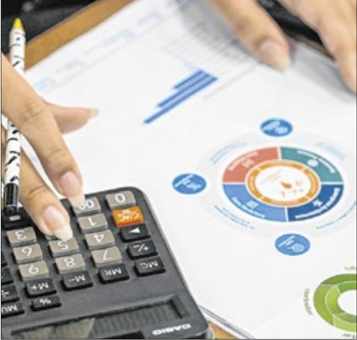
Aplicações em renda fixa crescem com juros altos