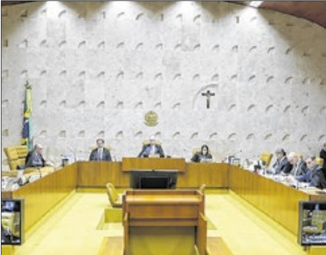
Decisão do STF sobre previdência beneficia servidores