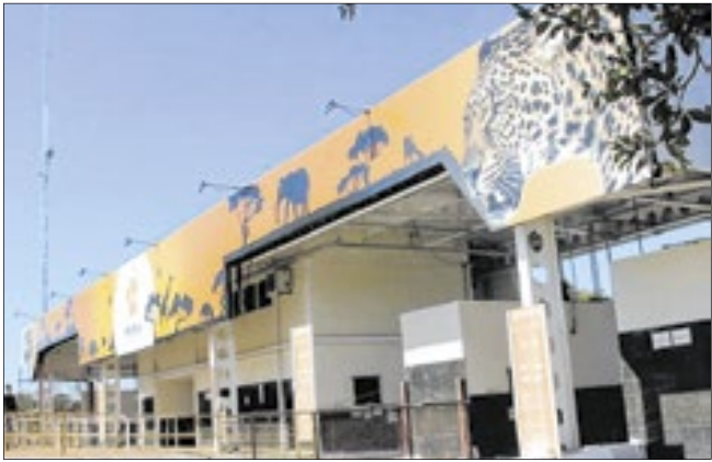
Com a nova parceria, zoológico terá acesso a uma rede de especialistas internacionais