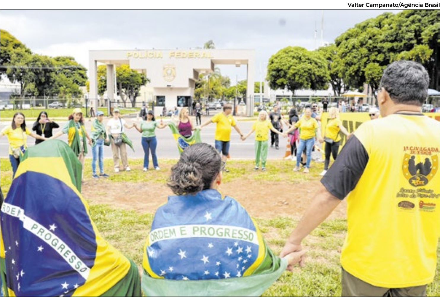
Manifestantes bolsonaristas em frente à Polícia Federal