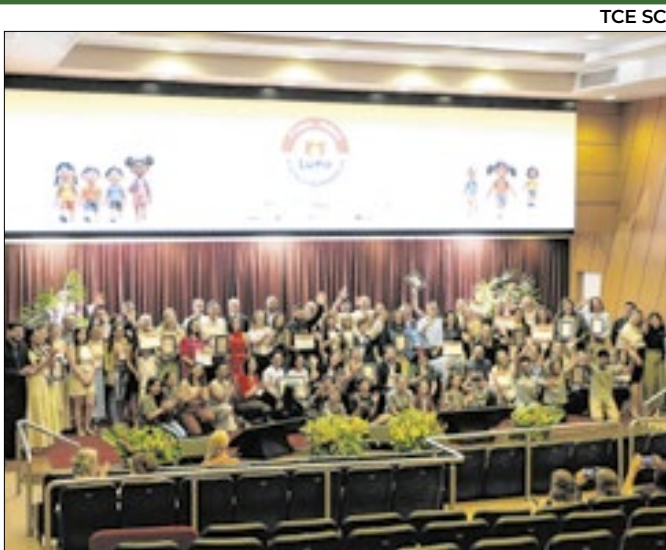
Ao todo, seis escolas foram homenageadas

Seis escolas estaduais de Santa Catarina foram premiadas por boas práticas na Educação nesta sexta-feira, 28, na 3ª edição do Prêmio Lume: Escola Referência.