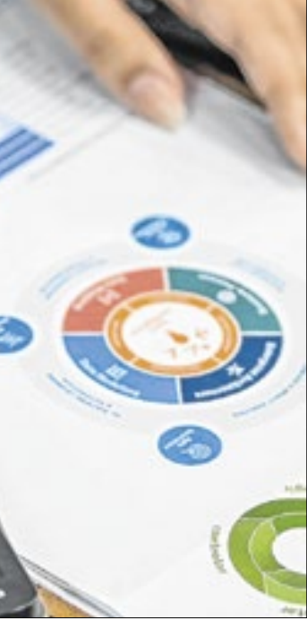
Agência de notícias da indústria

co. O mercado reagiu, e o cliente não vai pagar 5% ele migra para outro ativo.”