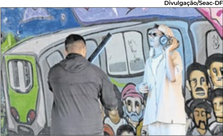
Evento busca promover dança e música urbana