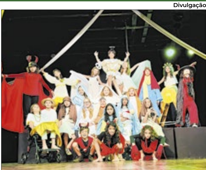
Evento terá teatro, circo, música e atividade formativa

Entre amanhã (2) e sexta (5), das 9h às 16h, o Venâncio Shopping, na Asa Sul, receberá a Feira da Mulher Empreendedora, do Projeto Banco de Talentos da Secretaria de Justiça e Cidadania do Distrito Federal. A iniciativa será no Piso 2 e reúne participantes que utilizam o trabalho próprio como fonte de renda. O público terá acesso a acessórios, decoração, roupas e itens para casa. A exposição funciona como vitrine para as produtoras, ampliando a visibilidade de seus negócios e fortalecendo a busca por independência econômica. A ação integra medidas de enfrentamento à violência contra mulheres com estímulo à renda.