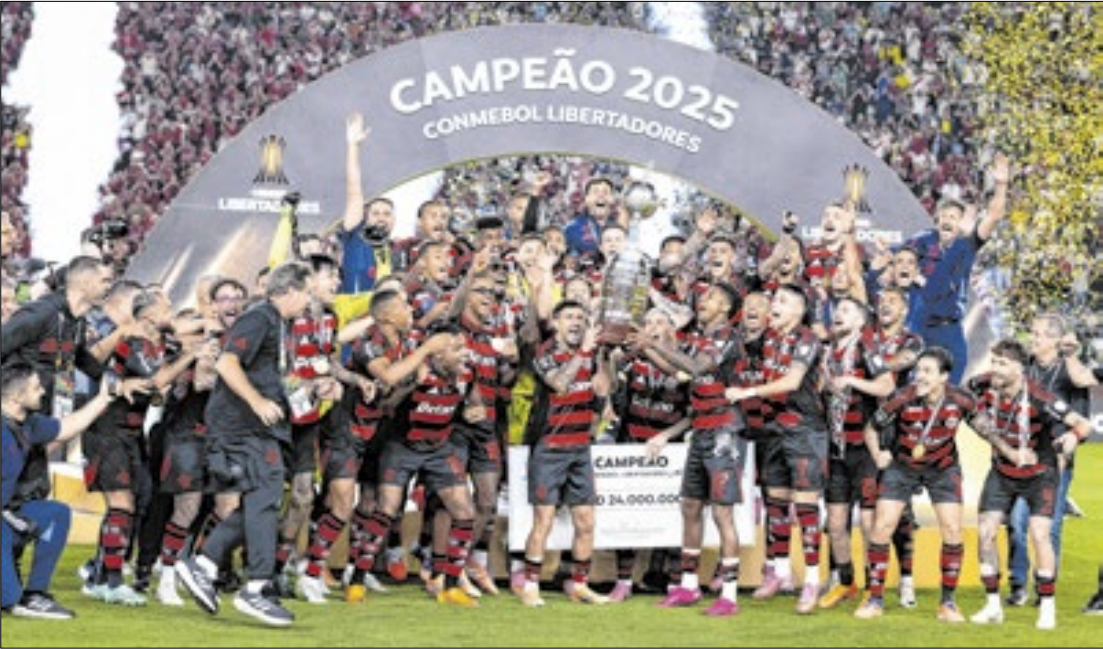
Flamengo se tornou o primeiro time brasileiro a ser tetracampeão da Libertadores

Com esse gol, Danilo entrou para um hall muito seleto de no-