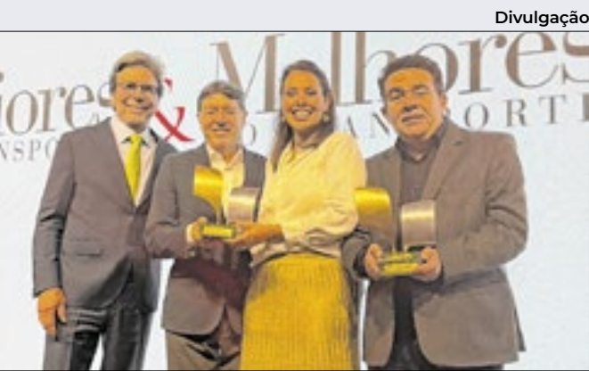
Premiação do setor de transportes ocorreu em SP

Consulta A consulta pode ser feita desde o último dia 21 na página da Receita Federal na internet. Basta o contribuinte clicar em “Meu Imposto de Renda” e, em seguida, no botão “Consultar a Restituição”. Também é possível fazer a consulta no aplicativo da Receita Federal.