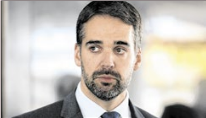
Eduardo Leite deve se eleger senador