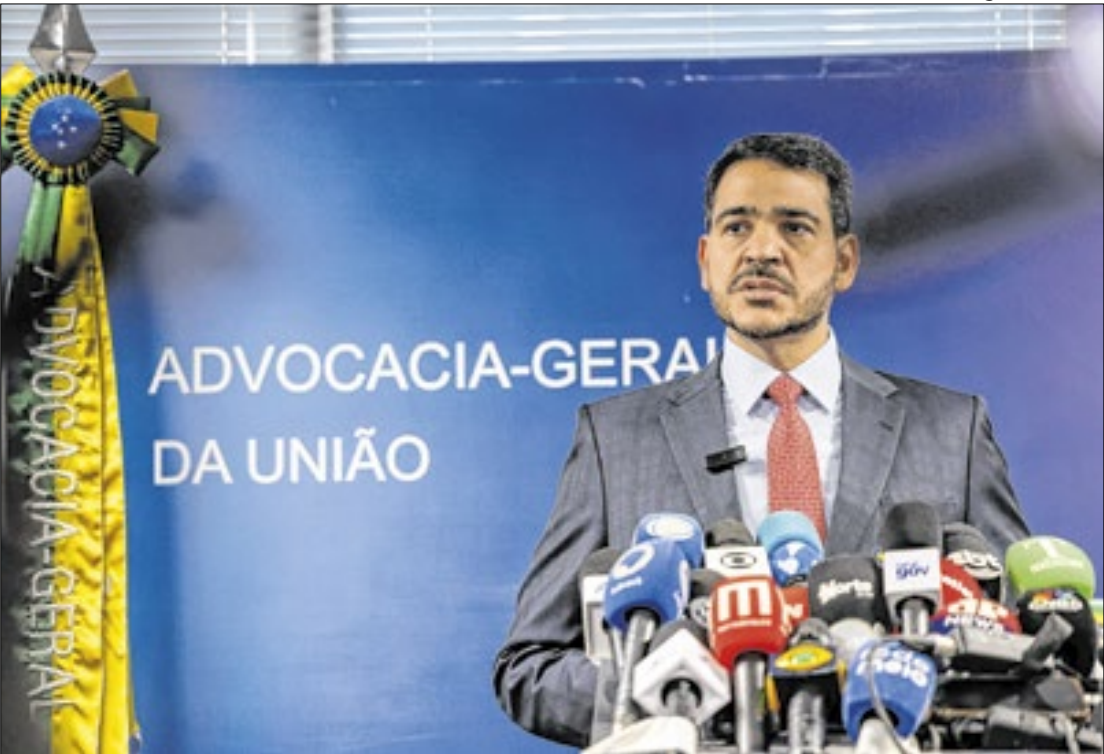
Indicação de Messias é um dos fatores da crise

Parlamentares ouvidos pela reportagem afirmam que choques são naturais, mas atribuem a escalada das crises à falta de diálogo e liderança dos chefes de cada poder, que deveriam tentar restabelecer o equilíbrio e os limites de sua atuação.