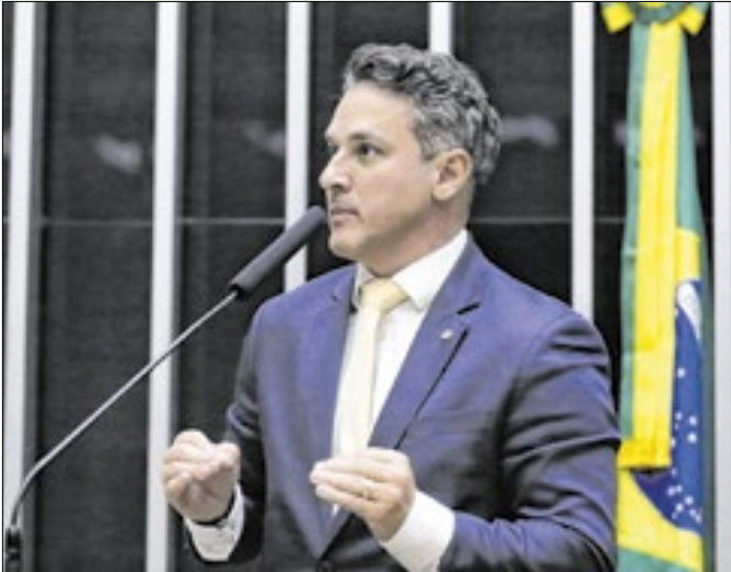
Zucco: em situação de empate no Rio Grande do Sul