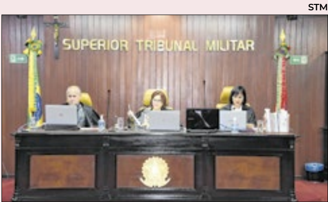
STM costuma levar em conta passado dos oficiais

Se perderem posto e patente, todos serão expulsos das Forças Armadas. Isto, ressalta o advogado, fará com que os quatro oficiais-generais condenados percam o direito de ficar presos em instalações militares. Terão, portanto, que ir para presídios.