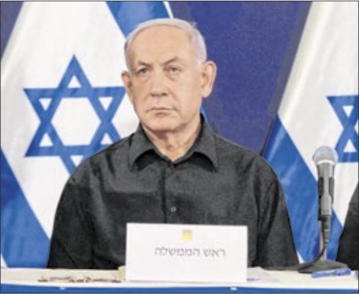
Netanyahu é investigado por suposto esquema de corrupção

Alvo da Justiça em um processo que investiga suposto esquema de corrupção, o primeiro-ministro de Israel, Binyamin Netanyahu, fez um pedido formal de perdão ao presidente Isaac Herzog, informou neste domingo (30) o gabinete da Presidência.