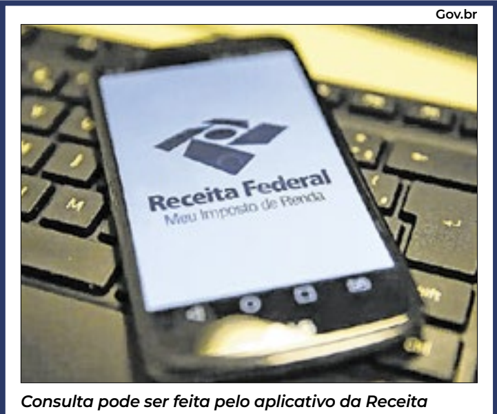
Consulta pode ser feita pelo aplicativo da Receita