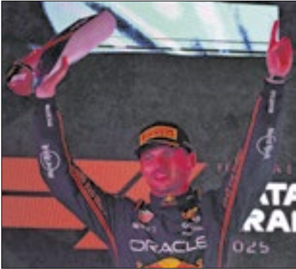
Max conquistou sua 70ª vitória

O GP do Qatar terminou com vitória de Max Verstappen, da Red Bull. Em segundo, Oscar Piastri, da McLaren. O pódio foi fechado com Carlos Sainz, da Williams. Já Lando Norris, líder do campeonato, terminou em quarto. Com isso, o Mundial de Fórmula 1 de 2025 será decidido no próximo domingo (7), no GP de Abu Dhabi. Para ser campeão, basta Lando Norris chegar ao menos em terceiro. Já Max Verstappen precisará vencer o Grand Prix e torcer para que Norris termine em quarto lugar, no máximo. O GP do Qatar foi decidido em um erro inexplicável de estratégia da McLaren.