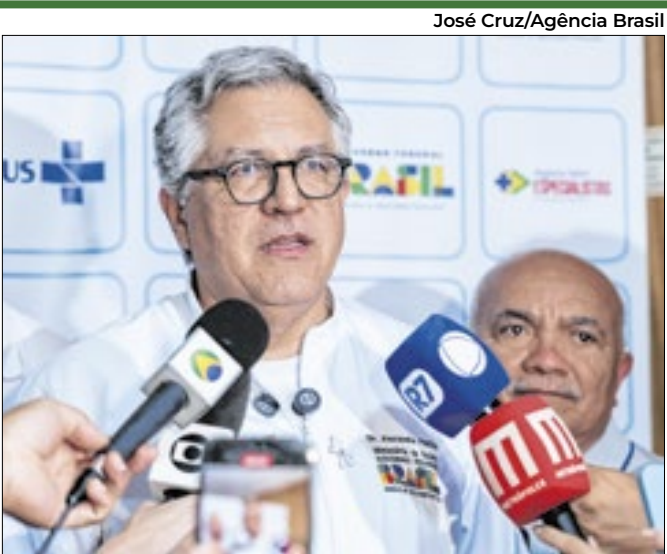
Equipamentos custaram R$ 116 mi do Novo PAC Saúde