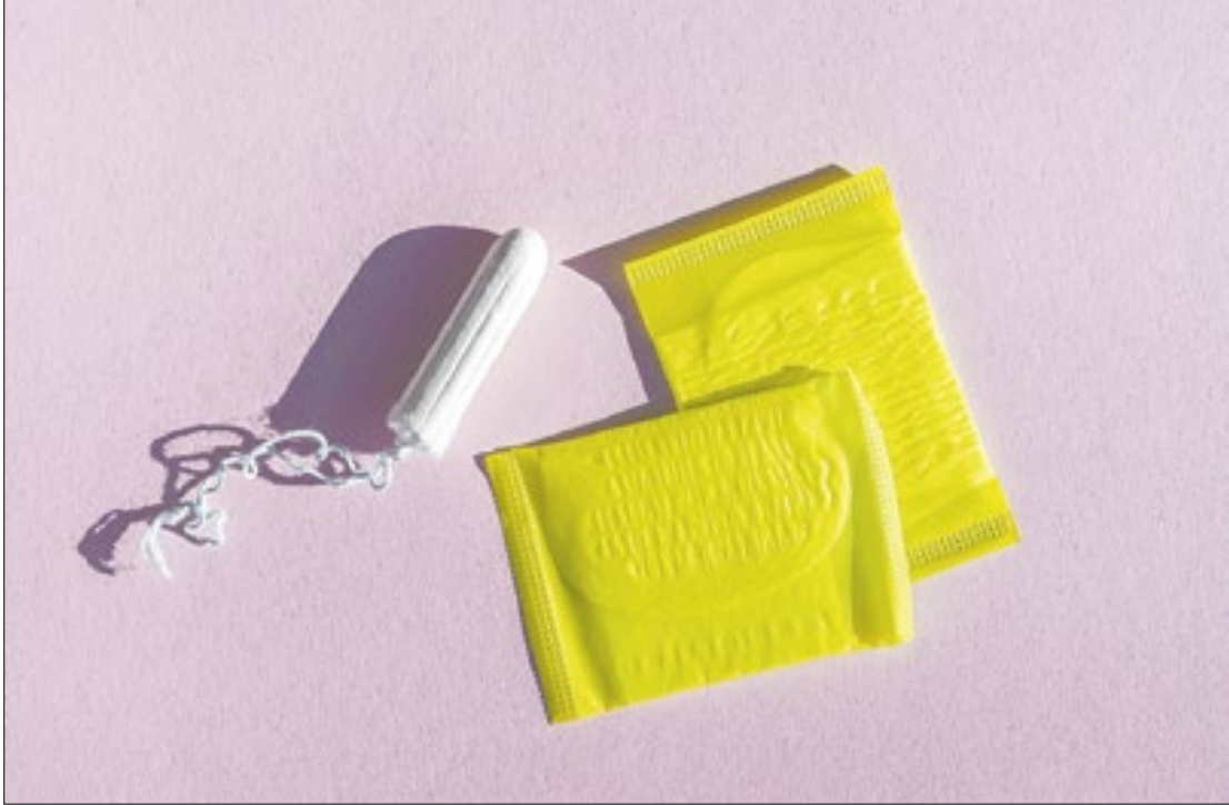
O levantamento inédito foi realizado pela Nexus – Pesquisa e Inteligência de Dados