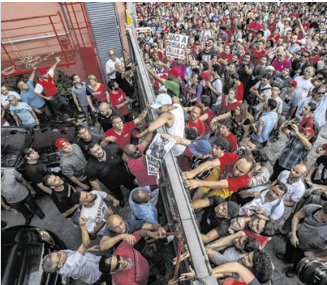
Prisão de Lula em 2018 virou ato midiático

A deputada diz ainda que o PL Mulher, presidido pela ex-primeira-dama Michelle Bolsonaro, pode ser um trunfo no processo de rearticulação. As viagens de Michelle estão mantidas até o fim do ano e, segundo a parlamentar, há o desejo de reforçar o trabalho do grupo com as famílias conservadoras.