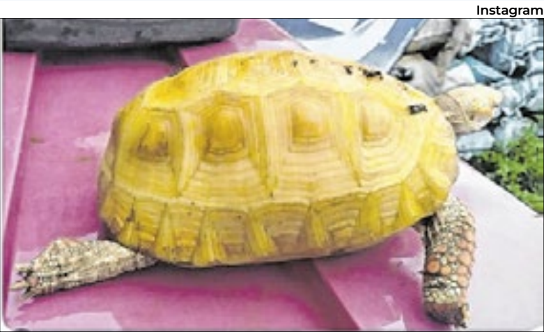
Um raro jabuti albino foi encontrado no Parque Cesamar, em Palmas (TO) e será estudado, por se tratar de um réptil com características atípicas

às melhores práticas globais de manejo, ampliando oportunidades de capacitação, inovação e integração em projetos científicos e educativos. Segundo o diretor-presidente Wallison Couto, a conquista representa “o reconhecimento internacional de que estamos alinhados aos princípios dos zoológicos modernos: cuidar bem dos animais, conservar espécies ameaçadas, educar e inspirar as pessoas e gerar conhecimento científico”. A nova etapa inclui avançar nos processos de acreditação nacional e internacional, além de expandir parcerias com universidades, centros de pesquisa e outros zoológicos. O objetivo é fortalecer o papel do Zoo de Brasília como referência na conservação da fauna brasileira e mundial.