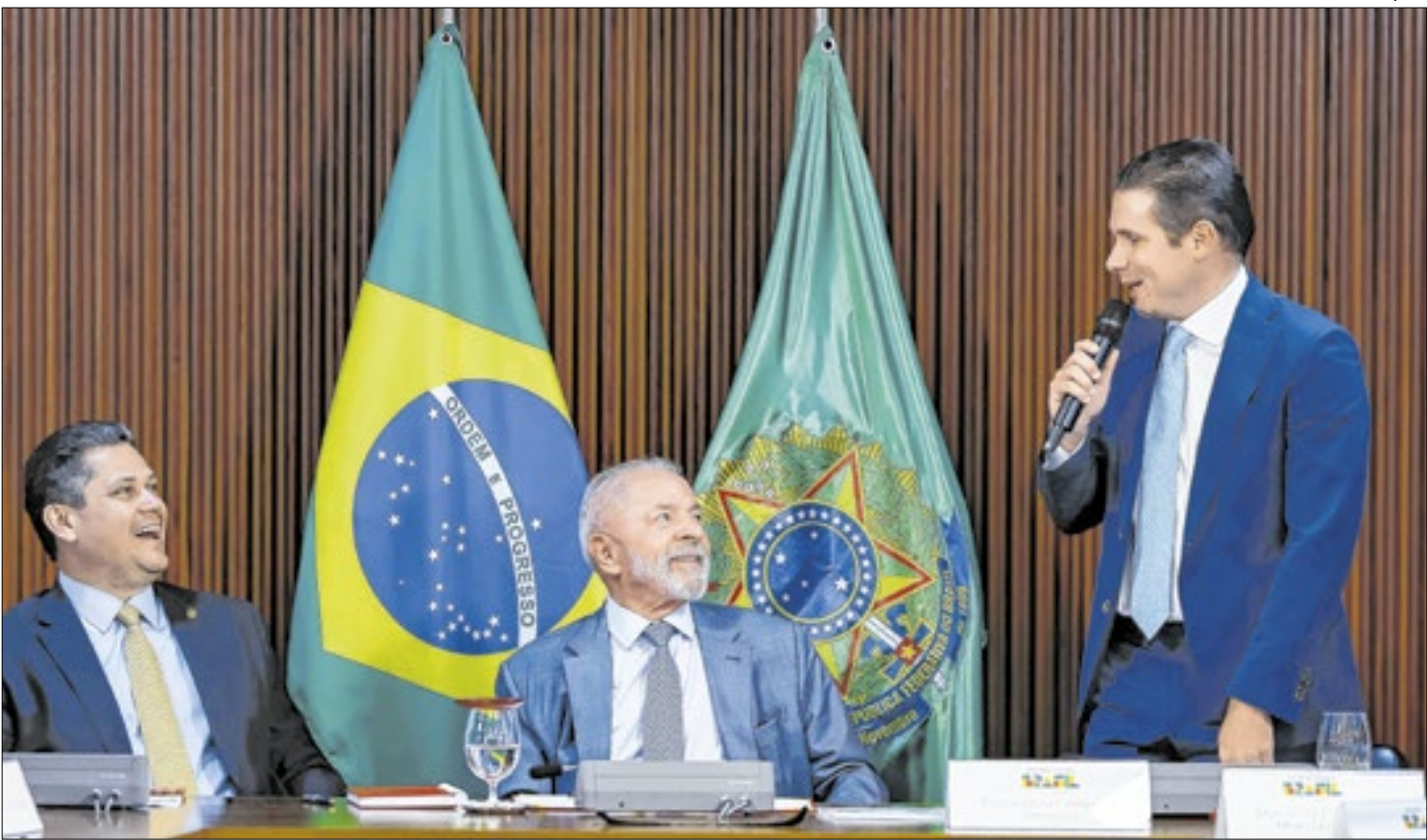
Relações entre Alcolumbre, Lula e Motta já foram melhoras

Mas muito possivelmente com o MDB, com nomes como Renan Calheiros, em Alagoas, por exemplo. Quando ao PSD, o partido liderado por Gilberto Kassab é uma incógnita. Hoje, traça hoje planos oposicionistas. Mas fica fora de um eventual novo governo Lula?