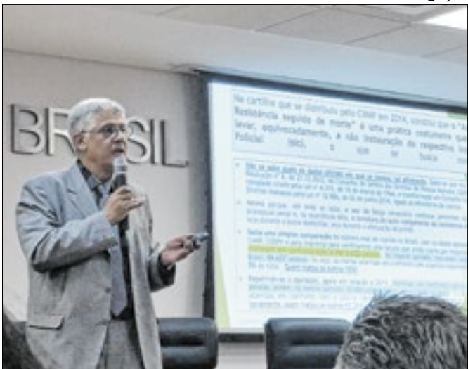
Assis: STM não é a última instância no caso