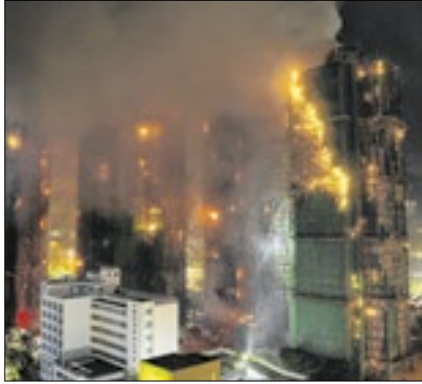
Números subiram para 146 mortos

O número de mortes no incêndio que destruiu prédios residenciais no distrito de Tai Po, em Hong Kong, subiu para 146, informou neste domingo (30) um representante da polícia.