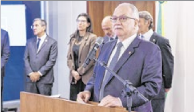
Presidente da Suprema Corte, Edson Fachin