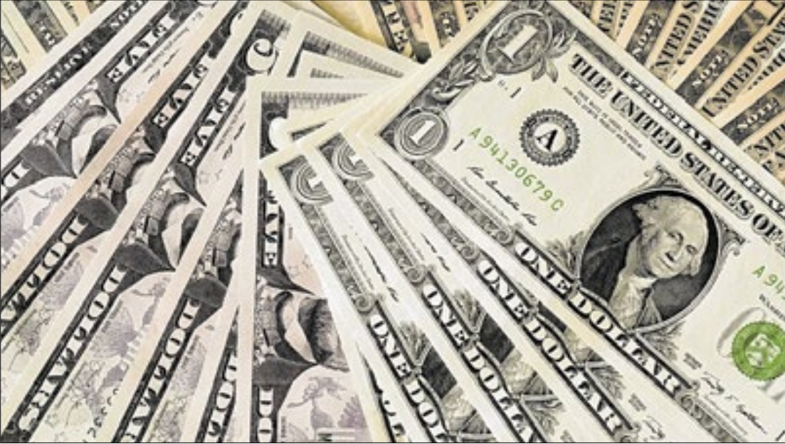
Variação da cotação do dólar norte-americano tem reflexo na economia brasileira

Em relação a outras dez nações, o Brasil dispara. Para comparar os gastos do Brasil com outros países, a pesquisa usou o dólar e considerou a paridade de poder de compra - um método que mede a capacidade do dinheiro de comprar a mesma quantidade de bens em cada país. A partir desses parâmetros, o gasto no Brasil com pagamentos acima do teto ficou em US$ 8 bilhões em um ano. Longe do segundo colocado: a Argentina gasta US$ 381 milhões com o extrateto. Em seguida: Estados Unidos, México, Reino Unido, Chile, França, Itália, Colômbia, Portugal e na Alemanha o estudo apontou que não há essa despesa.