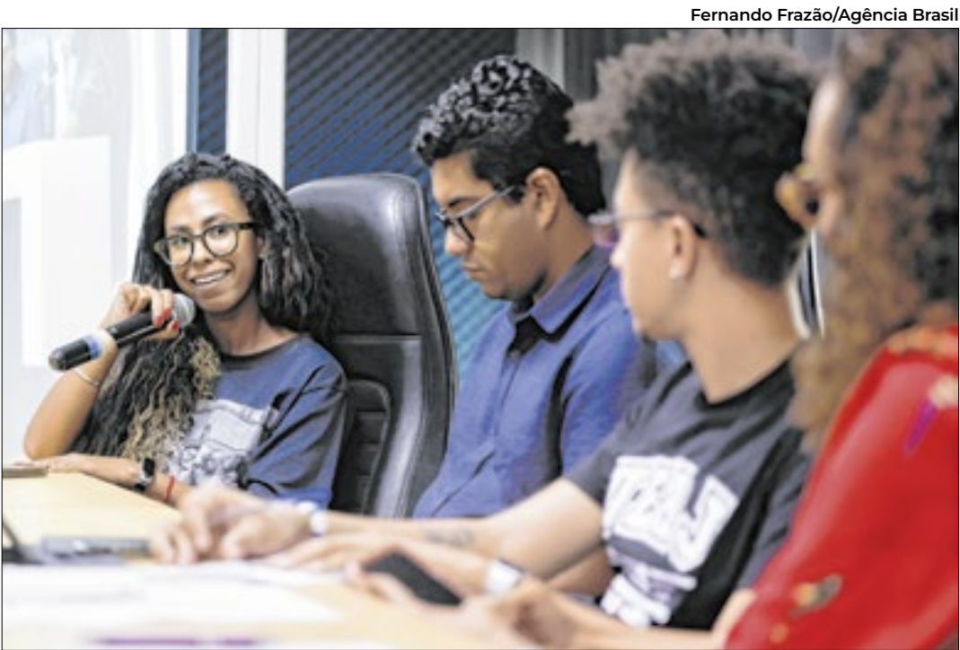
Segundo pesquisa, exclusão racial persiste em carreiras mais bem pagas

do Ministério da Saúde que distribui absorventes gratuitos a mulheres em situação de vulnerabilidade social. Ou ainda o projeto de lei em tramitação no Congresso Nacional que prevê uma licença menstrual do trabalho para mulheres que, comprovadamente, sofram com sintomas grave do ciclo. “A gente sabe que as pessoas falam desse assunto e quando estamos tratando-o sob um aspecto social, ele vai transitar por narrativas que falam sobre dignidade, trabalho, educação, saúde da mulher. Todos esses aspectos, na minha opinião e