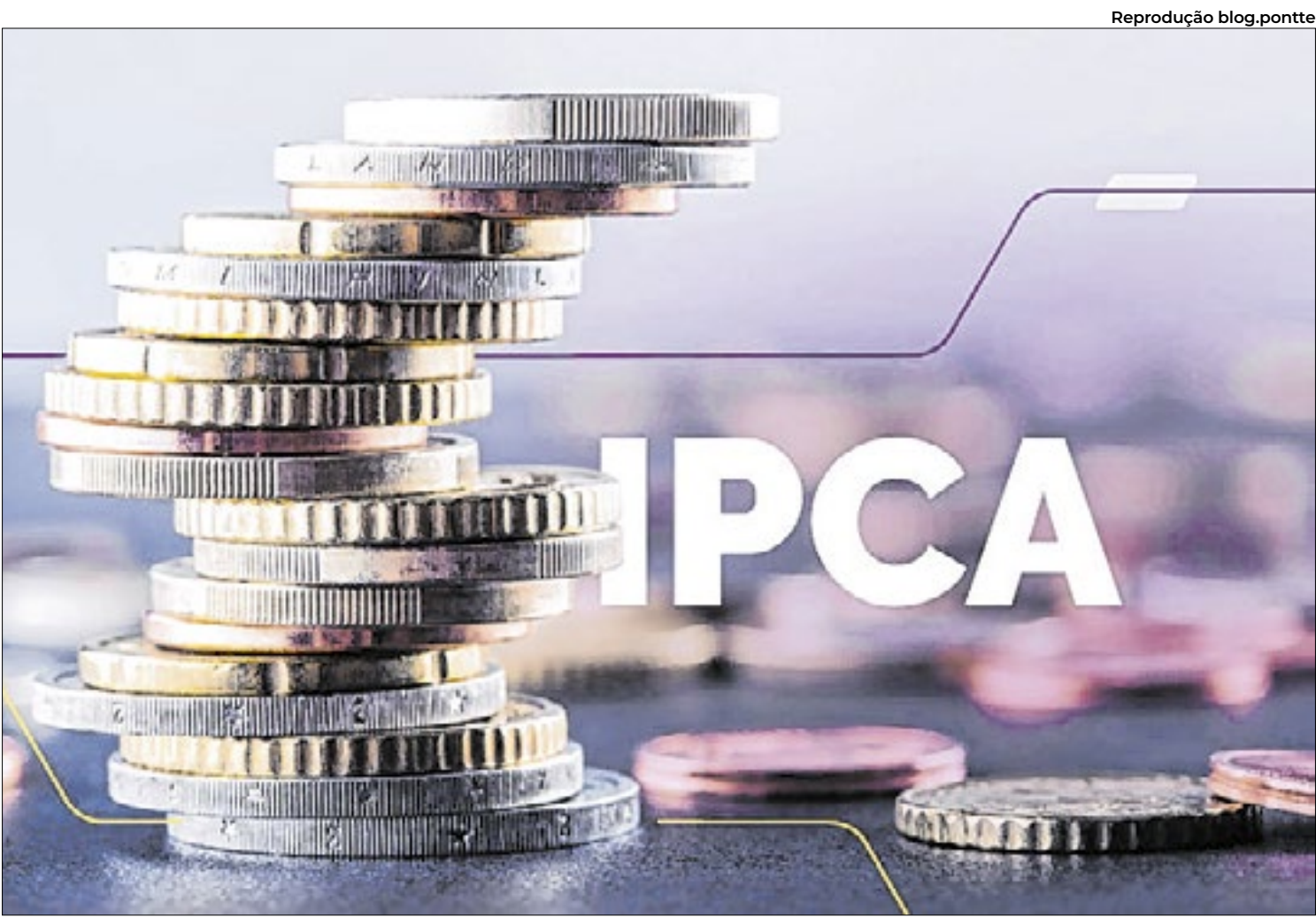
Estudo do IBGE não mencionou o impacto do aperto monetário para o declínio do IPCA

Os aportes em VGBL devem cair 19,4% neste ano, passando de R$ 178,26 bilhões em 2024 para R$ 143,68 bilhões em 2025, de acordo com a Fenaprevi (Federação Nacional de Previdência