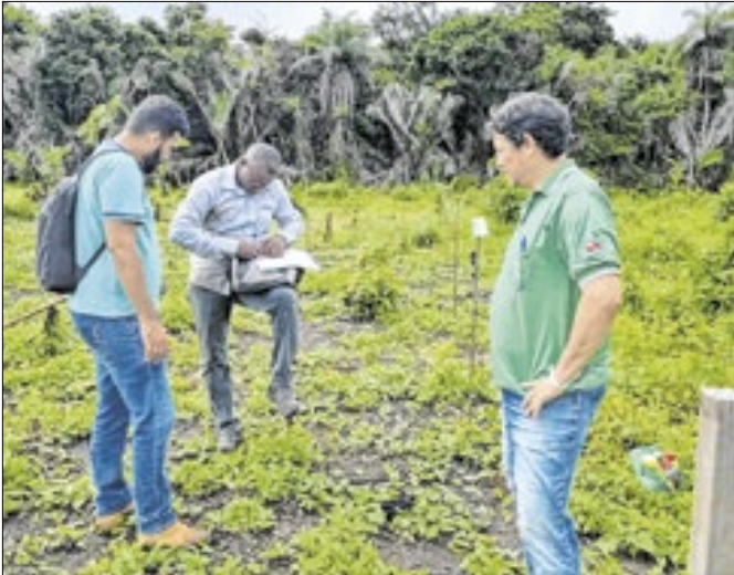
900 famílias em 13 comunidades são acompanhadas