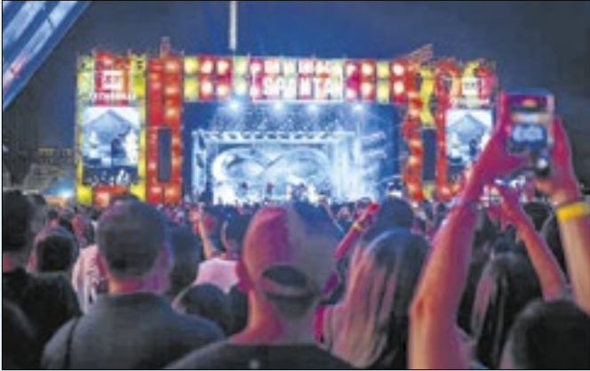
Edição de 2026 valoriza a Música Preta Brasileira