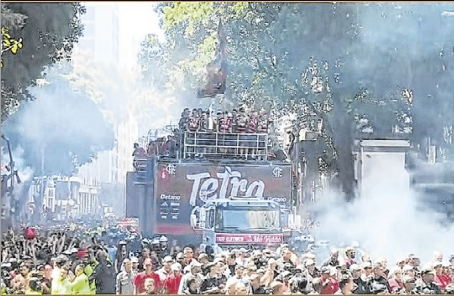
Milhares de torcedores foram ao Centro celebrar o título

nício registrou melhora nos indicadores: queda gradativa nos casos novos, redução do diagnóstico tardio e uma expansão expressiva da oferta de Profilaxia Pré-Exposição, que hoje alcança dezenas de milhares de usuários ativos. As áreas com maior adesão à prevenção combinada também são as que apresentam os melhores resultados no diagnóstico oportuno.