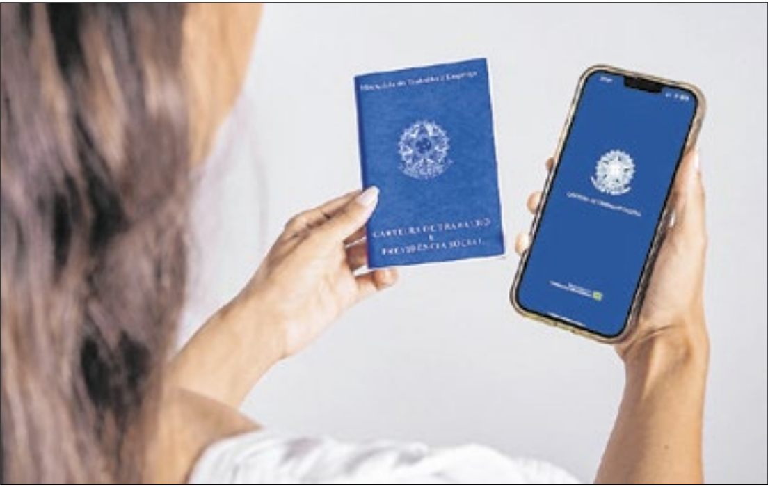
Trabalhadores enfrentam restrições de crédito e utilizam os saques principalmente para reduzir endividamento.

A tese reforça a importância de reformas institucionais bem desenhadas para promover um ambiente financeiro mais equilibrado e inclusivo. A pesquisa também foi destaque no Valor Econômico.