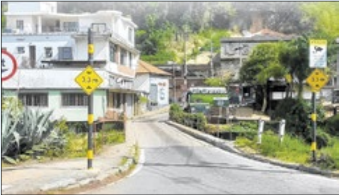
Obras começarão a partir do mês de março de 2026