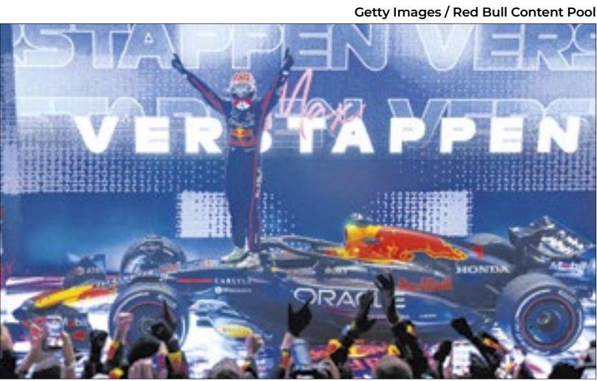
Max Verstappen conquistou sua 70ª vitória na Fórmula 1, no GP do Qatar

Em prova marcada pelo erro grosseiro de estratégia da McLaren, Max Verstappen, da Red Bull, aproveitou a chance e venceu o Grand Prix do Qatar, com Oscar Piastri chegando