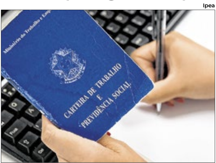
Ipea Em 12 meses, o balanço é positivo em 1,35 milhão de postos

de 14,9%, atingida em dois períodos: nos trimestres móveis encerrados em setembro de 2020 e em março de 2021, ambos durante a pandemia de covid-19. - O número de desocupados atingiu 5,910 milhões, menor