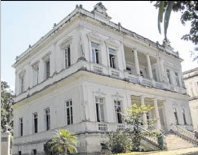
Dívidas podem ser parceladas em até 48 vezes