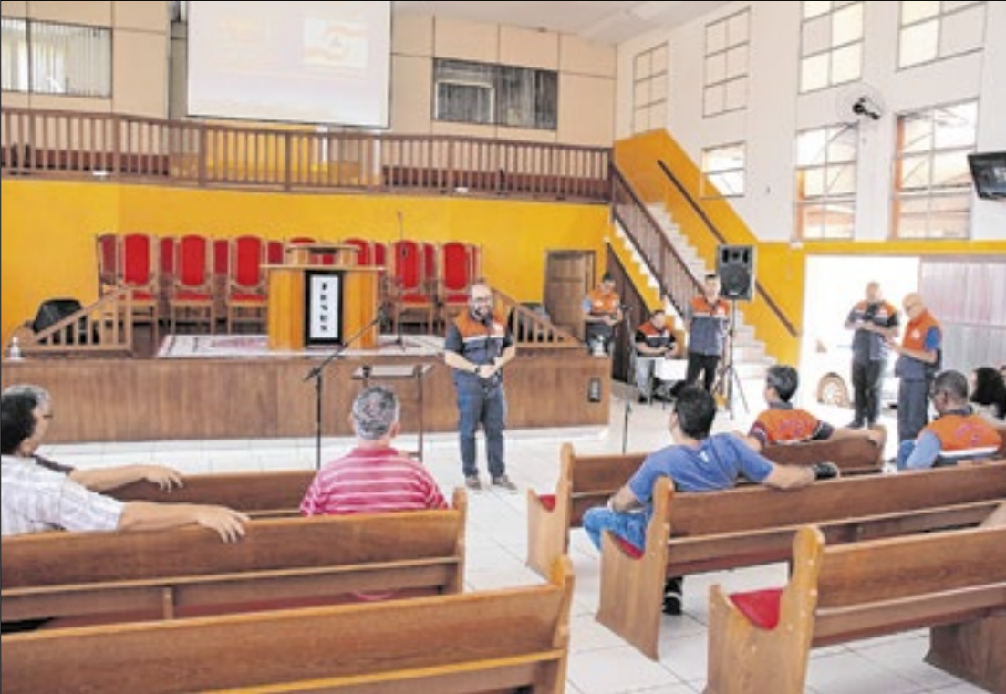
Encontro ocorreu na Assembleia de Deus do Chalet em Barra do Piraí

Ação faz parte das medidas preventivas para período de chuvas