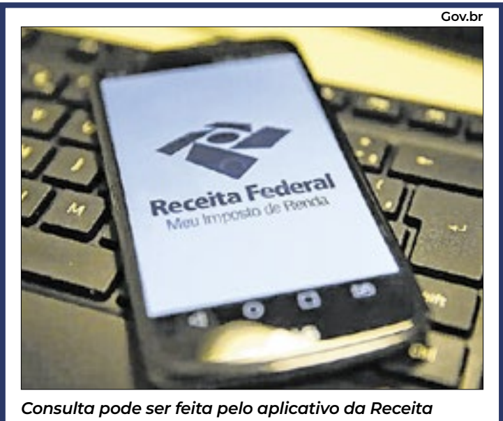
Gov.br Consulta pode ser feita pelo aplicativo da Receita