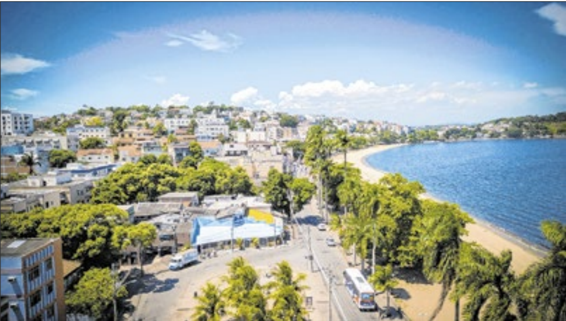
Casas na Praia da Bica, na Ilha do Governador, Zona Norte do Rio de Janeiro