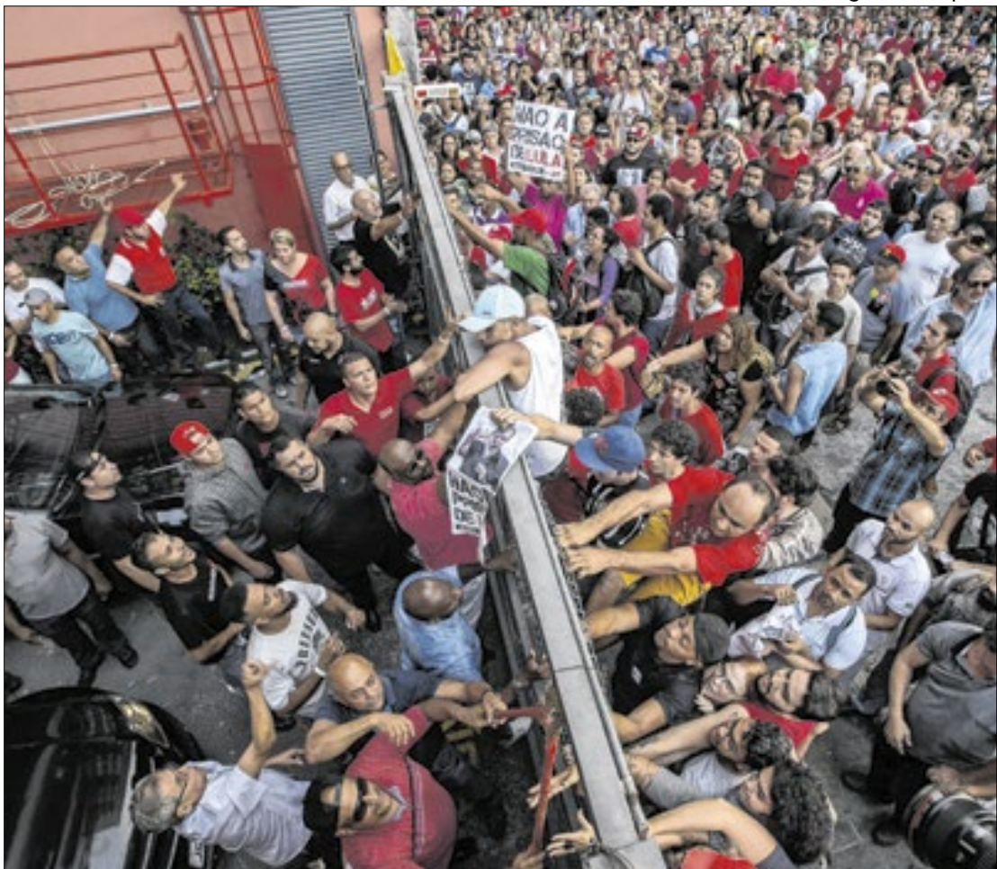
Prisão de Lula em 2018 virou ato midiático

A deputada diz ainda que o PL Mulher, presidido pela ex-primeira-dama Michelle Bolsonaro, pode ser um trunfo no processo de rearticulação. As viagens de Michelle estão mantidas até o fim do ano e, segundo a parlamentar, há o desejo de reforçar o trabalho do grupo com as famílias conservadoras.