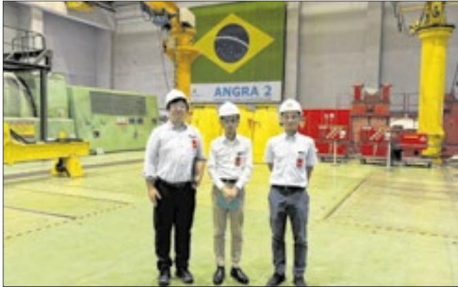
Representantes do Japan Atomic Industrial Forum