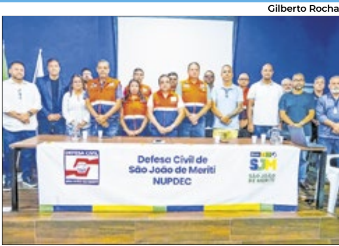
Reunião reforça a importância das ações integradas

A Secretaria de Resiliência Urbana, Proteção e Defesa Civil de São João de Meriti realizou a primeira reunião do Grupo de Ações Coordenadas, etapa inicial para o alinhamento do Plano de Contingência Municipal para riscos de desastres relacionados às fortes chuvas. Durante a reunião, foram discutidos cenários de risco, rotinas operacionais, pontos de apoio à população, rotas de deslocamento em situações críticas e atribuições específicas de cada secretaria.