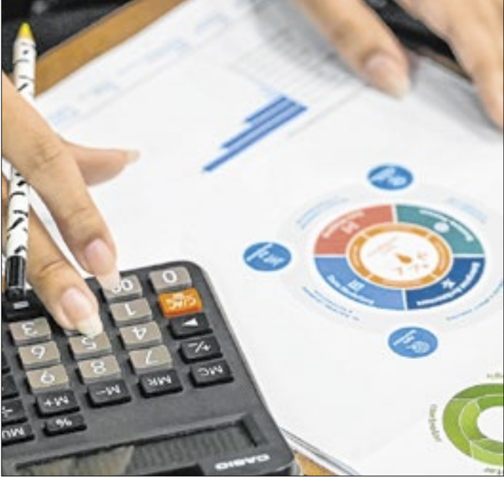
Aplicações em renda fixa crescem com juros altos