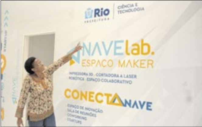
As naves oferecem cursos variados e para todas as idades