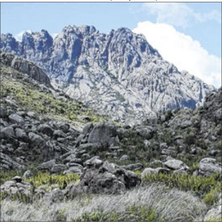
Incidente aconteceu no Pico das Agulhas Negras

Conforme informado pelas equipes do Parque, a apuração do caso constatou que o grupo de turistas desconsiderou as orientações oferecidas no Posto Marcão (Portaria da Parte Alta do Parque). Na ocasião, eles teriam sido informados sobre a necessidade de agendamento prévio para acessar o Pico das Agulhas Negras, além da recomendação do uso de equipamentos