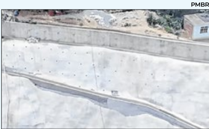
Obras acontecem na Estrada de Xerém, no Xavantes

prevenção, monitoramento e resposta a emergências. A iniciativa segue modelos adotados em outros municípios fluminenses, que reforçam a importância da atuação intersectorial no enfrentamento ao período de maior incidência de chuvas. Durante a reunião, foram discutidos cenários de risco, rotinas operacionais, pontos de apoio à população, rotas de deslocamento em situações críticas e atribuições específicas de cada secretaria.