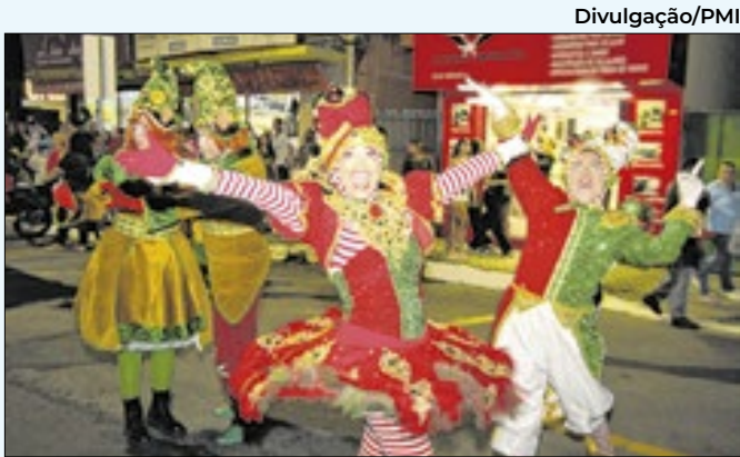
Abertura lotou o Centro e a Praça Mariana Rocha Leão

rem os agentes do IBGE e ressalta que os dados coletados são protegidos por sigilo, conforme a legislação vigente, sendo utilizados exclusivamente para fins estatísticos.