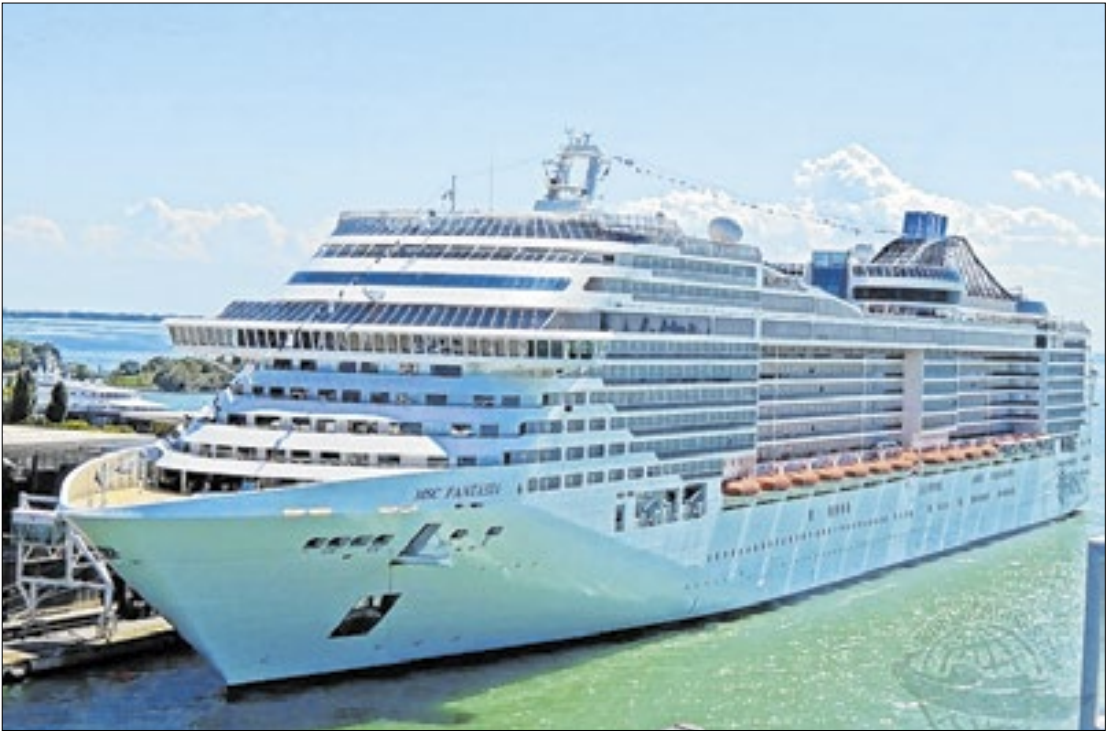
MSC Fantasia, de bandeira panamenha, tem capacidade para 4.363 turistas

O Louvor de Fim de Ano é aberto ao público e convida toda a comunidade a celebrar um momento de gratidão, unidade e renovação.