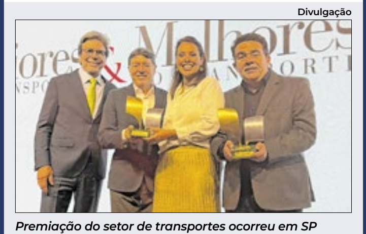
Premiação do setor de transportes ocorreu em SP