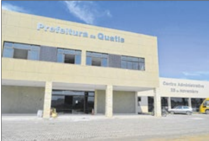
Sede da prefeitura de Quatis

A prefeitura de Quatis informa que o IBGE estará realizando atividades de coleta no bairro Bondarowsky, como parte do processo regular de atualização e acompanhamento estatístico conduzido no país. As ações serão realizadas em duas etapas: O Cadastro Na-