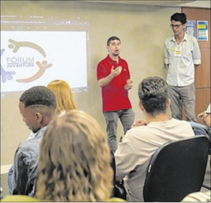
Fórum reúne jovens em Volta Redonda

A Secretaria Municipal da Juventude (Sejuv) e o Conselho Municipal da Juventude (CMJ) de Volta Redonda realizaram, na sexta-feira, dia 28, o Fórum da Juventude com o tema “Políticas de Juventude pela Justiça Climática”. O evento lotou o campus da Estácio, no bairro Aterrado, reunindo jovens de 15 a 29 anos interessados em debater soluções para os desafios climáticos e fortalecer a participação juvenil na construção de políticas públicas. Durante o encontro, foram eleitos os novos membros do CMJ para o biênio 2026/2027.