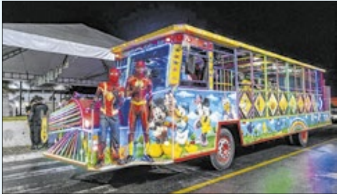
Vereador quer medidas de segurança para passeios