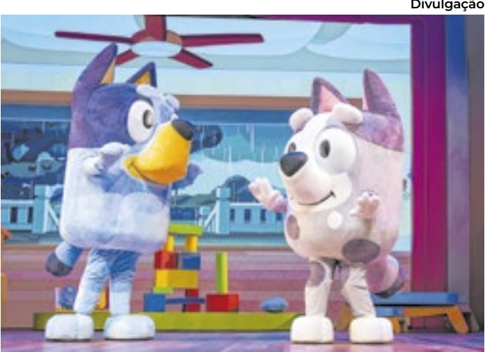
Bluey Ao Vivo - Diversão em Família!