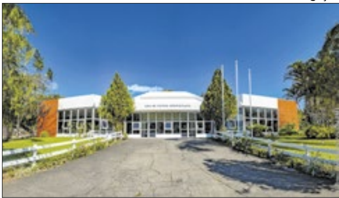
Divulgação O objetivo do projeto é promover a troca de experiências

Nesta sexta-feira (28) a Casa de Cultura Adolpho Bloch será palco do Intercâmbio Cultural da Febacla (Federação Brasileira dos Acadêmicos das Ciências, Letras e Artes), evento que traz a Teresópolis uma comitiva de artistas de Cuiabá/Mato Grosso. O objetivo do