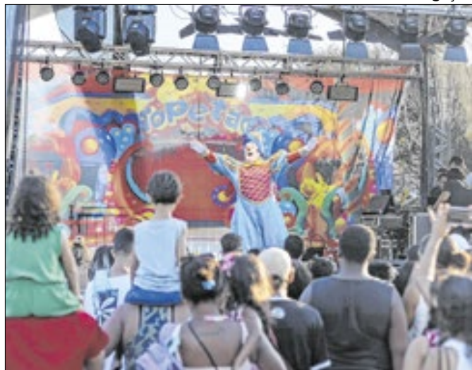
Evento terá apresentação do palhaço Topetão

Circula em conjunto com: CORREIO PETROPOLITANO