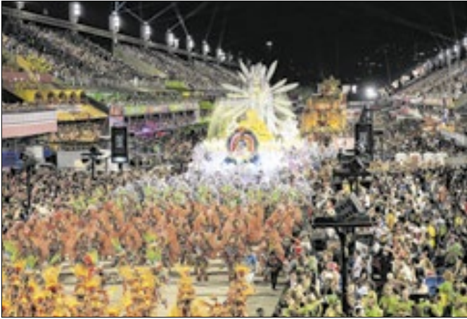
Desfiles marcam o Carnaval do Rio anualmente