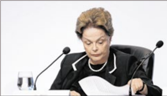
Dilma venceu Aécio nas eleições de 2014