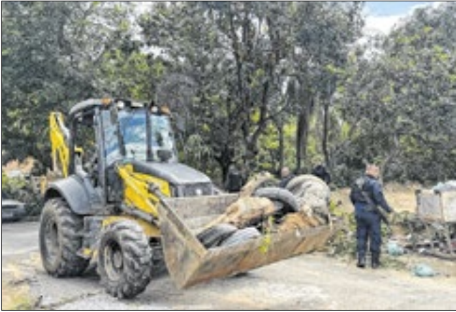
Forças de segurança removeram bloqueios em Japeri

A manhã de quinta (27) do bairro São Jorge, em Japeri, teve o som dos motores e das máquinas pesadas da Operação Barricada Zero, que entrou na região com determinação para garantir algo básico: o direito de ir e vir da população. A força-tarefa, realizada pelo Governo do Estado em parceria com a Prefeitura, mobilizou 40 agentes, duas retroescavadeiras e seis caminhões cedidos pela Secretaria de