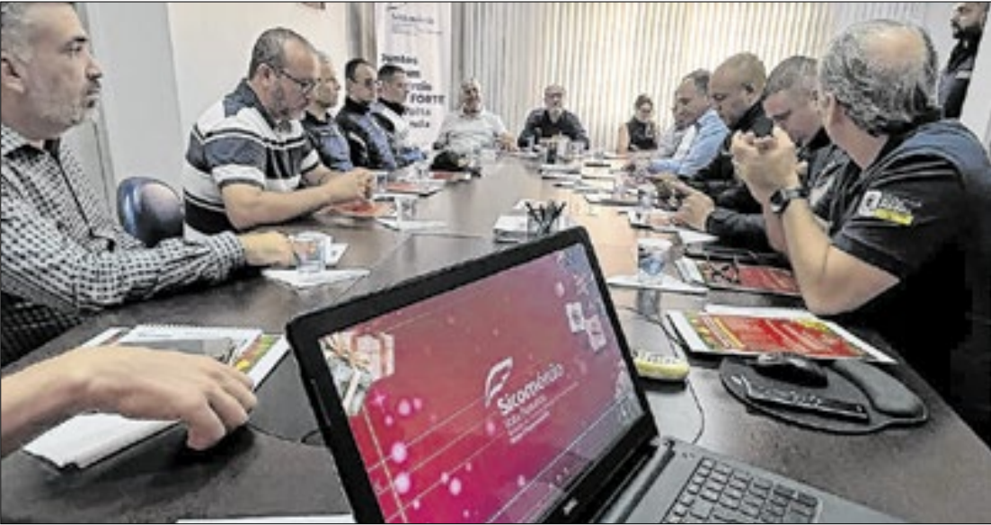
Novo horário vigora a partir de 1º de dezembro