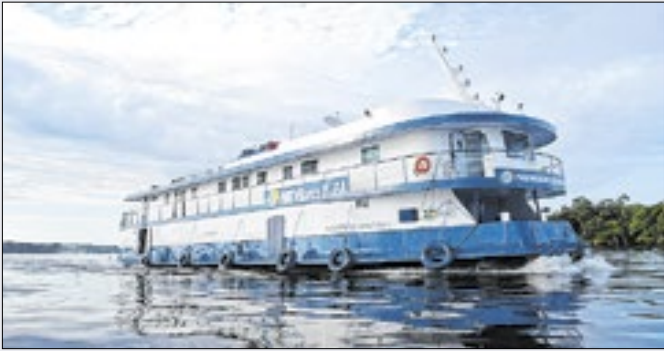
PREVBarco leva atendimento à população ribeirinha