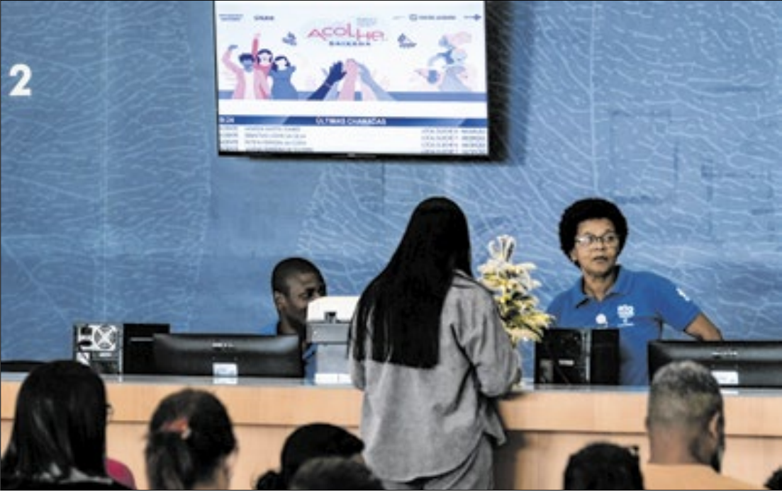
Acolhe Baixada tem capacidade para 400 inserções de Implanons por mês, quase 20 por dia

RJ foi pioneiro na oferta pública de métodos contraceptivos de longa duração no estado. Em pouco mais de dois anos, já foram realizadas 30 mil inserções de dispositivos como DIUs Mirena, Kyleena e Implanon.