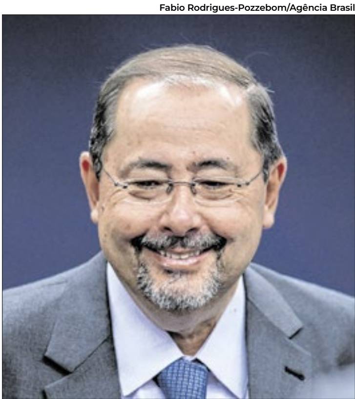
Fabio Rodrigues-Pozzebom/Agência Brasil

Caio Spechoto e Carolina Linhares (Folhapress)