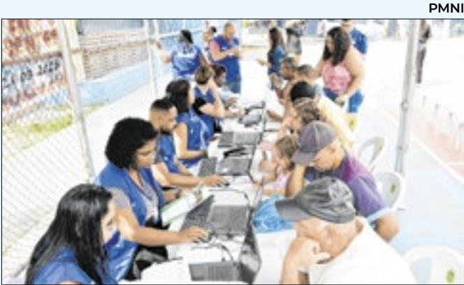
Refis nos Bairros é realizado em Comendador Soares

trabalho conjunto. “Contamos com 40 homens neste efetivo e agradecemos o apoio da Prefeitura de Japeri. Estamos garantindo o direito de ir e vir do cidadão, para que a população volte a trafegar com tranquilidade. Podem sempre contar com a Polícia Militar”, afirmou.