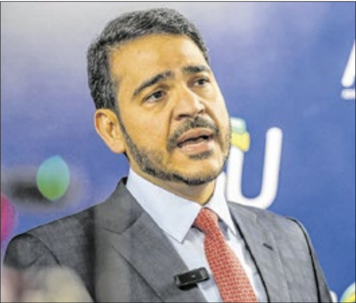
Indicação de Messias para STF no centro da crise