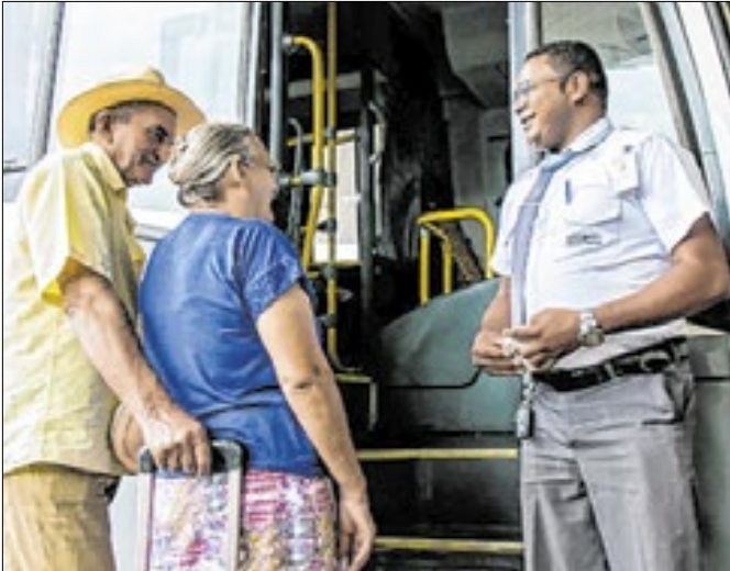
Novos aposentados recebem o 13º e o pagamento