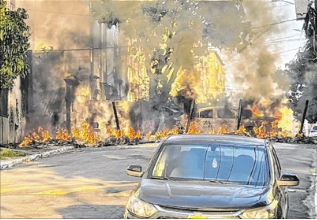
Operação Barricada Zero na Cidade Alta, Complexo de Israel

Logo nas primeiras horas da manhã, criminosos tentaram impedir a entrada da Polícia Militar na Cidade Alta, incendiando pneus e barricadas. Em Campinho, bandidos chegaram a atirar contra os policiais. Devido à troca de tiros e à fumaça que tomou as vias, a PM fechou a Avenida Brasil nos dois sentidos por cerca de 40 minutos, entre 4h20 e 5h30,