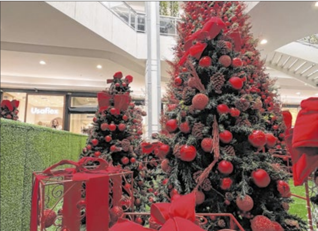
Árvore de Natal do Recreio Shopping, na zona Sudoeste do Rio de Janeiro

“O planejamento finan- ceiro ainda é algo muito precário entre os brasileiros. Durante esse período de megapromo- ção, as compras por impulso se tornam muito mais frequentes, e esse movimento não só difi-