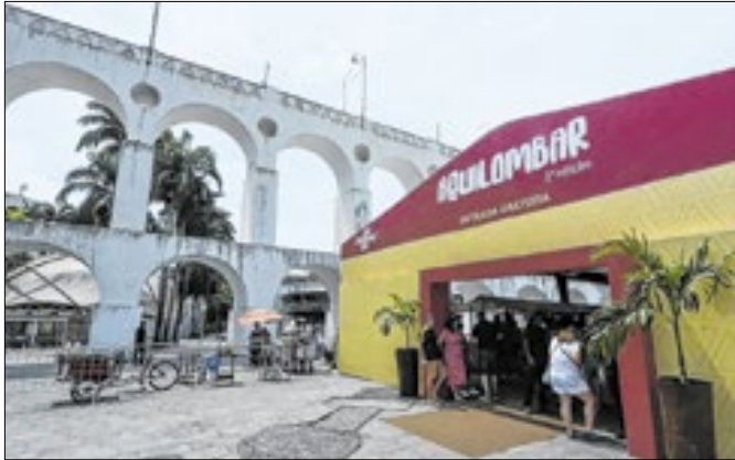
Arcos da Lapa encerram o mês da Consciência Negra

Os Arcos da Lapa encerram o mês da Consciência Negra com uma atração especial que reúne cultura e gastronomia quilombola no sábado e domingo (29 e 30 de novembro). O evento Aquilombar, uma parceria do Sebrae com a Associação Esta-