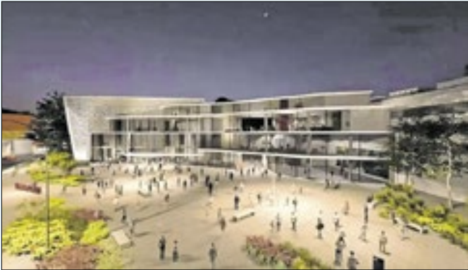
Novo Canecão tem previsão de inauguração para 2026