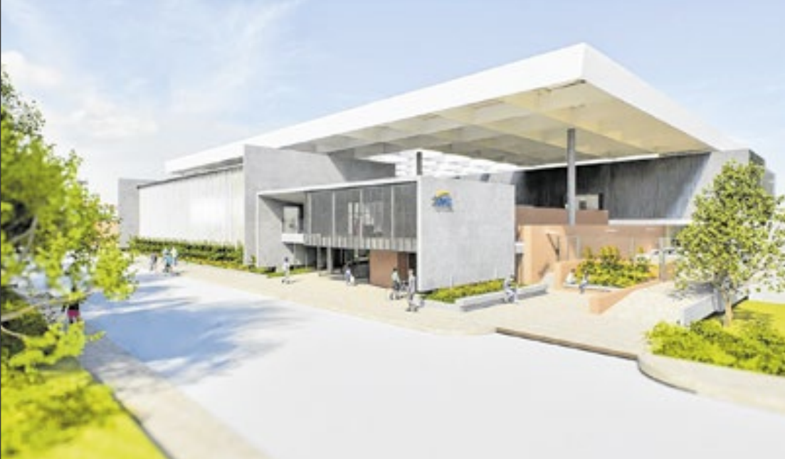
Novo complexo de 6,4 mil metros quadrados tem entrega prevista para 2027