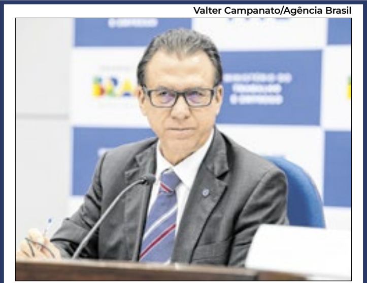
Ministro do Trabalho e Emprego, Luiz Marinho

O Brasil fechou o mês de outubro com saldo positivo de 85.147 empregos com carteira assinada. O balanço é do Novo Cadas- tro Geral de Empregados e Desempregados (Novo Caged) divulgado pelo Ministério do Trabalho e Emprego (MTE). O resul- tado de outubro decorreu de 2.271.460 admissões e de 2.186.313 desligamen- tos no período. Com o resultado, o estoque de