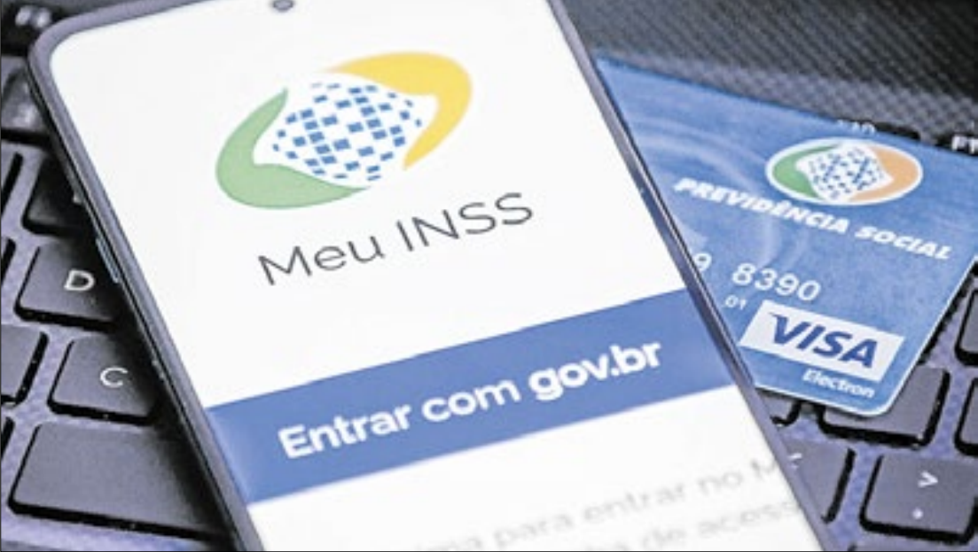
Em caso de dúvida use os canais oficiais do INSS: aplicativo, site ou central 135