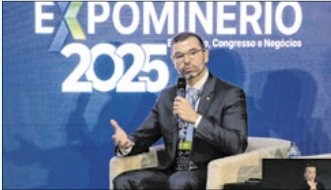
Tomás Filho na abertura da Expominério 2025

A relevância do urânio para uma matriz energética limpa foi destacada pelo presidente e diretor de Recursos Minerais da Indústrias Nucleares do Brasil – INB, Tomás Filho, nesta quarta-feira (26), durante a participação no painel “Minerais críticos, estratégicos e geopolítica: Brasil na transição energética”, na Expomi-