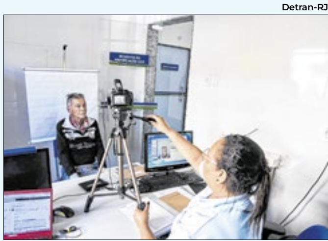
Mutirão será para idosos e pessoas com deficiência

Atualmente, o Rio de Janeiro tem uma dívida de R$ 225 bilhões, sendo R$ 193 bilhões devidos à União, R$ 28 bilhões em contratos garantidos pela União e R$ 4 bilhões referentes a parcelamentos. O prazo para adesão dos estados ao Propag termina em 31 de dezembro.