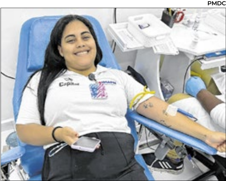
Hospital Moacyr Rodrigues do Carmo recebe as doações

Em primeiro lugar, é preciso procurar a Clínica da Família ou Unidade Básica de Saúde mais próxima de casa. E então, manifestar a intenção de inserir um método contraceptivo de longa ação. A unidade de saúde faz a inserção da paciente no Sistema Estadual de Regulação (SER), ela pode ser agendada para o Acolhe Baixada ou Acolhe RJ.