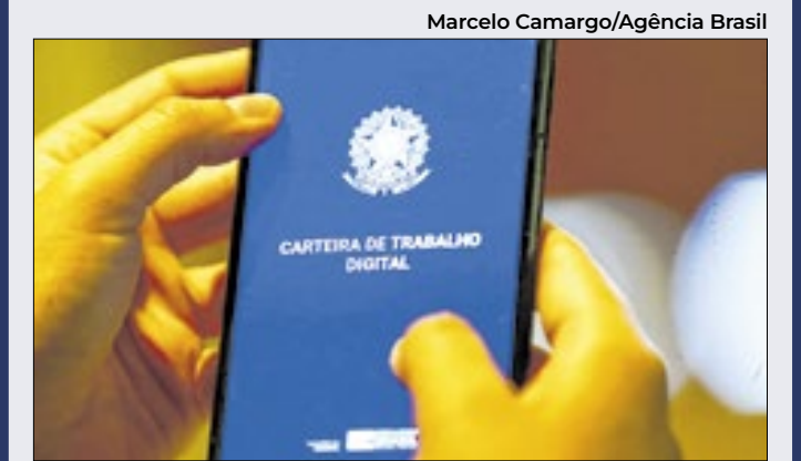
Mais mulheres e jovens foram contratados no mês

Do total de postos gerados no mês, 67,7% foram con- siderados típicos e 32,3% não típicos, com destaque para trabalhadores com jornada de trabalho in- termitente que somaram 15.056 e trabalhadores com jornada de 30 horas ou menos, que ficaram com 10.693 vagas. O salário mé- dio real de admissão foi de R$ 2.304,31, alta de R$17,28