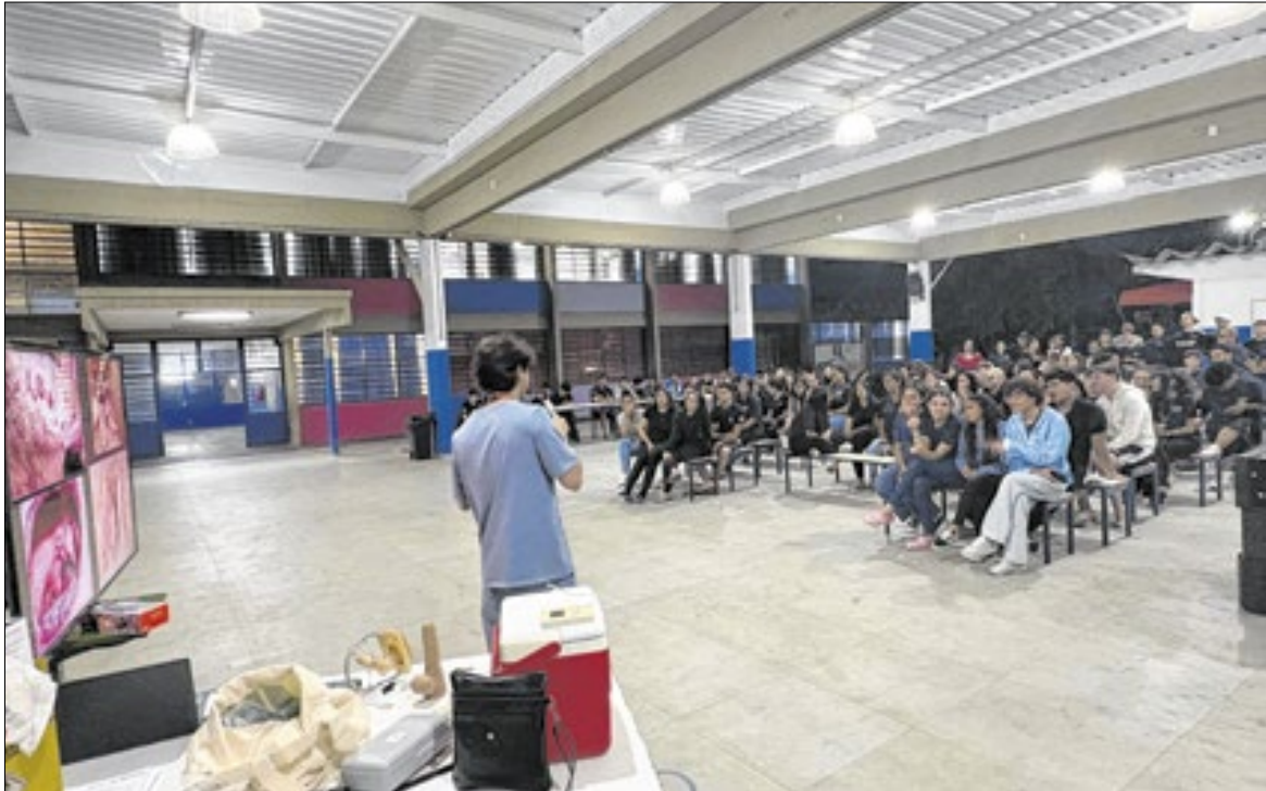
Escola estadual recebeu palestra sobre cuidados para cerca de 100 alunos do ensino médio

As escolas estão reforçando a necessidade de que os pais enviem a caderneta de vacinação acompanhada da autorização assinada, permitindo que adolescentes e jovens de 15 a 19 anos re-