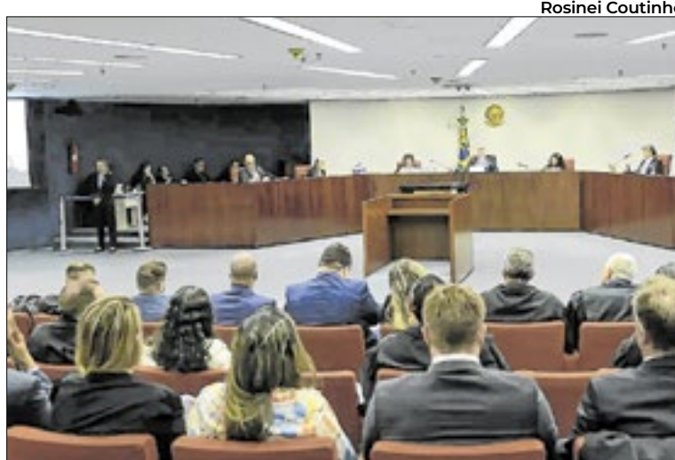
Em 2022, plenário decidiu que revisão da vida toda era constitucional

Durante o curso do processo, o INSS apresentou uma nota técnica informando um valor suposto de impacto nos cofres públicos: R$ 46 bilhões em dez anos, o que chegou a ser questionado por outra entidade, o Instituto de Estudos Previdenciários (Ieprev). No entanto, após perder a ação, e fora dos autos do processo, o INSS divulgou um estudo de impacto de R$ 360 bilhões em 15 anos e, por fim R$ 480 bilhões.