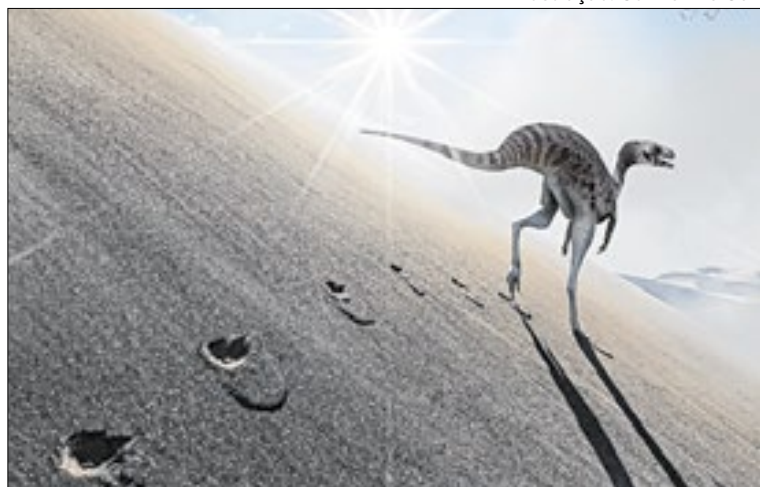
Ilustração: Guilherme Gehr

critas pertencem a um pequeno dinossauro ágil e corredor, possivelmente ancestral de grupos como os noassaurídeos — terópodes de porte reduzido, velozes e muito adaptados a ambientes áridos — e os velociraptorídeos, parentes do famoso Velociraptor, conhecidos pela agilidade na caça. O predomínio do terceiro dedo indica uma locomoção quase monodáctila, uma adaptação rara a ambientes desérticos", detalha Fernandes.