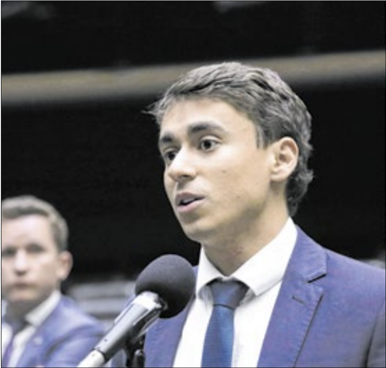
Nikolas Ferreira usou o celular na visita a Bolsonaro