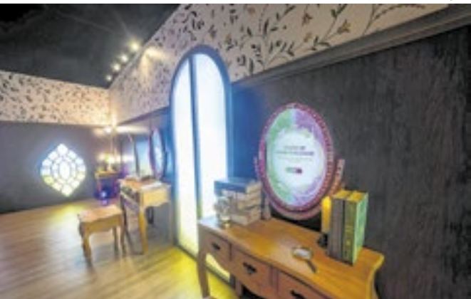
Mostra imersiva que recria cenários icônicos de Oz