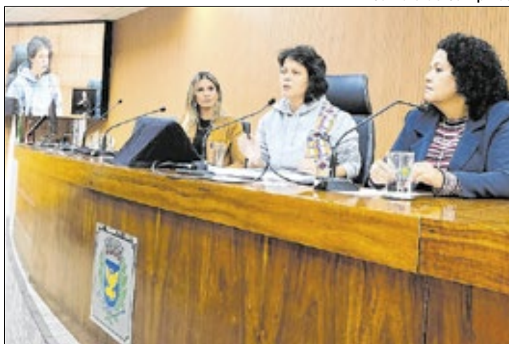
Câmara de Campinas