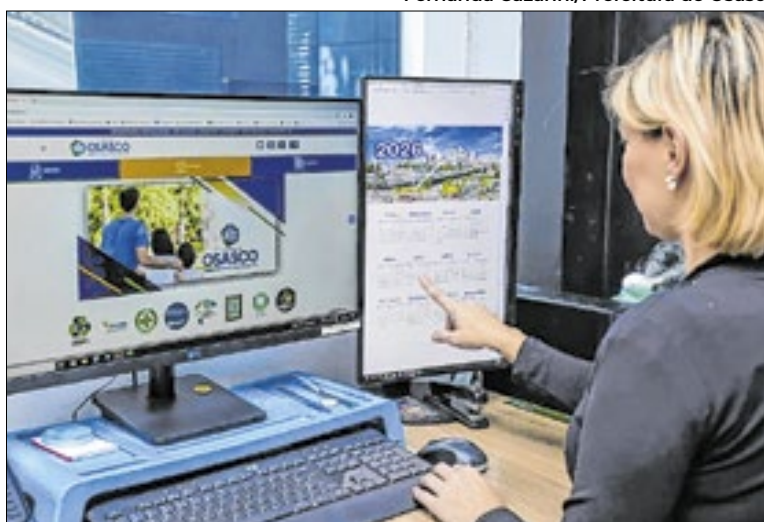
Iniciativa tem como objetivo modernizar o processo

De acordo com a administração municipal, o sistema digital proporcionará mais praticidade na emissão e no acompanhamento das cobranças. “Estamos ampliando os canais digitais e garantindo benefícios para quem optar pelo IPTU Digital”, afirmou o prefeito em suas redes sociais. A adesão deve ser realizada pelo site do Protocolo Digital de Osasco. O munícipe que ainda não possui cadastro deve criar uma conta para acessar o sistema. Após o lo-