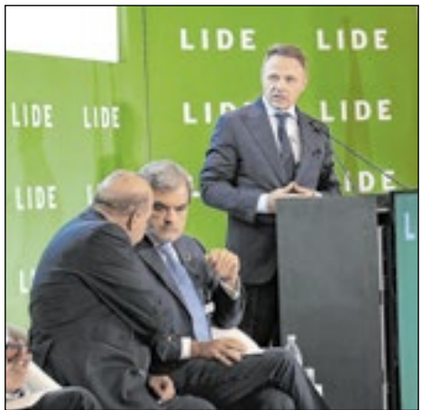
Francesco Lollobrigida, ministro da Agricultura da Itália