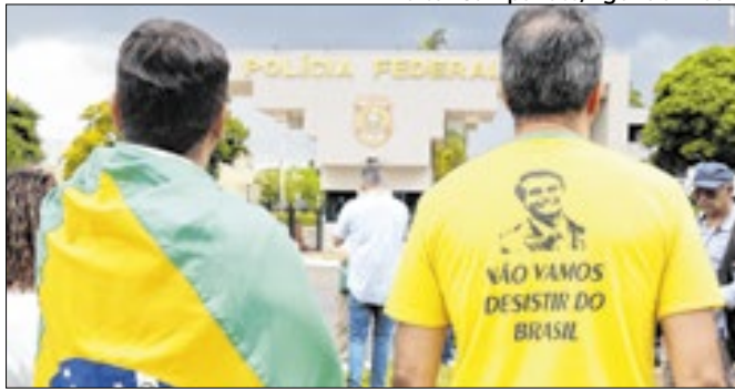
Como com Lula, bolsonaristas na frente da sede da PF