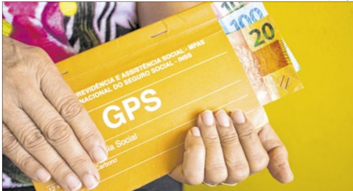
Contribuições previdenciárias podem ser feitas por carnê ou guias emitidas online

Pela decisão, segurados que tiveram a aposentadoria aumentada após conseguir a revisão por meio de tutela antecipada não vão precisar devolver o valor que receberam. O INSS pode, no entanto, reduzir o valor do benefício.