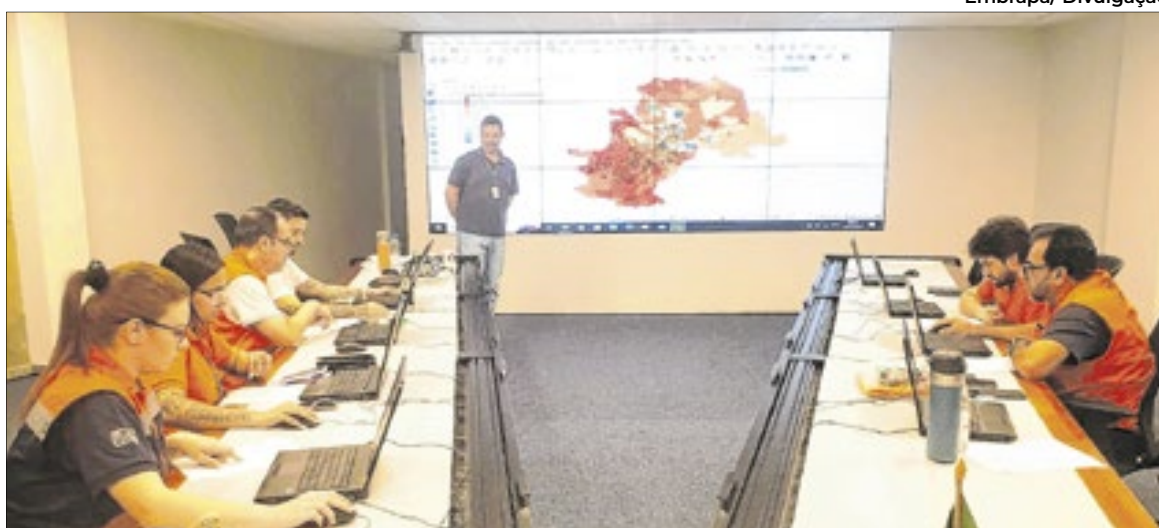
Pesquisadores em reunião de trabalho na sede da Embrapa Territorial

Spadotti ressalta que a localização em Campinas oferece vantagens competitivas à Embrapa