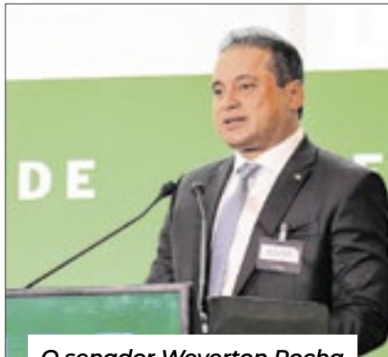
O senador Weverton Rocha apresentou um panorama das políticas climáticas e energéticas já aprovadas pelo Congresso