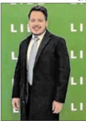
O secretário de Estado de Comunicação do Rio de Janeiro, Igor Marques