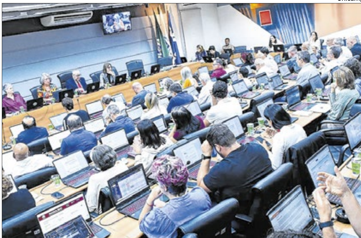
Abertura do curso foi votada na terça-feira (25) pelo Conselho Universitário (Consu)