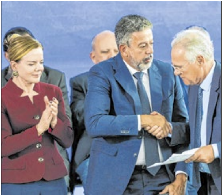
Lira cumprimenta seu adversário Renan Calheiros