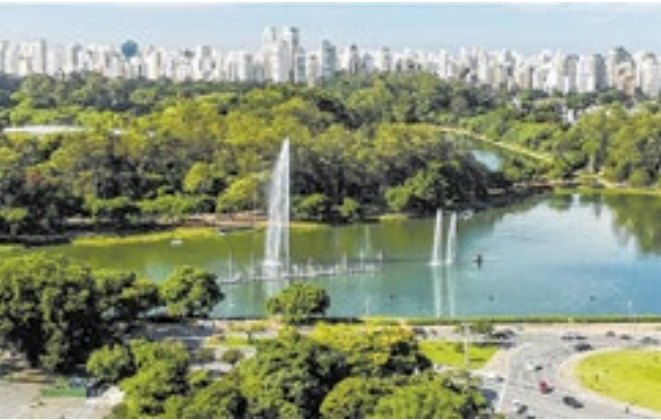
Na capital, as temperaturas variam entre 14°C e 25°C

A Assembleia Legislativa aprovou, na terça-feira (25), o Projeto de Lei 1.048/2025, que atualiza e consolida o Sistema Único de Assistência Social (SUAS) no Estado. O texto, de iniciativa do governo paulista, estabelece diretrizes, competências e parâmetros de cofinanciamento, buscando ampliar segurança jurídica e transparência na execução da política pública. A proposta segue para sanção do governador Tarcísio de Freitas.