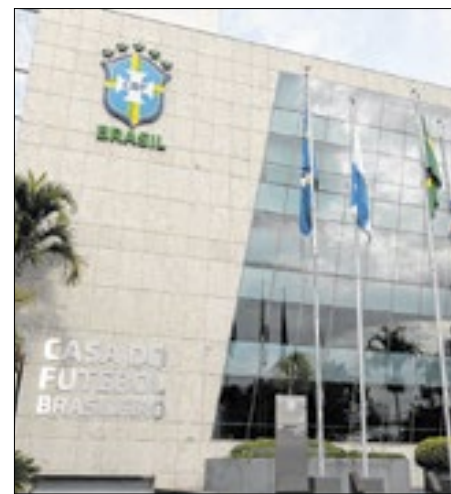
O Fair Play financeiro faz parte do programa CBF Impacta