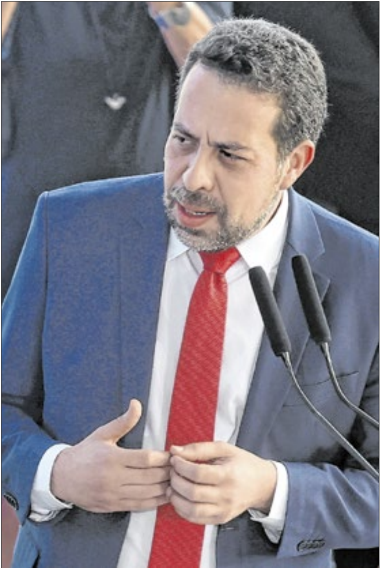
O novo Secretário-Geral da Presidência, Guilherme Boulos