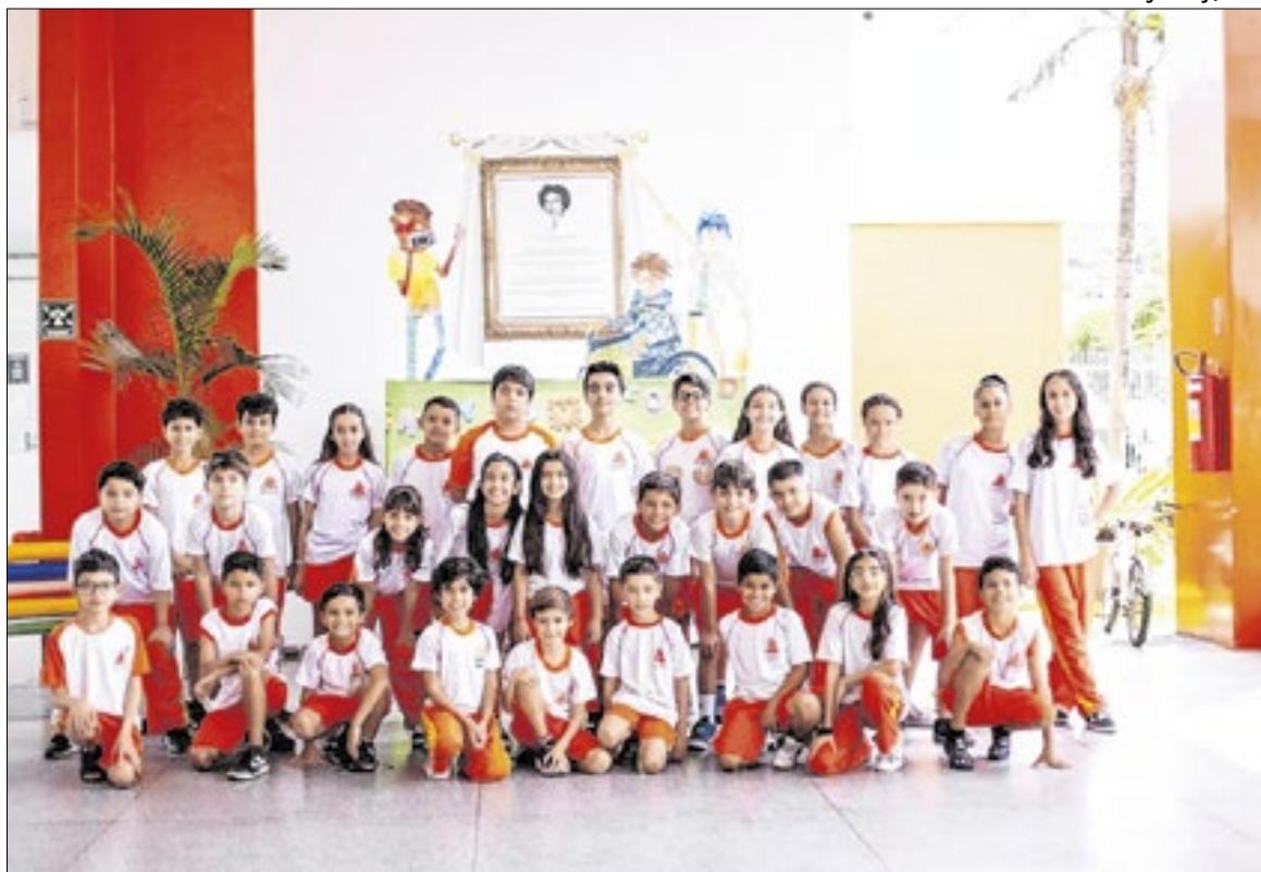
No total, 30 estudantes receberam medalhas após o desempenho na 2ª fase

A preparação dos estudantes ao longo do ano letivo envolveu atividades regulares em sala de aula e exercícios voltados ao estímulo do raciocínio lógico. Professores e equipe gestora da unidade reforçaram o trabalho pedagógico voltado ao desenvolvimento das habilidades mate-