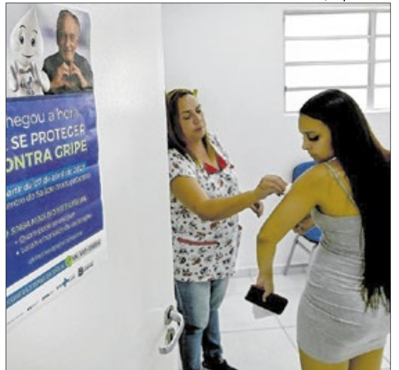
Dos 63 óbitos por gripe, 50 foram de pessoas não vacinadas

A experiência de Campinas no fortalecimento da resiliência urbana frente aos efeitos das mudanças climáticas é um dos destaques da publicação “Nota Técnica Ondas de Calor e Soluções Baseadas na Natureza”, lançada nesta terça-feira (25) na Secretaria de Meio Ambiente, Infraestrutura e Logística do Governo do Estado de São Paulo.