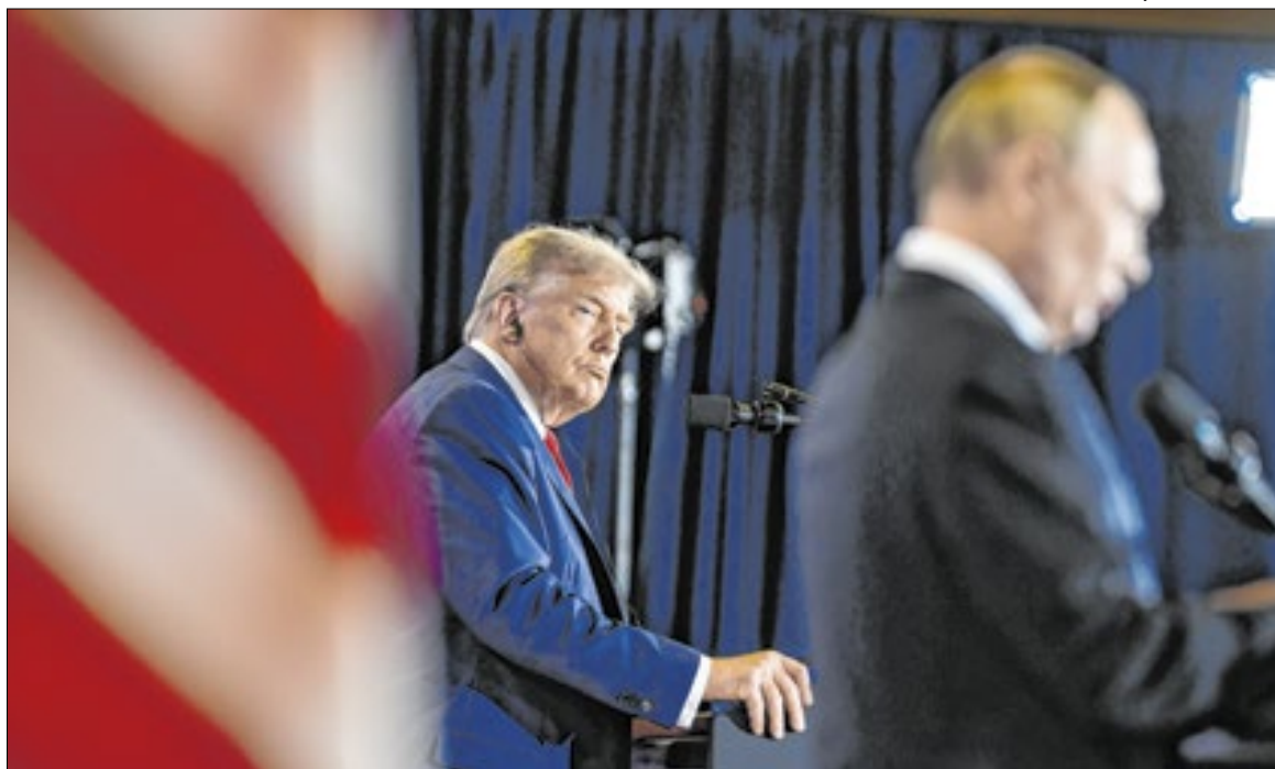
Donald Trump já não fala mais em uma “data limite” para definir acordo de paz na Ucrânia

Voando para passar o feriado do Dia de Ação de Graças na Flórida, Trump disse a repórteres que não tinha um prazo final e que espera resultado das negociações de seu enviado para o conflito, Steve Witkoff. O Kremlin anunciou nesta quarta que ele deverá ser recebido por Putin só na semana que vem.