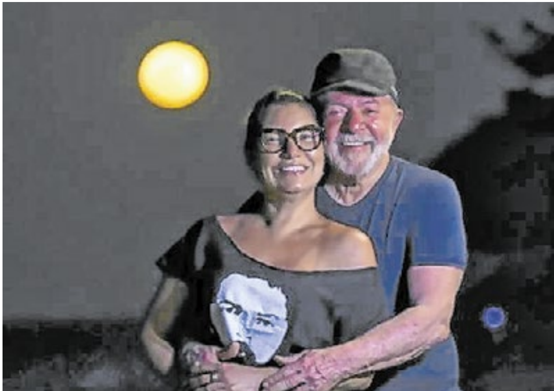
Lula vendeu uma imagem de saúde quando deixou a prisão