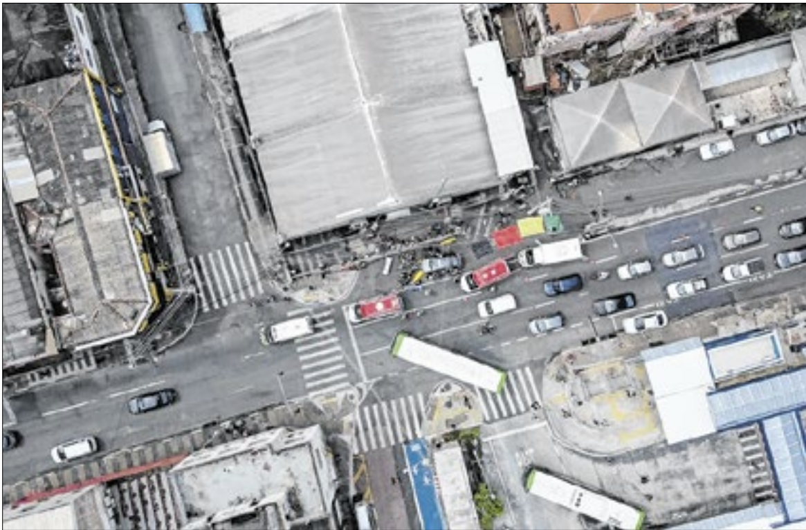
Excesso ou velocidade inadequada causaram dez sinistros fatais em vias urbanas

Com 114 óbitos no trânsito até outubro deste ano, Campinas alcançou redução de quase 16% nos índices registrados em vias urbanas e rodovias, em comparação às 135 mortes do mesmo período