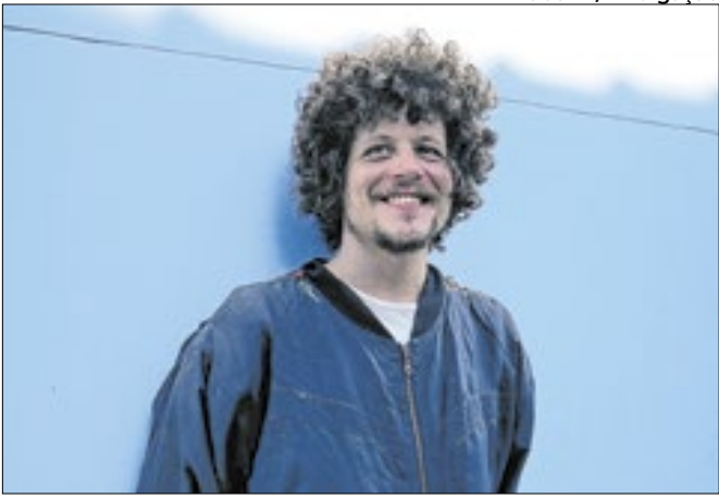
Chico Chico: fogo move música e poesia