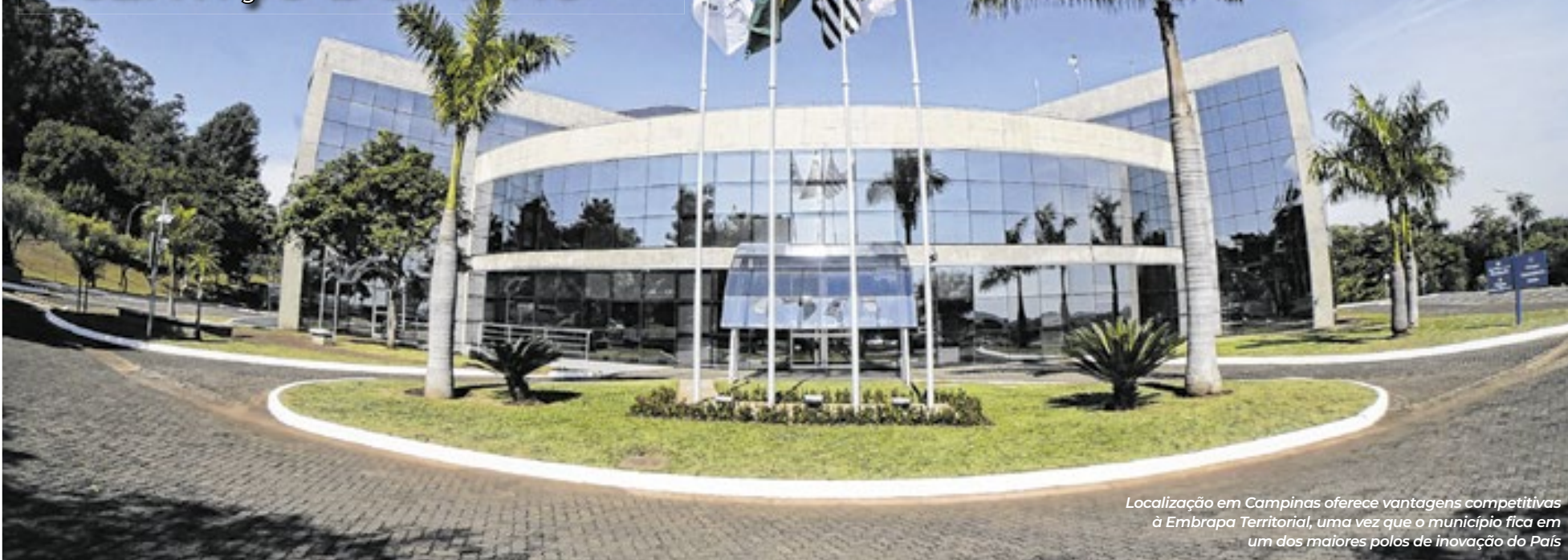
Localização em Campinas oferece vantagens competitivas à Embrapa Territorial, uma vez que o município fica em um dos maiores polos de inovação do País

Unidade foi pioneira no monitoramento da agropecuária