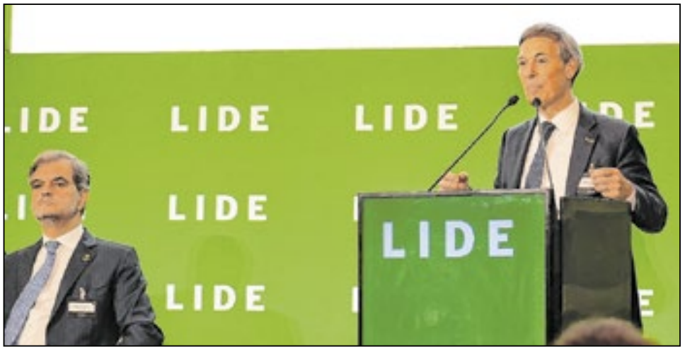
Francesco Lollobrigida, ministro da Agricultura da Itália