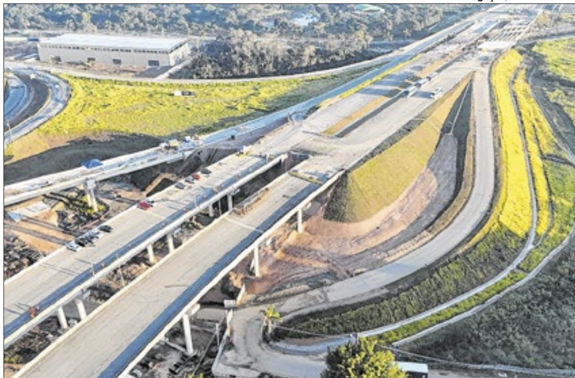
Andamento das obras que estão localizadas no rodoanel norte

Modernização no estado terá outros 430 km de terceiras faixas e 250 km de marginais