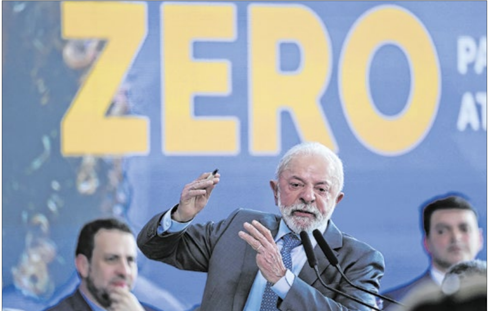
O presidente Luiz Inácio Lula da Silva sanciona a lei que amplia a faixa de isenção do IR

Em discurso sobre justiça social e combate à desigualdade, Lula destacou que não existe “sociedade igualitária”, mas que é preciso governar para aqueles que precisam do Estado. Ele reafirmou que o crescimento