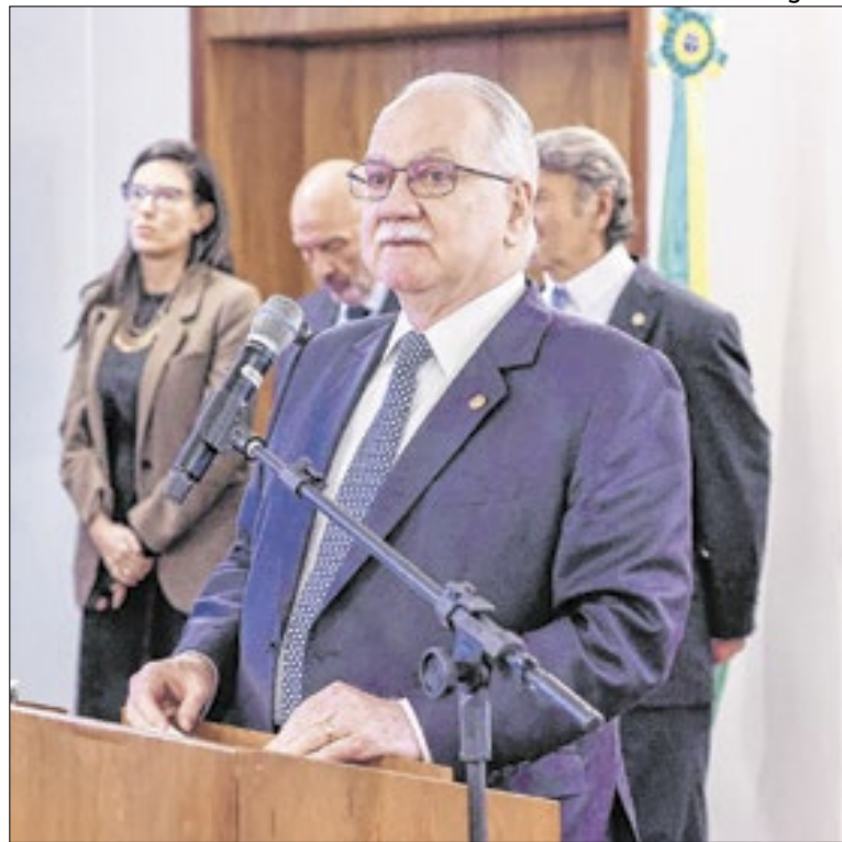
Presidente da Suprema Corte, Edson Fachin

Conforme Andrea, a adequação à LGPD vai além da formalidade documental. Trata-se de um processo de conscientização e de mudança de mentalidade. Empresas que tratam a proteção de dados como prioridade estão cumprindo a lei, preservando sua reputação, credibilidade e relação de confiança com o cliente. “Nesse novo mundo onde a IA está onipresente e os ciberataques mais sofisticados, a cibersegurança deixou de ser uma questão apenas mais técnica. O caso do Gmail é um lembrete de que os dados são a nova riqueza digital”, finaliza.