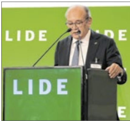
Gilmar Mendes, ministro do Supremo Tribunal Federal, reforçou o impacto do acordo no estímulo de investimentos estratégicos

■ Importante salientar que todas as medidas adotadas pela Seguros Unimed foram devidamente amparadas em suas políticas e estrutura de Governança, envolvendo conselho de administração e comitês, sob auditorias interna e externa, assegurando gestão técnica, responsável e transparente.