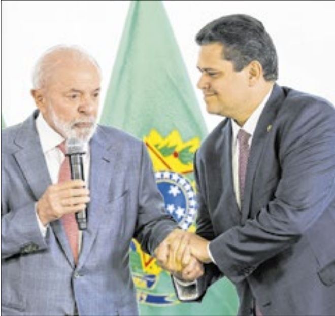
Alcolumbre soltou a mão do presidente Lula