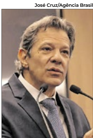
O ministro da Fazenda, Fernando Haddad

Alguns tipos de rendimentos não entram nessa conta, como ganhos de capital, heranças, doações, rendimentos recebidos acumuladamente, além de aplicações isentas, poupança, aposentadorias por moléstia grave e indenizações. A lei também define