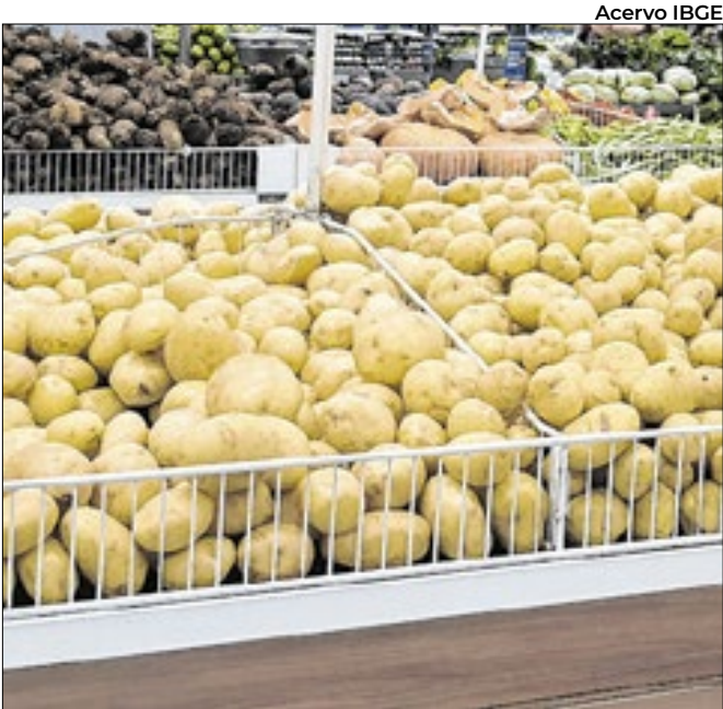
Batata inglesa foi a 'grande vilã' da alta do indicador