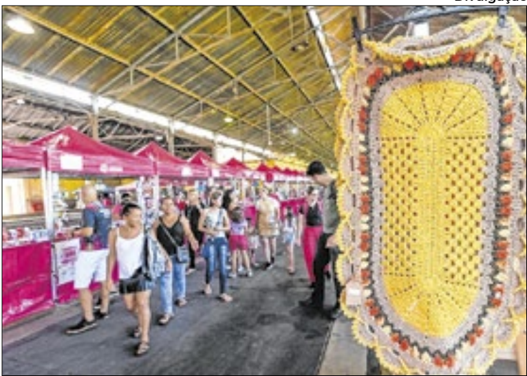
Feira terá 150 barracas, com artesanato, roupas, entre outros

“Neste ano, celebramos a quarta edição da Feira de Natal, evento que representa um marco significativo no fomento ao empreendedorismo feminino. É um privilégio observar o impacto positivo deste programa, que não apenas capacita mulheres a desenvolverem suas habilidades, mas também as motiva a perseguir suas aspirações e