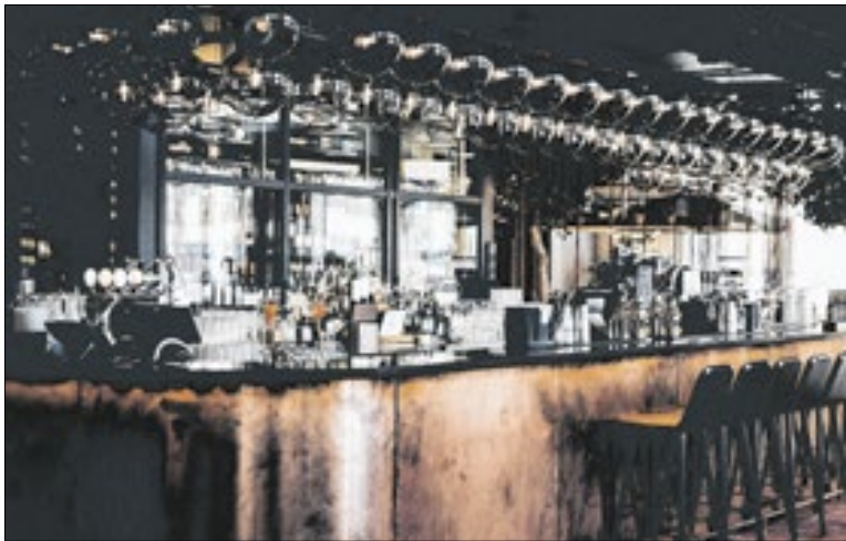
Nova pesquisa da Abrasel revela crescimento nas vendas