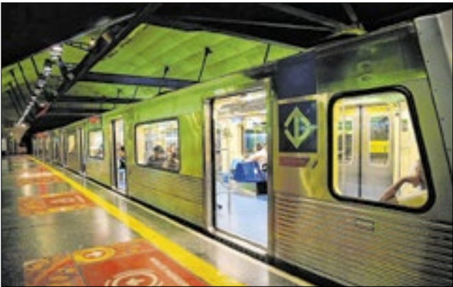
Frota de trens será ampliada aos finais de semana

Com o aumento esperado no fluxo de passageiros devido à Black Friday e à aproximação do Natal, o Metrô de São Paulo ampliará a frota de trens entre esta quarta-feira (26) e sexta (28) nos horários de pico. Cinco trens extras serão distribuídos pelas linhas 1-Azul, 2-Verde, 3-Vermelha e 15-Prata. A partir de 29 de novembro, o reforço passa a valer também nos fins de semana para as linhas 1-Azul e 3-Vermelha, que atendem regiões de comércio intenso, como São Bento e Brás. O efetivo de segurança será ampliado em estações selecionadas. O Metrô orienta passageiros a evitar áreas aglomeradas nas plataformas, manter atenção nas escadas rolantes e respeitar limites para transporte.