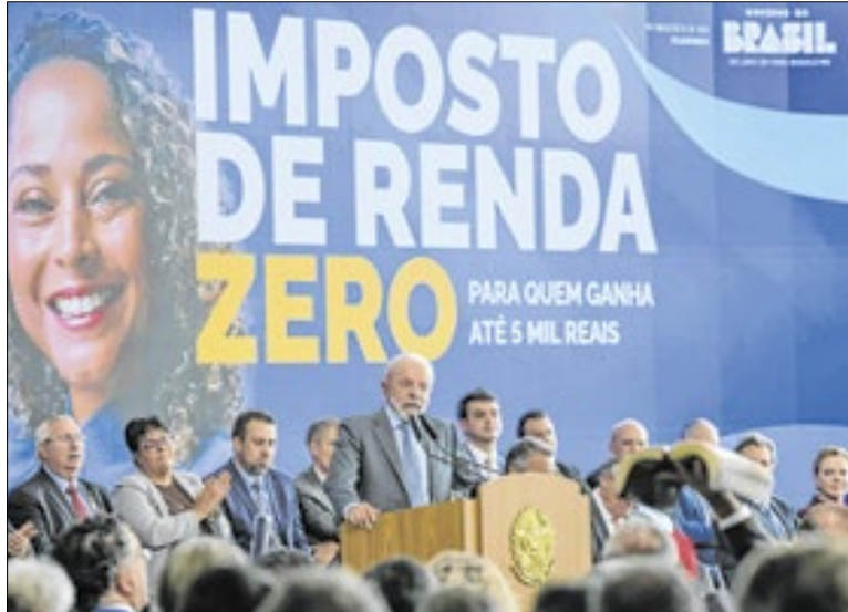
Ministros tentaram minimizar ausências de Motta e Alcolumbre

Promessa de campanha do presidente Luiz Inácio Lula da Silva (PT), a isenção do Imposto de Renda para quem ganha até R$ 5 mil foi aprovada de forma unânime tanto na Câmara quanto no Senado. Ao sancionar, porém, a lei que estabelece a isenção, Lula não contou na cerimônia com a presença dos dois comandantes do Congresso, acentuando o clima ruim hoje entre o governo e o Congresso.