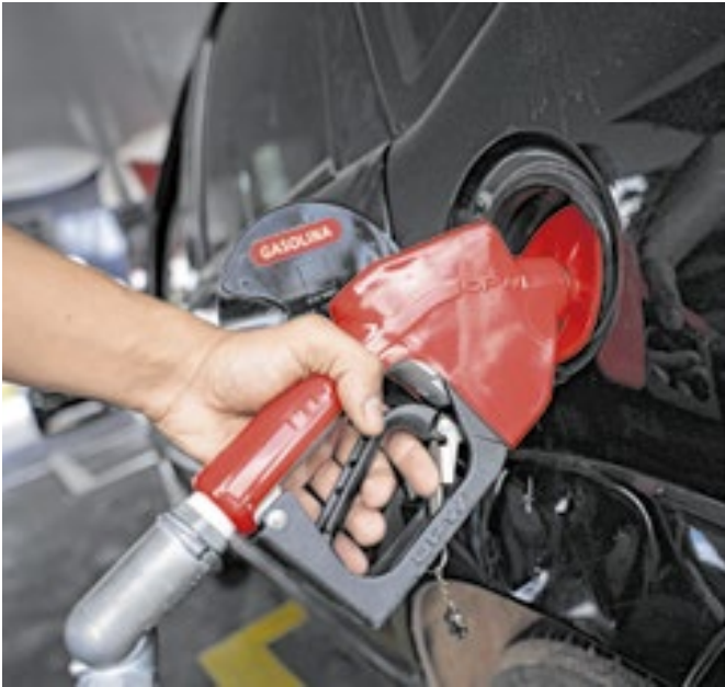
O anúncio da redução foi feito pela Petrobras