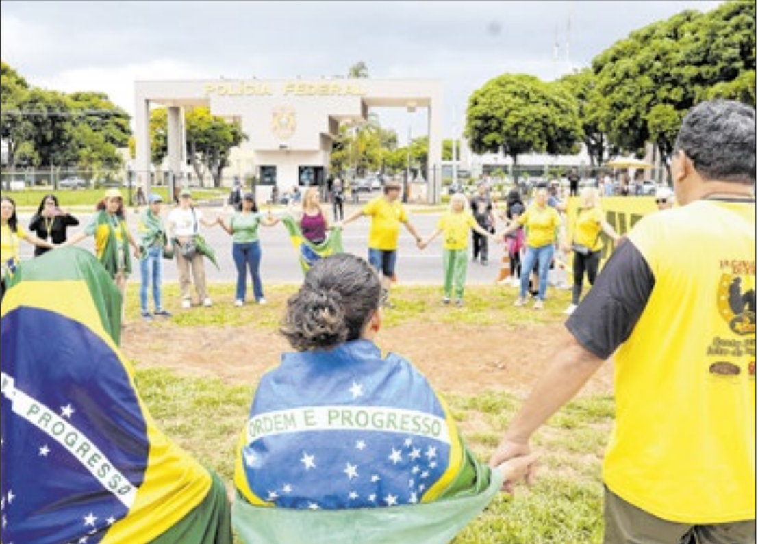
Manifestantes em frente à sede da Polícia Federal, onde está preso Bolsonaro

Não é possível saber, porém, quanto tempo Bolsonaro ficará preso na sala onde se encontra. O trânsito em julgado foi possível porque a defesa de Bolsonaro não apresentou novos recursos – os chamados embargos declaratórios. Pode – e deverá fazer isso – apresentar agora os embargos infringentes, que não contestam a condenação