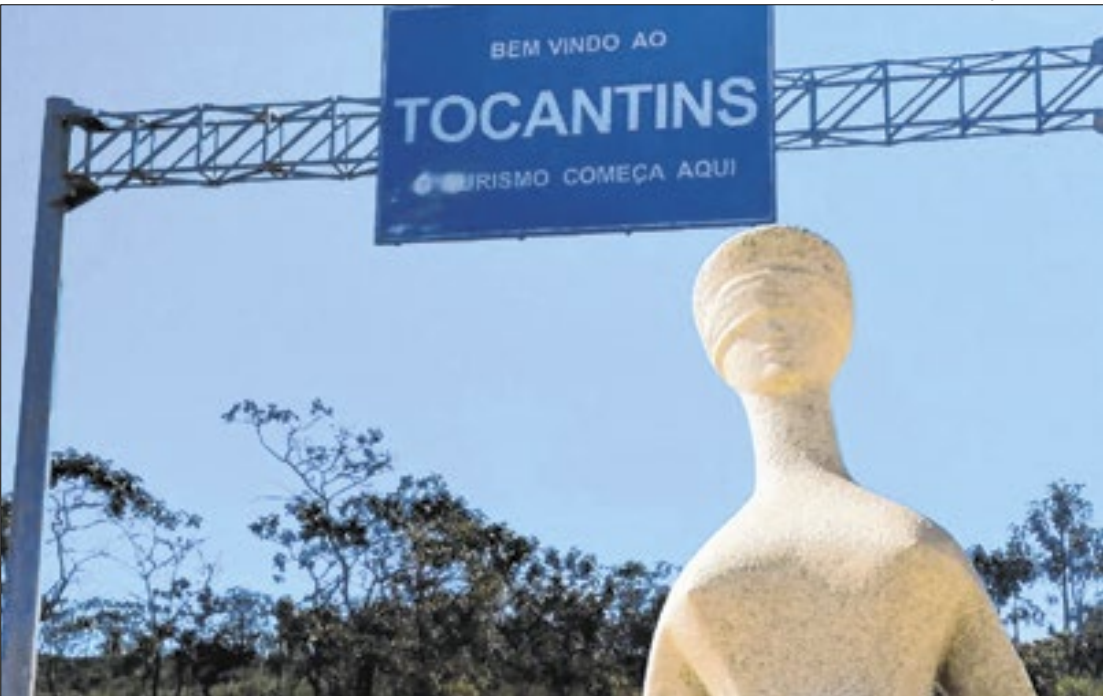
Estados debatem posse territorial e possível erro em carta topográfica do Exército

O governo de Goiás, pela procuradoria estadual (PGE-GO), ingressou com uma