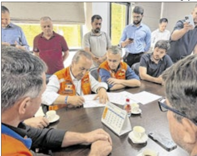
As ações foram alinhadas junto à prefeitura

O governador de Santa Catarina, Jorginho Mello, esteve nesta terça-feira, 25, em Luiz Alves, no Vale do Itajaí, para garantir o apoio do Estado na reconstrução das áreas atingidas por fortes chuvas. As ações foram alinhadas junto à prefeitura do município. Entre domingo, 23, e a madrugada de segunda, 24, o município registrou mais de 180 milímetros de chuva em 24 horas, sendo 114 mm apenas nas primeiras seis horas, segundo a Defesa Civil. Em