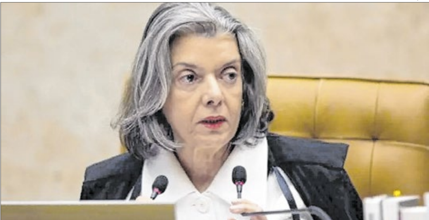
Cármén Lúcia, ministra do STF, participou do seminário Democracia, substantivo feminino

nhecer as novas regras ou não se preparar adequadamente pode enfrentar indeferimentos e atrasos”. Enquanto aguarda decisão do presidente da República, Portugal se aproxima de um novo capítulo na sua política migratória, mais rígido, regulamentado e com maior exigência.