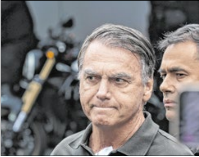
Bolsonaro é capitão da reserva do Exército