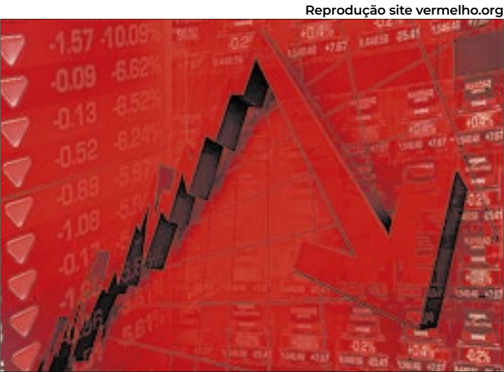
Contas externas tiveram saldo negativo em outubro

De acordo com o BC, as transações correntes têm cenário bastante robusto e vinham com tendência de redução nos déficits em 12 meses, o que se inverteu a partir de março de 2024. Ainda assim, o déficit externo está financiado por capitais de longo prazo, principalmente pelos investimentos diretos no país, que têm fluxos e estoques de boa qualidade.