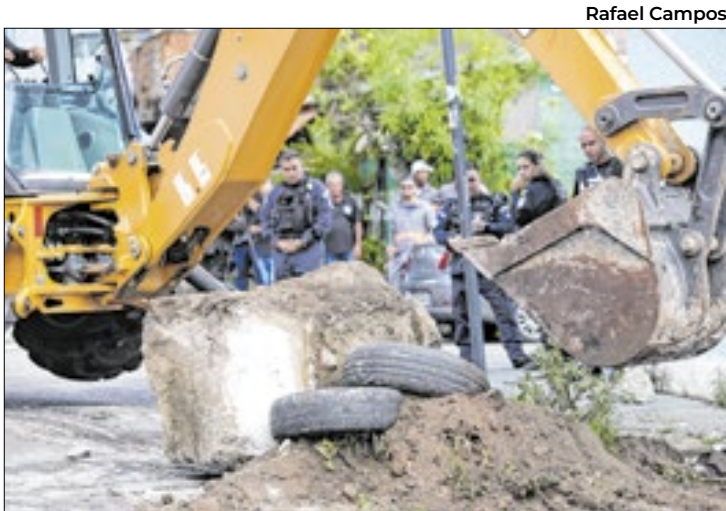
As forças de segurança não vão tolerar barricadas

segundo dia da Operação Barricada Zero resultou na prisão de sete criminosos e na apreensão de quatro pistolas. “É importante ressaltar que todas as comunidades em que estivemos ontem continuam com a atuação das forças de segurança hoje. Além da retirada de barricadas, que segue de forma constante, estamos reconstruindo as vias que foram destruídas por esses criminosos. As forças de segurança não vão tolerar que criminosos instalem barricadas no estado”, afirmou o secretário Edu Guimarães. A Operação Barricada Zero é um programa contínuo de segurança com o objetivo de retirar os bloqueios instalados por organizações criminosas nas entradas das comunidades, retomar o direito de ir e vir dos moradores e permitir o acesso de serviços essenciais.