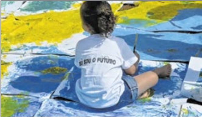
Regras também mudam para crianças em Portugal