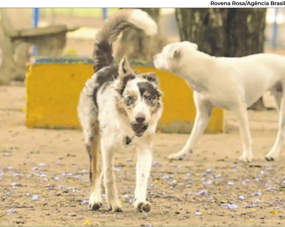
Pessoas fingem preocupação com animais

Segundo relatório produzido pela Social Media Animal Cruelty Coalition, o problema de falsos protetores já se configura global. Em 2024, a associação identificou mais de 1.022 links de vídeos falsos de resgate animal em plataformas como Facebook, Instagram, YouTube, TikTok e Twitter/X. Segundo os dados, os vídeos foram assistidos mais de 572 milhões de vezes.