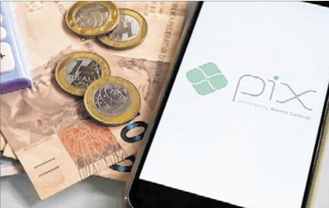
Investigações contra crimes com Pix ganham reforço

Antes, a devolução dos recursos era feita apenas a partir da conta originalmente utilizada na fraude. O problema é que os fraudadores, em geral,