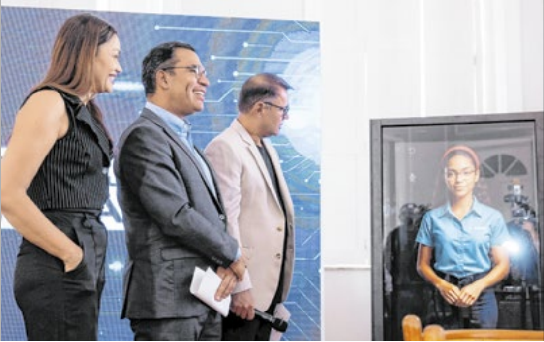
O avanço era um desafio histórico para os Detrans de todo o país

Estado se torna pioneiro ao eliminar documentos físicos