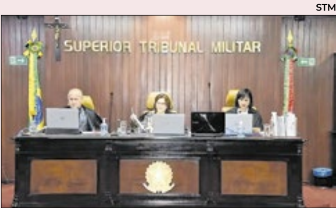
O STM tem dez ministros militares e cinco civis

No caso, pode-se dizer que o julgamento no STM que leva à perda da patente militar é mais uma questão moral. Significa dizer que a instituição considerou que tal pessoa, pelo crime que cometeu e foi condenada, é indigna de permanecer nas Forças Armadas.