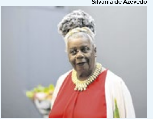
Vencedora do Jabuti Conceição Evaristo transformou a experiência da mulher negra em matéria literária