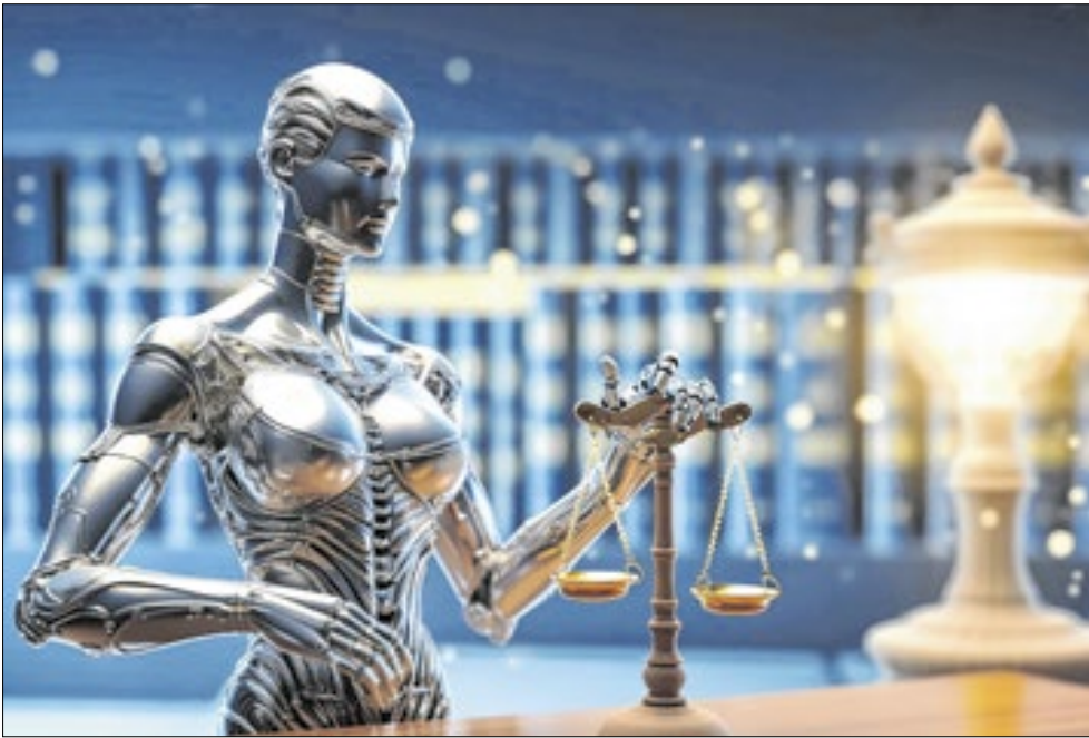
Justiça em 2026 terá novos desafios, principalmente por conta da tecnologia