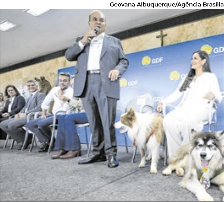
O governador Ibaneis Rocha e seus cães, durante cerimônia que fez os anúncios para a proteção animal

“Com este programa, não apenas colocamos os animais no mapa do DF, mas os inserimos na lista de prioridades do