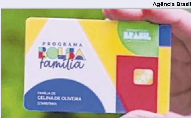
Bolsa Família de novembro começou a ser pago dia 20

Os pesquisadores atribuem a melhora recente ao aquecimento do mercado de trabalho e à expansão das transferências de renda, ambos responsáveis por quase metade da redução da desigualdade e da queda da extrema pobreza entre 2021 e 2024.