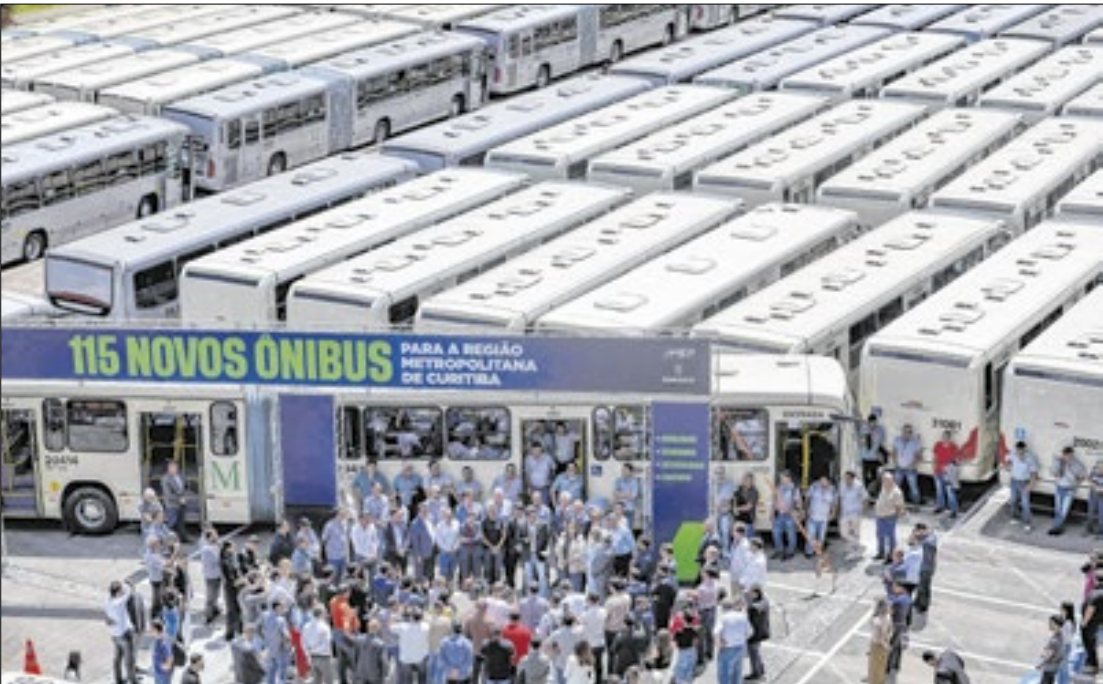
O investimento foi realizado pelas empresas operadoras do sistema metropolitano

Para o governador Carlos Massa Ratinho Junior, a renovação representa mais conforto aos usuários para deslocamentos durante o dia a dia. “Temos a maior integração do transporte público do País e agora novos veículos à disposição. São mais de 25 cidades integradas com a Capital,