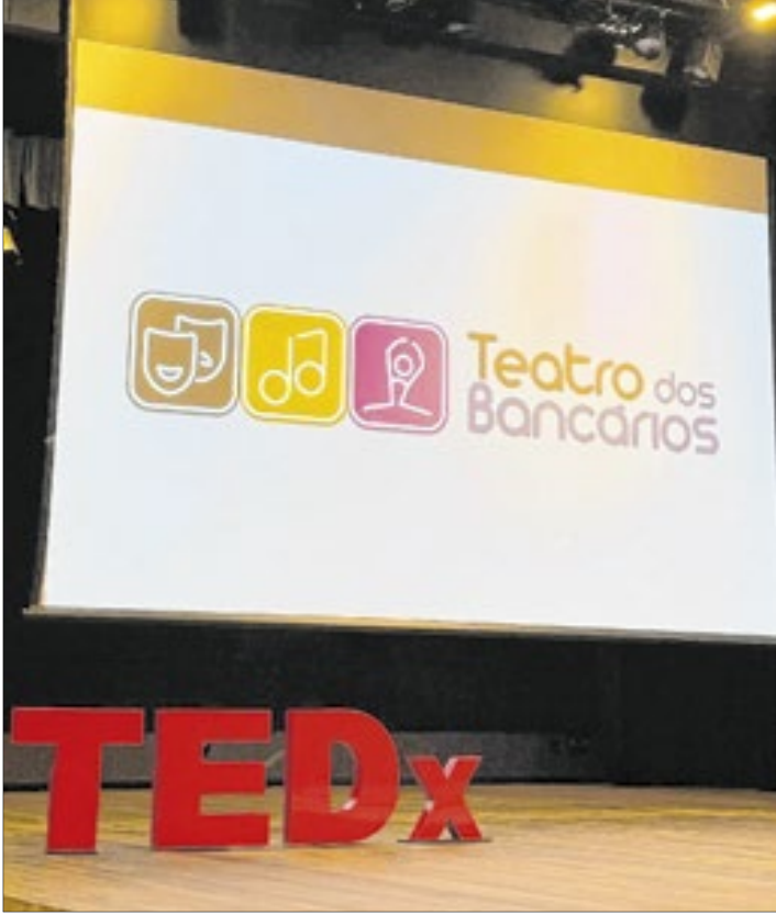
O encontro desta quinta marca o retorno do TEDx à cidade após sete anos e promete reunir 500 participantes

Com o tema “Brasília — a reinvenção do Brasil”, o evento propõe uma reflexão sobre como a tecnologia, a inovação e o empreendedorismo podem transformar o país a partir do Distrito Federal. Serão 16 palestras curtas e impactantes, conectando tendências globais — como inteligência artificial, construção 4.0, economia descentralizada e cidades inteligentes — a soluções