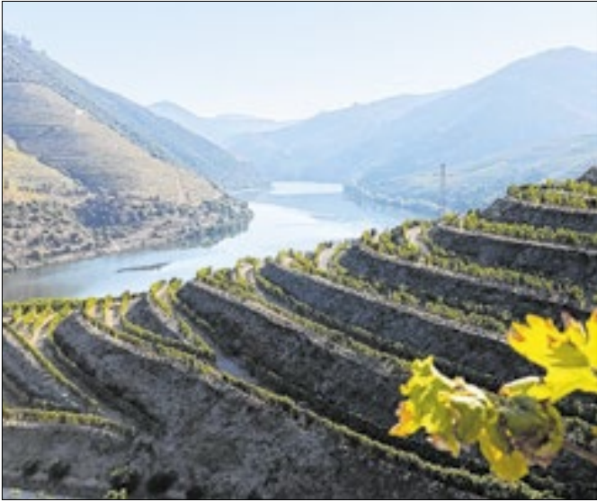
Vinhedos do Vale Douro são encrustados nas montanhas