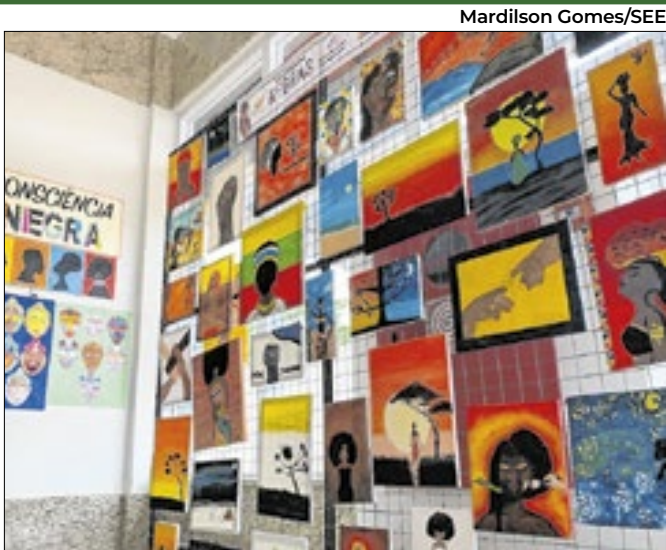
Evento reúne ações de pesquisa em programação aberta