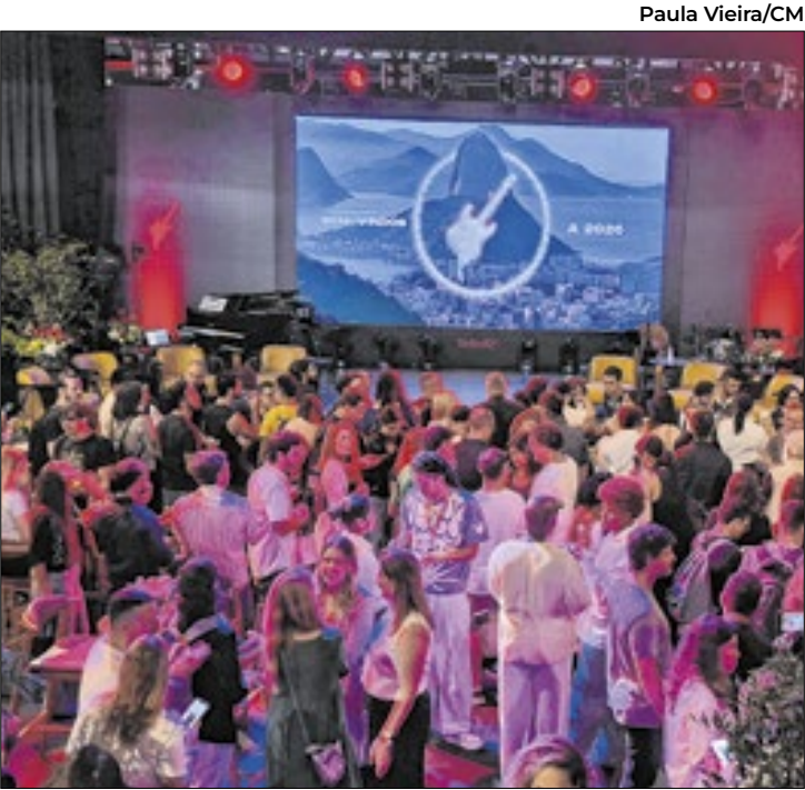
Apresentação aconteceu no Pão de Açúcar

O festival revelou ainda novidades estruturais, como o retorno do ‘The Flight’, que trará trilha sonora sincronizada, balé aéreo, cinco aviões e 756 disparos de fogos por dia. O Palco Mundo, principal vitrine do evento, será totalmente remodelado: 31,5 metros de altura, 104 metros de comprimento e um painel de LED de 2.400 m². O novo desenho promete ampliar a experiência visual do público. “é uma cenografia absolutamente inovadora, com muita tecnologia, mas a mesma grandiosidade de sempre”, des-