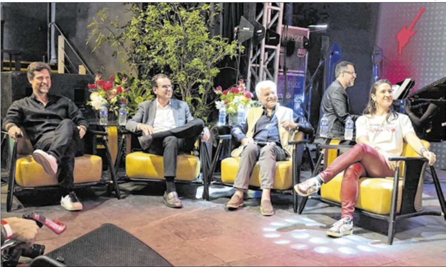
Prefeito Eduardo Paes se esteve ao lado de Roberto Medina e líderes da Rock World

Em entrevista ao Poder 360, Celso Sabino atribuiu à ONU a falha que permitiu a entrada de um aparelho de micro-ondas e que resultou no incêndio na Zona Azul da COP30. Ninguém se feriu, mas o episódio revelou o tamanho do risco: uma tragédia com mortes teria colocado em xeque a imagem do Brasil como destino de grandes eventos, além de gerar enorme dano à Embratur, que se livrou de um enrosco monumental. A Polícia Federal apura onde ocorreu a falha — na segurança da ONU, no controle local ou na combinação dos dois.