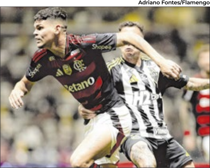
Flamengo precisa de uma vitória simples no Maracanã para soltar o grito de campeão brasileiro de 2025