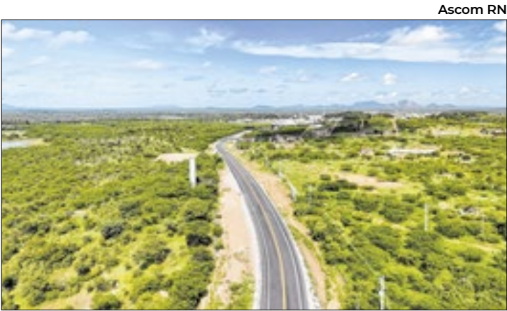
Governo do Rio Grande do Norte assegura R$ 855 milhões

Entre os expositores, estarão presentes os grupos e cooperativas Trançados da Ilha, Codevarp, Coopboahora, Cajuêspi, Coofrut, Pequena Horta, Raízes do Brasil, Unisol, entre outros.