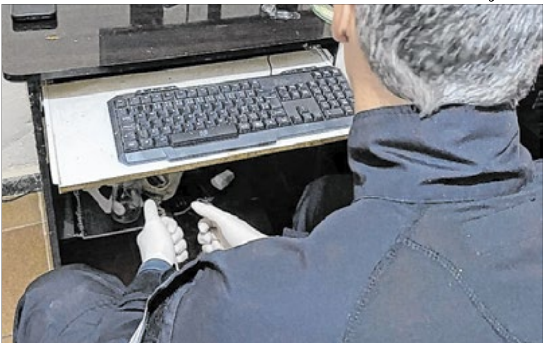
Suspeito foi preso em flagrante por armazenar conteúdo com cenas de abuso sexual

O investigado é suspeito de aliciar menores em redes sociais