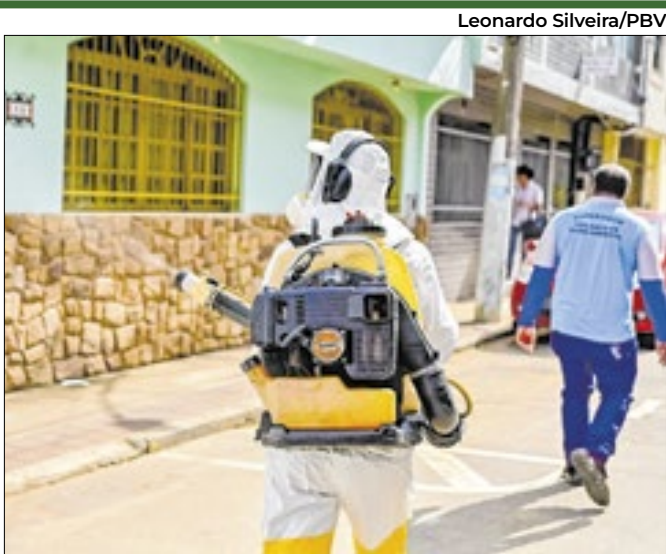
Equipes orientam moradores e eliminam possíveis focos