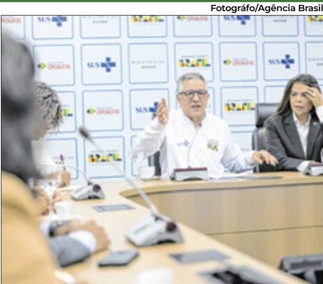
Primeiro lote começa a ser distribuído em novembro