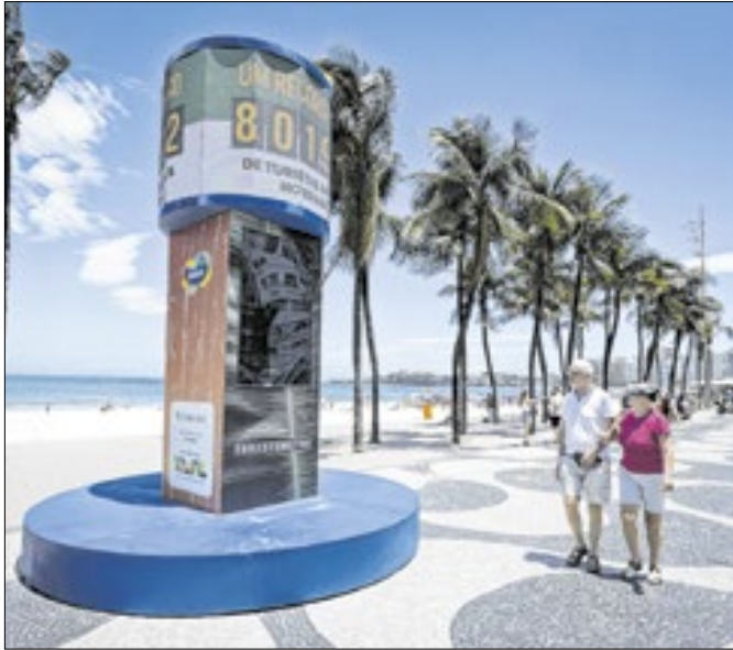
Turistômetro do Rio está na orla de Copacabana