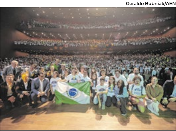
Os jovens vão estudar por um semestre em cinco países