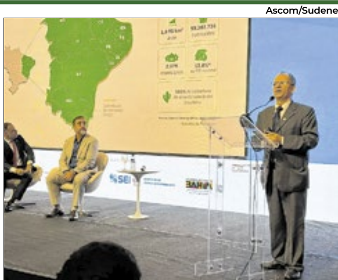
O Nordeste possui a maior vantagem comparativa

A Superintendência do Desenvolvimento do Nordeste (Sudene) apresentou, durante o III Fórum Bahia-China, a Região como um destino estratégico para investimentos estrangeiros, especialmente da China, com foco na reindustrialização verde e na transição energética.