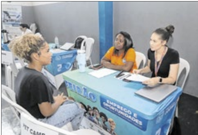
Feirão é realizado pela Secretaria de Trabalho e Renda

A Prefeitura de Campinas realiza o 26º Feirão de Emprego e Oportunidades nesta quinta-feira (27) disponibilizando 800 vagas. O evento é aberto ao público e será realizado das 9h às 16h, no Unisal (Centro Universitário Salesiano de São Paulo), na Av. Dr. Theodureto de Almeida Camargo, 244, no Jardim Nossa Senhora Auxiliadora. Antes das entrevistas, os candidatos passam por uma triagem feita por agentes do Centro Público de Apoio ao