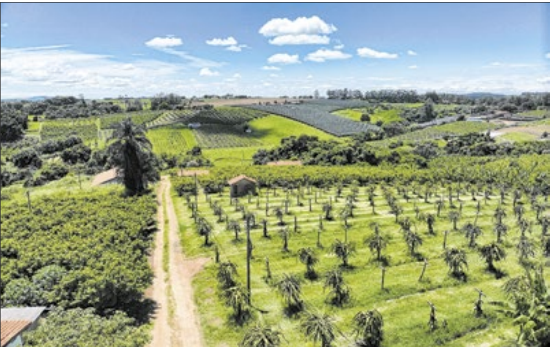
Sítio no bairro rural Descampado recebeu R$ 9.200 de incentivo monetário

A prefeitura de Campinas (SP) reabriu o edital do programa que oferece incentivos financeiros e técnicos a produtores rurais da cidade para que conservem e recuperem áreas de nascentes, mananciais e solo, garantindo a qualidade da água e o desenvolvimento sustentável do município.