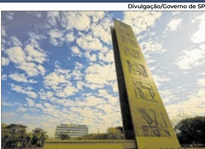
Praça do Relógio, na USP, no Butantã

A USP avançou da 57ª para a 32ª posição na edição 2026 do Interdisciplinary Science Rankings (ISR), tornando-se líder no Brasil e na América Latina e a única instituição brasileira entre as 50 primeiras. O levantamento, elaborado pela Times Higher Education (THE) em parceria com a Schmidt Science Fellows, avalia a capacidade das universidades de promover pesquisa interdisciplinar. O Brasil tem 37 instituições classificadas. Após a USP, aparecem a Unesp (86º lugar), a Unifesp (144º