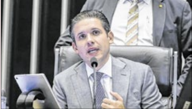
Motta gerou descontentamento ao nomear Derrite