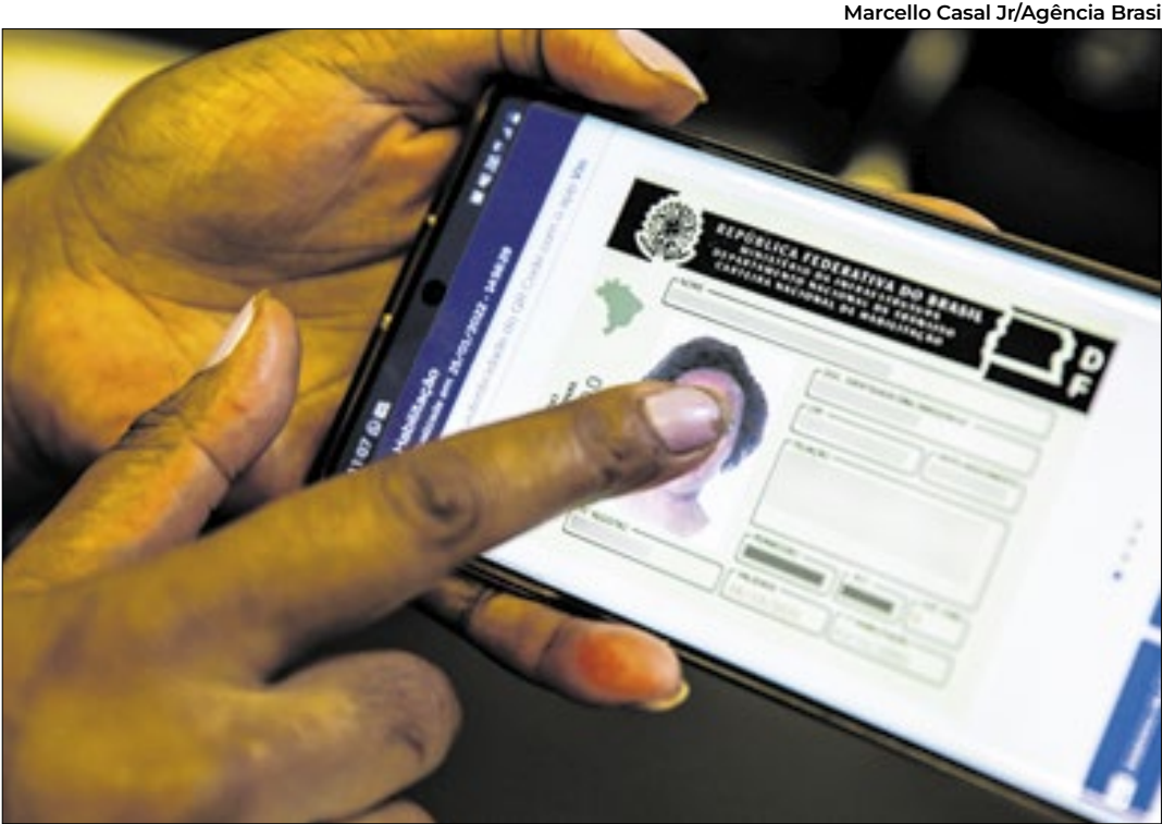
CNH tem alta nas fraudes: 8% dos casos em 2022 e 14% em 2025

Após procurar um ou mais destes espaços de acolhimento, apenas 28% registraram denúncia em Delegacias da Mulher e 11% acionaram o Ligue 180, central de atendimento à mulher. Em uma análise considerando o tipo de congregação entre as entrevistadas que afirmavam ter alguma fé, 70% das evangélicas procuraram amparo religioso, enquanto 59% das católicas recorreram a familiares.