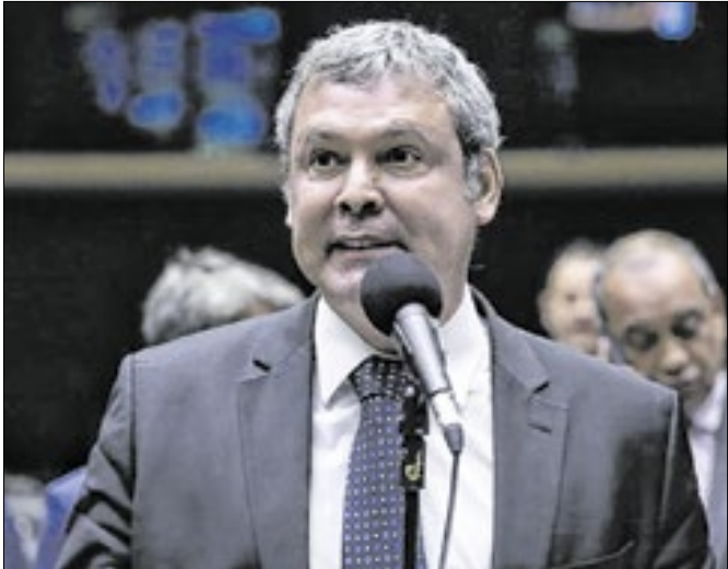
Lindbergh Farias: segundo aliados, pouco agregador