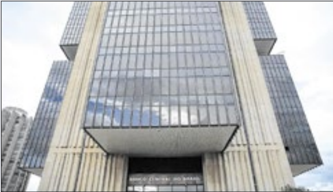
Copom, do Banco Central, que decide a taxa Selic