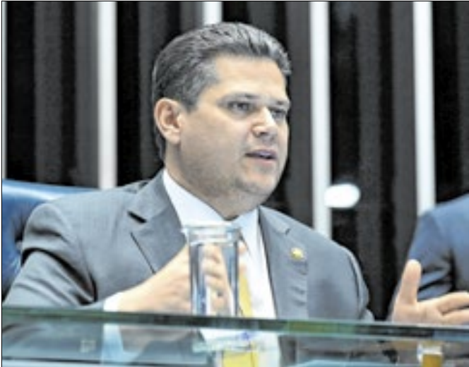
Alcolumbre: nova votação muda previdência