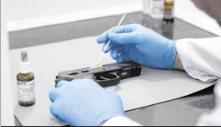
Equipes forenses recuperam dados suprimidos