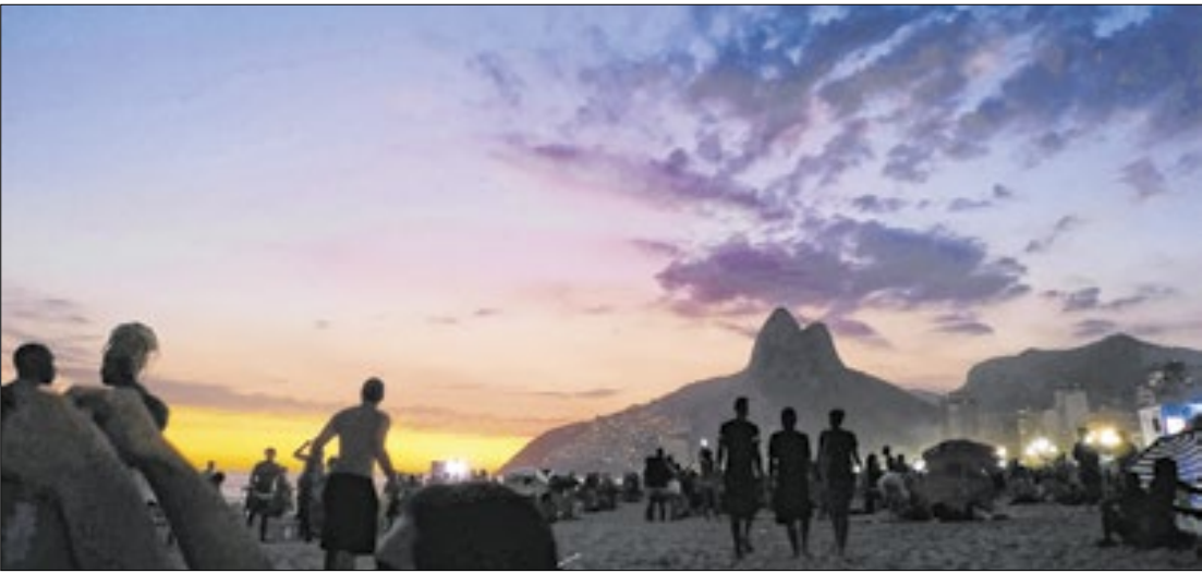
O litoral carioca segue sendo a preferência dos turistas