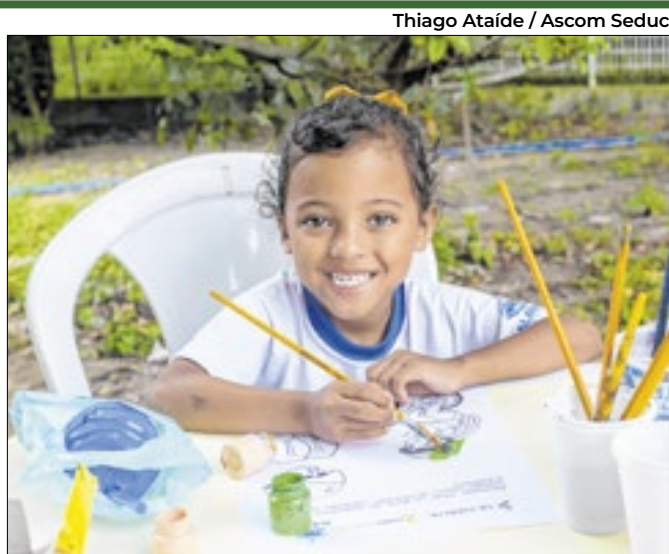
Thiago Ataíde / Ascom Seduc

Materiais integram a Estratégia Primeira Infância