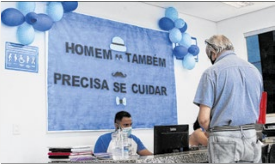
Em 2023, 47 homens morreram por dia por câncer de próstata

Dados da Secretaria de Saúde do Distrito Federal apontam que somente um terço dos atendimentos na atenção primária são para homens, embora eles sejam a maioria da população. É um dado preocupante no momento em que se promove a conscientização do Novembro Azul.