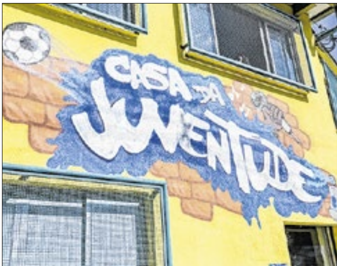
Progamação para a juventude em três locais