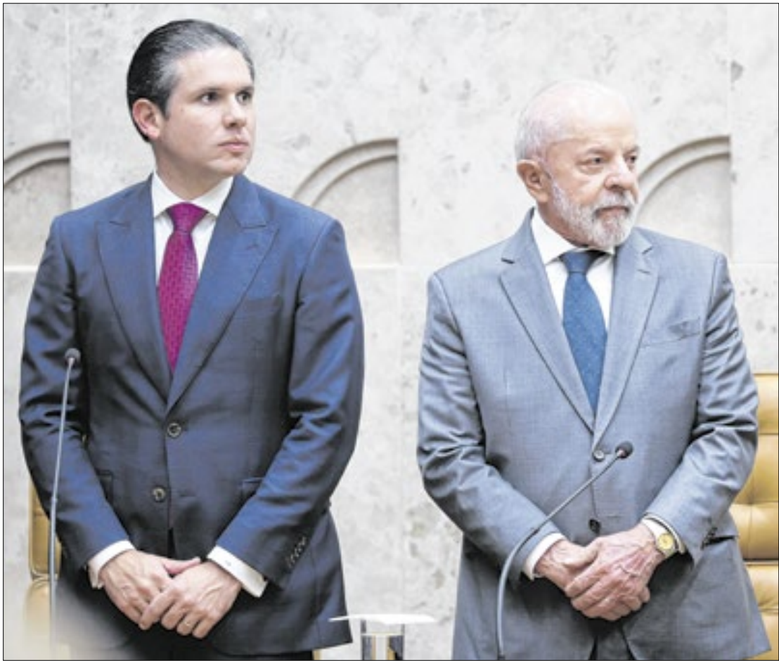
Motta afasta-se do governo na condução da Câmara

Segundo a ministra, o governo federal não conseguiu avançar da forma que queria no