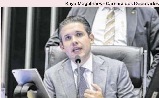
Motta gerou descontentamento ao nomear Derrite

A ausência, por algumas semanas, do líder do governo, José Guimarães (PT-CE), que precisou se submeter a uma cirurgia cardíaca, piorou a situação. Isto porque, na prática, Lindbergh assumiu funções que caberiam ao colega de bancada, mais conciliador do que ele.