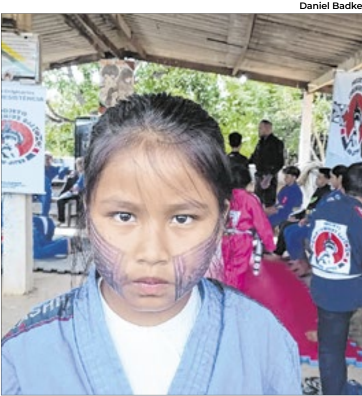
Crianças indígenas se destacam nas artes marciais

“Organizamos competições até dentro da aldeia, assim eles aprendem a ganhar e perder. É difícil levá-los para fora. Precisamos de transporte, comida, inscrições... Mas nós damos um jeito e conseguimos. No último final de semana, 13 crianças competiram e todas elas ganharam medalhas. Foram quatro de ouro, sete de prata e duas de bronze. É muito gratificante ver eles subindo no pódio mostrando que o projeto está dando certo. Eu acho que é um povo muito ‘raçudo’, então isso ajuda mesmo com eles treinando pouco”, declara.