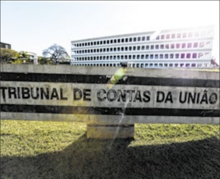
TCU está preocupado com as licitações públicas

O Tribunal de Contas da União (TCU) lançou, no dia 19, a consulta pública “Você escolhe, o TCU fiscaliza!”, para que a população indique temas a serem fiscalizados pelo Tribunal, em 2026. Quem quiser votar deve acessar o Portal do Cidadão e selecionar entre cinco grandes temas e 18 problemas. Os cinco assuntos mais votados vão se tornar novas auditorias.