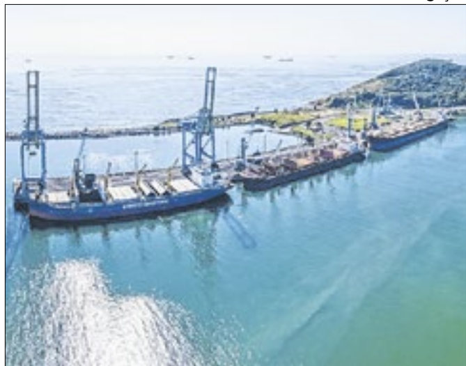
6,17 milhões de toneladas foram movimentadas

O Porto de Imbituba fechou o acumulado de janeiro a outubro de 2025 com 6,17 milhões de toneladas movimentadas e 268 atracações. O destaque do ano foi o mês de outubro, o mais movimentado até agora, com 714,7 mil toneladas. No acumulado do ano, as exportações totalizaram 2,53 milhões de toneladas, com ênfase nos embarques de coque calcinado, coque não calcinado e farelo de milho. Já as importações alcançaram 2,86 milhões de toneladas, um