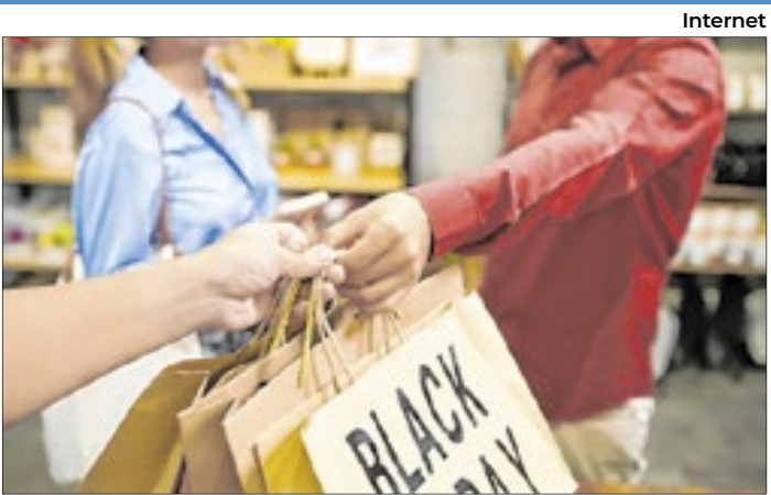
O 13º movimentou o comércio local, especialmente na Black Friday e no Natal

Apesar do avanço no endividamento, a inadimplência — que considera apenas as dívidas em atraso — teve leve recuo, passando de 42,3% para 42,1%, o que equivale a 450.729 famílias. No entanto, o número de lares que afirmam