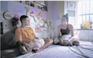
O sensível documentário ‘Apolo’ chega aos cinemas nesta quinta