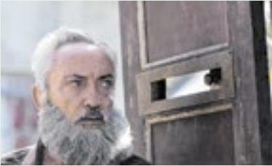
Ator de ‘O Agente Secreto’, alemão Udo Kier morre aos 81