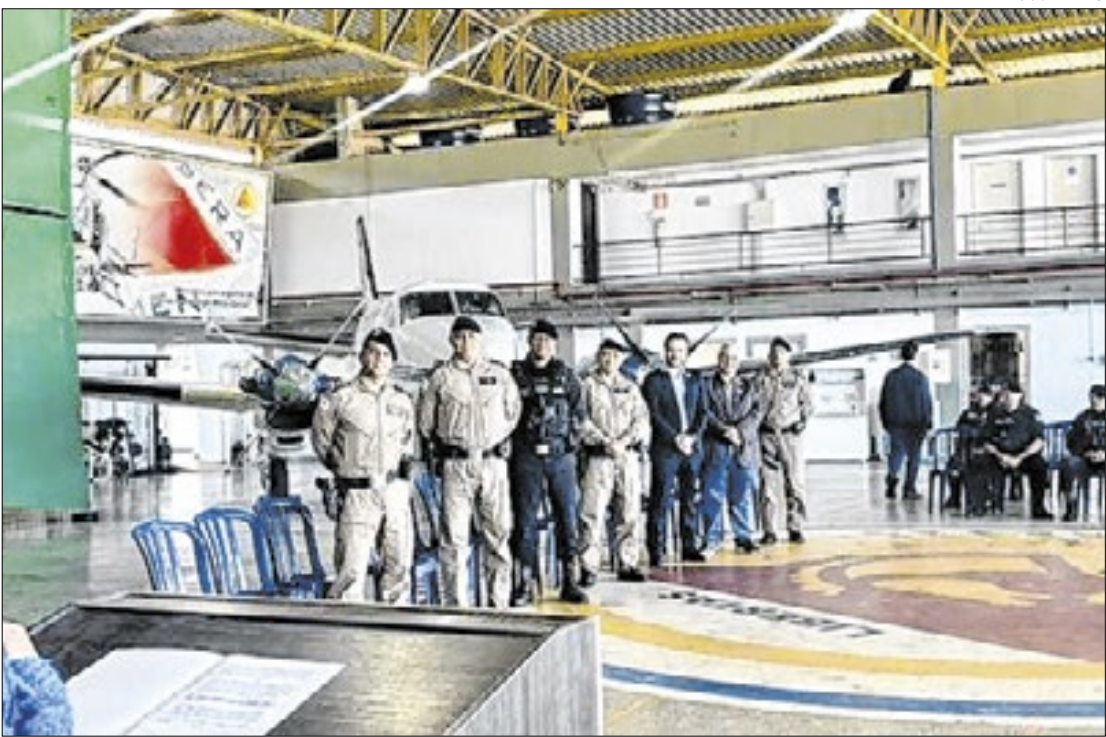
Tecnologia apresentada reforça proteção ambiental

Investimentos incluem novo caminhão de abastecimento