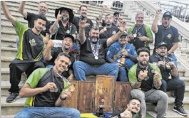
O Brasil venceu a competição pela primeira vez, superando 62 equipes de mais de 40 países

Mas o que realmente chamou a atenção dos jurados foi a identidade brasileira impressa em cada prato. A equipe apostou em técnicas autênticas e ingredientes nativos, como as baunilhas do cerrado, levando à mesa sabores que traduzem a biodiversidade e a