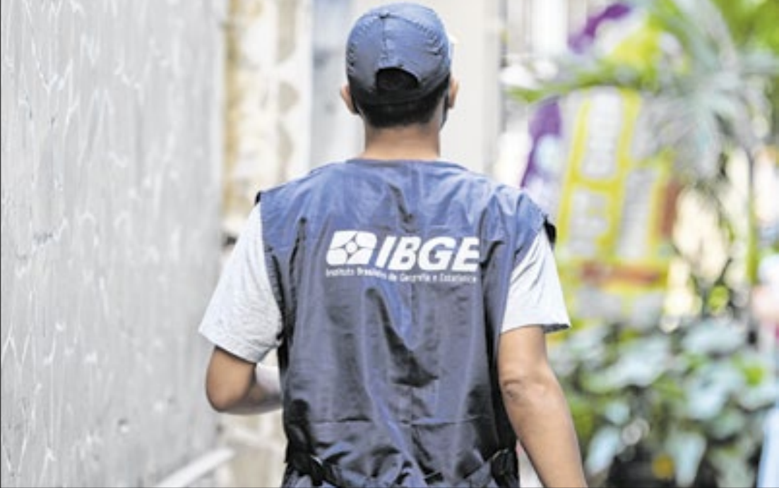
Um em cada cinco domicílios tem apenas um morador, aponta pesquisa do IBGE

A aplicação será em dois turnos, possibilitando a participação dos candidatos nas provas das duas funções disponíveis no concurso: Agente de Pesquisas e Mapeamento (APM) e Supervisor de Coleta e Qualidade (SCQ). Pela manhã, será aplicada a prova para a função de APM e, à tarde, para