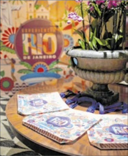
Promoção reforçou o posicionamento do Rio como destino competitivo na Europa

A ação na Itália integra uma agenda internacional robusta liderada pela Setur-RJ, que este ano incluiu ações em mercados estratégicos como Canadá, Estados Unidos, China e Emirados Árabes, consolidando a presença global do destino Rio de Janeiro.