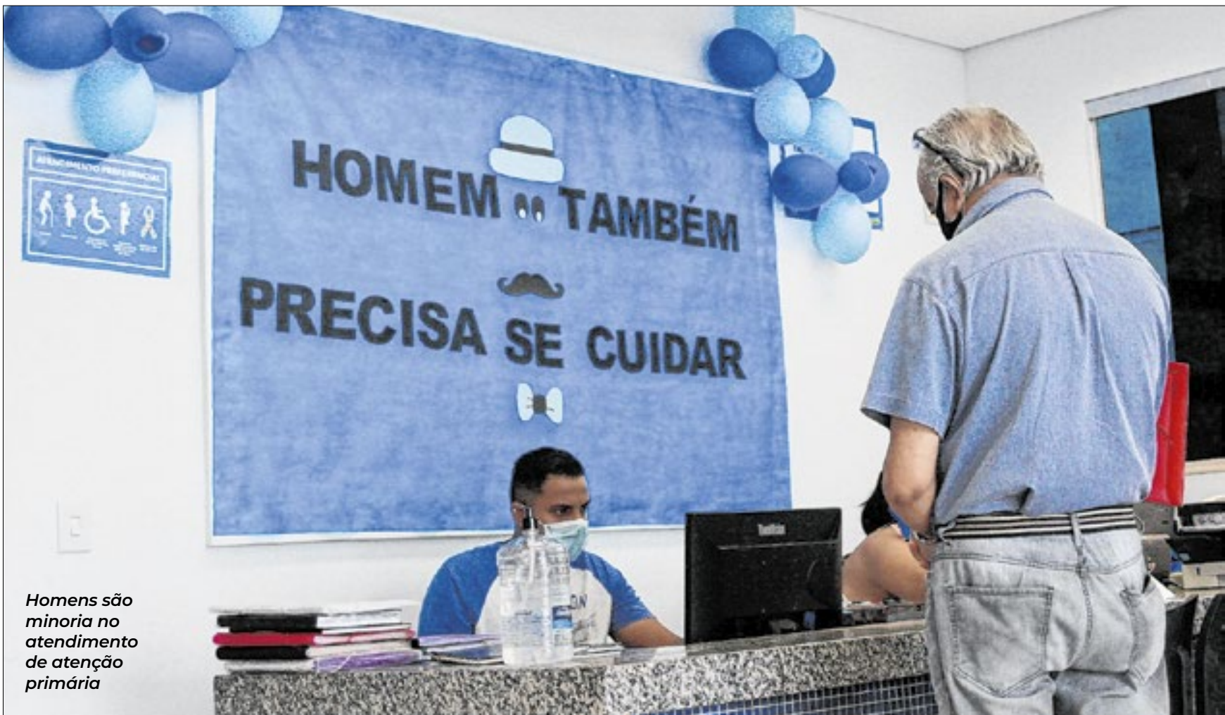
Homens são minoria no atendimento de atenção primária

“Diferente das mulheres, que, culturalmente, são educadas para a prevenção e o autocuidado, muitos homens desenvolvem o que chamamos de Alexitimia Normativa: uma dificuldade aprendida de identificar e expressar emoções e sensações físicas”, pontuou a psicóloga.