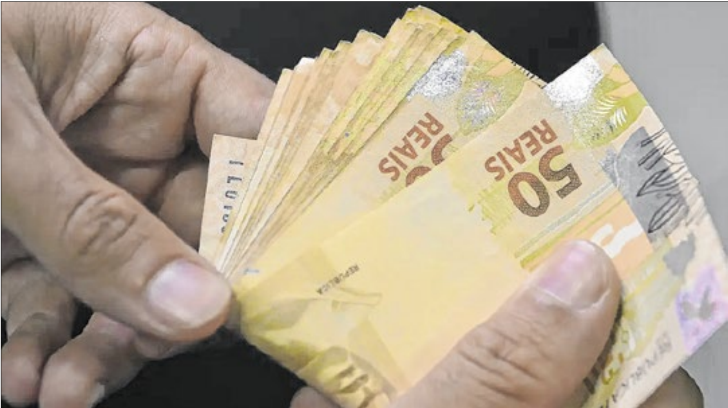
Somente seridores e aposentados que se aposentaram após meio do ano terão direito ao pagamento do 13º