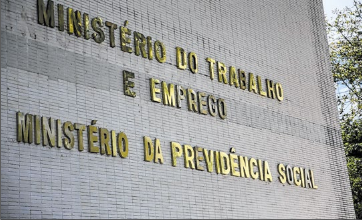
Ministério do Trabalho e Emprego atualiza norma