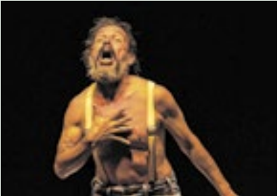
A premiada ‘A Descoberta das Américas’ em única apresentação