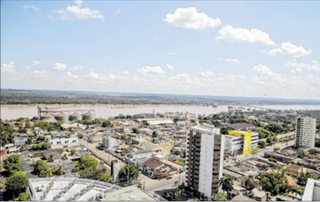
Dados mostram avanço contínuo de Rondônia e Tocantins no mercado de trabalho

tou mudanças que reduziram etapas para iniciar operações comerciais, uma política de apoio a unidades de menor porte e estímulo à participação de negócios locais em mercados externos, além de investimentos em capacitação gratuita em áreas com maior procura.