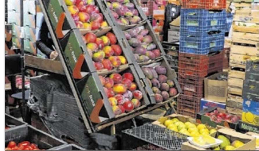
Frutas e legumes da Ceasa, Campinas.