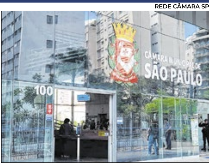
Fachada da Câmara Municipal de São Paulo

Aberturas até o fim de setembro chegaram a 130.967