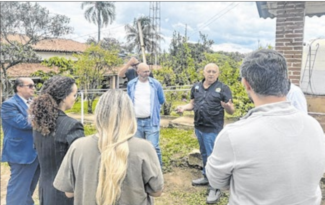
Chefe da fiscalização afirmou que vai acompanhar a situação salarial dos funcionários

Fiscais do Ministério do Trabalho de Sorocaba e região realizaram, na manhã desta segunda-feira (24), uma operação no canteiro de obras do Cacau Park, em Itu, para verificar o cumprimento das Normas Regulamentadoras (NRs). A ação contou com apoio da Polícia Federal (PF) e resultou na notificação da empresa responsável pelo empreendimento, que deverá apresentar documentos e comprovar adequações exigidas pela legislação trabalhista.