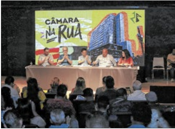
Câmara na Rua esteve no CEU Paraisópolis