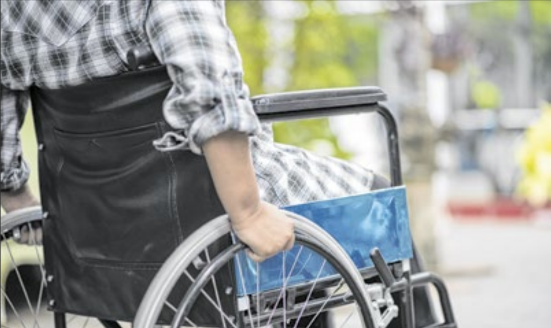
A edição do “Inclusão em Pauta” reuniu lideranças para ampliar políticas de acessibilidade

do encontro foi o Polo de Empregabilidade Inclusiva (PEI), que integra o Programa Meu Emprego Inclusivo. Ele oferece qualificação profissional e empreendedora, análise de perfil, laudo de funcionalidade e encaminhamento para vagas, além de apoio às empresas na contratação de trabalhadores com deficiência.