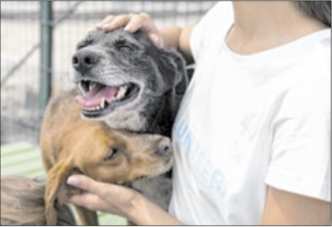
Todos os pets disponíveis estão vacinados e cuidados