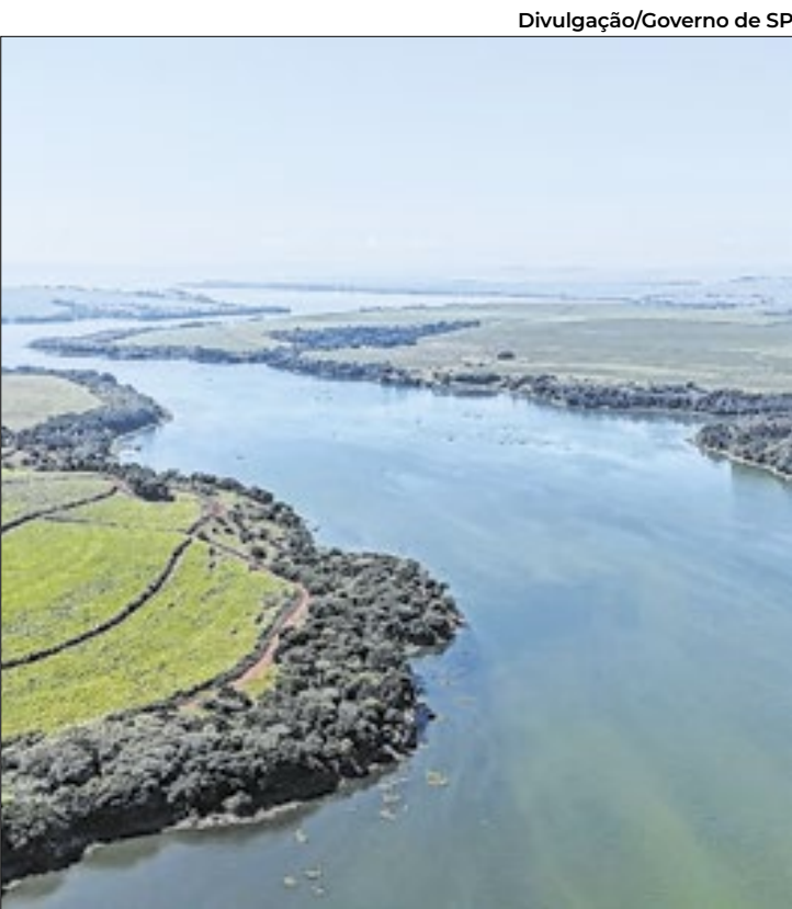
Iniciativa financiará contratação de estudos e subsídios.