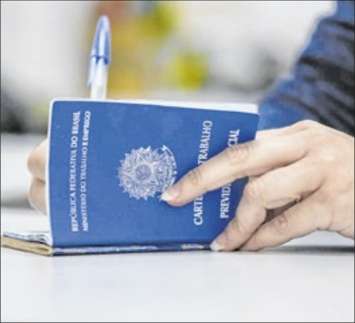
Vagas de emprego oferecidas nas unidades do Cate

entre R$ 1.518 e R$ 2.140. No setor de comércio são mais de 400 oportunidades para atendentes em mercados, lanchonetes, lojas e outros tipos de estabelecimentos comerciais.