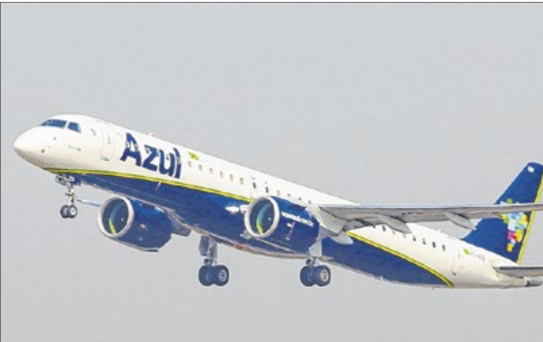
Voos adicionais foram planejados para destinos turísticos

Já de 7 de janeiro a 28 de fevereiro, a Azul vai ampliar a malha aérea doméstica ao aumentar as frequências de voos para Recife (PE), Vitória (ES), Manaus AM), Brasília (DF), Fortaleza (CE) e Salvador (BA). Serão mais de 615 voos, entre partidas e chegadas, e cerca de 98 mil assentos nas decolagens e pousos extras. De acordo com