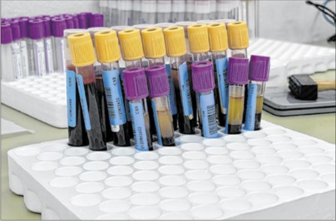
A iniciativa tem o objetivo de agradecer e reforçar a importância da doação regular