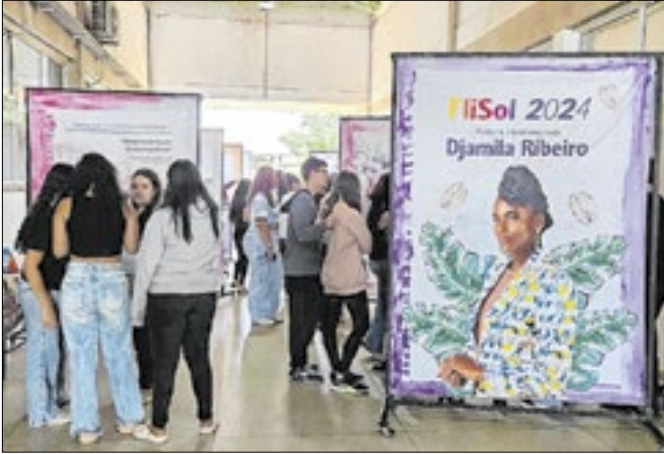
A proposta visa estimular a leitura e reflexão

O IFSP - Instituto Federal de São Paulo, campus Matão, recebe até 29 de novembro a exposição dedicada à obra de Djamila Ribeiro, autora homenageada pela FliSol em 2024. A mostra faz parte da programação da FliSol – Festa Literária da Morada do Sol, que neste ano ampliou a sua presença regional e estabeleceu diálogo com instituições de ensino parceiras. A exposição apresenta um recorte da trajetória intelectual de Djamila, filósofa, escri-