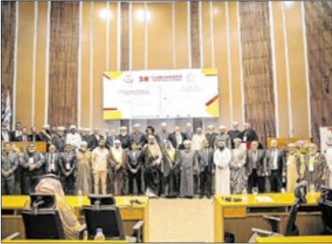
Reunião destacou a comunidade árabe muçulmana.

Letícia Teixeira/GNO Marketing e Publicidade