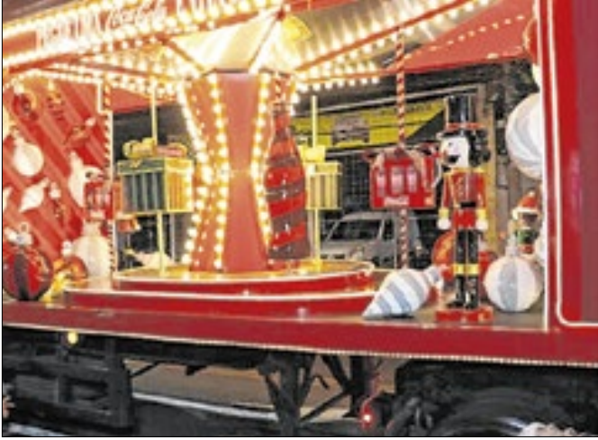
Evento reuniu famílias suzanenses em clima natalino.

A Caravana da Coca-Cola reuniu cerca de 20 mil pessoas em Suzano na noite de sexta-feira (21), em trajeto de 11,8 km que passou por diversos bairros e pelo centro comercial da cidade. O comboio, formado por cinco caminhões iluminados, apresentou atrações temáticas como “Carrossel Iluminado”, “Papai Noel e Mamãe Noel” e painéis de LED, marcando o início das celebrações de fim de ano. O percurso começou às 21h40 na rua