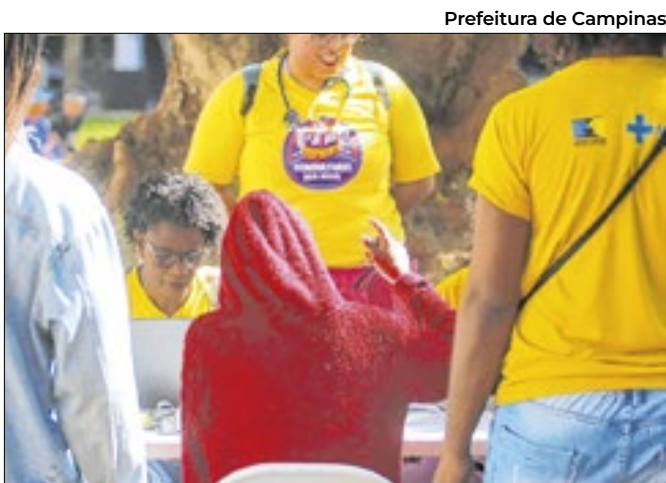
Prefeitura de Campinas SOS Rua durante abordagem em Campinas (SP)

de Ciências Médicas da Unicamp e integra a mobilização nacional coordenada pelo governo federal em parceria com estados e municípios. Em Campinas, a iniciativa é organizada pela Secretaria Municipal de Políticas para as Mulheres, que desde 17 de novembro já realiza atividades de sensibilização e formação sobre o tema.