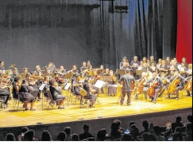
Evento marca a dedicação dos alunos ao longo de 2025