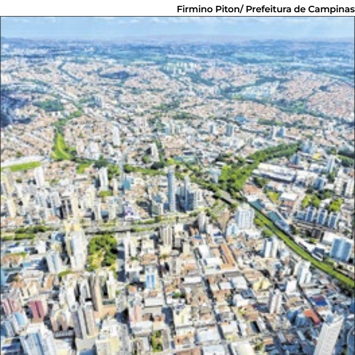
Guias já estão disponíveis nos canais de atendimento

A guia para pagamento do valor devido e a solicitação de parcelamento estão disponíveis no Ambiente Exclusivo Finanças, em https://campinas.sp.gov.br/servico/ambiente-exclusivo-financas ; o acesso é feito via e-CNPJ. Os contribuintes também podem acessar guia para pagamento no Chat de Finança ( https://portal.campinas.sp.gov.br/servico/chat-secretaria-de-financas ).