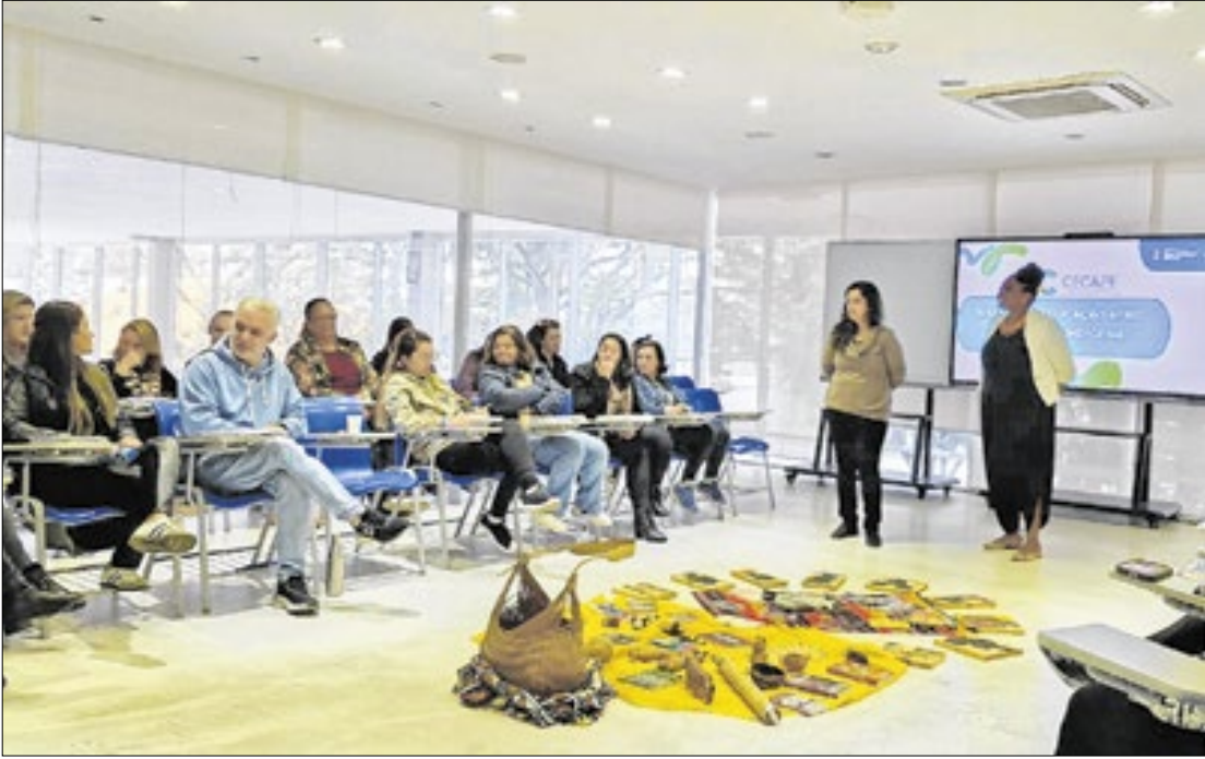
Cursos têm certificação e contam com a presença crescente dos educadores da rede.