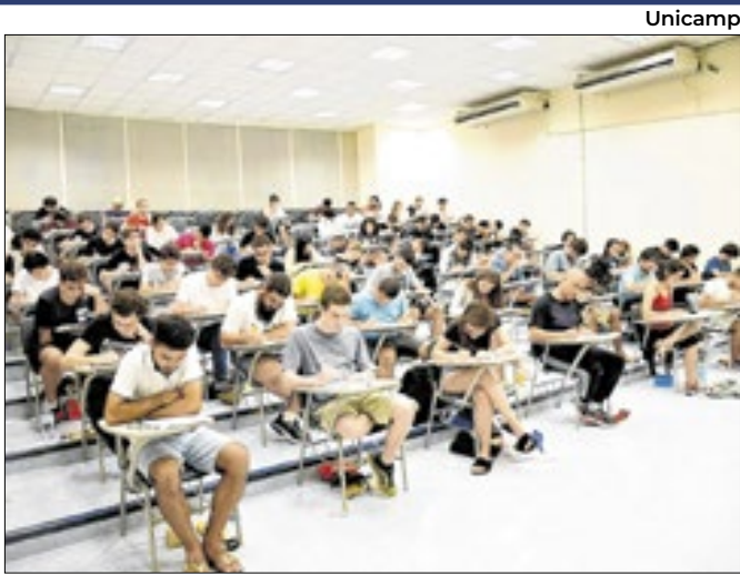
Unicamp Até cidade para aplicação da prova pode mudar