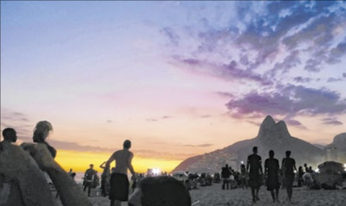
O litoral carioca segue sendo a preferência dos turistas brasileiros e estrangeiros

Para reforçar a importância econômica do setor, a Embratur instalou o “turismôme-