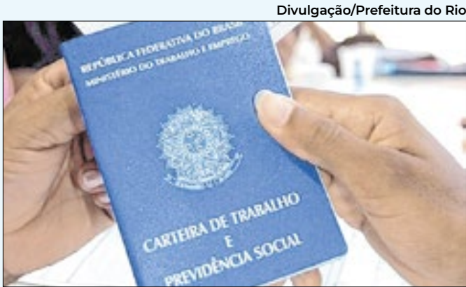
Há oportunidades temporárias, fixas e estágios no Rio

negros cariocas têm nível superior, o dobro da média nacional. Na gestão, o programa Líderes Cariocas triplicou a presença negra. Os dados mostram que investir em educação e oportunidades gera melhoria consistente nas condições de vida. O município deve ampliar as iniciativas.