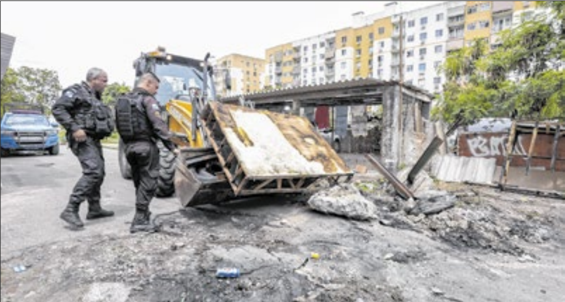
Operação Barricada Zero, na Cidade de Deus (CDD), Zona Sudoeste do Rio de Janeiro

A operação começou na Cidade de Deus e se estendeu por São Gonçalo (Jardim Catarina), Duque de Caxias (Manguieirinha), Queimados (Caixa D'Água) e Nova Iguaçu (Grão Pará e Dom Bosco). Também houve apreensão de uma estufa de maconha em Jardim Catarina e de drogas enterradas em Queimados. Segundo o governador Cláudio Castro (PL), trata-se de uma estratégia de longo prazo: “A Barricada Zero é um duro golpe contra a ocupação territo-