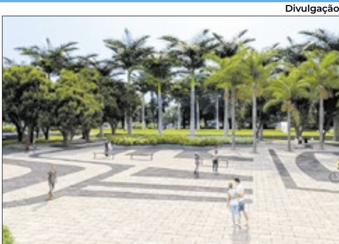
Obras de revitalização já estão em andamento