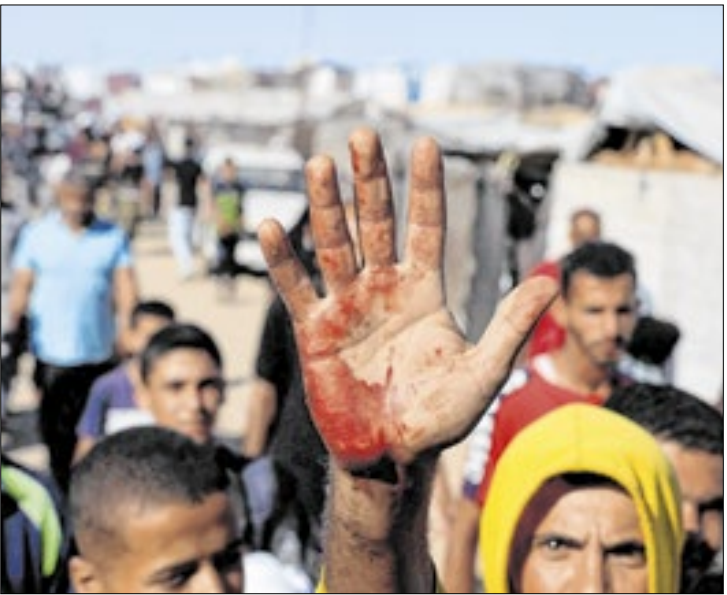
Nem mesmo o cessar-fogo deu fim ao massacre israelense

O Governo da Palestina in-formou que 279 pessoas foram mortas em ataques israelenses na Faixa de Gaza desde o início do cessar-fogo, iniciado em ou-tubro deste ano. Israel não co-mentou as afirmações. Além dos mortos, outros 652 palestinos ficaram feridos. Os números foram divulgados hoje em um comunicado do Gabinete de Imprensa do país e contabilizam violações cometidas até a noite de ontem na região. O órgão acusa o Exército de Israel de 113 disparos diretos contra civis. De acordo com as autoridades, os militares teriam atacado diretamente cidadãos, casas, bairros residenciais e ten-das de deslocados. Outras mortes teriam ocor-rido em outros 174 ataques e bombardeios israelenses. Além disso, a pasta afirma que 17 in-cursões foram realizadas por veículos militares em áreas re-sidenciais e agrícolas, enquan-to houve também 85 demoli-ções de casas e instalações civis durante esse período. Palestina diz que esse “com-portamento agressivo” deve frustrar qualquer esforço inter-