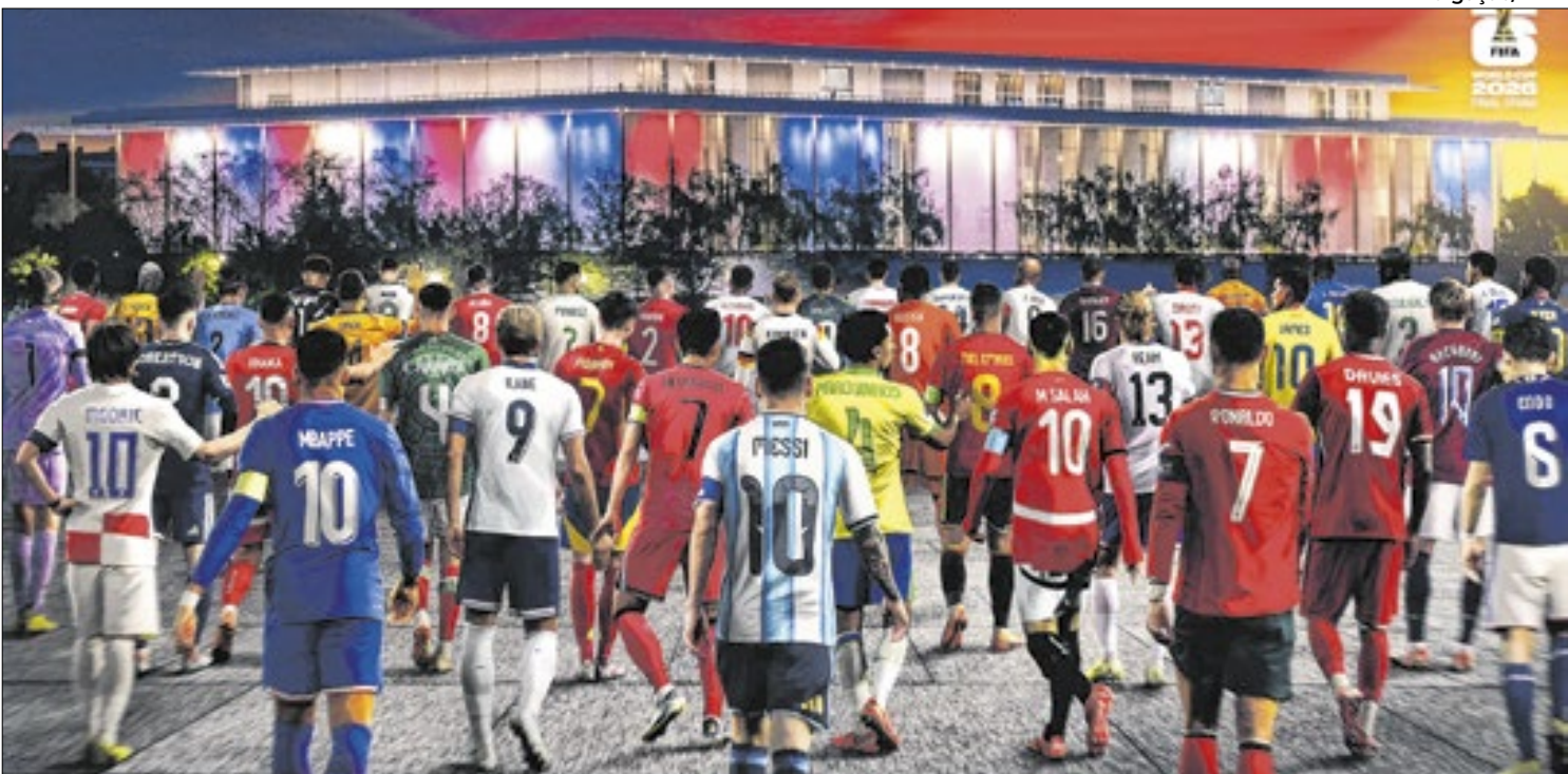
Já foram confirmadas 42 das 48 seleções que vão disputar a Copa do Mundo FIFA 2026, nos EUA, Canadá e México

De saída? Com contrato até julho de 2026, o zagueiro Thia-go Silva quer voltar para a Europa ao fim do contra-to com o Fluminense. Ele gostaria de voltar a ficar perto da família, que mora no Velho Continente.