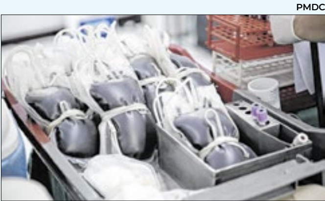
Hemorio Caxias receberá doadores em horário especial

que os homens deixem o preconceito de lado e coloquem a saúde em primeiro lugar. Magé tem avançado na atenção básica e na oferta de serviços, e ações como o ‘Toque Aqui’ aproximam ainda mais a Prefeitura da nossa gente, levando informação e cuidado para quem mais precisa”.