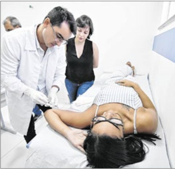
Método está disponível desde terça (18) em Nova Iguaçu

“Minha rotina é corrida e nem sempre consigo tomar o remédio todos os dias. Esse método me deixa mais segura e me dá liberdade para seguir meus planos. Mais pra frente, quem sabe, posso pensar em um segundo filho”, contou.