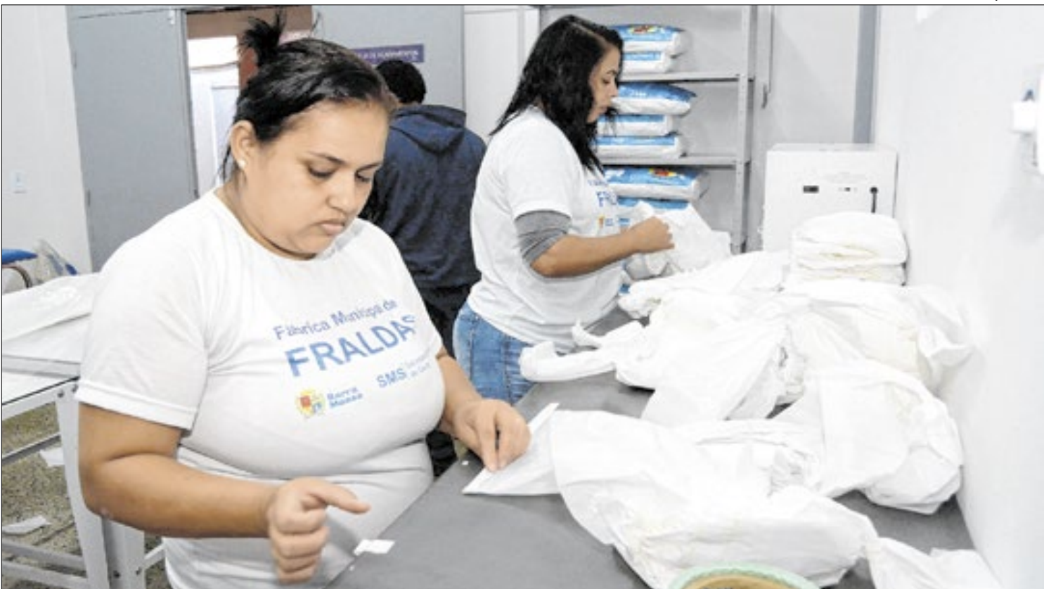
O levantamento aponta que o Brasil tinha 10 milhões de empresas e organizações

Levantamento do IBGE foi realizado até 2023 e aponta mais dados