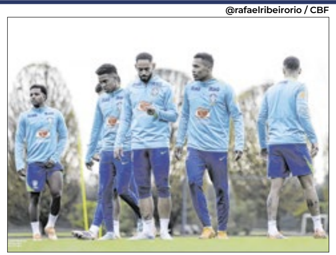
Seleção Brasileira concluiu treinos para o amistoso

SELEÇÃO - A Seleção Brasileira se despediu na quinta (13) do CT do Arsenal, onde treinou por quatro dias, na preparação para o duelo contra Senegal, no sábado (15), em Londres. O presidente da CBF, Samir Xaud, marcou presença no treino desta quinta, pela primeira vez na semana. Ele chegou do Brasil na quarta (12). O atacante Gabriel Jesus, do Arsenal, também assistiu a atividade, ao lado de membros da comissão técnica. Em breve conversa com o presidente da CBF, testemunhada