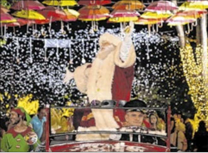
O Papai Noel receberá a chave da cidade