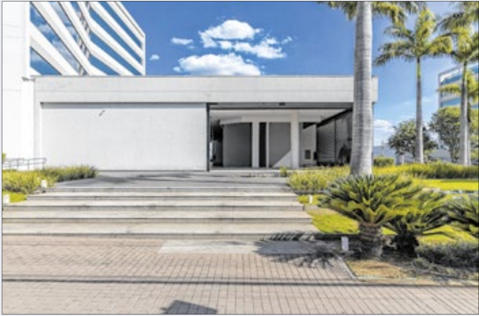
Fachada do prédio que vai receber o Campinas Decor 2026

Criada em 1996, mostra consolidou-se como a principal de arquitetura, decoração e paisagismo do Interior de SP. Fortaleceu o mercado local e ganhou projeção nacional.