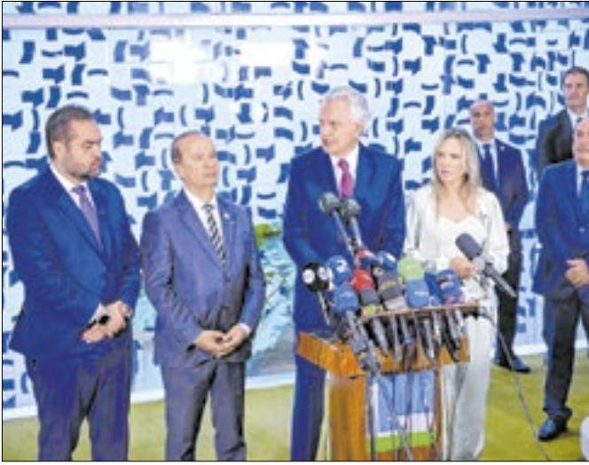
Governadores se sentiram atropelados por Derrite