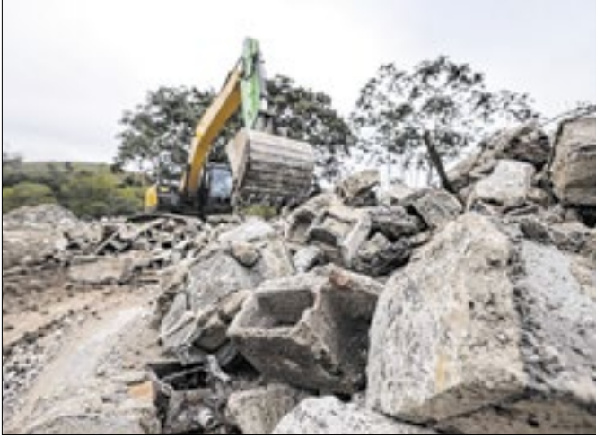
Equipamento transforma entulhos em cascalho.

A Prefeitura de Guararema deu início a uma nova etapa na limpeza de um terreno localizado na avenida Antonio Teixeira Muniz, no bairro Ipiranga, próximo à entrada da cidade. O local, adquirido pelo município e anteriormente ocupado por um prédio que foi demolido, passa agora por um processo de reaproveitamento dos resíduos gerados pela demolição. O material resultante está sendo transformado em cascalho por meio da Usi-