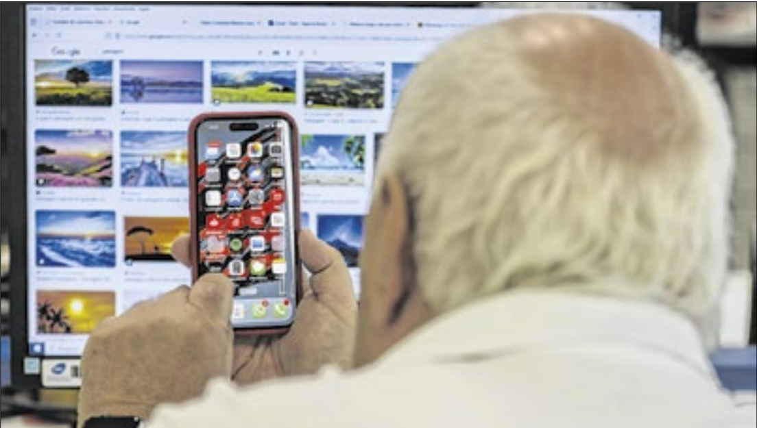
Além das inovações para PCDs, a nova versão traz atualizações para os demais usuários

“Além das inovações para PCDs, a nova versão também traz atualizações para os demais usuários. Essas passam pela relocalização de informações para áreas mais intuitivas - como a mudança da área de dispositivos autorizados para a seção de privacidade - até a incorporação de funcionalidades como alteração