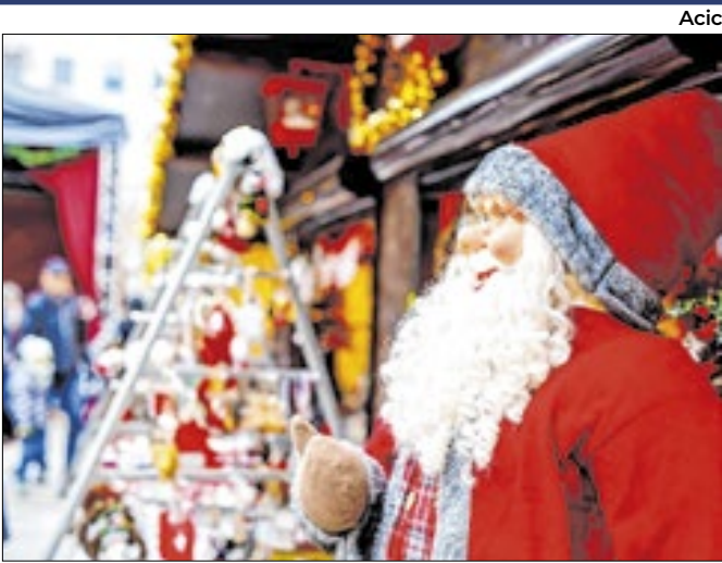
Encontro é gratuito e oferece certificado