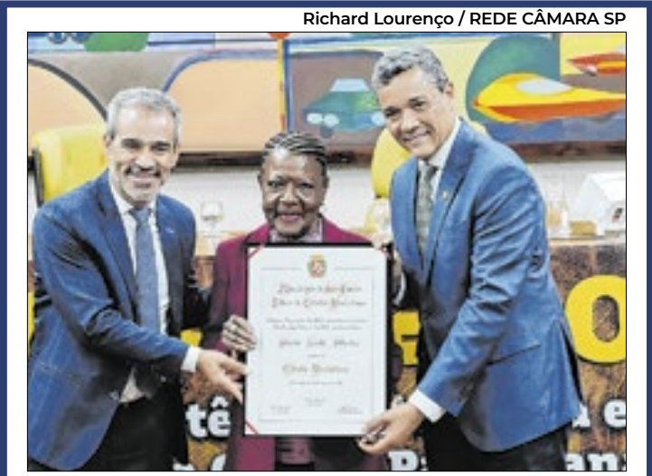
Cantora e compositora nasceu no Rio de Janeiro