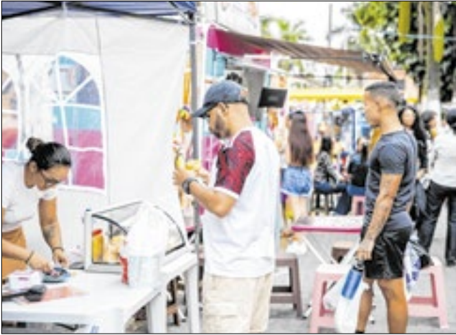
A proposta é incentivar e movimentar o comércio local.

A Feira Gastronômica de Ferraz de Vasconcelos realiza, nesta sexta-feira (14), a edição especial Black Food, em alusão à Black Friday. O evento acontece no Calçadão da Avenida XV de Novembro, a partir das 13h, com pelo menos 15 expositores oferecendo pratos variados, como comidas japonesa, italiana, lanches, doces, petiscos, pastéis, geléias e chopp, com promoções especiais. O objetivo é movimentar o co-