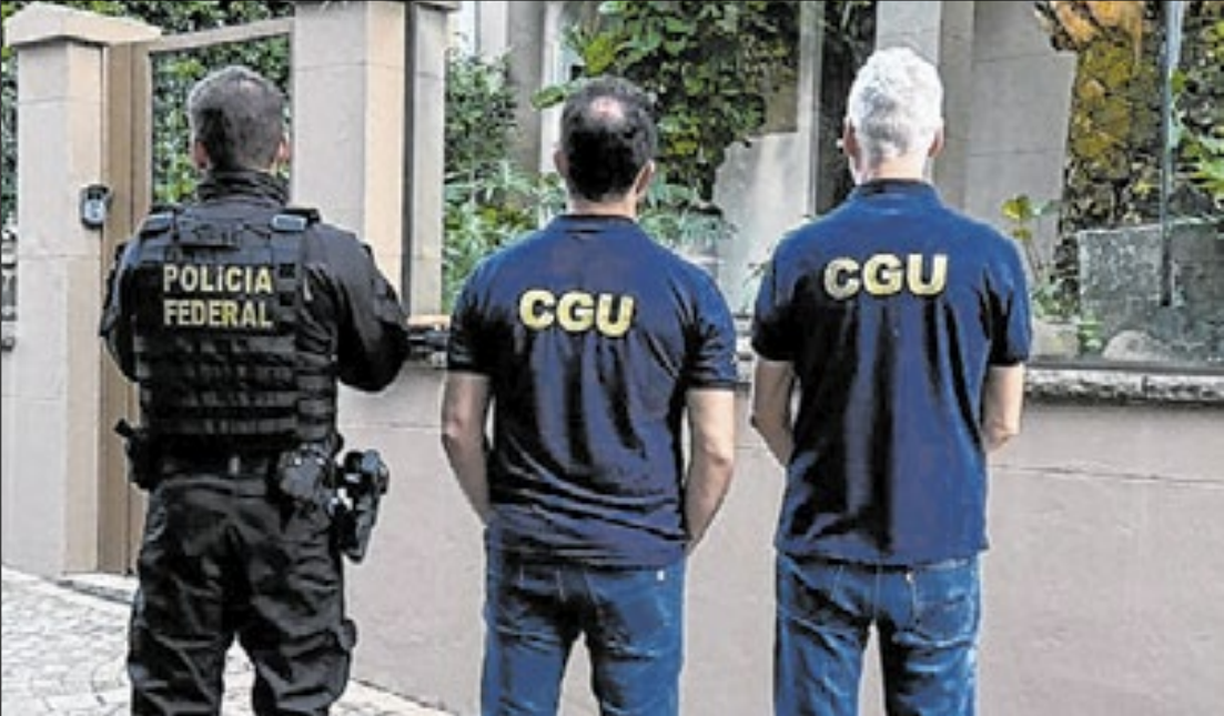
Agentes cumpriram 19 mandados de busca e três de prisão na Região Campinas

A Região Metropolitana de Campinas (RMC) virou palco das novas fases da Operação Coffee Break, da Polícia Federal, que apura um suposto esquema de fraudes em licitações da educação. Nesta semana, a PF cumpriu 19 mandados de busca e apreensão e três prisões preventivas em Hortolândia, Sumaré, Limeira e Morugaba.