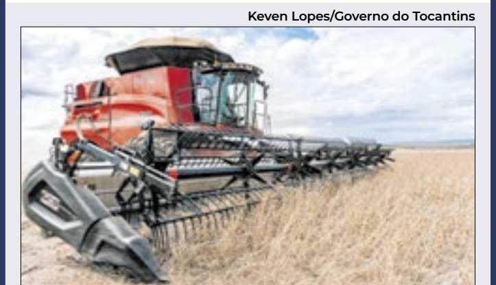
Um aumento registrado em 2025 ao repetirá em 2026

A safra brasileira de grãos, cereais e leguminosas deve somar 332,7 milhões de toneladas em 2026. Esse resultado representa recuo de 3,7% em comparação a este ano, que marca um recorde. As estimativas foram divulgadas nesta quinta-feira (13) pelo Instituto Brasileiro de Geografia e