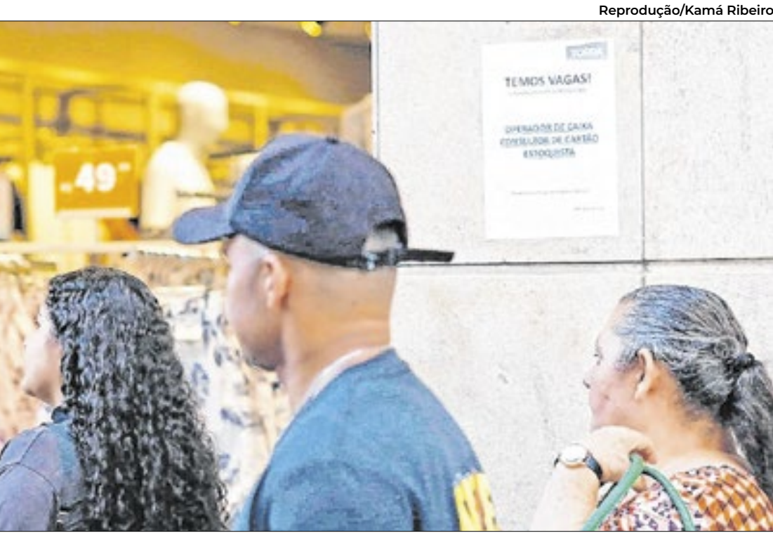
O total chegou a 1,237 milhão de consumidores com contas em atraso

A iniciativa é uma parceria entre o Fundo Social de São Paulo e a Prefeitura de Hortolândia, com foco na geração de renda e desenvolvimento social.