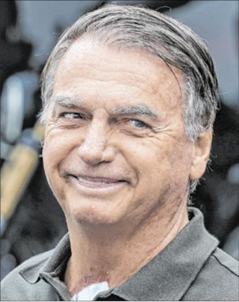
Bolsonaro empataria com Lula em eventual segundo turno