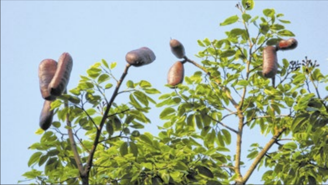
Árvore brasileira jatobá é muito comum no Parque Natural dos Jatobás, em Campinas

A moratória ambiental é uma medida temporária adotada por órgãos ambientais ou conselhos gestores para interromper novas autorizações ou licenciamentos enquanto estudos e planos de manejo não estão concluídos. Na prática, ela funciona como uma pausa obrigatória para evitar que empreendimentos causem danos irreversíveis antes que as regras de preservação estejam definidas. Com a suspensão dos licenciamentos, a Prefeitura fica impedida de liberar obras ou projetos imo-