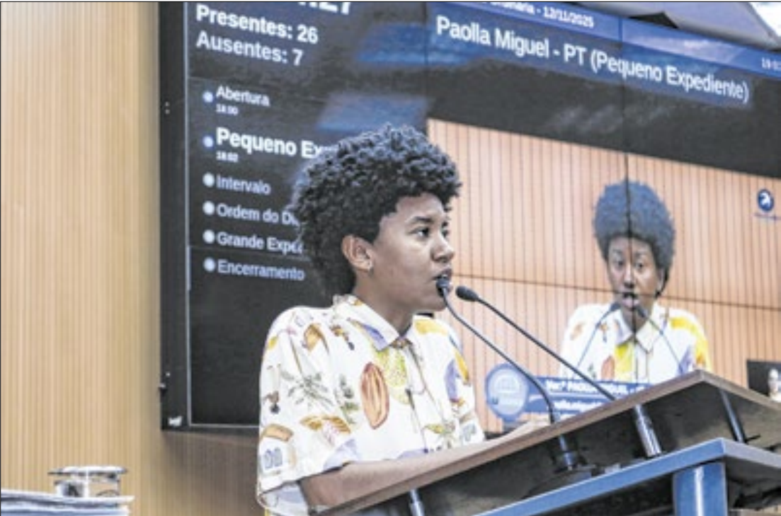
Paolla Miguel (PT-SP) na 70ª Reunião Ordinária da Câmara

estudantes e a gestão escolar, encontram-se: “redução do número de estudantes em sala de aula, fortalecimento da participação da comunidade por meio dos conselhos de escola, melhoria das condições de infraestrutura (laboratórios, bibliotecas, quadras cobertas, auditórios/ teatros), além do cumprimento das diretrizes curriculares nacionais e fim da plataformação”.