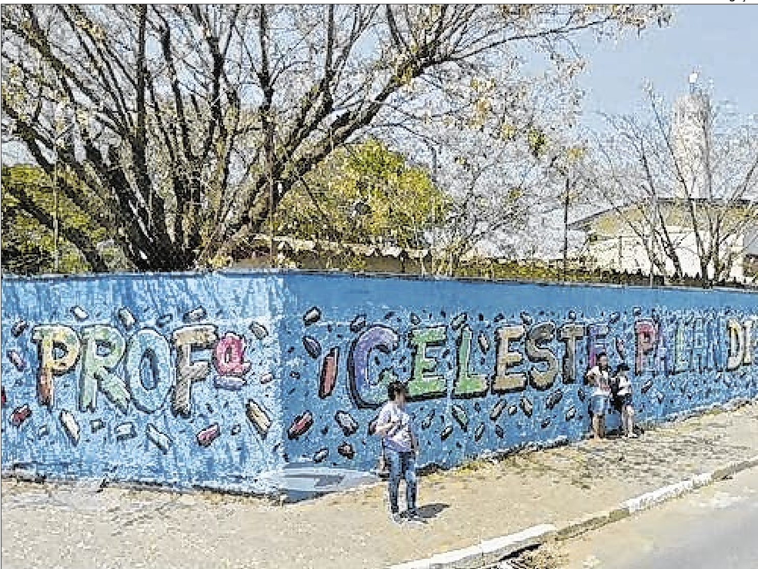
Escola Estadual Professora Celeste Palandi de Mello, em Campinas (SP)