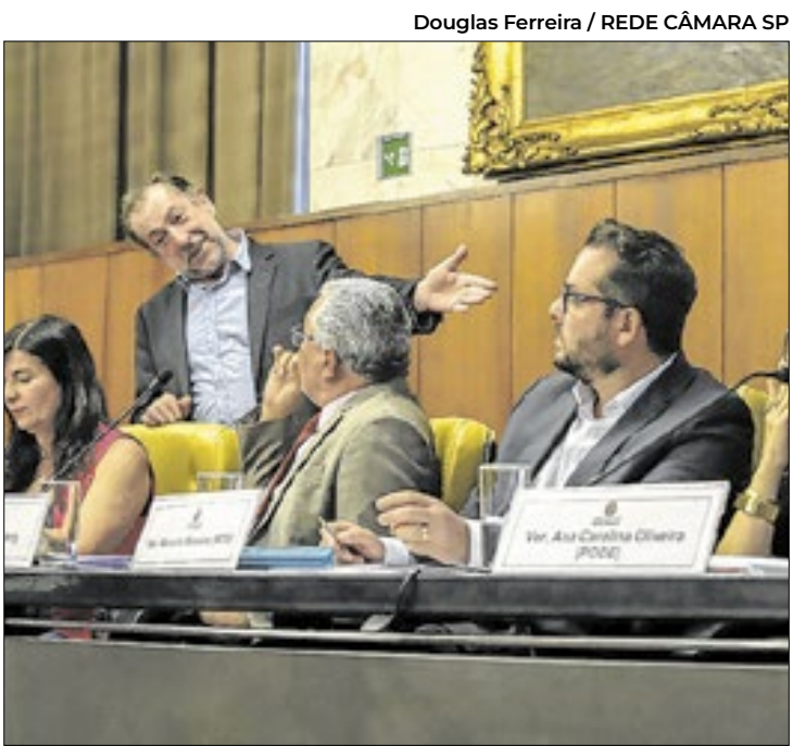
Projeto estima orçamento total de R$ 135,4 bilhões.

A Comissão de Finanças e Orçamento da Câmara Municipal de São Paulo realizou a 6ª Audiência Pública temática do Orçamento municipal de 2026 e do PPA (Plano Plurianual). O debate, que contou com intensa participação popular, abordou as ações e valores destinados das Secretarias de Educação, Esportes e Lazer, Mobilidade Urbana e Transporte, além de CET (Companhia de Engenharia de Tráfego) e SPTrans (São Paulo Transportes S/A). O PL (Projeto de Lei) 1169/2025 – que trata da LOA (Lei Orçamentária Anual) – estima um orçamento total de R$ 135,4 bilhões, valor que engloba todos os gastos e despesas do município para o ano que vem. Este total representa um aumento de 7,79% em relação ao valor atual, de R$ 125,6 bilhões. Já o PL 1168/2025 – referente ao PPA – prevê investimentos de R$ 583,7 bilhões. Os valores podem sofrer alterações durante a tramitação da proposta na Câmara.