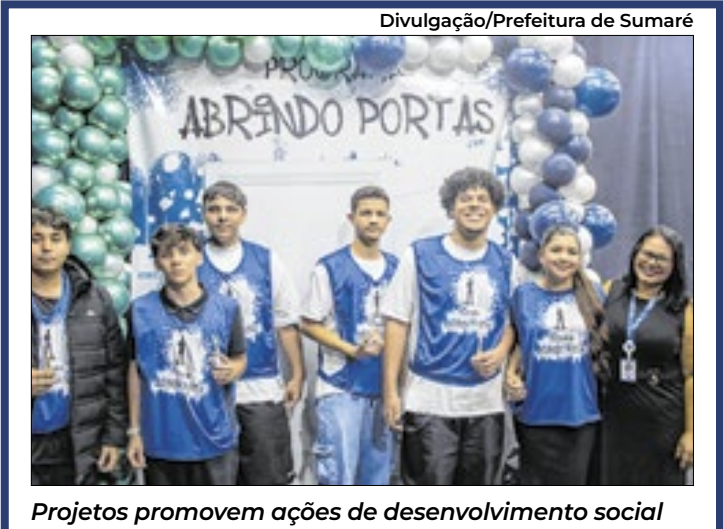
Projetos promovem ações de desenvolvimento social