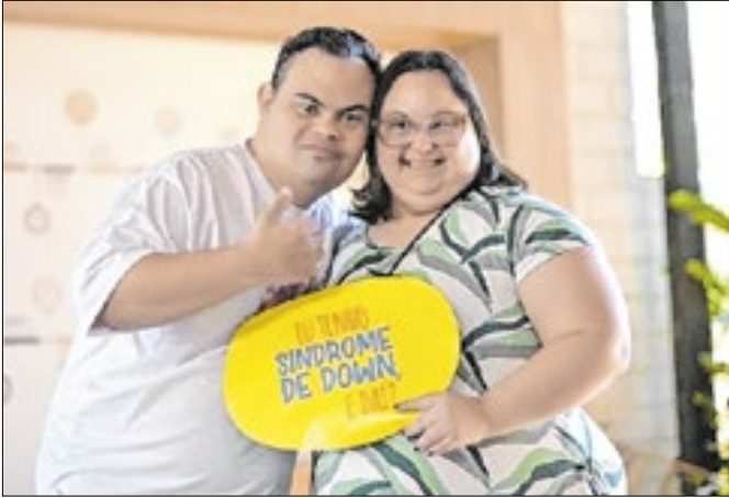
Evento contará com delegações de 19 países