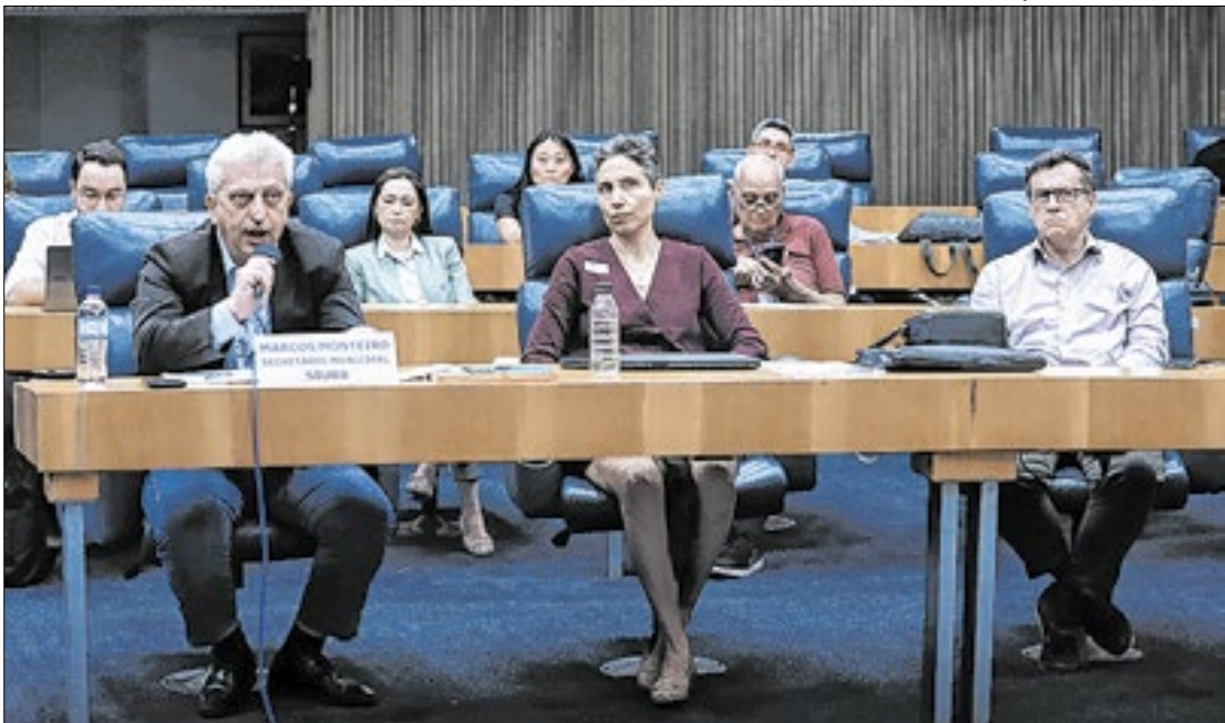
Secretário apresentou projeto de criação de uma barreira de proteção de R$ 32,5 milhões

O secretário fez uma apresentação com o histórico da situação do Jardim Pantanal e falou como a atual gestão tem trabalho na região. Ele também apresentou ações mais recentes de programas da Prefeitura de São Paulo, como o Recupera Pantanal, entre elas, a criação de uma barreira de proteção, orçada em R$ 32,5 milhões, e uma pista de serviços. Segundo o secretário, já estão acontecendo obras de microdrenagem no valor de R$ 60 milhões. Também será feito um atendimento social com 1.400 famílias que serão removidas até outubro do ano que vem. “São cerca de 1.400 famílias que vão ter ou indenização ou um aluguel social e com isso a gente vai resolver em um prazo bem mais curto a situação delas”.