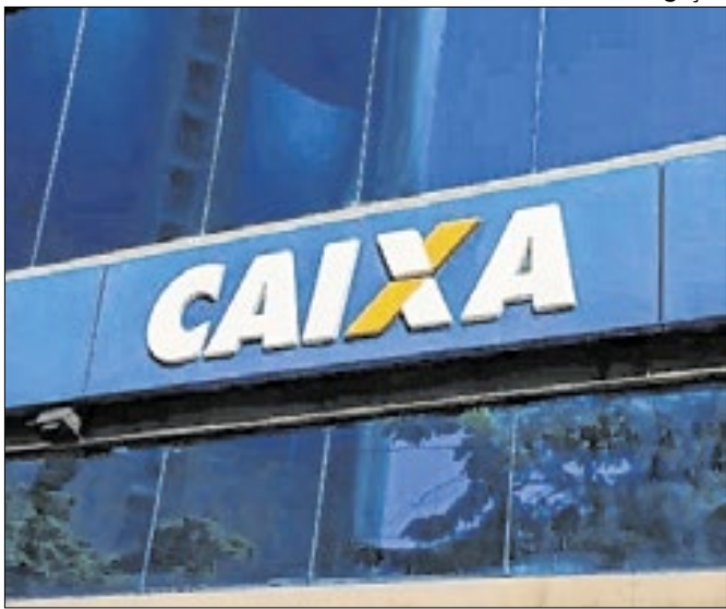
Caixa e INSS suspenderam o seguro prestamista