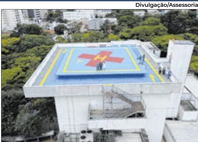
Heliponto do Conjunto Hospitalar recebeu reforma geral.

O heliponto do Conjunto Hospitalar do Mandaqui “Bispa Keila Campos Costa Ferreira”, na zona norte de São Paulo, voltou a operar na segunda-feira (10) após passar por reforma completa. A estrutura será referência para o recebimento de vítimas de acidentes socorridas pelo helicóptero Águia da Polícia Militar nas rodovias Fernão Dias, Dutra e, futuramente, no Rodoadel Norte. As obras incluíram nova pavimentação, melhorias nos acessos, guarda-corpos, pintura, iluminação e equipamentos