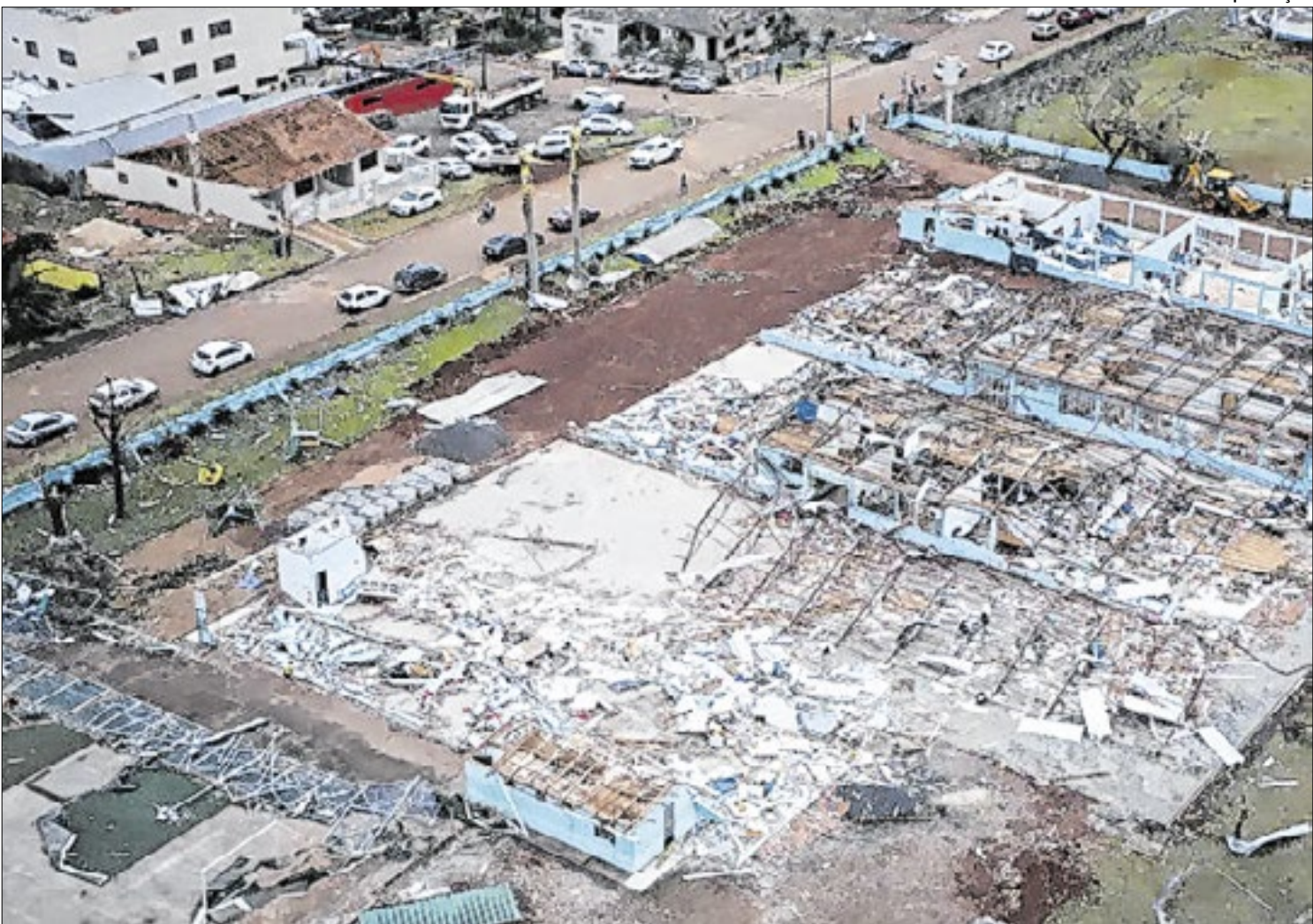
Tornado destruiu municípios do Paraná na semana passada afetando pelo menos 15 mil habitantes