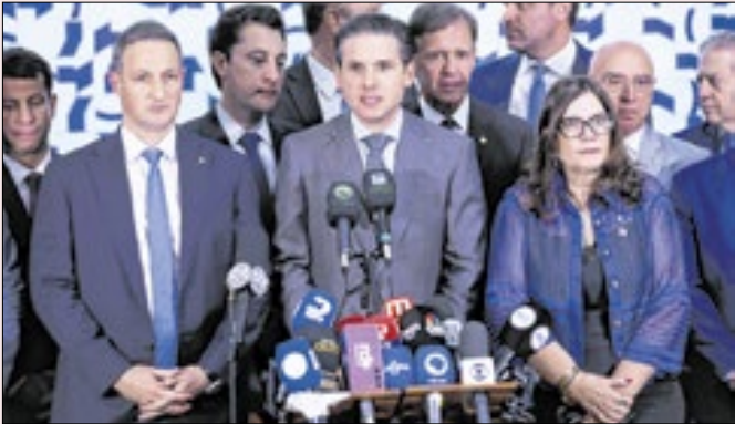
Derrite e Motta tiveram de adiar o projeto