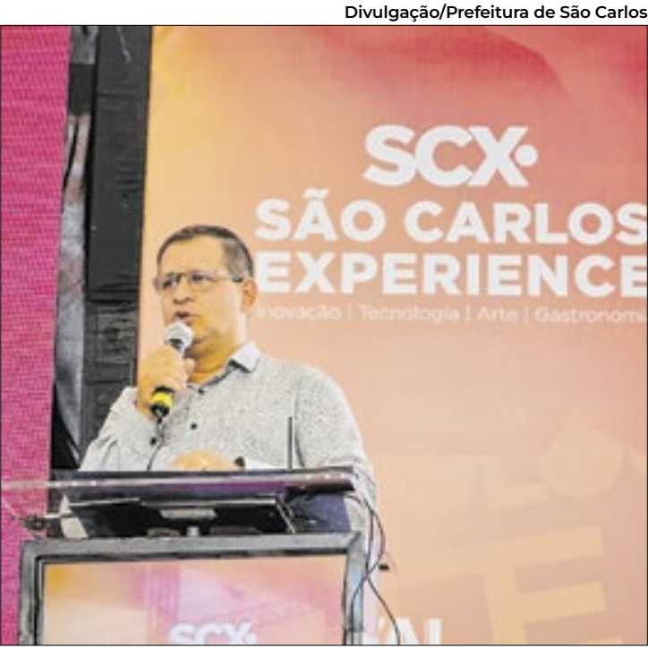
Divulgação/Prefeitura de São Carlos

O vice-prefeito da cidade discursou na abertura do evento