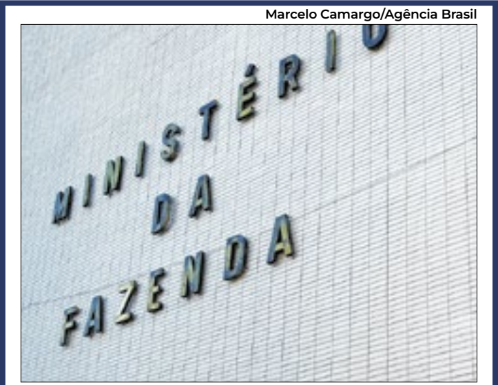
Ministério refez levantamento da projeção da safra

A desaceleração da economia provocada por juros altos surtirá efeitos sobre a atividade econômica brasileira. O Ministério da Fazenda reduziu de 2,3% para 2,2% a projeção de crescimento do Produto Interno Bruto (PIB - soma das riquezas produzidas no país) em 2025. A estimativa foi divulgada nesta quinta-feira (13), em Brasília, no Boletim Macrofiscal da Secretaria de