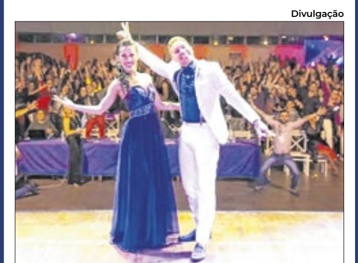
Ingressos na bilheteria do Club Homs, na Av. Paulista

em vida. O vereador destacou as obras criadas por Alaíde Costa. “As composições dela são essenciais para a música brasileira e para os paulistanos. Nada mais justo que a gente dê este Título de Cidadã Paulistana a ela”. Alaíde Costa Silveira nasceu em 8 de dezembro de 1935, no bairro do Méier, no Rio de Janeiro. O gosto pela música começou cedo, ainda criança. A homenageada participou de programas de calouros e fez parcerias importantes com Vinícius de Moraes.