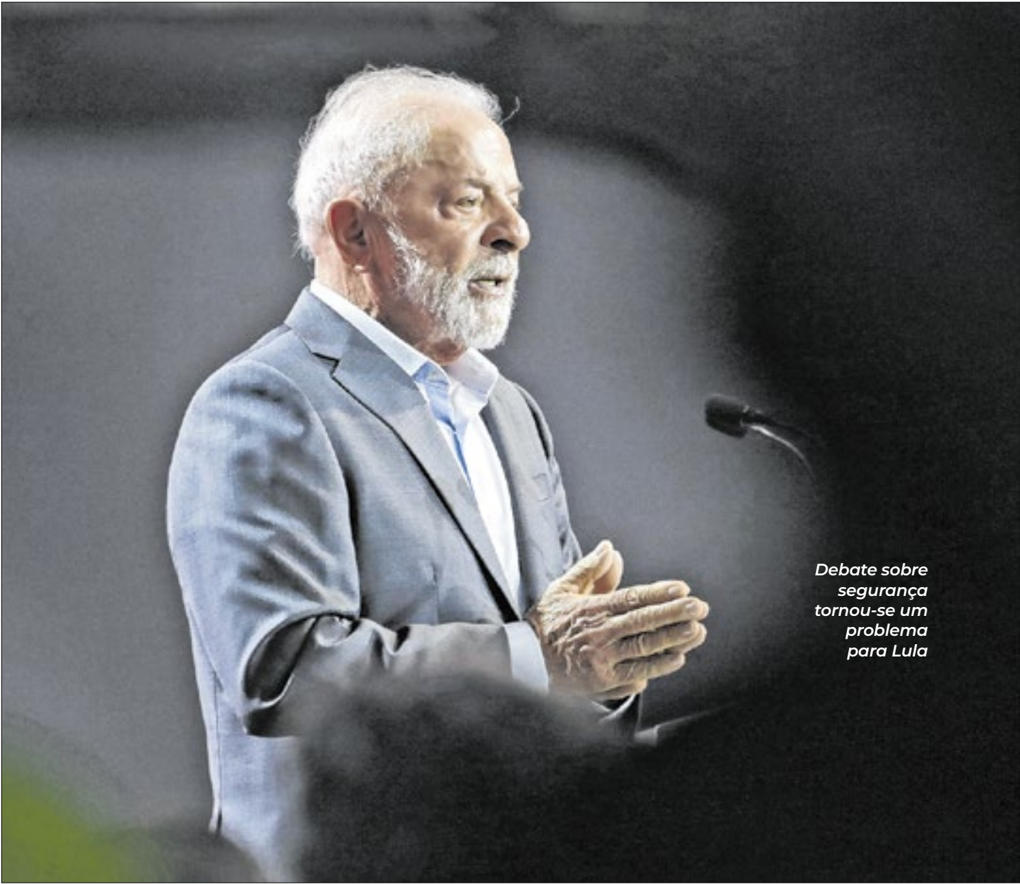
Debate sobre segurança tornou-se um problema para Lula