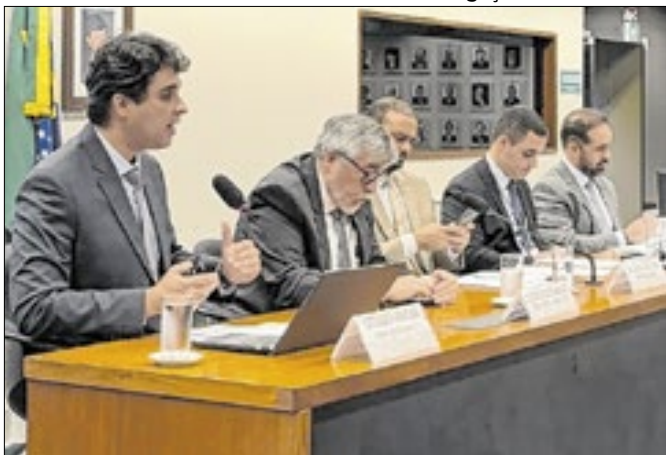
Assessor apresenta as propostas de ajustes ao PLP.

Em audiência pública na Câmara dos Deputados, a FecomercioSP manifestou apoio ao Projeto de Lei Complementar 125/2022, que propõe a criação do Código de Defesa do Contribuinte Nacional, mas apresentou sugestões de ajustes ao texto. A entidade defende a criação do Conselho Nacional de Defesa do Contribuinte, órgão consultivo e paritário que mediará o diálogo entre contribuintes e a administração tributária, inspirado na experiência da Lei Complementar