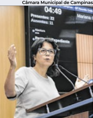
Câmara Municipal de Campinas

PL adequa guarda de menores sob tutela de servidores públicos de Campinas (SP) ao padrão federal ditado pelo STF