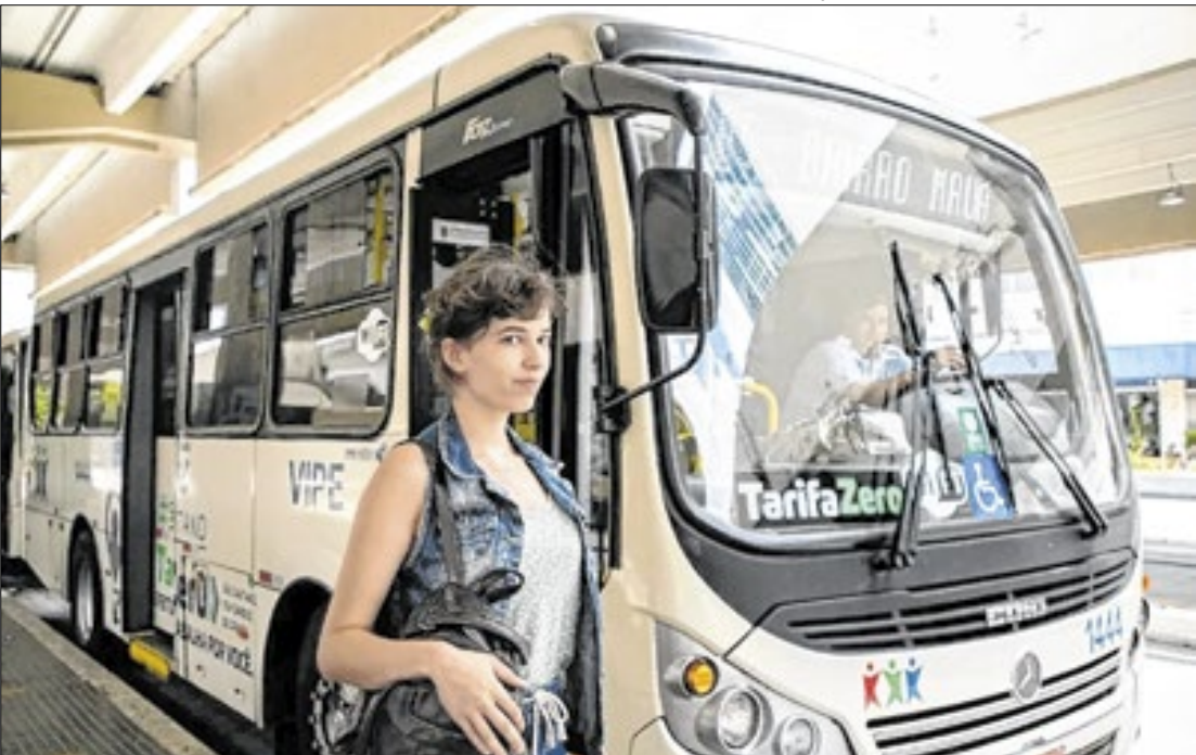
Ônibus em operação em município paulista que adotou a Tarifa Zero.

Atualmente, 45 municípios paulistas já adotam algum modelo de gratuidade no transporte coletivo. Entre eles, 42 oferecem a tarifa zero de forma universal, permitindo que os usuários utilizem os ônibus gratuitamente em qualquer dia da semana. Em três cidades, a gratuidade é parcial, funcionando apenas em dias específicos ou nos finais de semana, como ocorre na capital paulista, onde o transporte coletivo é gratuito aos domingos. O seminário contará com a participação de representantes de cidades que já implementaram a tarifa zero, incluindo Itapetininga, Penápolis, Pirapora do Bom Jesus, São Caetano do Sul e Maricá (RJ). Eles apresentarão experiências práticas de implantação, estratégias de financiamento, custos operacionais e