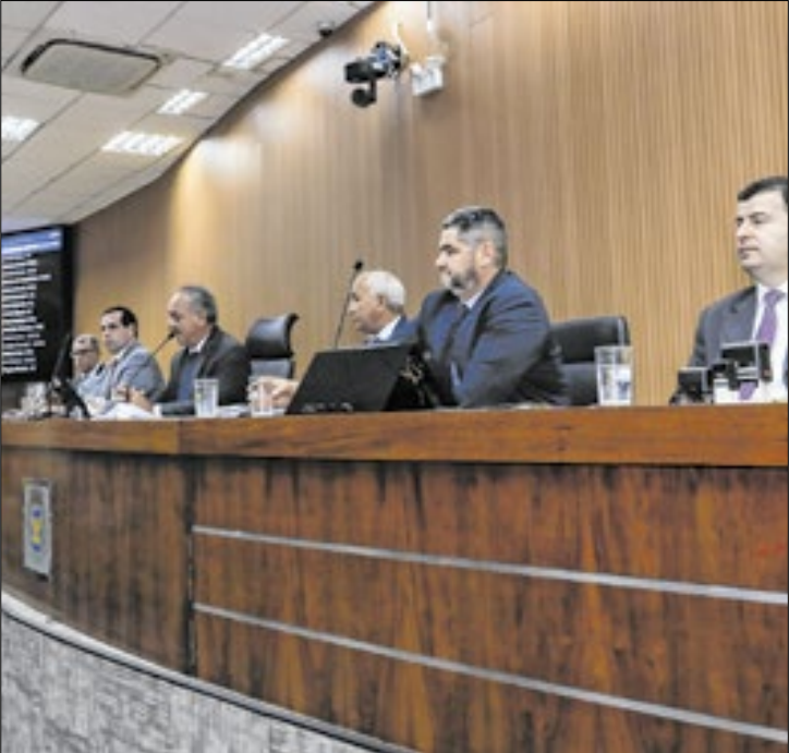
Mesa da Câmara em reunião ordinária da Casa