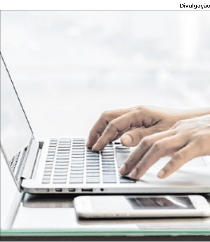
Transferências de recursos já somam R$ 38,73 bilhões.

manalmente, sempre até o segundo dia útil de cada semana, conforme estabelece a Lei Complementar nº 63, de 1990. Os valores podem ser consultados no portal da Sefaz-SP, no