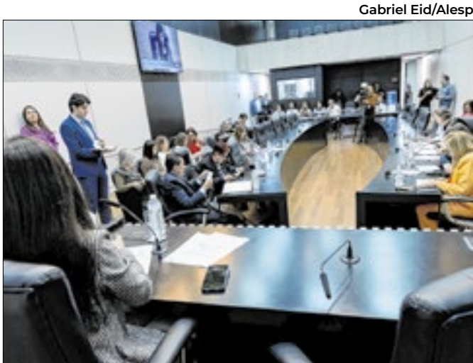
Deputados da Comissão da Mulher durante reunião.

da população e melhorar a infraestrutura para o escoamento da produção agropecuária, especialmente da agricultura familiar. A proposta também busca aumentar a segurança e a eficiência no transporte em regiões do interior. Caso seja aprovada, a medida garantirá recursos ao Departamento de Estradas de Rodagem (DER).