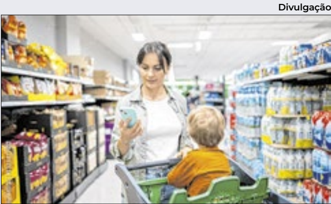
Divulgação Dia das Crianças impulsiona o movimento no varejo

Embora as novas regras já estejam em vigor, as instituições terão até 180 dias para protocolar pedidos de autorização de ajustes nos regulamentos dos arranjos de pagamento e para implementar as mudanças operacionais das bandeiras exigidas pelo Banco Central.