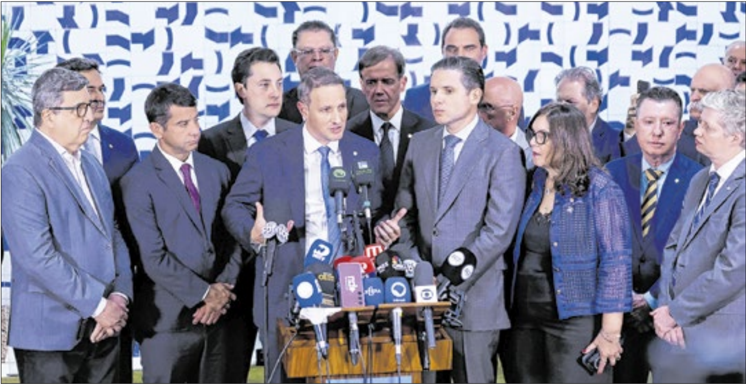
Derrite disse que fará “texto duro”, mas com mudanças que foram negociadas