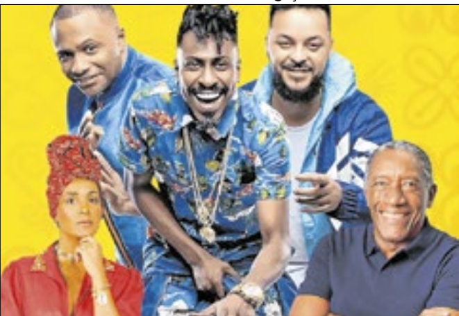
Divulgação/Prefeitura de Paulínia Semana conta com programação aberta ao público