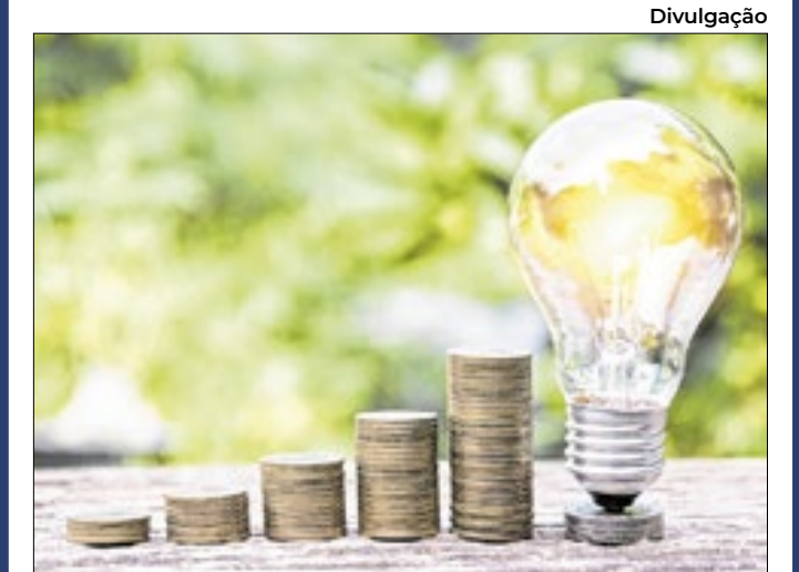
Um dos maiores gastos é com ar-condicionado.

Idosos que moram sozinhos A Comissão do Idoso e da Assistência Social da Câmara Municipal de São Paulo realizou mais uma reunião para debater o desenvolvimento das políticas públicas voltadas ao idoso e as questões