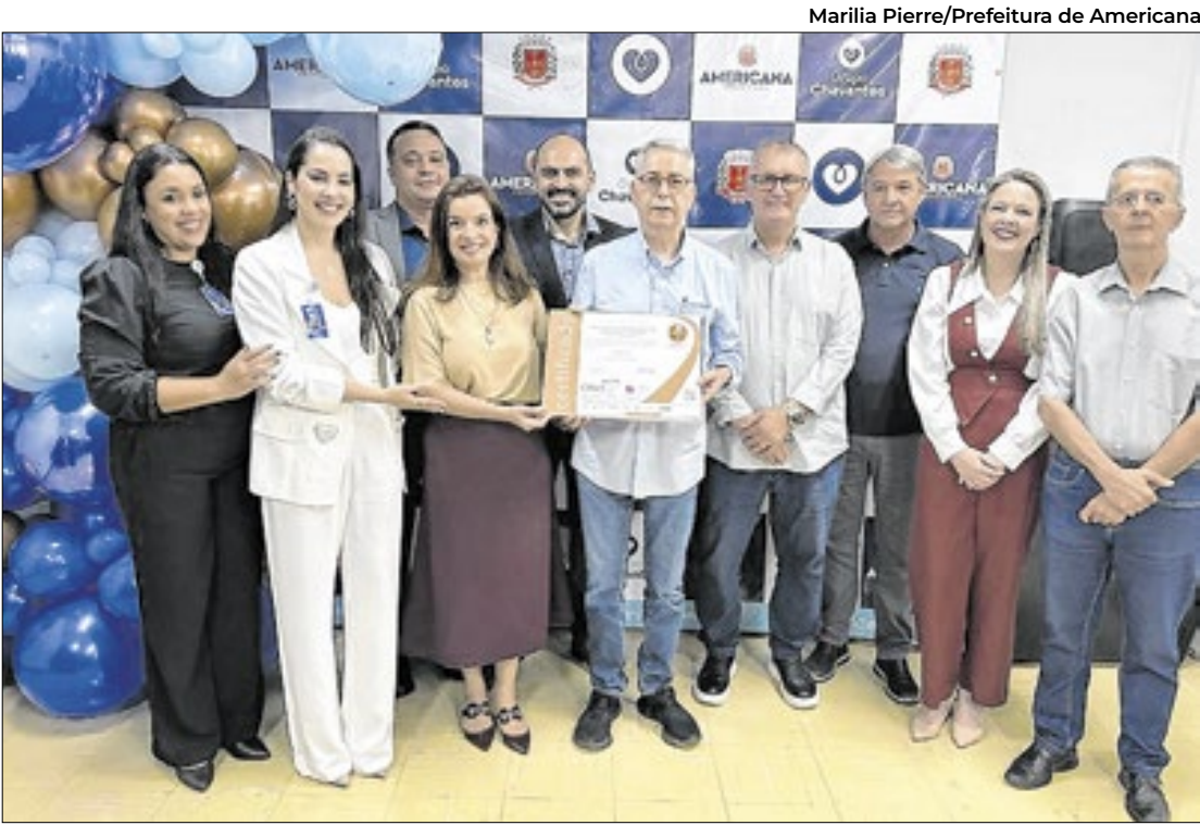
Hospital Municipal é o nono serviço hospitalar público do estado a conquistar o selo