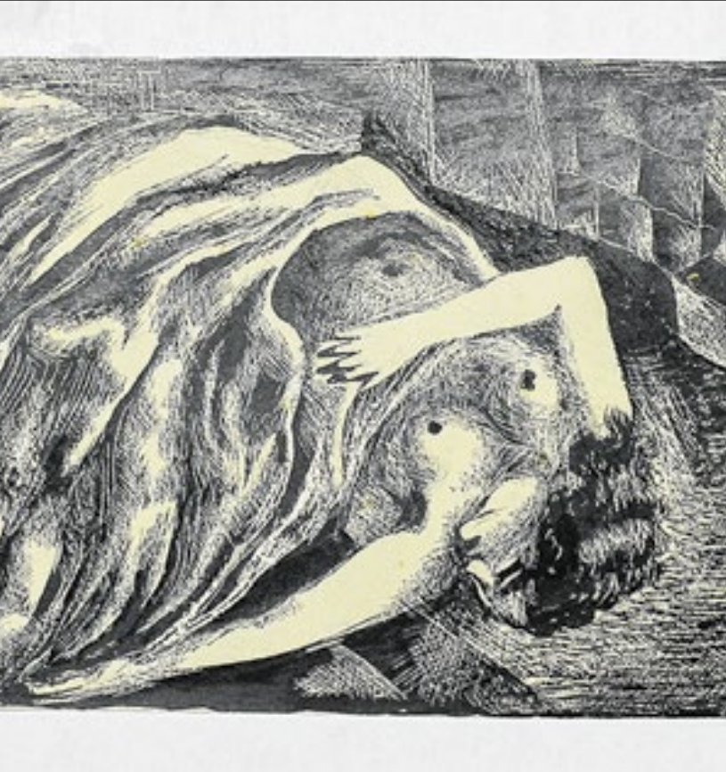
Obra de Emiliano Di Cavalcanti - “Sem título”, 1931

Mostra sobre Pintor brasileiro está em cartaz no Museu de Arte Contemporânea (MAC) da Universidade de São Paulo (USP) e exibe 115 desenhos do artista modernista que pertencem ao acervo do próprio museu.