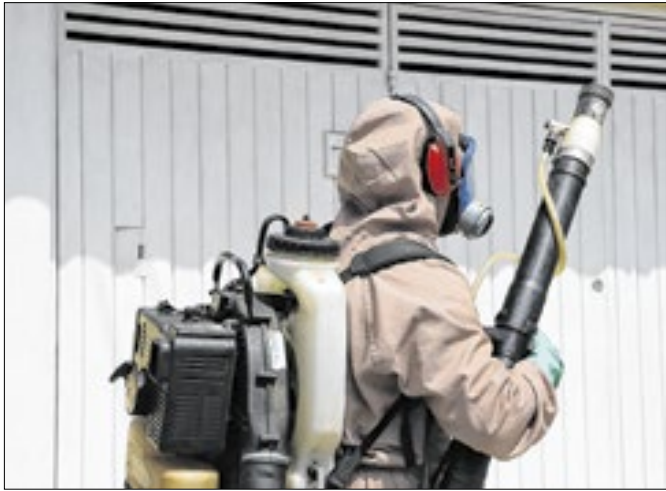
Ações visam conscientizar a população sobre os riscos

A ação de mobilização estadual contra as arboviroses (dengue, Zika vírus e chikungunya) se estende até esta sexta-feira (14). As ações têm o objetivo de conscientizar a população sobre a importância da eliminação dos criadouros do mosquito Aedes aegypti focando nos tipos de criadouros específicos do município. A mobilização tem ainda como objetivo informar os sinais e sintomas da doença e a necessidade de buscar o serviço de saúde.