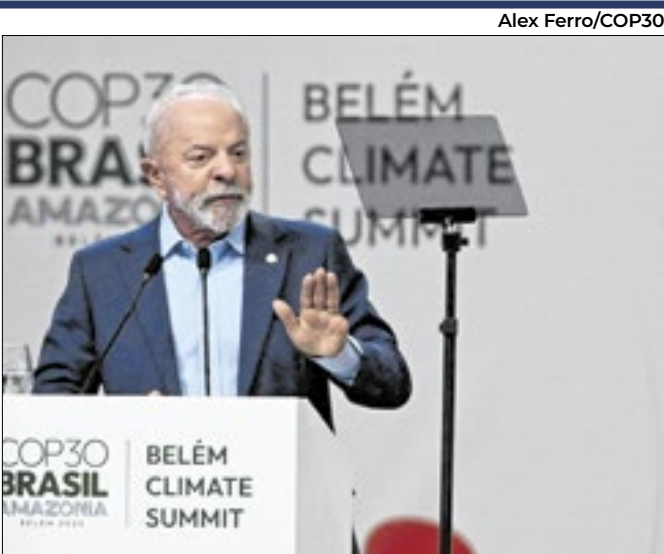
Presidente Lula abriu os trabalhos da COP 30