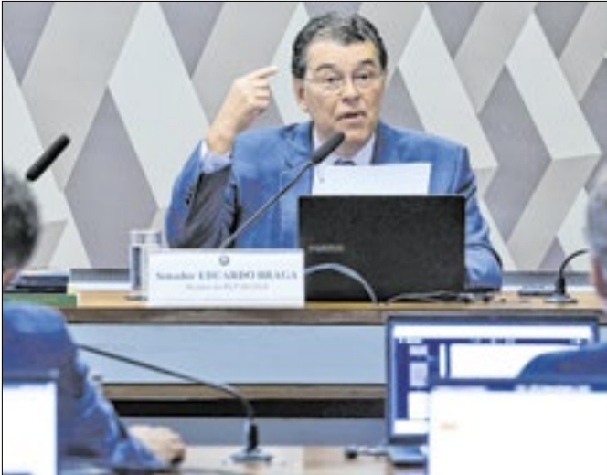
Braga devolveu tributária para a Câmara há um mês