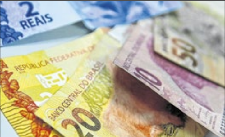
Dinheiro esquecido no banco chega a 48,6 milhões de pessoas físicas

R$ 1 mil representam 9,72% dos clientes. Só 1,81% tem direito a receber mais de R$ 1 mil.