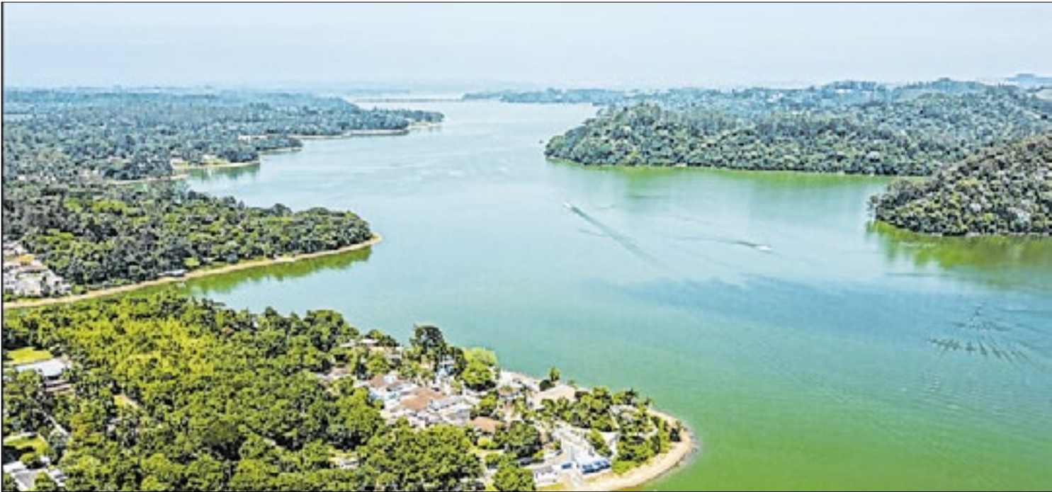
Prefeitura de São Bernardo do Campo

18h do dia 18 e às 9h30 do dia 19. A participação da população é aberta, presencialmente ou por meio da transmissão ao vivo no canal oficial da Câmara no YouTube. Os vídeos também estarão disponíveis no site www.camarajandira.sp.gov.br . Endereço: Rua Rubens Lopes da Silva, 100, Centro, Jandira/SP.