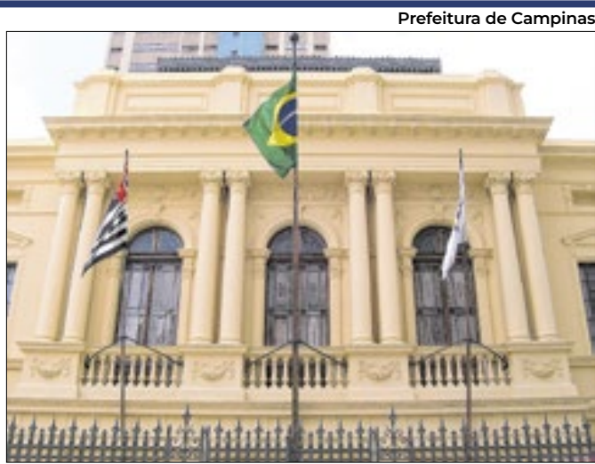
Palácio da Mogiana aguarda a documentação