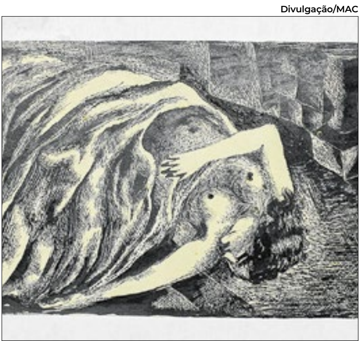
Obra de Emiliano Di Cavalcanti - “Sem título”, 1931

Organizada em seis módulos, a exposição acompanha as diferentes fases da carreira de Emiliano Di Cavalcanti