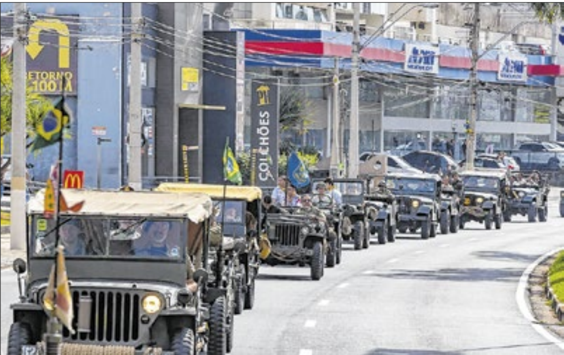
Coluna da Vitória 2025 contará com desfile de viaturas militares