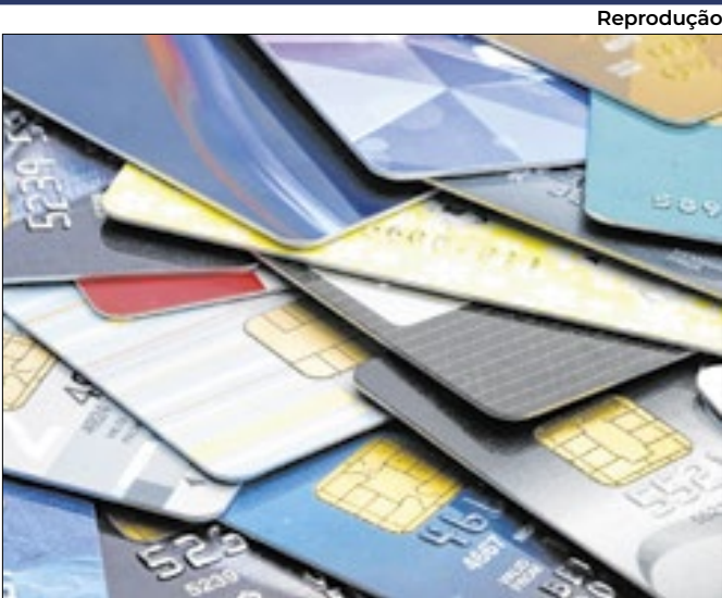
BC publicou novas regras para gestão de riscos