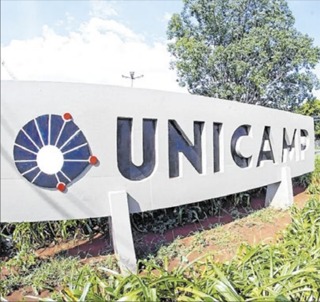
A Unicamp avançou no Ranking Universitário da Folha (RUF) 2025

A Universidade Estadual de Campinas (Unicamp) avançou no Ranking Universitário da Folha (RUF) 2025, e manteve a segunda colocação geral entre as melhores universidades brasileiras, atrás apenas da USP. Porém, a Unicamp manteve a primeira colocação do País em “qualidade de ensino” e assumiu a liderança em “inovação”, segundo o levantamento. O ranking foi divulgado nesta segunda-feira (10) pelo jornal Folha de São Paulo. Na pontuação total, a Unicamp obteve nota geral de 97,99 – em uma amplitude de 0-100 e reduziu para 0,35 ponto a diferença em relação à USP, líder do ranking com 98,34, uma diferença menor na comparação com o levantamento do ano passado e o menor índice da história do ranking, que entrou este ano na 11ª edição. Pela primeira vez, a Unicamp iguala a USP no número de indicadores em que lidera. Veja o ranking completo: https://ruf.folha.uol.com.br/2025/ranking-de-universidades/principal/