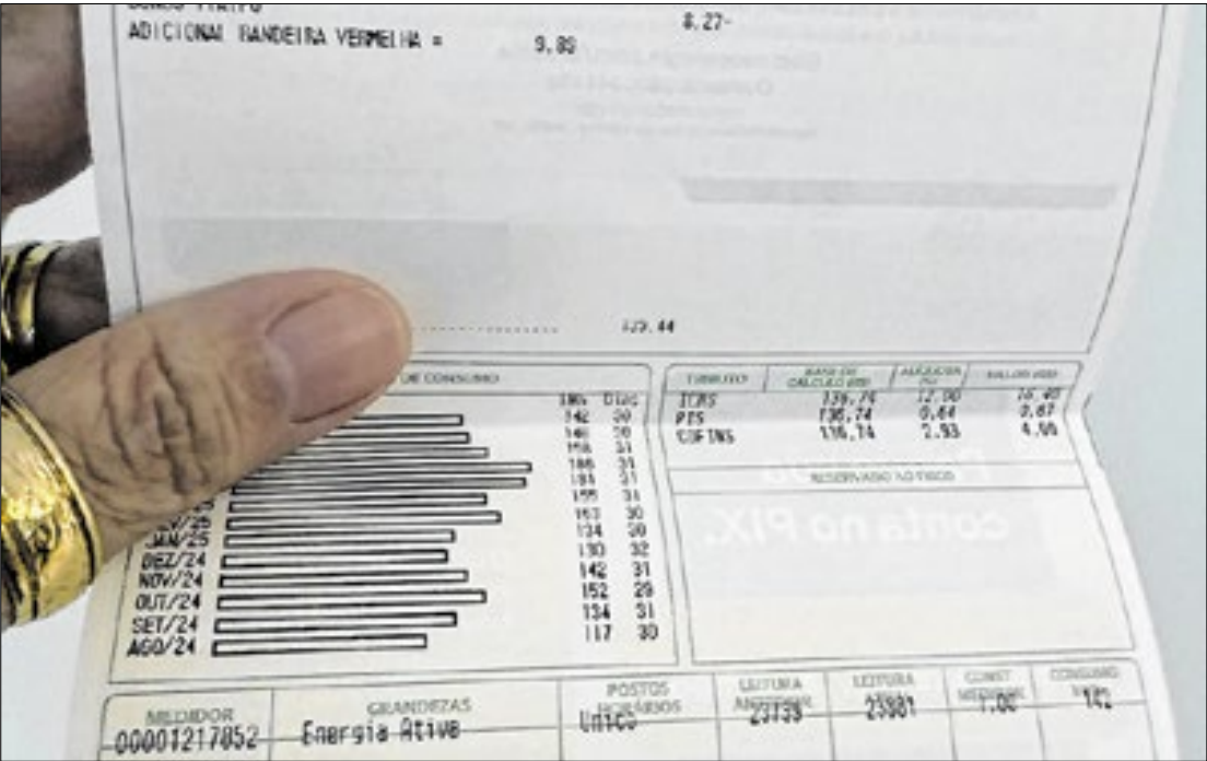
Na conta de energia vem a descrição da bandeira. O patamar 1 aliviou a inflação

A explicação está na migração da bandeira tarifária vermelha patamar 2 para 1. No 2, há cobrança adicional de R$ 7,87 na conta de