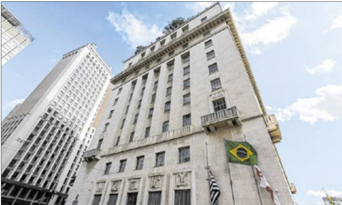
Consulta pública integra processo amplo de participação social do Plano de Saneamento.

“Queremos ouvir a cidade. Cada contribuição recebida torna o diagnóstico mais rico, representativo e capaz de orientar soluções efetivas para os diferentes territórios de São Paulo”, comenta o coordenador de