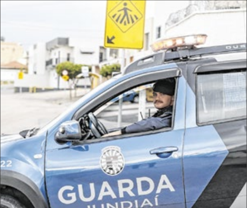
Dados da SSP-SP mostram redução em roubos e furtos na cidade

Dados oficiais da Secretaria da Segurança Pública do Estado de São Paulo (SSP-SP) indicam queda nos índices criminais em Jundiaí nos três primeiros trimestres de 2025, na comparação com o mesmo período do ano passado.