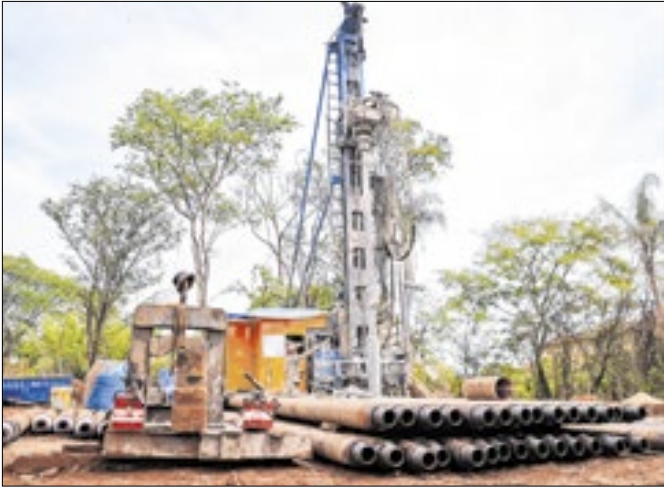
O novo poço será o mais profundo da cidade

A Prefeitura de Ribeirão Preto deu um passo importante para resolver os problemas de abastecimento de água nos bairros Jardim João Rossi e Jardim Nova Aliança, que afetam mais de 20 mil pessoas. A Saerp iniciou as obras do novo Poço CDHU, após meses de interrupções no fornecimento causadas pelo desgaste do antigo poço, perfurado nos anos 1990 e sem manutenção adequada. A construção foi definida como a úni-