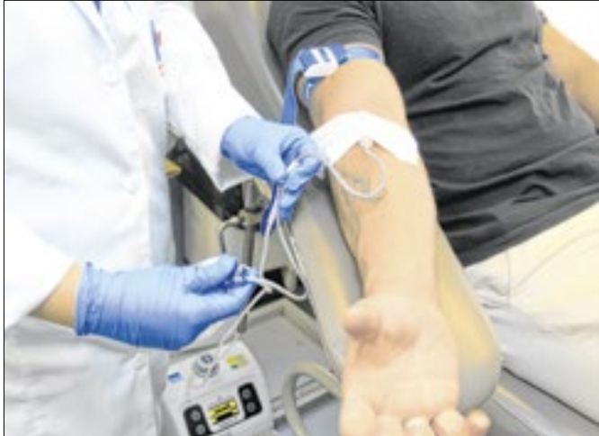
Doação será realizada por ordem de chegada

O Paço Municipal vai receber mais uma ação do Hemocentro, no dia 4 de dezembro, das 8h30 às 12h. Os servidores que quiserem doar sangue podem aproveitar a oportunidade, mas é preciso fazer a inscrição pelo link https://forms.gle/zzekwW-ztxqs32Yka9 . A iniciativa faz parte do SerSol, programa de voluntariado da Secretaria de Gestão e Desenvolvimento de Pessoas. “Incentivo todos a participar. Doar sangue é um ato simples que pode salvar