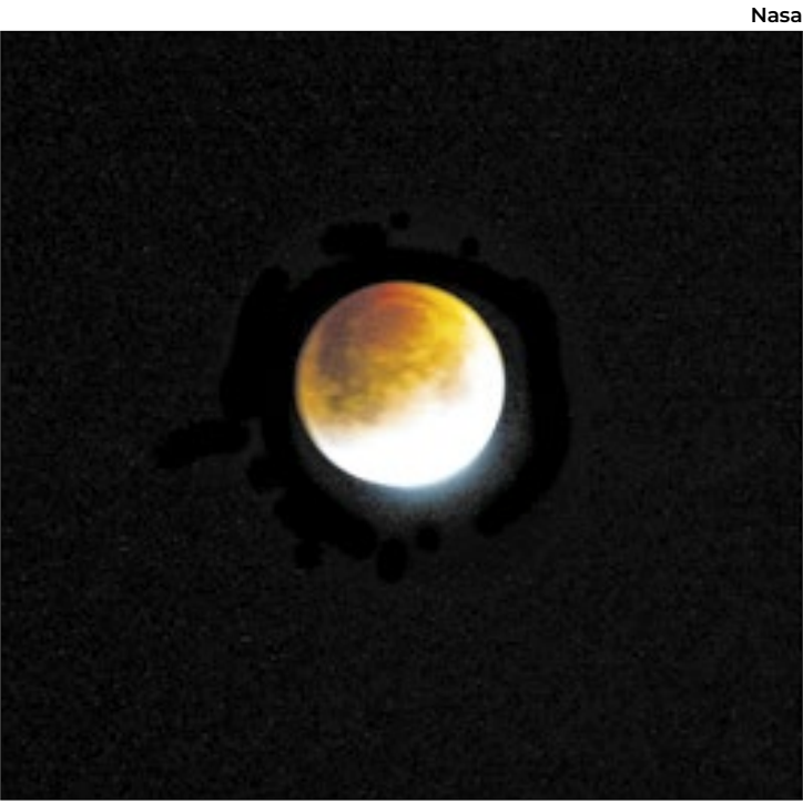
Superlua ficará totalmente visível a partir das 17h45

entre 17h45 e 19h, a superlua estará mais próxima do horizonte, com até 30% a mais de luminosidade e cerca de 14% maior do que o habitual. “Conforme a Lua sobe no céu, esse efeito vai diminuindo, mas ainda é possível observá-la com grande destaque durante toda a noite”, explica Whonrath.