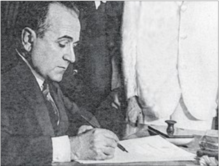
Vargas assinando a posse como presidente do Brasil

Em 3 de novembro de 1930 , Getúlio Dornelles Vargas era empossado como presidente do Brasil. De forma interina, o político de São Borja foi, aos poucos, ficando no poder, para completar 15 no controle do país, passando de governo democrático para nazifascista.