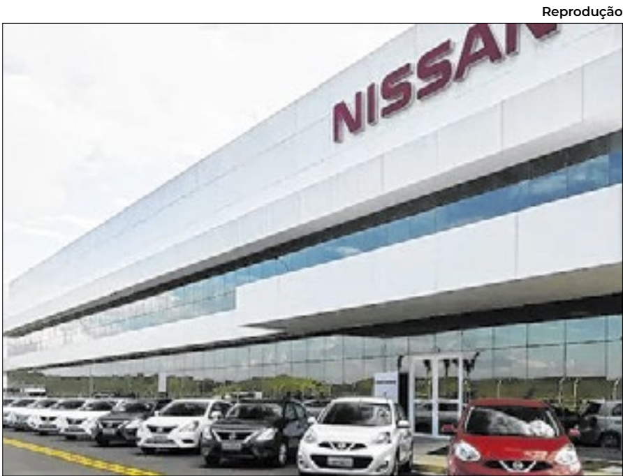
Inscrições para programa de estágio na Nissan estão abertas

Além das vagas regulares da semana, o Sine também conta com oportunidades temporárias de fim de ano, oferecidas por três empregadores do comércio local. O empregador 1 disponibiliza vagas para Vendedor, Operador de Caixa, Estoquista e Fiscal de Loja; o empregador 2 oferece vagas para Vendedor e Operador de Caixa; e o empregador 3 dispõe de oportu-