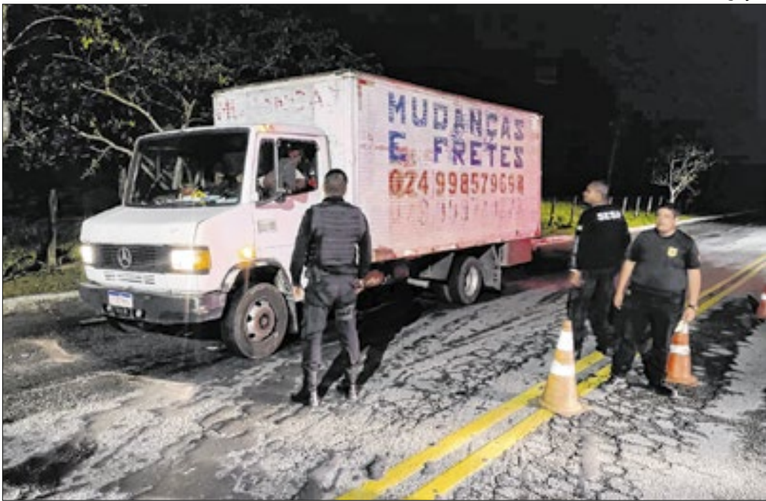
Operação monitora entradas de Angra e permanecerá por tempo indeterminado

O secretário destacou ainda que os equipamentos já instalados na Região Leste já estão em funcionamento e permitem o monitoramento em tempo real das ruas e logradouros, contribuindo para a identificação rápida de ocorrências e reforço na prevenção de delitos. “Cada câmera instalada representa um avanço importante na nossa meta de tornar Barra Mansa mais segura. O sistema integrado também facilita a atuação da