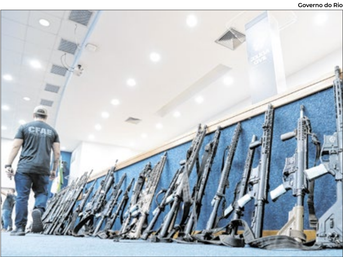
Polícia Civil compartilhará dados com o Exército para rastrear a origem dos armamentos

Biblioteconomia, Ciências Contábeis, Engenharia de Produção, Ciências Biológicas, Física, Geografia, História, Letras, Matemática, Pedagogia, Química, Sistemas de Computação, Gestão de Turismo e Segurança Pública. Os aprovados serão alunos matriculados em uma das sete instituições de ensino superior do Consórcio Cederj: Centro Cefet/RJ, Uenf, Uerj, UFF, UFRJ, UFRRJ e UniRio. Para facilitar os estudos, os aprovados vão ter acesso à internet gratuita através de chips de telefonia móvel.