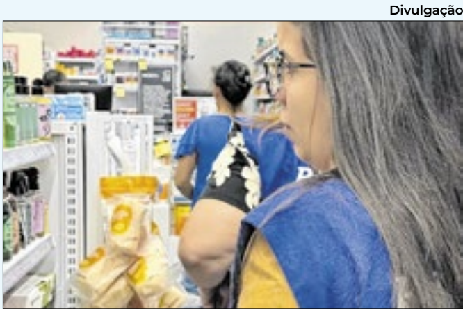
Órgão recebe denúncias de segunda a sexta-feira

secretarias municipais de Fazenda e Planejamento e de Coordenação Governamental. Com investimento de R$ 45 milhões do Consórcio Rio Solar, a iniciativa não gerou custos financeiros para a Prefeitura, que cedeu o terreno para a instalação dos painéis solares. O contrato estabelece concessão de 25 anos para a implantação, operação e manutenção da usina. Com 15 hectares de área total, sendo 8,4 hectares efetivamente ocupados pelos painéis solares, o Solário Carioca conta com 9.240 placas solares de 700 watts cada, responsáveis por converter a luz do sol em eletricidade capaz de abastecer diversos prédios públicos municipais – o suficiente para fornecer energia para cerca de 100 escolas municipais por dia.