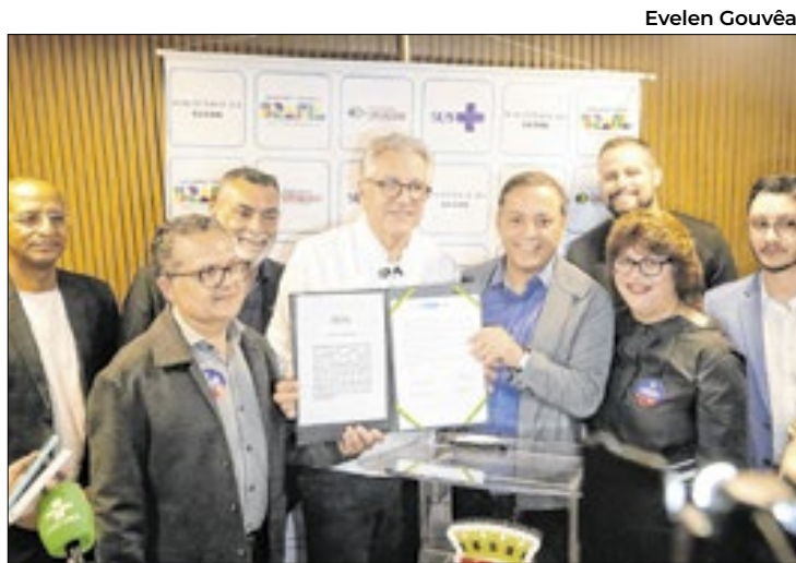
Ministro Alexandre Padilha e o prefeito Rodrigo Neves

“Agora Tem Especialistas” vai ajudar a diminuir as filas e ampliar a oferta de consultas e exames, especialmente em áreas de média e alta complexidade. É mais uma parceria que mostra o quanto o trabalho conjunto entre o município e o Governo Federal traz resultados concretos para a população. Niterói é referência em políticas públicas de saúde. Aqui nasceu o programa Médico de Família. Durante a pandemia, Niterói criou o primeiro hospital do SUS para pacientes graves de Covid-19 e firmou a primeira parceria com o Instituto Butantan para o desenvolvimento da vacina. Também fomos pioneiros, com a Fiocruz, em ações que eliminaram o risco de epidemia de dengue. Agora, também estamos ampliando o acesso e enfrentando filas com o programa Fila Zero da Saú-