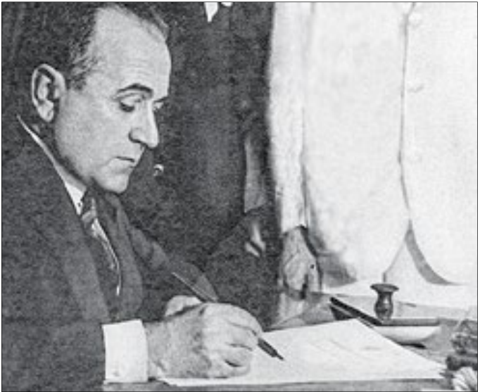
Vargas assinando a posse como presidente do Brasil

Em 3 de novembro de 1930, Getúlio Dornelles Vargas era empossado como presidente do Brasil. De forma interina, o político de São Borja foi, aos poucos, ficando no poder, para completar 15 no controle do país, passando de governo democrático para nazifascista.