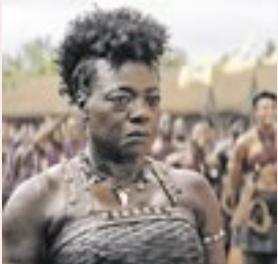
‘Mulher Rei’, com Viola Davis, chega à TV aberta nesta segunda PÁGINA 6