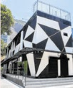
Teatro Gláucio Gill faz 60 anos e recebe 30 peças em 30 dias PÁGINAS 4 E 5