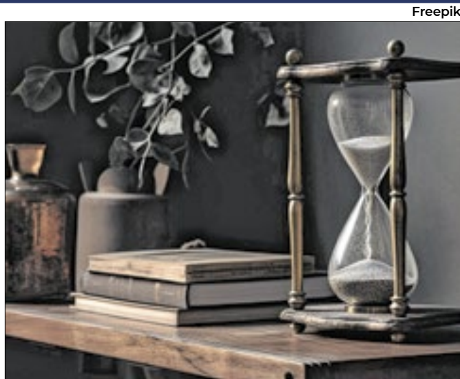
Pedido de revisão é de até dez anos após a concessão