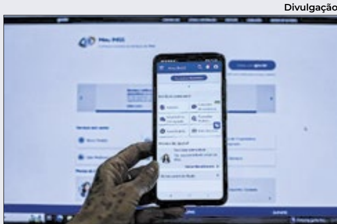
Aplicativo ou site Meu INSS dá acesso a serviços

INSS. Para acessar a plataforma, é necessário ter cadastro no Portal Gov.br, que exige login e senha. O próprio cidadão pode preencher o pedido de recurso sem a necessidade de algum intermediário. Caso precise de um advogado, consulte antes no site da OAB.