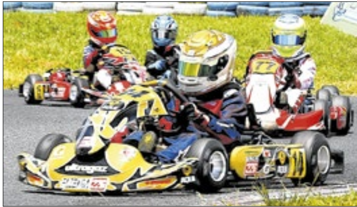
Brasília Kart Series realiza etapa com entrada gratuita