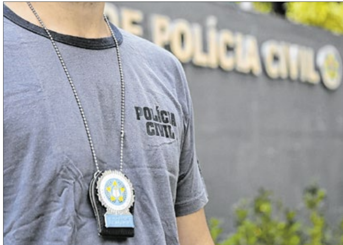
Operação visa a reprimir roubo, furto e receptação de cargas e de veículos

Dados de inteligência e monitoramento dão conta de que a localidade é usada como base para ações criminosas de roubadores de carga e narco-