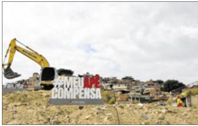
Serão dois residenciais, ao custo de R$ 46 milhões