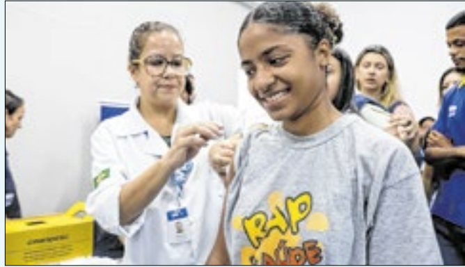
Imunização é segura e gratuita nas unidades de saúde