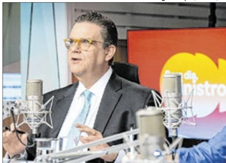
Ministro da Previdência Social, Wolney Queiroz

Os valores são pagos de forma integral, corrigidos pela inflação