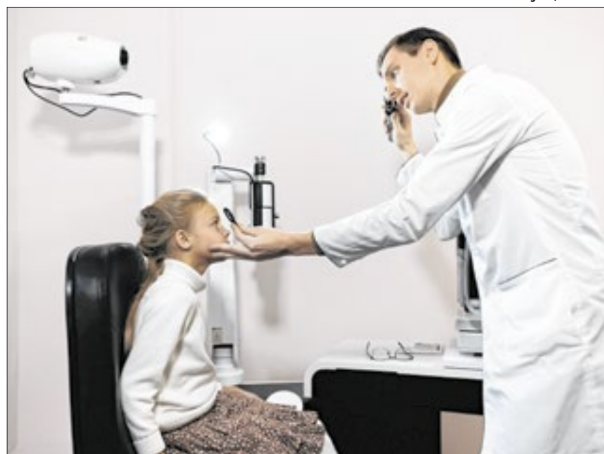
Sul e Sudeste têm até cinco vezes mais pediatras por criança que Norte e Nordeste

O Brasil tem uma média nacional de 94,72 pediatras para cada 100 mil habitantes de até 19 anos, mas a distribuição desses profissionais é desigual entre as regiões. Estados do Sul e Sudeste, como Rio Grande do Sul e São Paulo, e também o Distrito Federal, no Centro-Oeste, apresentam pelo menos cinco vezes mais pediatras por criança e adolescente do que estados do Norte e Nordeste, como Amapá, Amazonas, Acre, Pará e Maranhão, que são os cinco com menor cobertura.