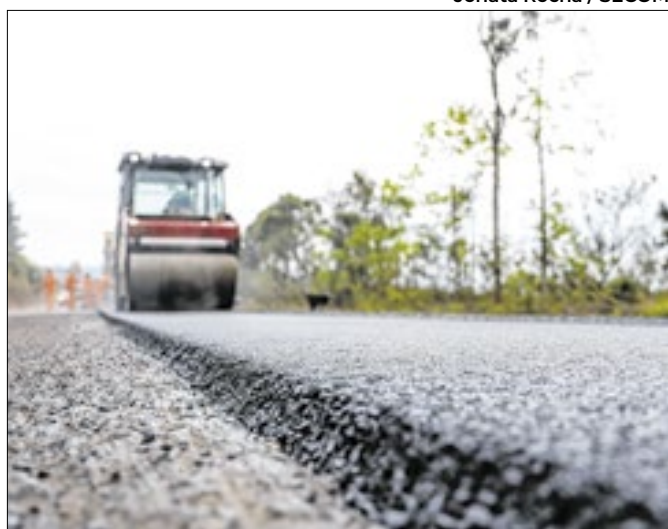
A malha viária da região passou por uma transformação