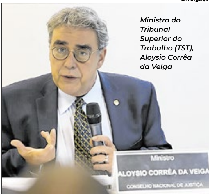
Ministro do Tribunal Superior do Trabalho (TST), Aloysio Corrêa da Veiga

Ele se caracteriza por meio de comportamentos abusivos