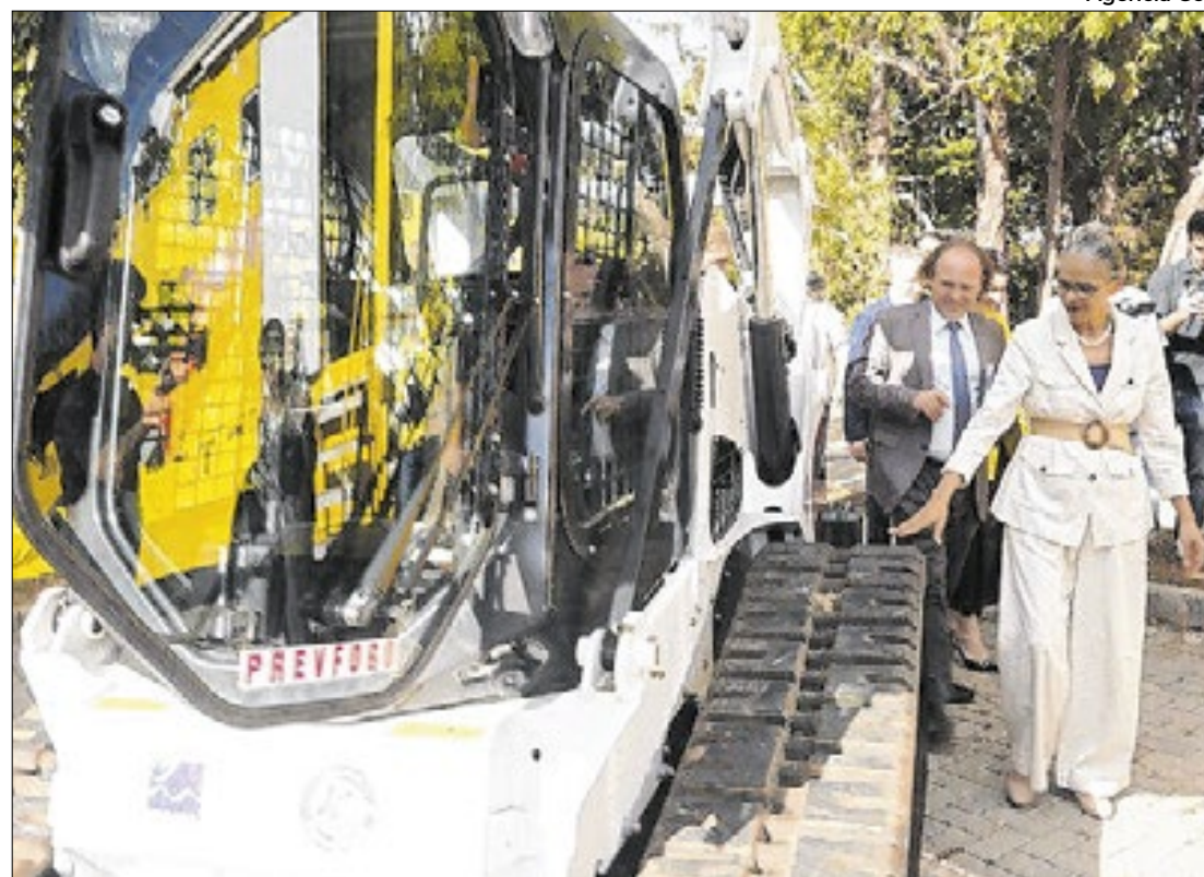
MMA, Ibama e ICMBio destacam avanços do primeiro ano do programa