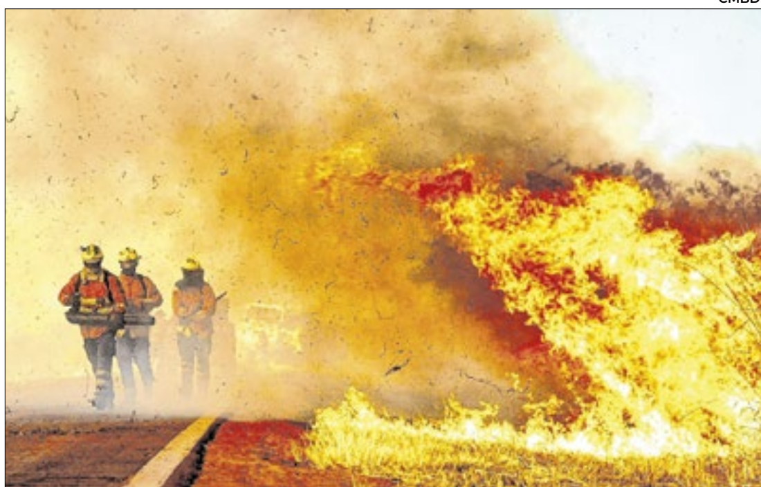
Tempo mais quente e seco propicia aumento das queimadas

O prefeito de Goiânia (GO), Sandro Mabel (União), recebeu a Comenda da Ordem do Mérito Anhangera do governador de Goiás, Ronaldo Caiado (União). A entrega aconteceu na noite de terça-feira (29) durante as comemorações aos 298 anos da Cidade de Goiás (GO).