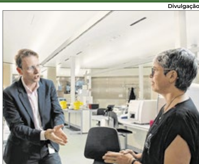
Especialistas e famílias debaterão sobre doenças raras

Mais de 785 ocorrências de queimadas em duas semanas