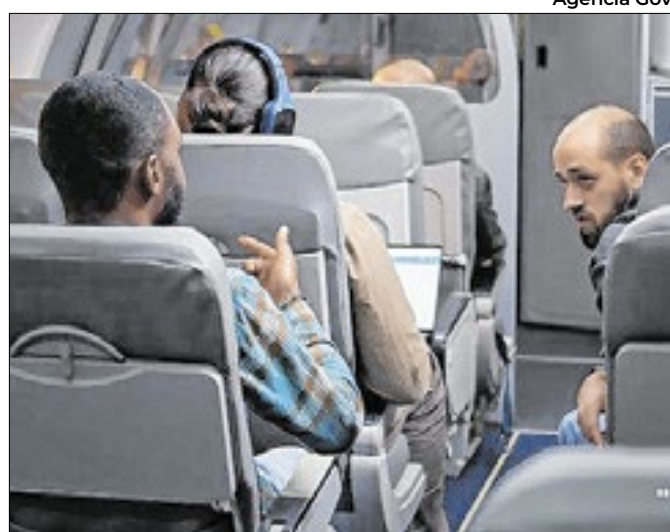
Aulas começam em 2 de setembro