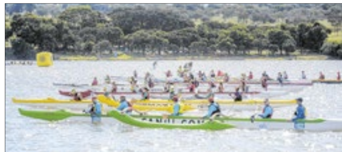
Brasília é o cenário perfeito para o Rei e Rainha do Mar. O Lago Paranoá tem excelente qualidade da água, monitorada regularmente

Tendo o Pontão do Lago Sul como ponto de partida, estão confirmadas provas de natação em águas abertas (Open 500 m, Sprint 1K, Classic 2K e Challenge 4K), biathlon (1K de natação + 2.5K de corrida), e canoa havaiana (Vãa Generations 11K e Vãa Race 17K), inclusive para o público PCD e para a criança. Afinal, como diz o ditado, "filho de peixe, peixinho é!", consolidando-se assim como um evento para toda a família.