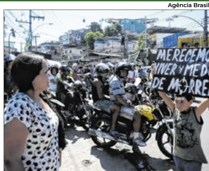
Os números fazem parte do relatório semestral