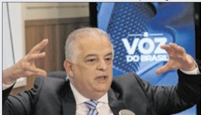
Ministro Márcio França durante entrevista