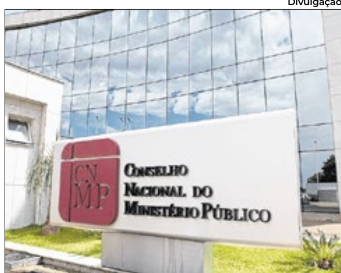
O CNMP é composto por 14 conselheiros