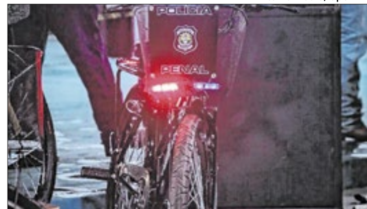
Projeto estatal une trabalho, doações e ressocialização