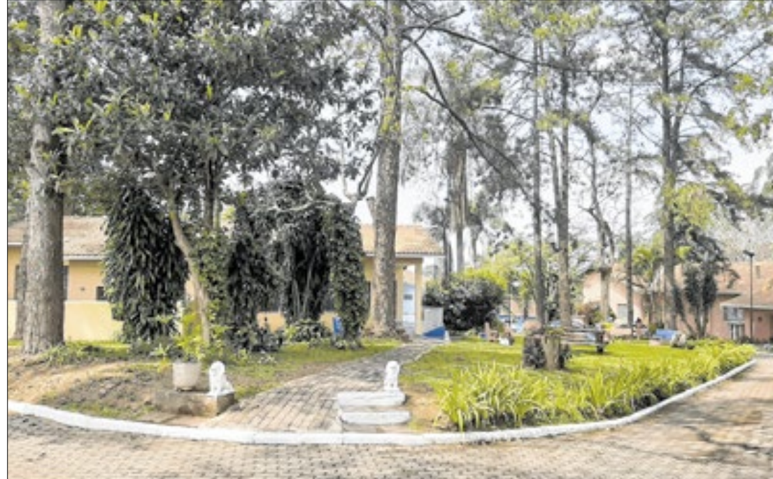
Os resultados foram apresentados nesta quinta-feira (30), na capital paulista