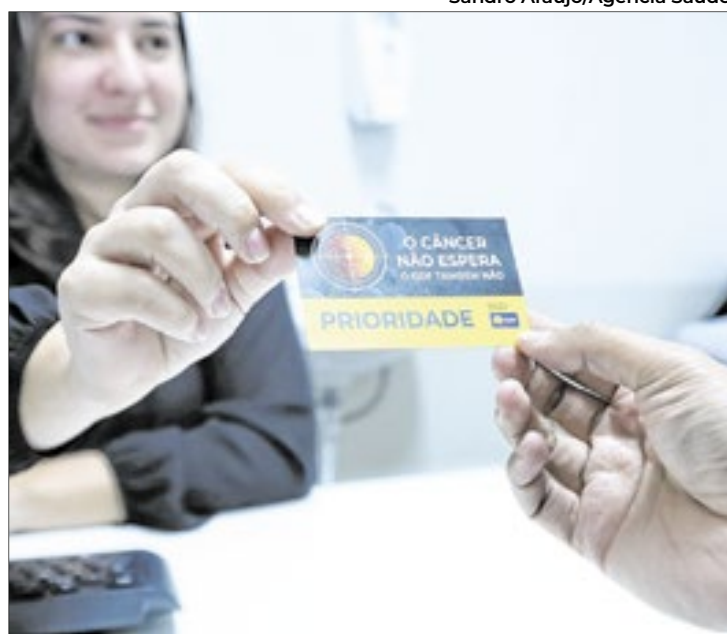
Cartão dá prioridade de atendimento a pacientes

Desde o lançamento do programa "Câncer não espera. O GDF também não", no iní-