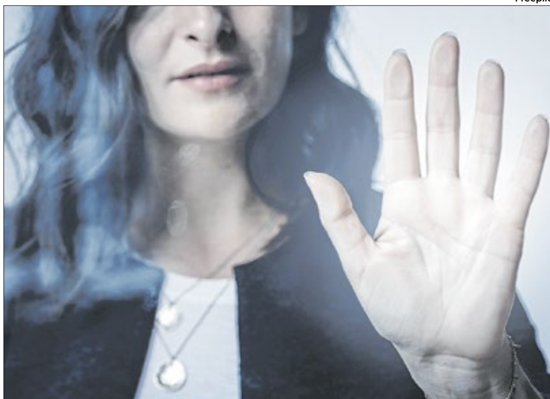
O assédio contra mulheres no ambiente de trabalho saltou 28% entre 2023 e 2024, aponta pesquisa

Entre os que não denunciaram, 27% acreditavam que o caso não seria investigado, enquanto