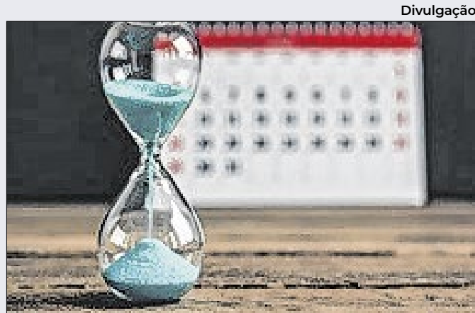
Prazos processuais ficaram suspensos até 31 de julho

O STF realizará nesta quinta-feira (31) o workshop "Prática de Decisão e os Estilos de Fundamentação de Cortes Supremas e Constitucionais". O evento será na sala de sessões da Segunda Turma, às 14h30. Link para inscrições está disponível na página do Supremo.