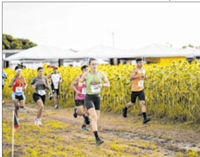
Evento do agronegócio espera mais de 50 mil visitantes