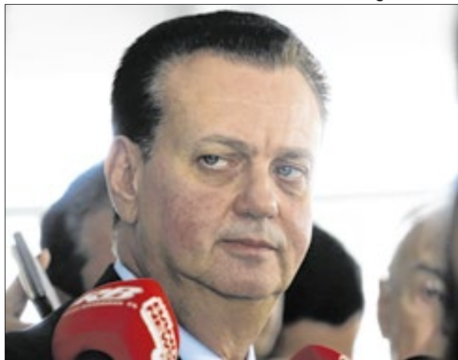
Kassab: no momento, jogo para 2026 ficou imprevisível