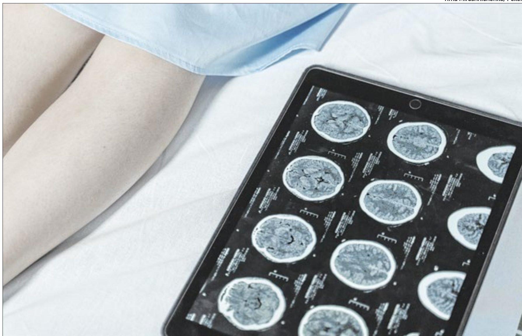
Os dados do Inca revelam que esse tipo de câncer é mais comum em homens

Segundo o Inca (Instituto Nacional de Câncer), o Brasil é um dos principais países do mundo em número de casos desse tipo de câncer. O estudo “Disparidades no estágio do diagnóstico de tumores de cabeça e pescoço no Brasil: uma análise abrangente de registros hospitalares de câncer”, publicado na The Lancet Regional Health Americas e conduzido pelo Inca, mostra que cerca de 80% dos tumores de cabeça e pescoço diagnosticados no Brasil entre 2000 e 2017 foram identificados em estágios avançados.