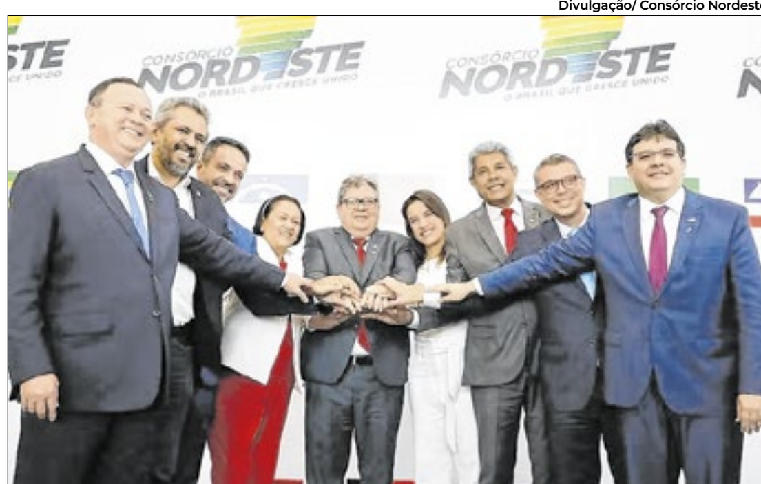
Bahia, Maranhão e Ceará são os estados nordestinos que mais exportaram para o EUA

Medida dos EUA atinge diretamente a cadeia produtiva da região