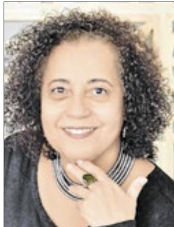
A escritora e jornalista lança hoje, em Paraty, seu mais novo livro de crônicas

Suas crônicas, ao contrário da falta de amor e compaixão, são lenitivos, bálsamos que embelezam nossos sentidos, nos dão razão para acreditar no sobrevivente próximo - e em nós mesmos, nas nossas forças e atitudes."