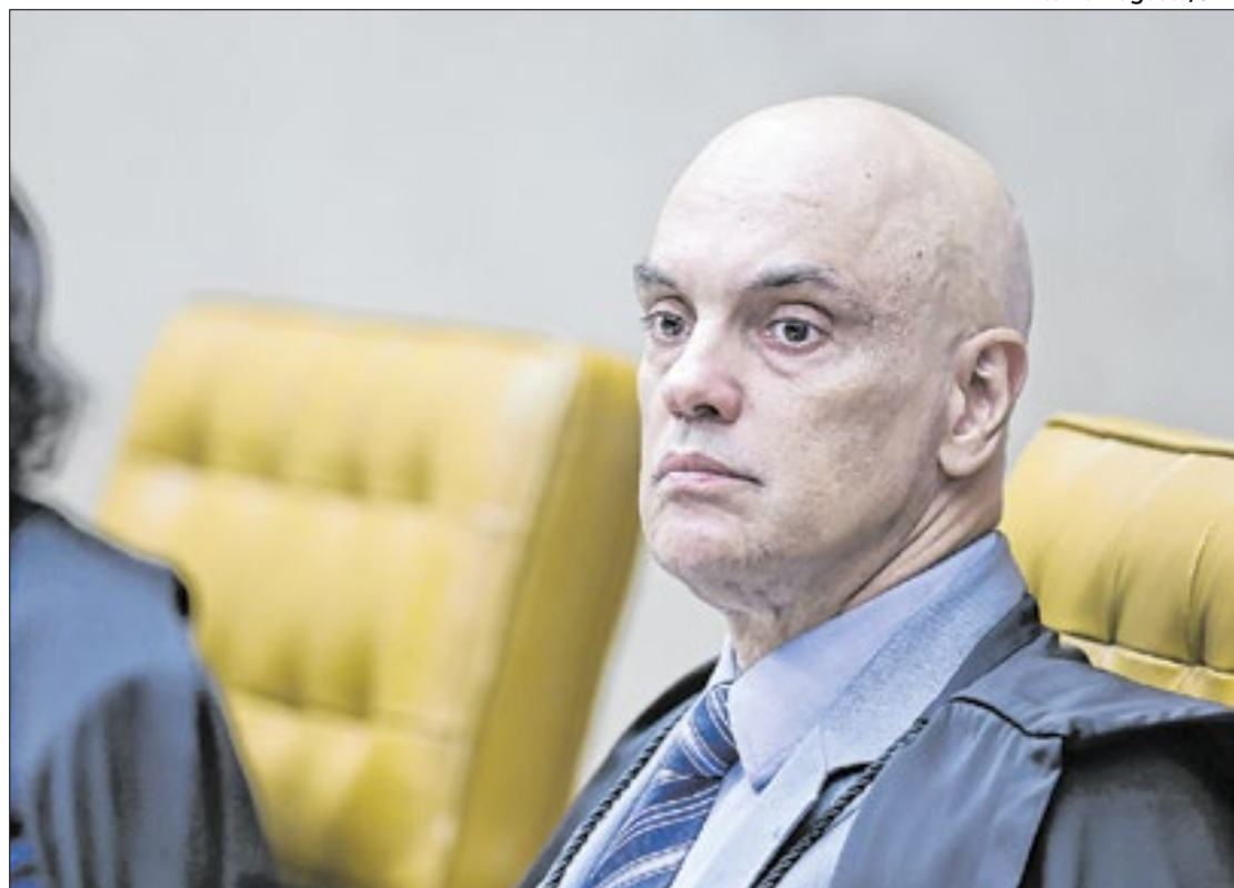
Lei usada contra Moraes foi pensada para violadores de direitos humanos

Em nota, o STF manifestou solidariedade ao ministro integrante da Corte e pon-