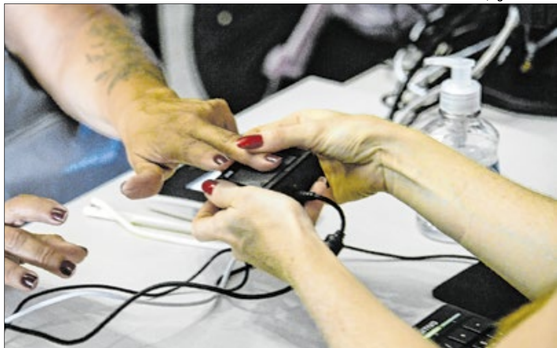
De acordo com dados do governo, 150 milhões de pessoas têm registro biométrico

De acordo com o governo, cerca de 150 milhões de brasilei-