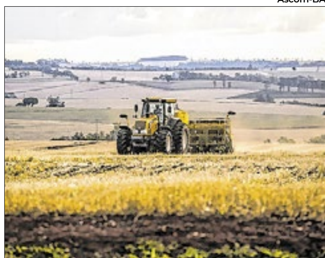
Dados mostram desigualdade regional