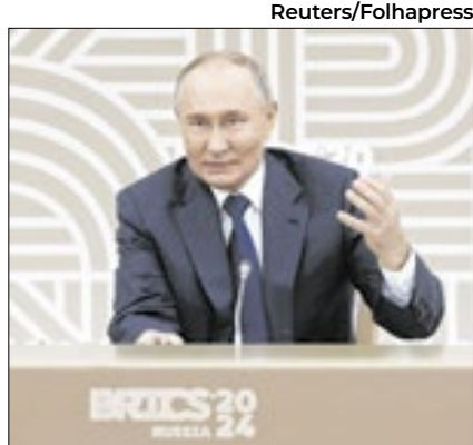
Putin 'desapontou' Donald Trump

Buscando estimular o crescimento da taxa de natalidade, o governo da China anunciou um programa nacional de subsídio. Com ele, os pais receberão 3.600 yuans (R$ 2.800) anuais para cada filho com menos de três anos.