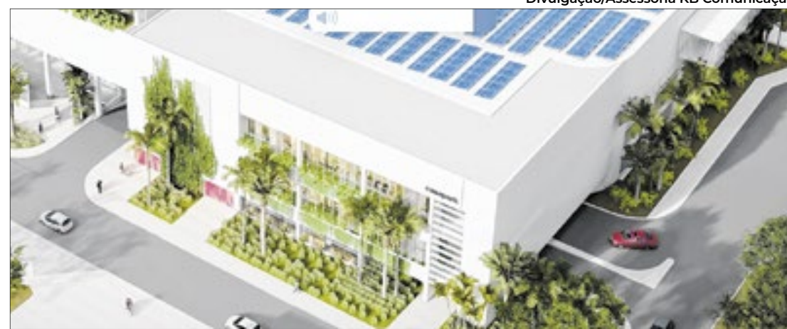
Nova entrada do Casapark, que ficará voltada para o Park Sul, o novo bairro da cidade

“O Casapark vai voltar a sua frente para onde hoje é a parte