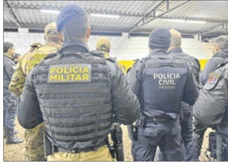
Número de aparelhos recuperados cresce 50%

Se considerado somente o crime de furto de celulares (quando a ação não envolve violência), o número de ocorrên-