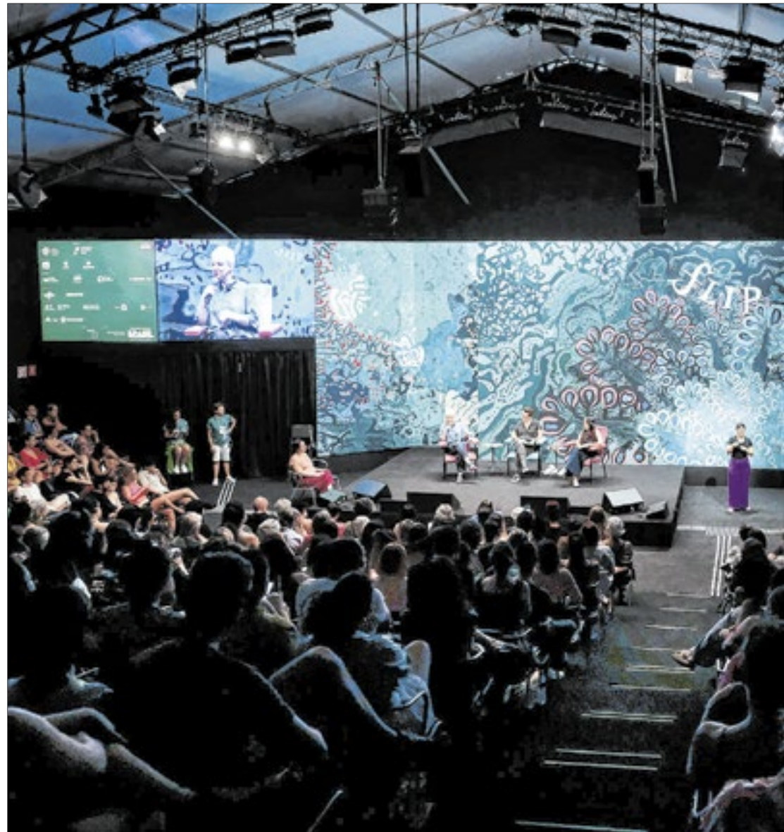
Os ingressos para a feira estão disponíveis pelo link https://flip.icticket.com.br/