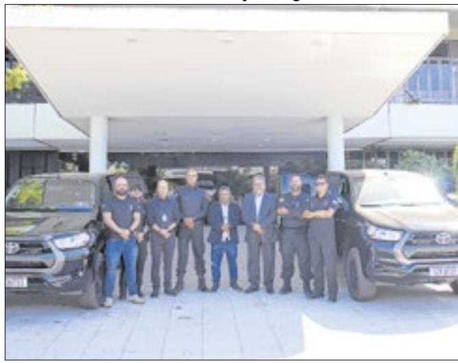
Veículos vão reforçar operações e transporte