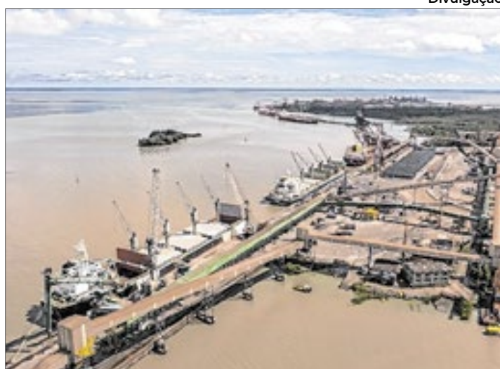
Portos mantêm crescimento com destaque para Salvador