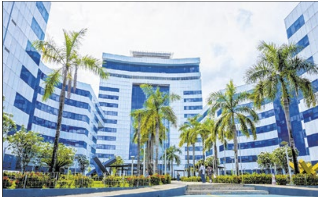
Segundo o governo, o crescimento é impulsionado por ações em diversas frentes industriais

Rondônia deve alcançar um crescimento de 5,5% no Produto Interno Bruto (PIB) em 2025, segundo projeção divulgada na Resenha Regional de julho do Banco do Brasil.