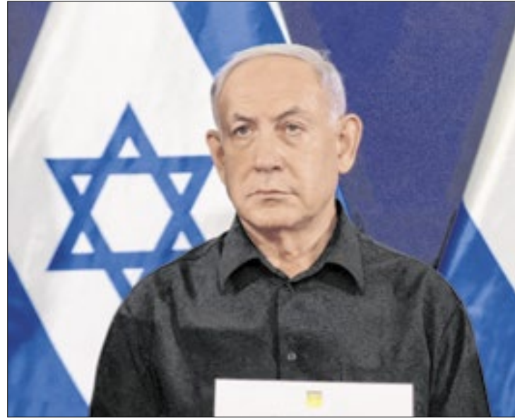
Binyamin Netanyahu negou acusações sobre fome em Gaza

Netanyahu ainda acrescentou que Israel possibilitou a entrada da quantidade exigida pelo direito internacional de ajuda humanitária e voltou a acusar o Hamas de roubar suprimentos. O grupo terrorista nega a acusação, e um relatório produzido em junho pela Usaid, a agência de ajuda externa americana, constatou que