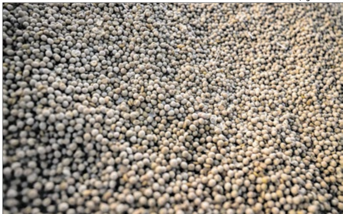
O relatório SOFI divulga esse indicador sempre na forma de médias trienais

Relatório apresentado nesta segunda-feira (28) durante a 2ª Cúpula de Sistemas Alimentares da Organização das Nações Unidas (ONU) (UNFSS+4), na Etiópia, revela que o Brasil está novamente fora do Mapa da Fome. O país está abaixo do patamar de 2,5% da população em risco de subnutrição ou de falta de acesso à alimentação suficiente.