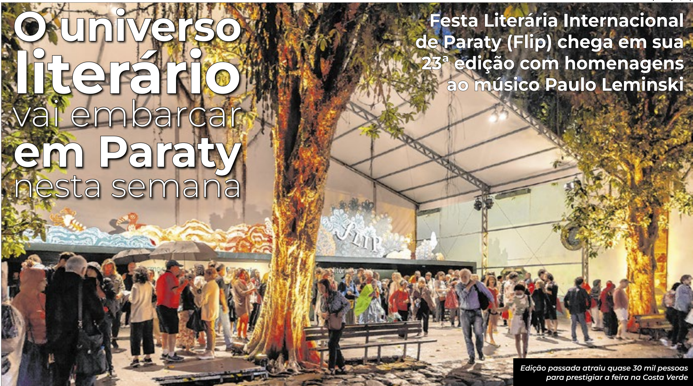
Edição passada atraiu quase 30 mil pessoas para prestigiar a feira na Costa Verde

Festa Literária Internacional de Paraty (Flip) chega em sua 23ª edição com homenagens ao músico Paulo Leminski