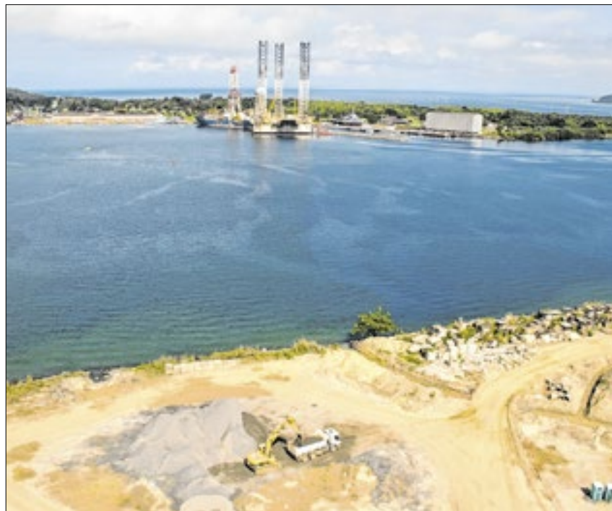
Canal onde foi abandonada a balsa é em frente à Base Naval da Marinha em Aratu