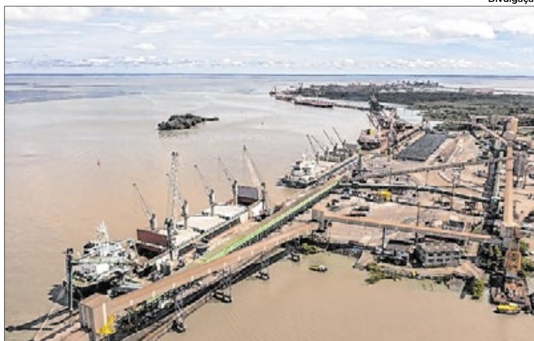
Portos mantêm crescimento em 2025, com destaque para Salvador e Natal

Exportação de frutas e cabotagem impulsionam movimentação