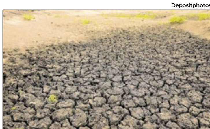
Ação da Sudene marca retomada integrada da região

No litoral potiguar, a diversificação da pauta exportadora também ganhou destaque, com embarques de melões, melancias, mangas, uvas e limões. Essa ampliação demonstra o potencial agrícola e logístico da região, que contribui para o crescimento sustentável dos portos.