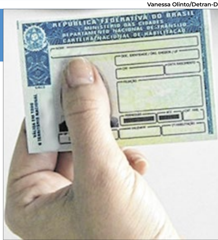
Dos mais de 60 mil inscritos, o Detran-DF selecionou 5 mil candidatos

Dentre os selecionados, 1.323 candidatos que se declararam negros ou transe-