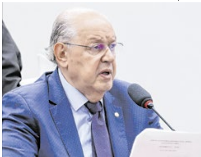
Nem governista nem bolsonarista: Haully vê do centro