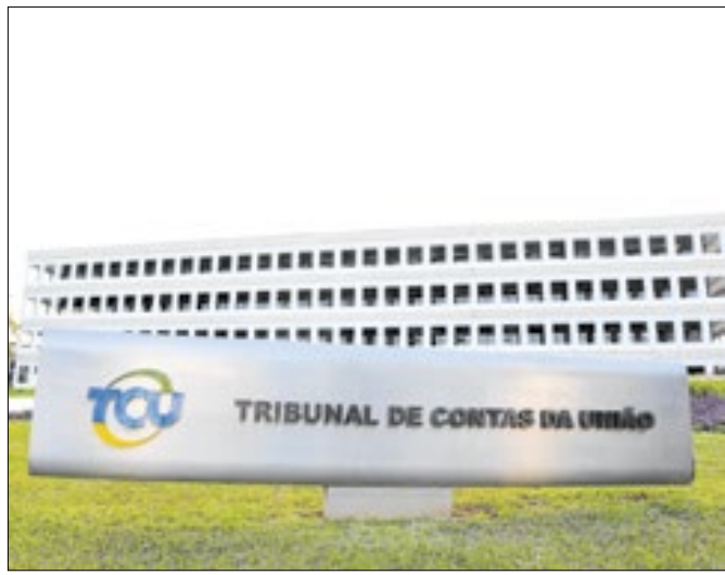
Tribunal de Contas da União fará reunião amanhã