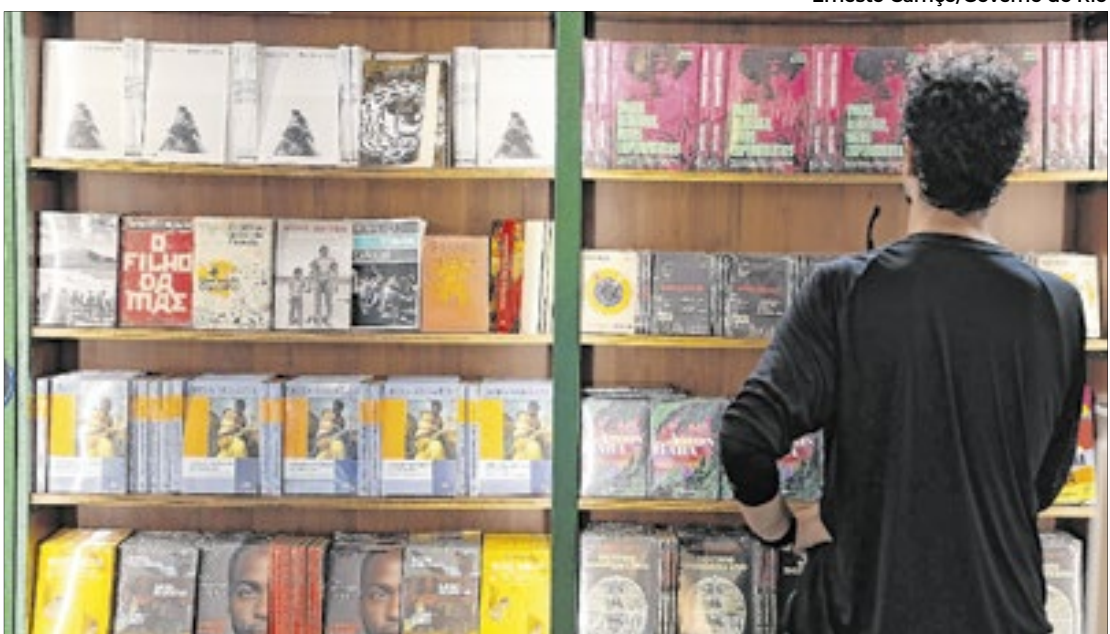
Governo do Rio leva Casa da Leitura e do Conhecimento à Flip 2025 com programação gratuita