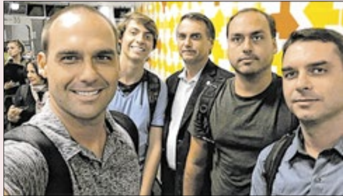
Família Bolsonaro perdeu boa parte de sua força