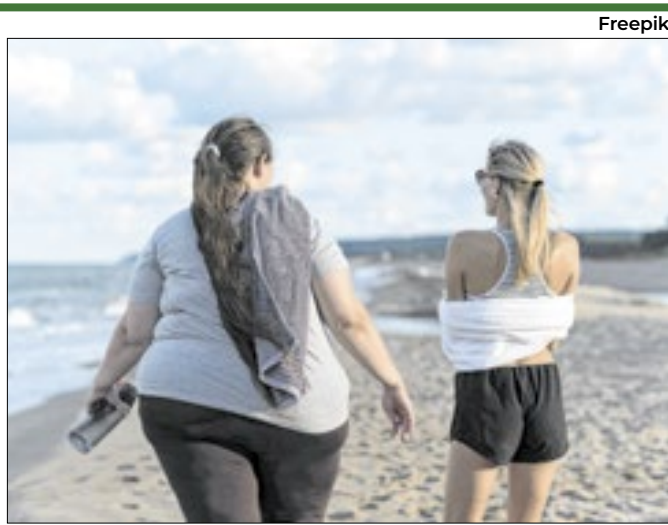
Estudo é da Universidade Federal de São Carlos