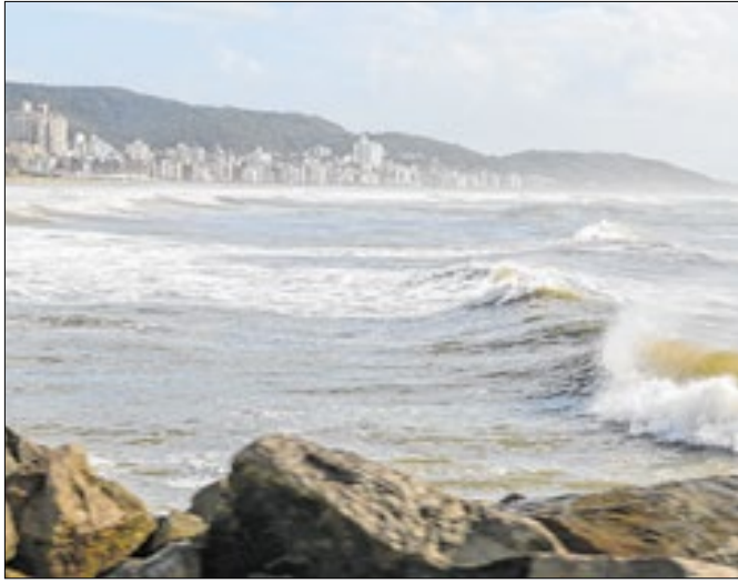
Semana começa sob influência de ciclone extratropical