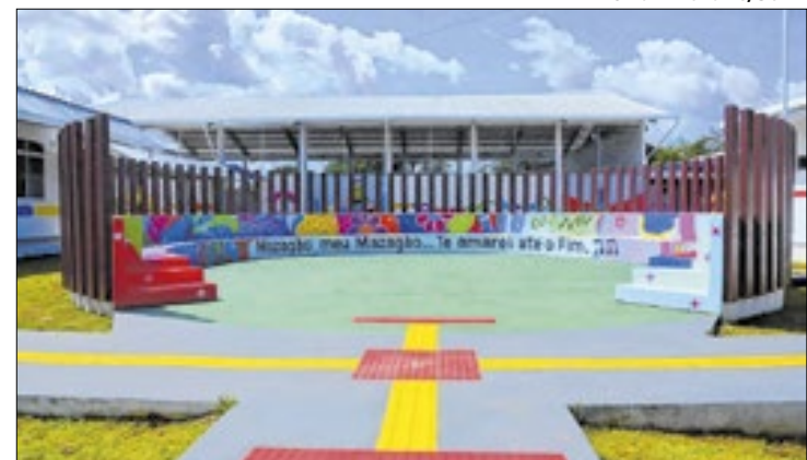
Unidade em Mazagão teve recursos de R$ 8,7 milhões