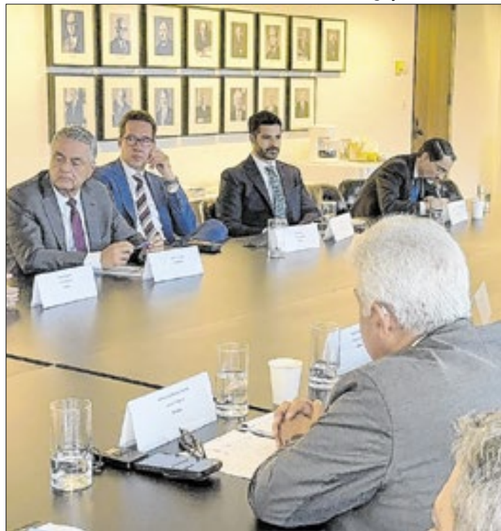
Senadores estiveram no BID e com empresários dos EUA

Para além de empresários, os senadores se reuniram com