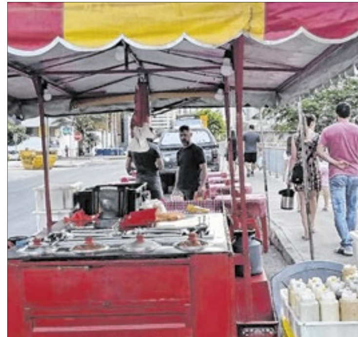
Barrquinhas estão sendo retiradas das ruas

“Resaltamos que estamos trabalhando para que a regularização ocorra o mais breve possível”, promete.