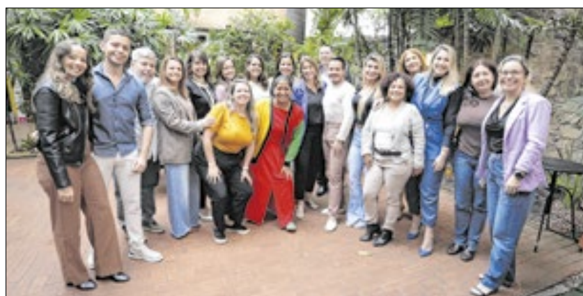
O secretário Igor Marques com sua equipe de imprensa e digital do governo do Estado do Rio