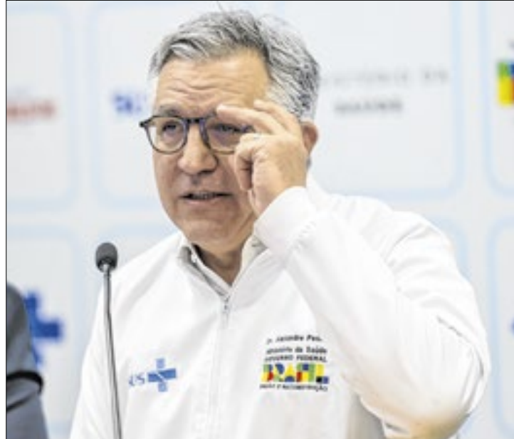
Programa visa áreas com carência de serviços especializados

exames e cirurgias. É preciso comprovar capacidade