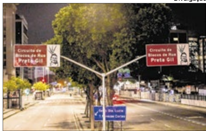
Prefeitura faz homenagem a artista