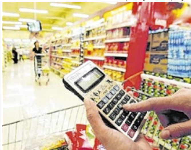
Inflação de alimentos em queda seguiu prévia de julho