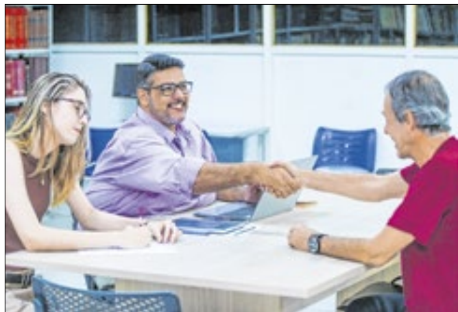
Centro Cultural irá formar o novo Coro Municipal