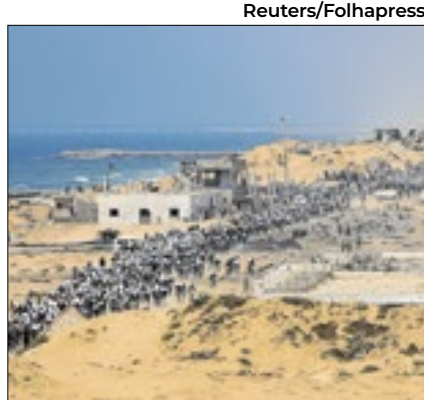
Palestinos carregam mantimentos

O restante de Gaza, áreas que incluem os quatro pontos de distribuição de comida operados pela Fundação Humanitária de Gaza (FHG), seguem em locais para onde o Exército