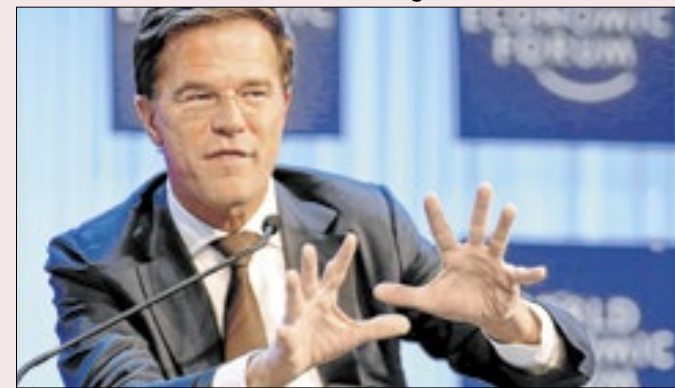
Mark Rutte, da Otan, ameaçou o Brasil