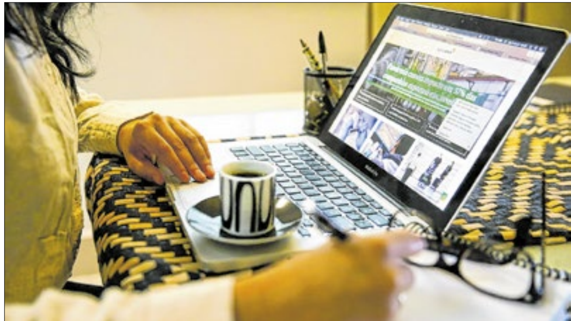
Uma média de quatro em cada 10 funcionários atua à distância

Mesmo depois da pandemia, houve um aumento de 11% no