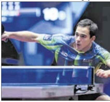
Hugo foi campeão na Argentina

O jogo deste domingo foi a quarta final consecutiva de Calderano, que iniciou a partida de forma