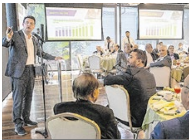
Ratinho Jr durante encontro com os empresários na Casa Firjan, no Rio de Janeiro