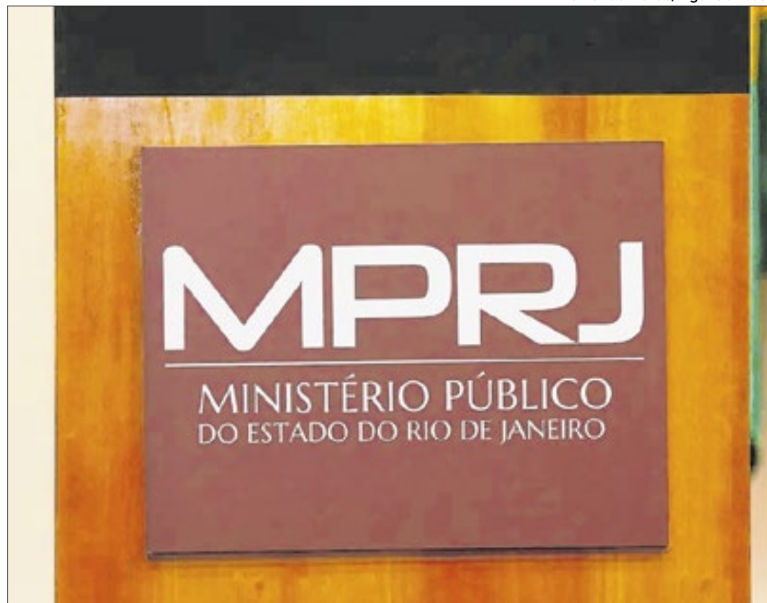
A nova sede será construída na Rua Parú, nº 277, no bairro Agriões

A comarca de Teresópolis foi criada em 2002, durante a gestão do então procurador-geral de Justiça José Muiños. Desde então, as promotorias funcionam em salas alugadas, divididas entre prédios comerciais e o Fó-