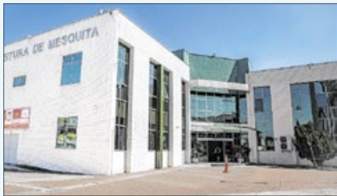
Depósitos foram realizados na última sexta-feira (25)