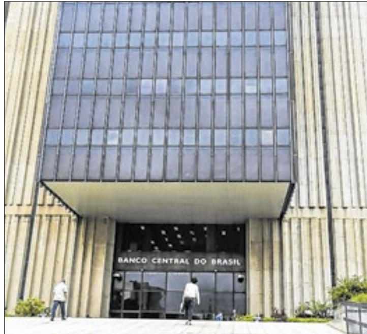
Financeiras agora vão poder operar como fintechs

A partir de setembro, as financeiras poderão exercer atividades de fintechs (empresas de tecnologia financeira) de crédito e de instituições de pagamento (que movimentam pagamentos, mas não oferecem empréstimos). O Conselho Monetário Nacional (CMN) aprovou nesta quinta-feira (24) uma resolução que moderniza as regras das financeiras e permite a incorporação de uma série de serviços, regulamentados por outras normas.