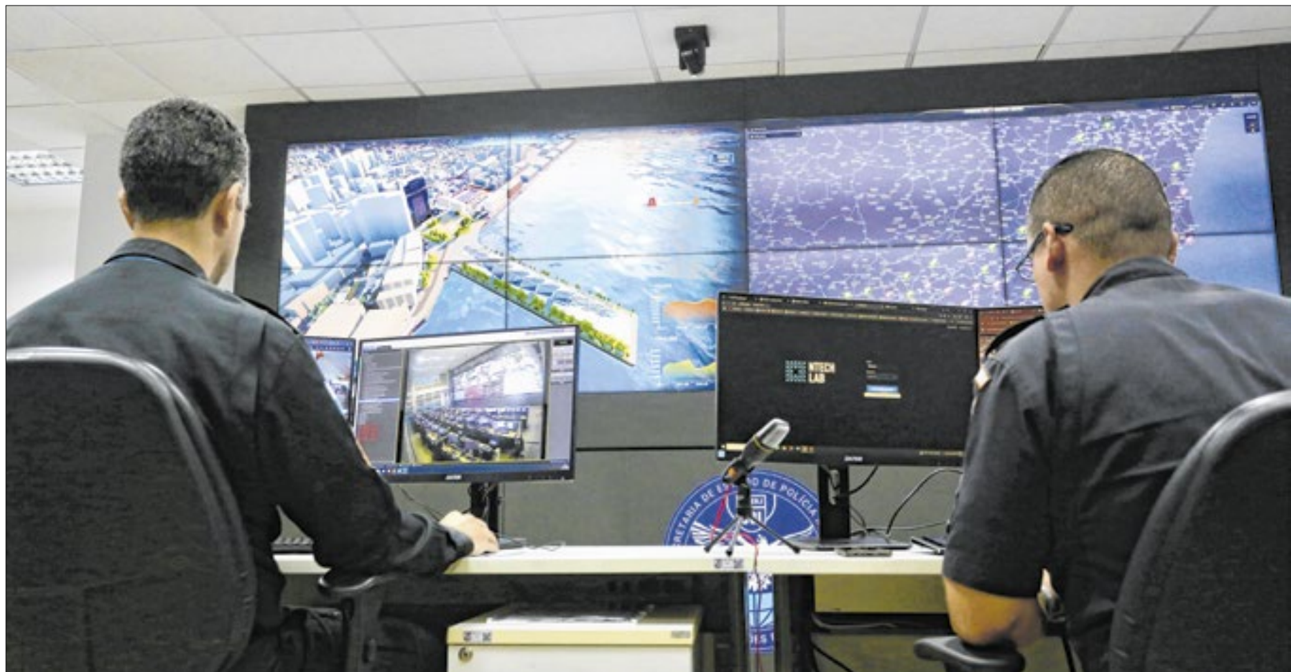
Governo investiu mais de 4 bilhões de reais na segurança pública e na valorização policial

O Governo do Estado tem destinado esforços e investimentos para promover o fortalecimento das forças de segurança, por meio da aquisição de novos recursos materiais para as áreas operacionais e de inteligência, como também para melhorar as condições de trabalho dos policiais, com obras de infraestrutura em unidades, compra de