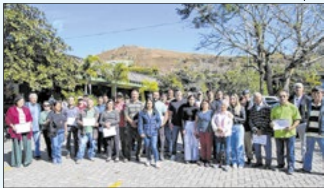
Trabalhadores foram homenageados no Horto