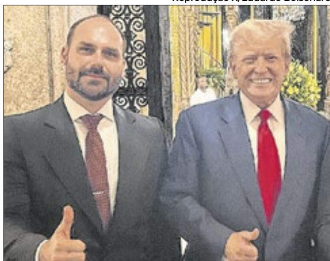
Eduardo e Trump: praticamente só ele acha legal