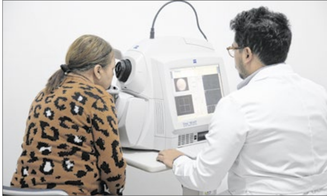
Mobilização faz parte de plano para acelerar atendimento a pacientes

“O Instituto Estadual de Olhos foi criado com o objetivo de oferecer assistência especializada. Começamos com as cirurgias de catarata e, neste sábado, realizamos os atendimentos para descolamento de retina. No dia