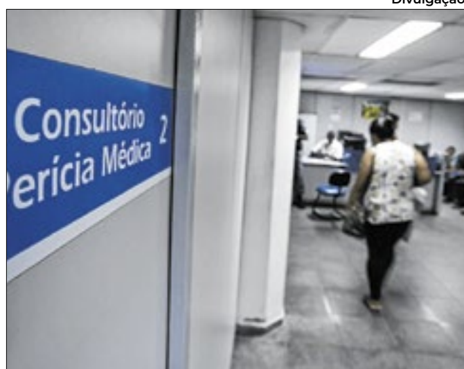
Peritos médicos federais vão atuar na Previdência