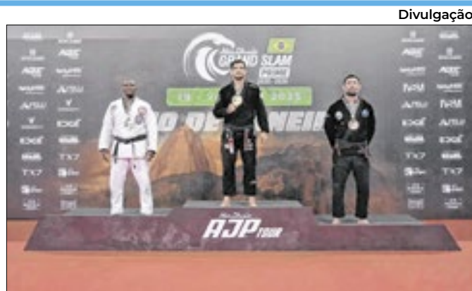
Torneio é promovido pelos Emirados Árabes Unidos