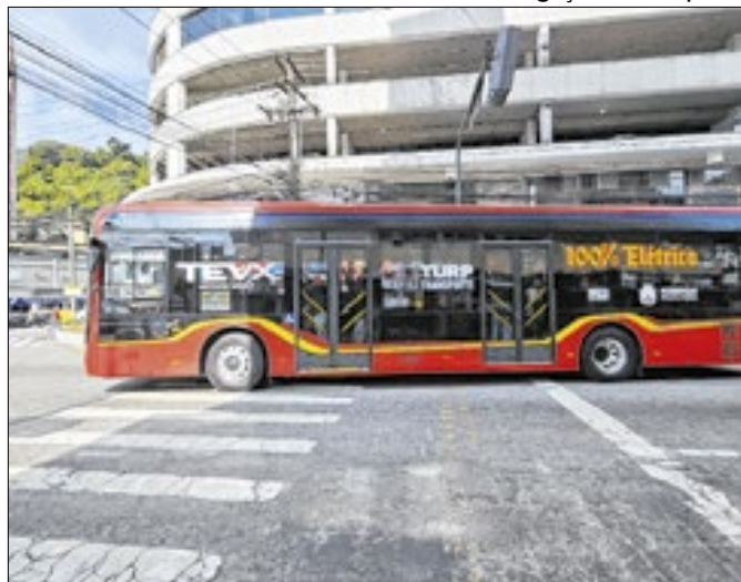
Veículo começou a operar na sexta-feira