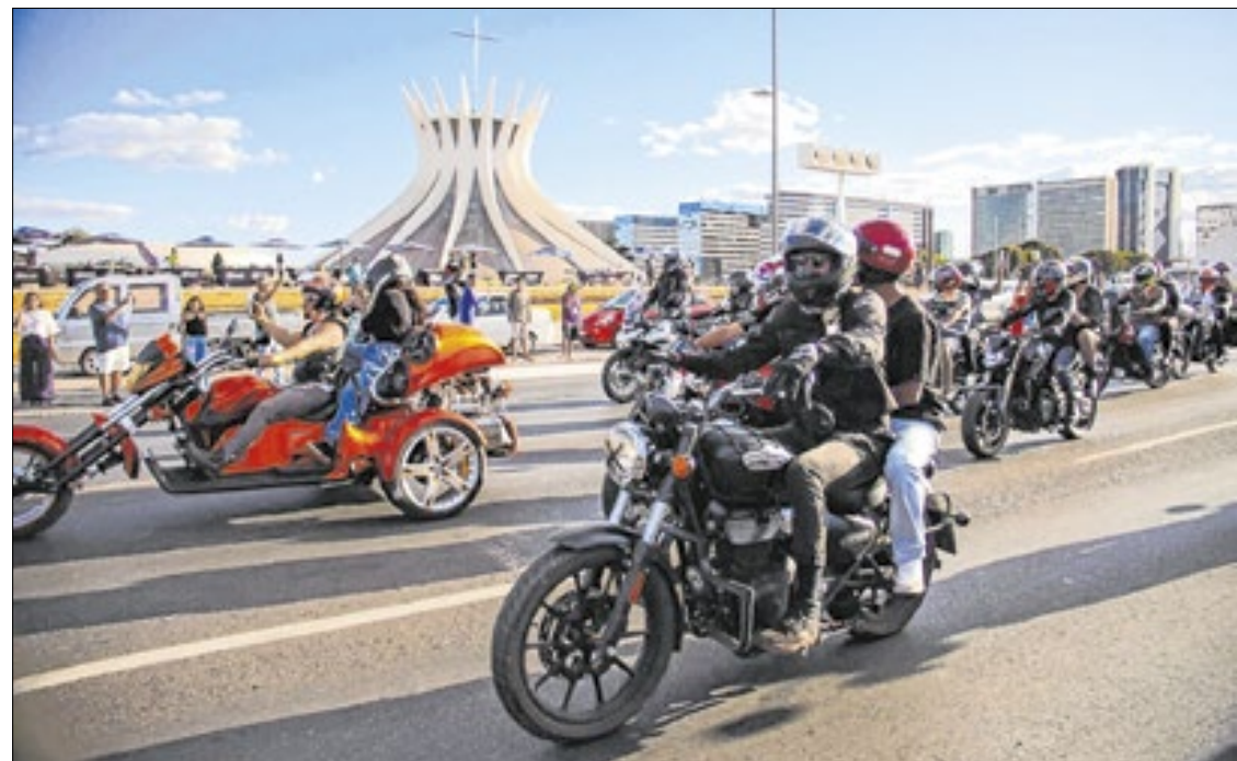
Até 2 de agosto, Brasília sediará o Capital Moto Week, maior evento de motos da AL

“O levantamento revela que esse avanço não se limita aos maiores centros urbanos nacionais: Alagoas, Amazonas, Bahia e Piauí lideram a lista, demonstrando que o uso da motocicleta tem se expan-