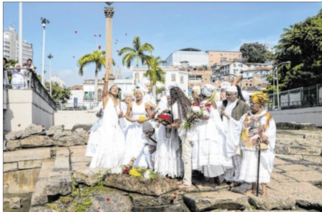
Evento promoveu atividades no local

Ao longo do dia, o evento promoveu uma série de atividades abertas ao público, incluindo uma mesa de debate sobre políticas públicas e anti-