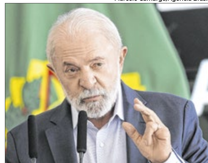
Lula avalia o risco de aumento de retaliações