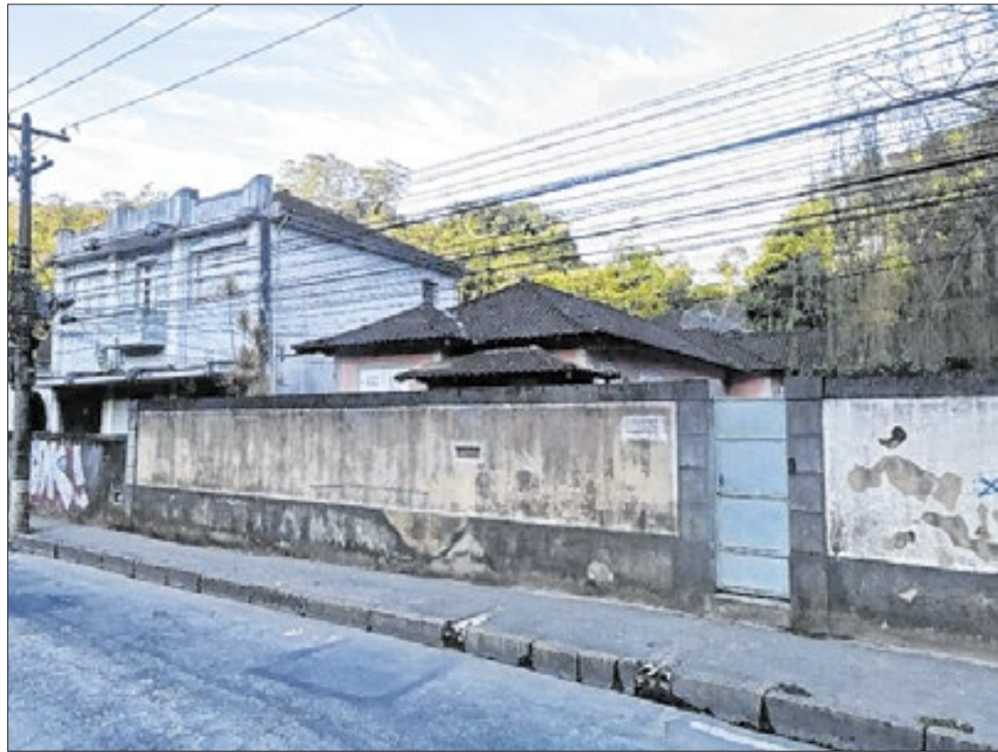
Revogação foi publicada no Diário Oficial da última quarta-feira

A Fábrica Patrone entrou com uma ação na 4ª Vara Cível de Petrópolis para tentar anular o decreto, alegando que a Prefeitura ignorou os riscos técnicos da área e não apresentou laudos que comprovassem a segurança do terreno para receber um equipamento público