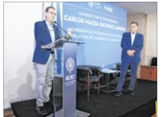
O prefeito do Rio, Eduardo Paes, durante participação do encontro na ACRJ