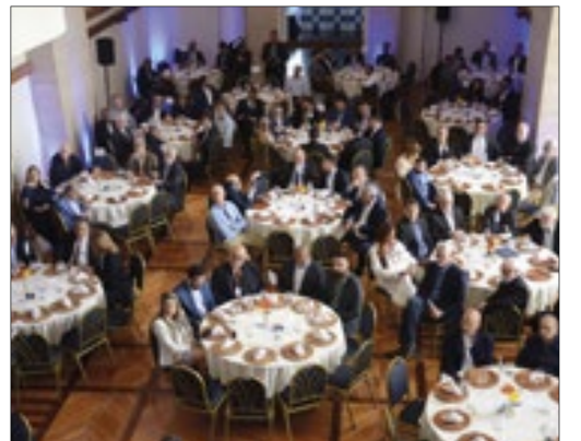
Evento reuniu gestores públicos e lideranças empresariais na ACRJ