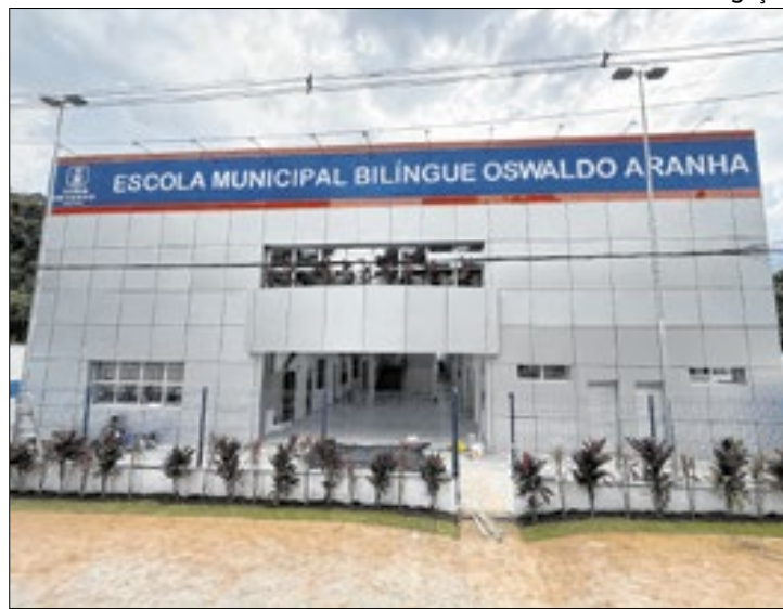
As escolas bilíngues são construídas no padrão da UFRJ

A Prefeitura de Duque de Caxias, em parceria com o Governo do Estado, está transformando o cenário da educação no município com a construção de escolas bilíngues e de creches modernas, ampliando o número de vagas. Projetadas pela Secretaria Municipal de Obras, as novas unidades visam oferecer mais qualidade de ensino, inclusão e infraestrutura adequada para os matriculados na rede pública de ensino municipal.