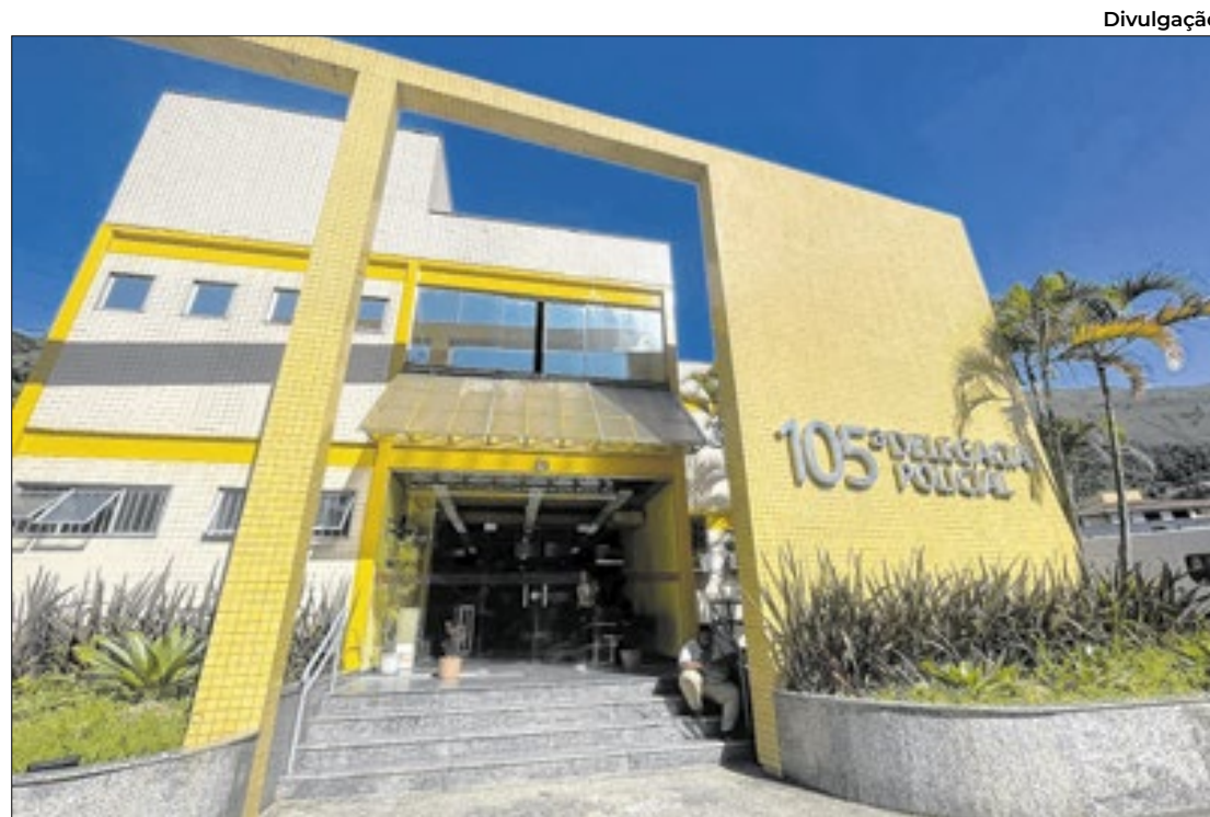
Índices apresentam aumento desde 2021

Segundo dados do Dossiê Mulher, outro painel do ISP, os crimes contra mulheres em Petrópolis vêm crescendo desde 2021. O total de registros saiu de pouco mais de 2.300 naquele ano para cerca de 2.900 em 2023, com pico anterior em 2019 (3.064 casos). O dossiê inclui diversos tipos de crimes com recorte de gênero — como estupro, feminicídio, ameaça,