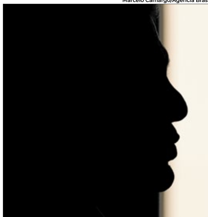
Haddad estima que dez mil empresas serão prejudicadas

A carta contesta as justificativas dadas pelo republicano ao anunciar as sanções, previstas para entrarem em vigor