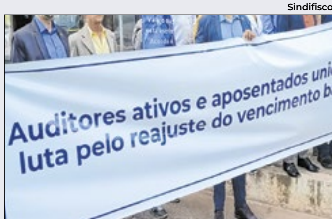
Greve de auditores-fiscais acabou em 11 de julho

O concurso público para provimento de cargos de perito médico federal foi realizado em fevereiro, contemplando 250 vagas e formação de cadastro reserva. As vagas iniciais priorizam a região Nordeste, que conta com o maior número de vagas: 159.