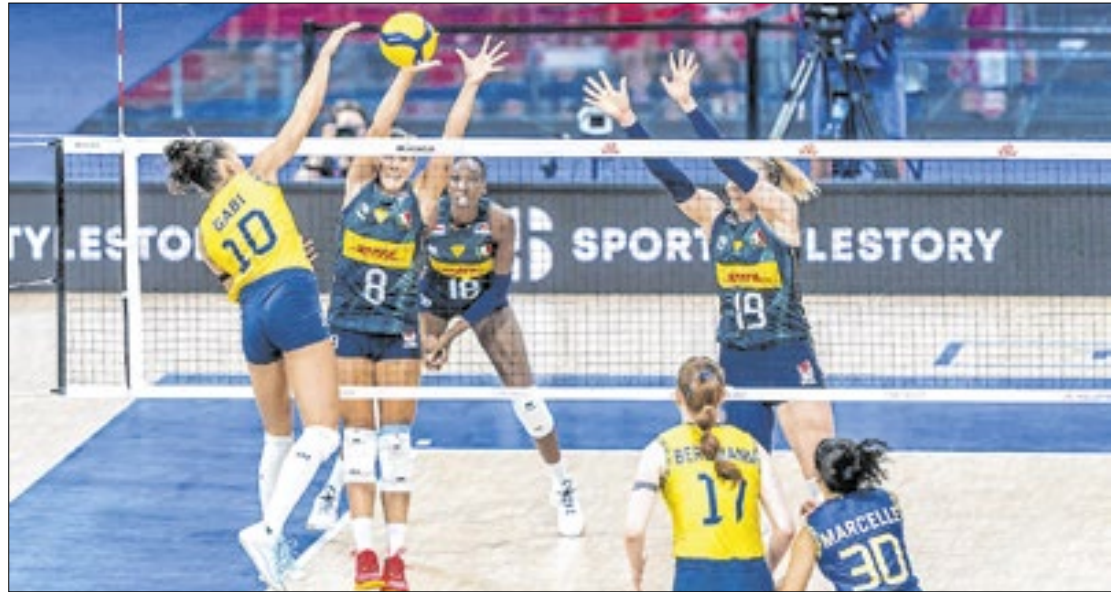
A Itália foi indiscutivelmente a melhor equipe desta edição da Liga das Nações

Na final deste domingo, a seleção brasileira começou o primeiro set com mais desenvoltura em quadra, abrindo quatro pon-