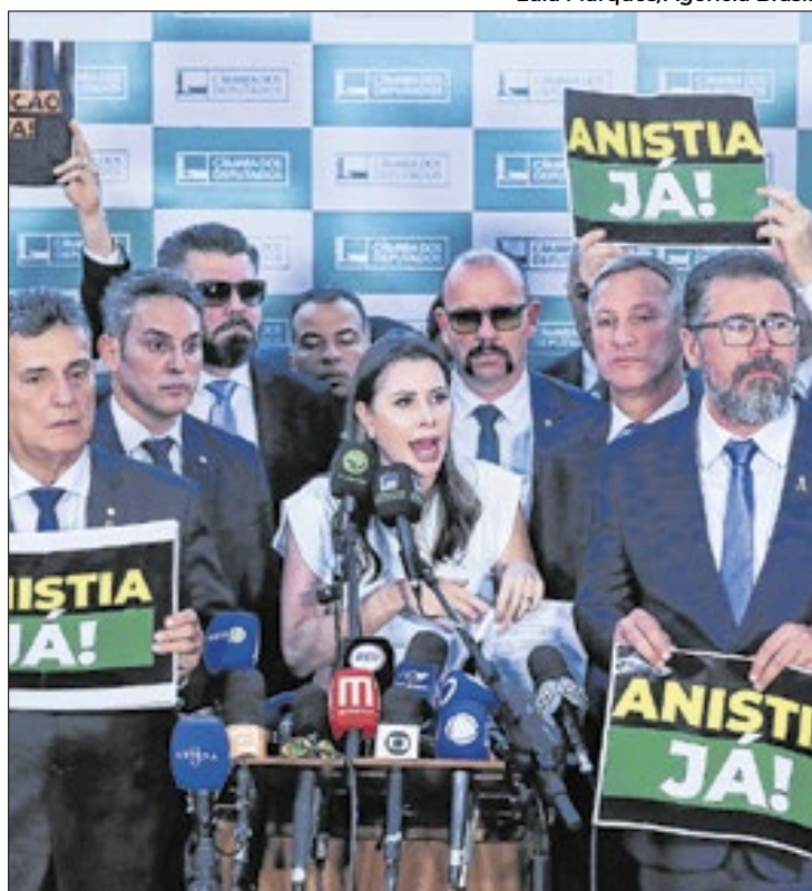
Proibição do uso do Congresso restringiu ações

Com a organização, o ministro do STF, Alexandre de Moraes, determinou pela retirada dos parlamentares mani-