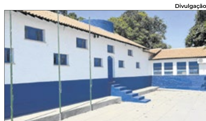
Intervenções realizadas durante as férias

O Instituto de Olhos já realizou 71.276 exames — entre eles ultrassonografia, tomografia e biometria ultrassônica ocular — além de 6.644 consultas e 498 cirurgias de catarata, beneficiando moradores de 66 municípios de todo o estado.