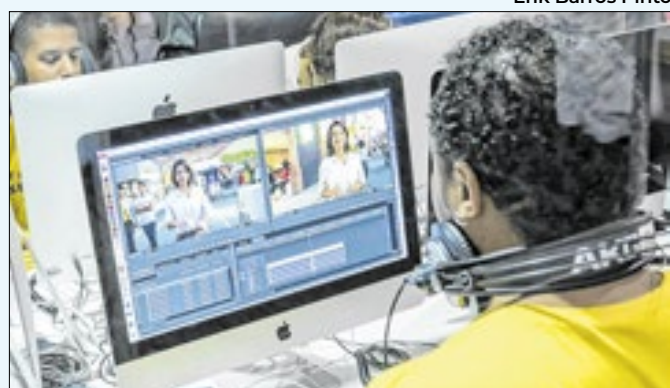
Há oportunidades nas áreas de TI e audiovisual