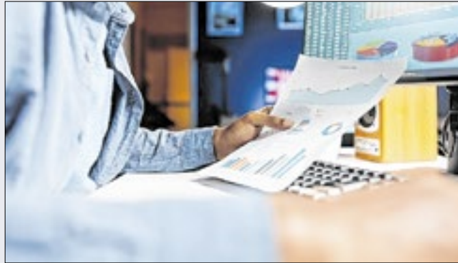
Auditores independentes analisaram 254 relatórios