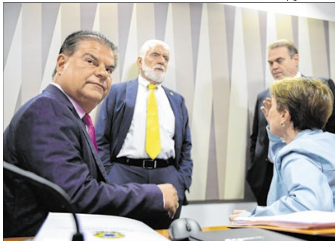
Senadores vão aos EUA para “reabrir canais de diálogo”

A comitiva cumpre ao mesmo tempo um papel político importante e delicado. Importante porque insere o Congresso Nacional nos esforços para tentar evitar o tarifaço ameaçado por Trump. Delicado porque, nos Estados Unidos, o filho do ex-presidente Jair Bolsonaro, Eduard Bolsonaro, ten-