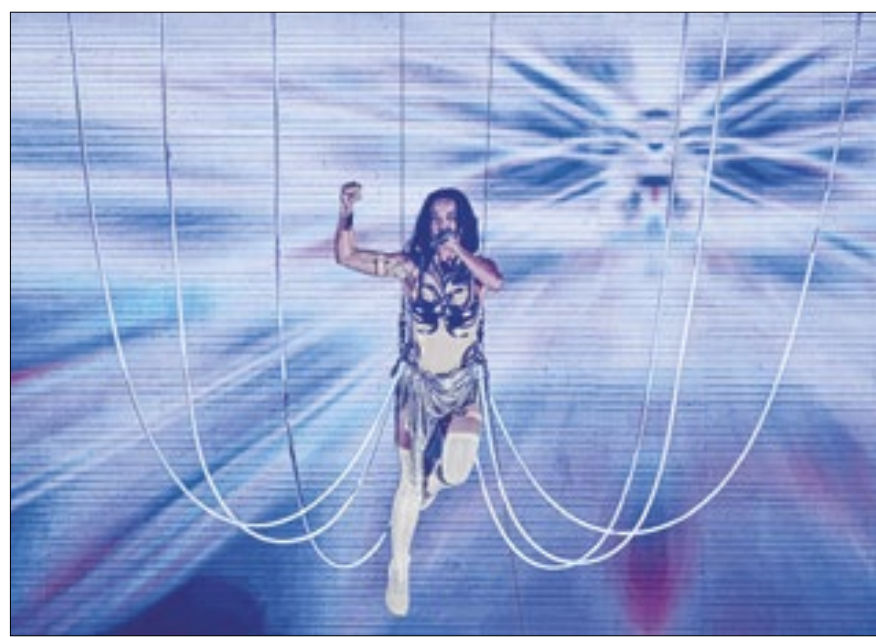
Katy Perry é uma das artistas mais aguardadas no The Town

abertura de Di Ferrero, que leva seu novo projeto “The Hard Pop Party” para a Cidade da Música. A São Paulo Square recebe Snarky Puppy, Leo Gandelman e a São Paulo Square Big Band com as vozes icônicas de Alaíde Costa e Claudette Soares. No palco Quebrada, Kayblack e Duquesa representam o novo som das periferias. No Factory estão TZ da Coronel, ALEE, Brô MC’s e Kaê Guajajara. E na The Tower Experience, o comando é do duo Dubdogz.