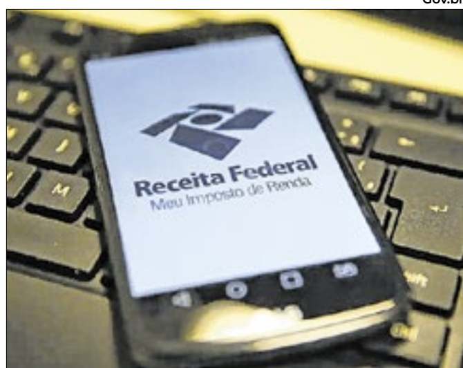
Consulta pode ser feita pelo aplicativo da Receita