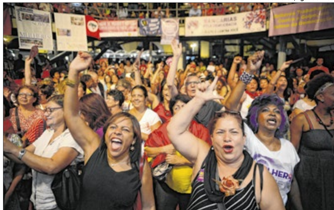
O prazo para preencher o cadastro de inscrição termina em 13 de agosto

As inscrições estão abertas para duas categorias distintas: Mulheres e Coletivos. A primeira é voltada exclusivamente para mulheres negras, cisgênero ou transgênero, maiores de 18 anos, com atuação comprovada em arte ou cultura há pelo menos um ano. A segunda categoria contempla grupos não formalizados, que tenham como representante uma mulher negra e com atividades