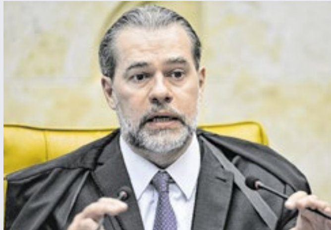
Ministro Dias Toffoli foi relator do caso no Supremo