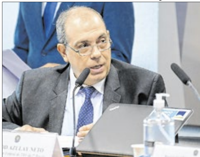
Ministro Messod Azulay Neto questiona uso do celular