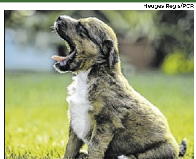
O projeto é uma experiência nova para adoção