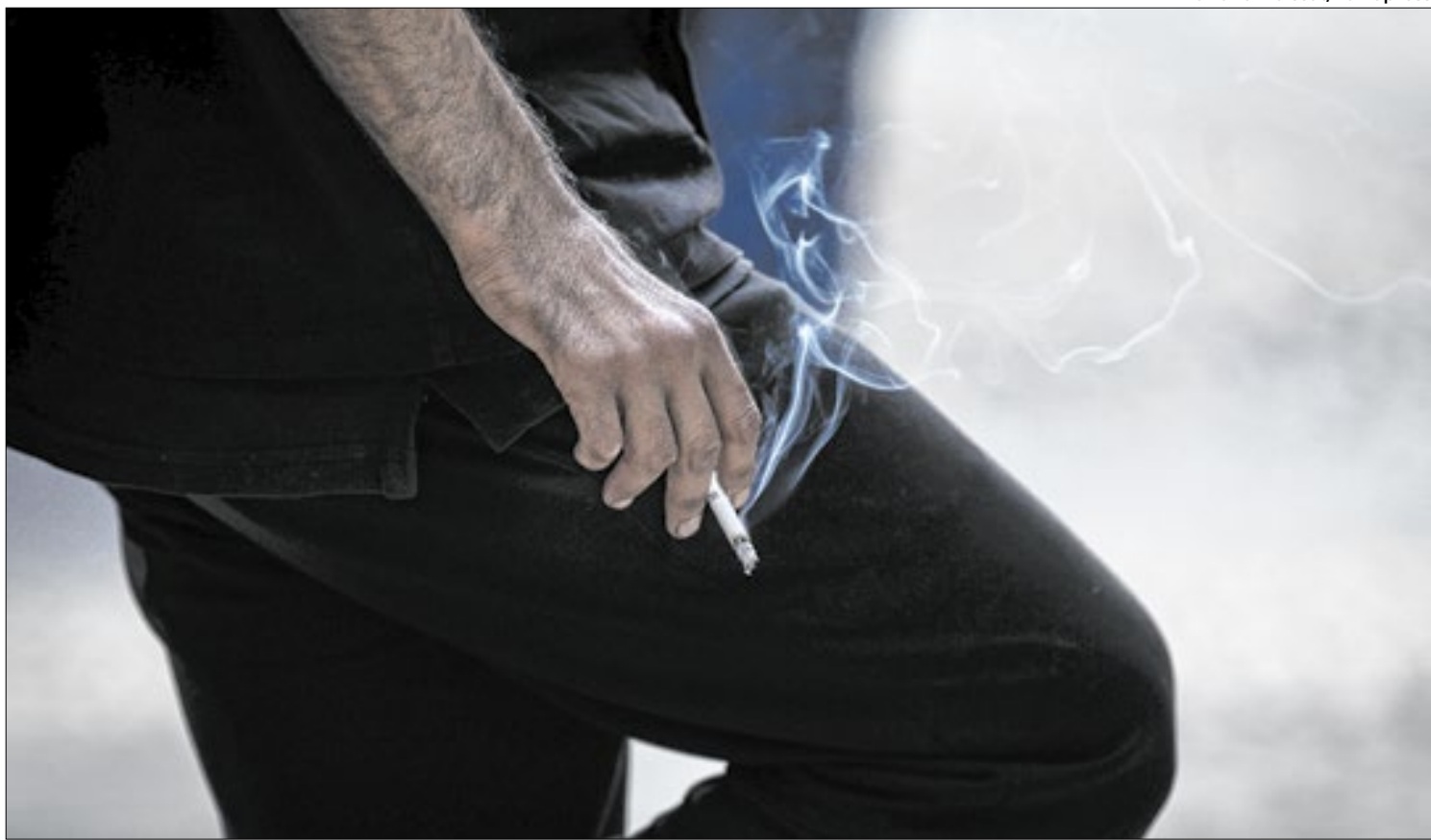
Tabaco está no chamado ‘imposto do pecado’, da reforma tributária

aumentou a força de trabalho disponível na vara especializada. Sediada em Porto Alegre, a unidade tem abrangência estadual e teve esforços somados a partir da implementação de regime de exceção, inclusive por compartilhamento de jurisdição.