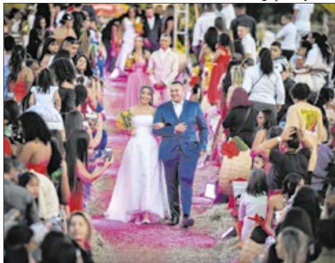
Cerimônia gratuita atenderá até 400 casais