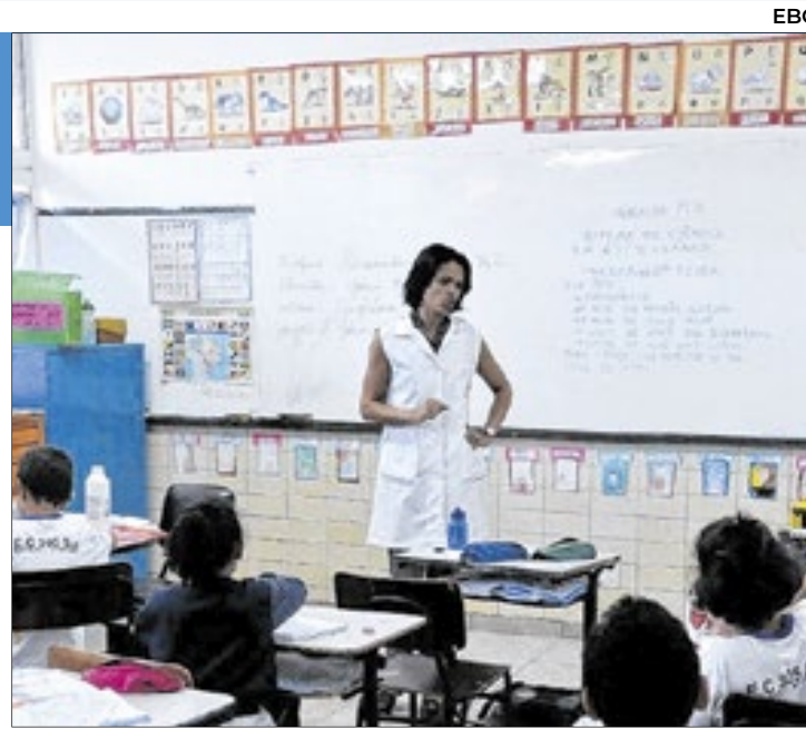
Professores do ensino básico estão entre as carreiras onde poderá haver nomeações em 2026

Inicialmente, O GDF havia pedido para nomear 29.676 cargos - e os deputados distritais, por meio de 207 emendas apresentadas ao projeto de lei, aumentaram em quase duas vezes e meia esse número. Neste ano, cada um dos 24 distritais pôde