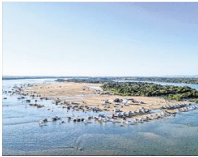
Shows e natureza agitam a Araguabeach 2025