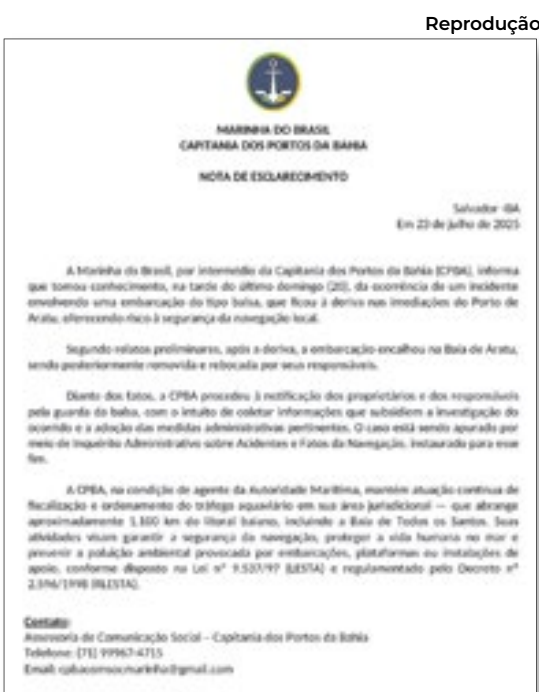
Reprodução Marinha enviou nota ao Correio da Manhã

Diante dos fatos, a CPBA procedeu à notificação dos proprietários e dos responsáveis pela guarda da balsa, com o intuito de coletar infor-