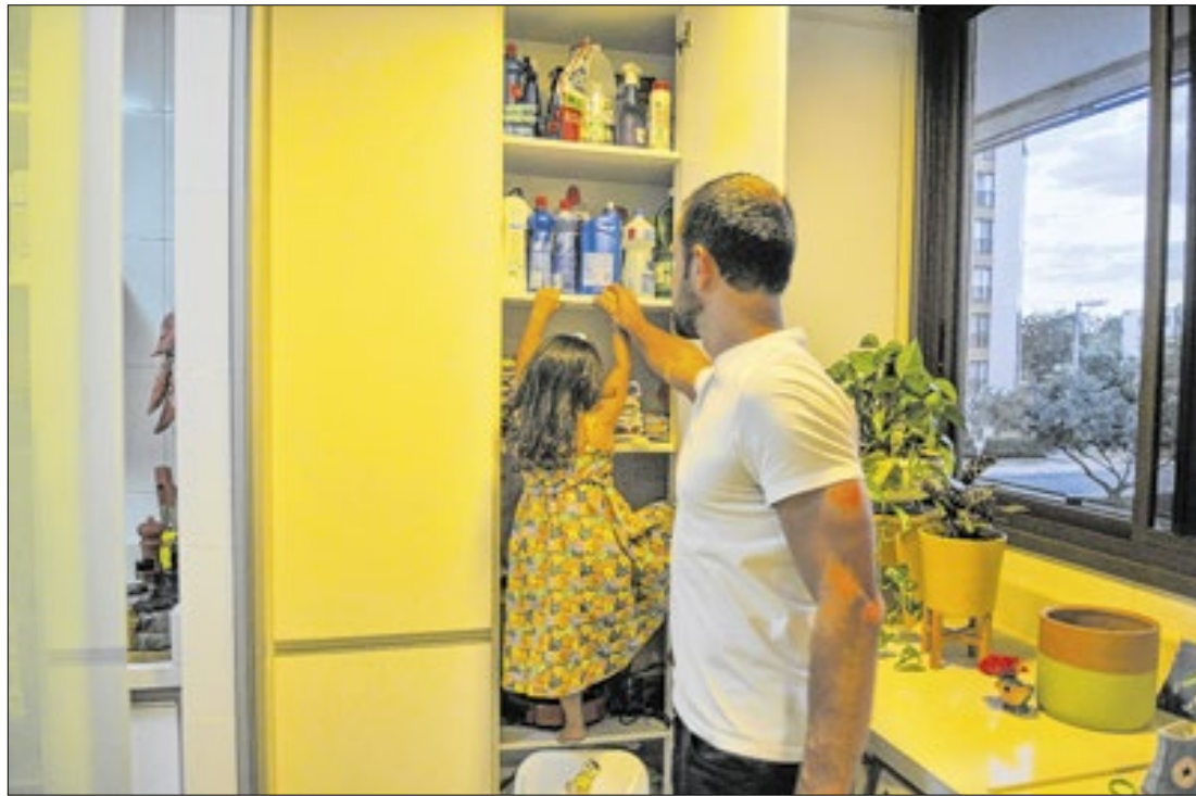
País devem ficar atentos especialmente durante as férias