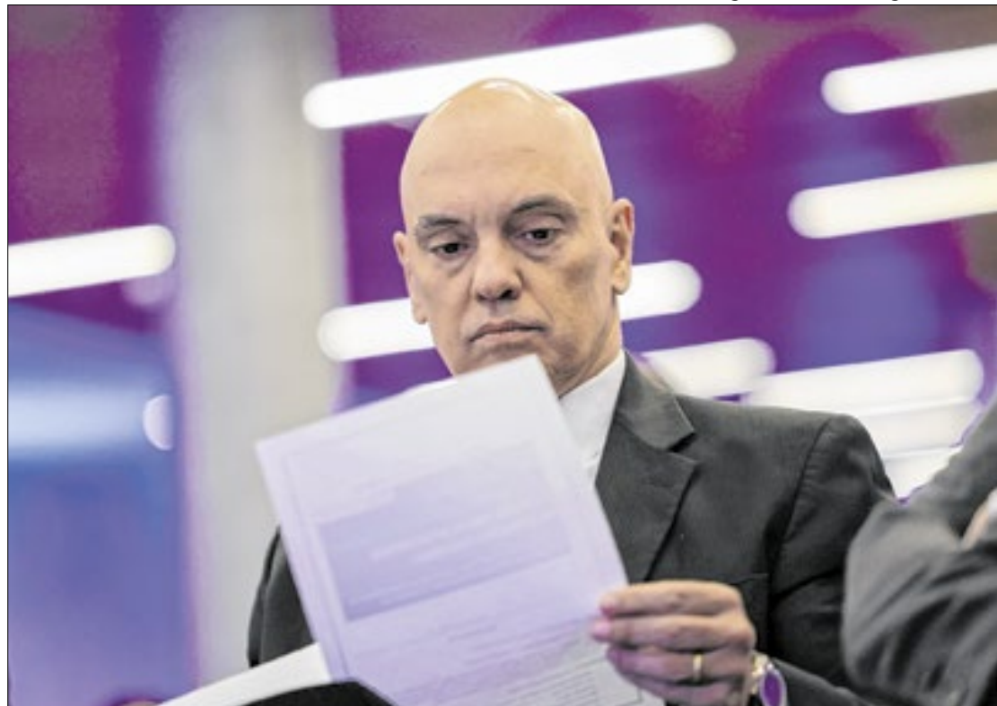
Moraes ainda não decidiu o que fará após resposta dos advogados