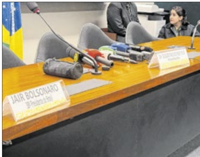
Silenciamento de Bolsonaro é o primeiro problema