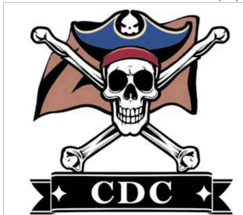
A CDC não possui licença e nem outorga para operação portuária. É uma empresa “pirata” no setor ignorando regulação