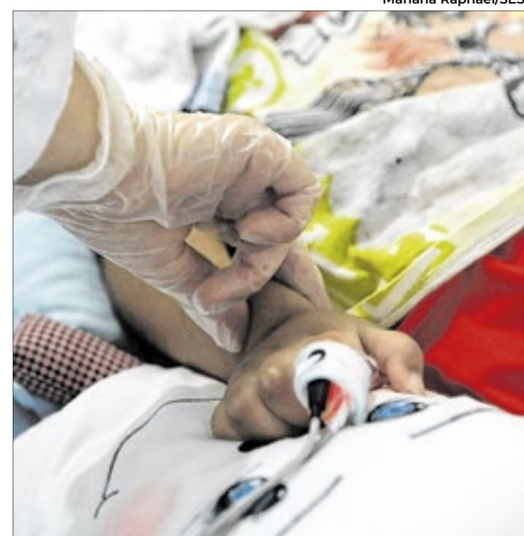
Familiares se queixam de piora no atendimento domiciliar

Em nota, a SES não respondeu aos questionamentos da reportagem. Disse apenas que trabalha de maneira transparente com os órgãos de controle.