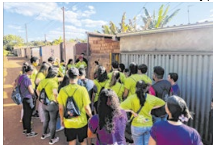
Ações fortalecem o trabalho voluntário em rede

Fazer acontecer uma realidade nova, bonita e melhor para todos. Julho é o mês de recesso escolar, porém, concentra uma intensa programação para estudantes do 9º ano EF ao Ensino Médio e ex-alunos do Marista Brasil que voluntariamente optam por um “verdadeiro itinerário de encontro com o outro do jeito como Maria pensou”. Isso porque é justamente nessa época que os Colégios e Escolas Maristas realizam as ações do Missão Solidária Marista (MSM), envolvendo várias regiões do país em prol de ações sócio transformadoras relacionadas a diferentes experiências e ações práticas de voluntariado.