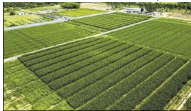
Cultivos apresentados unem ciência e produção rural