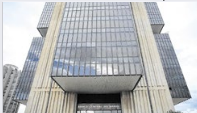
Copom, do Banco Central, que decide a taxa Selic