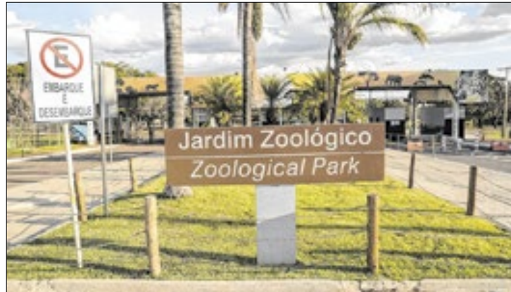
Atividades educativas e recreativas no fim de semana