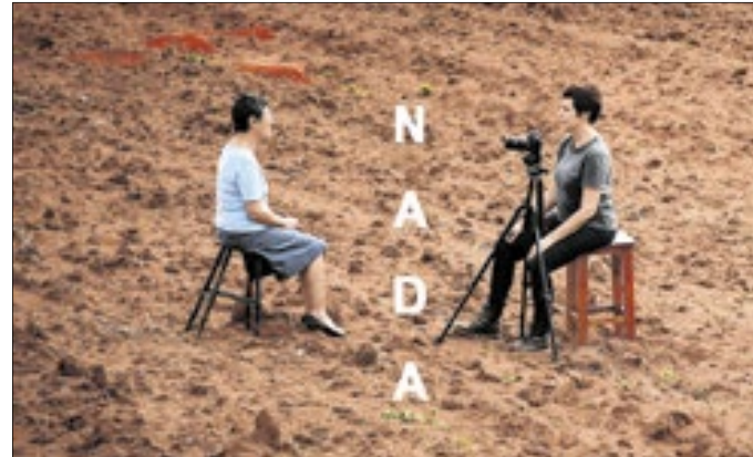
"NADA" conduz o espectador a uma reflexão sobre lembrar, esquecer e seguir adiante