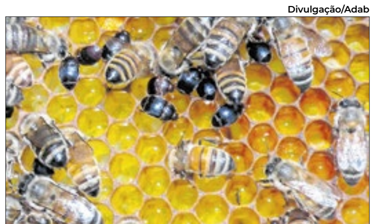
O Apicultor deve ficar atento às características físicas