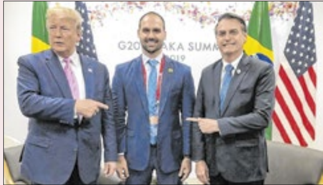
Eduardo puxa para si tarifaço de Trump