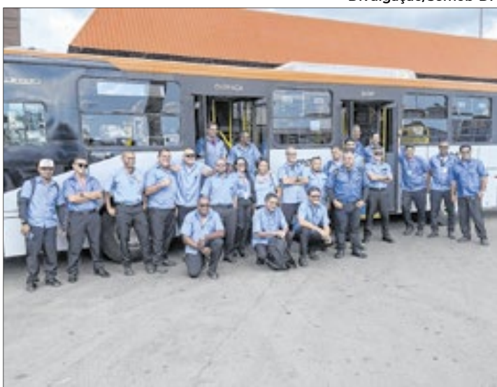
Motoristas da Viação Marechal, que participaram de treinamento ano passado, promovido pela Semob-DF

Desde então, esta coluna observações e também sugestões.