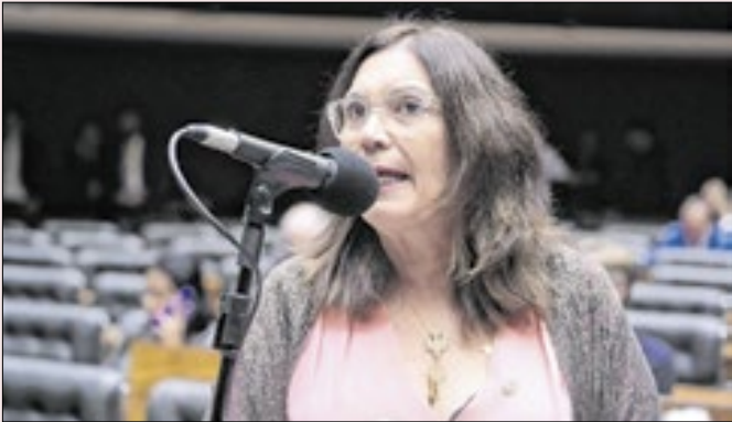
Bia quer uma das vagas da direita ao Senado