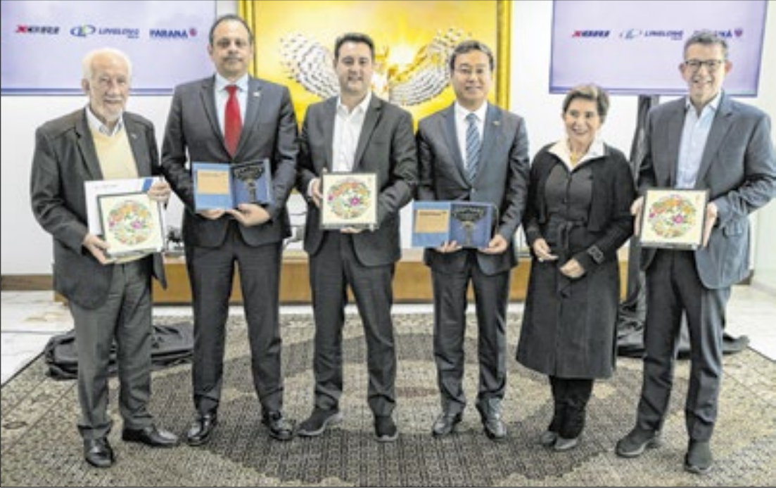
O anúncio foi feito nesta quarta-feira (4) ao governador Carlos Massa Ratinho Junior

O Paraná vai ganhar mais um empreendimento bilionário, que consolida o Estado como um dos maiores polos da cadeia automotiva do Brasil. Em parceria com a multinacional chinesa Linglong Tire, a brasileira XBRI Pneus vai investir US$ 1,2 bilhão (R$ 6,7 bilhões na cotação atual) para a instalação de uma fábrica de última geração de pneus na cidade de Ponta Grossa, nos Campos Gerais.