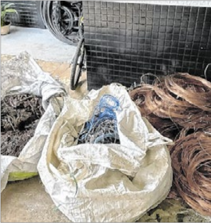
Mais de 40 km de cabos já foram roubados este ano