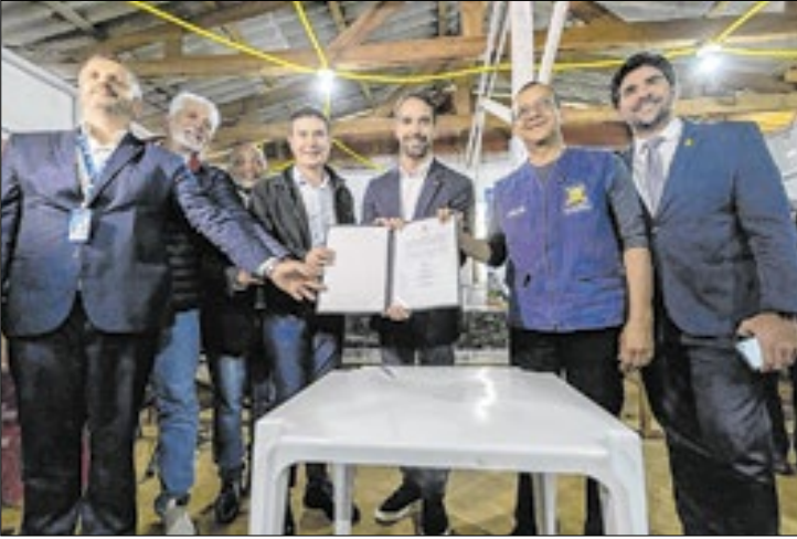
Recursos beneficiarão coletivos urbanos em 1.600 unidades

O governador Eduardo Leite e o secretário de Habitação e Regularização Fundiária (Sehab), Carlos Gomes, assinaram, nesta quarta-feira (4/6), um protocolo de intenções entre o Estado e a Caixa Econômica Federal para incluir, na Lei Orçamentária Anual 2026, um investimento de R$ 34 milhões no programa Porta de Entrada - Entidades. A iniciativa permitirá a construção de 1.689 unidades habitacionais em Porto Alegre e em mais 10 municípios.