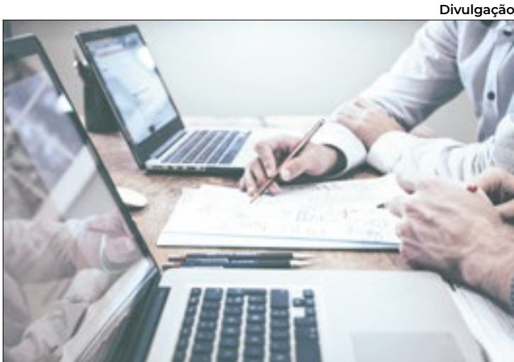
Foram registrados mais de 6,9 mil novos negócios

Maio também apresentou um significativo aumento em relação ao ano passado. O número registrado em 2025 é 16,6% maior do que o computado em 2024, quando foram abertas 5.953 empresas. Entre as atividades estão serviços de escritório; consultórios de psicologia e psicanálise; consultórios médicos ambulatoriais;