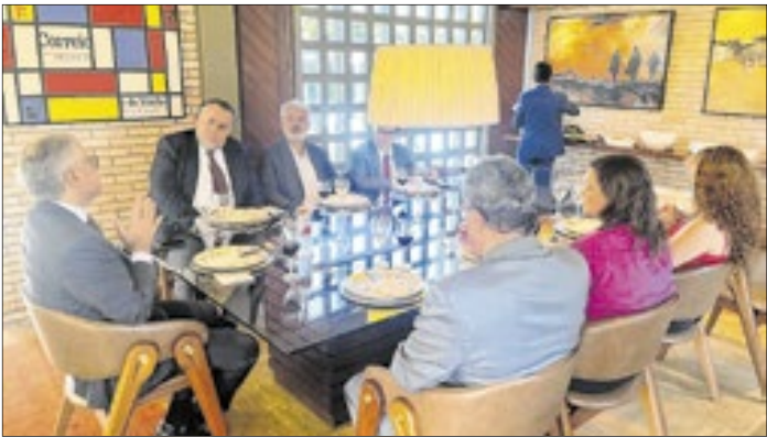
Durante o almoço, o presidente da OAB-DF falou sobre o trabalho das comissões que estão acompanhando os vários temas de interesse do DF