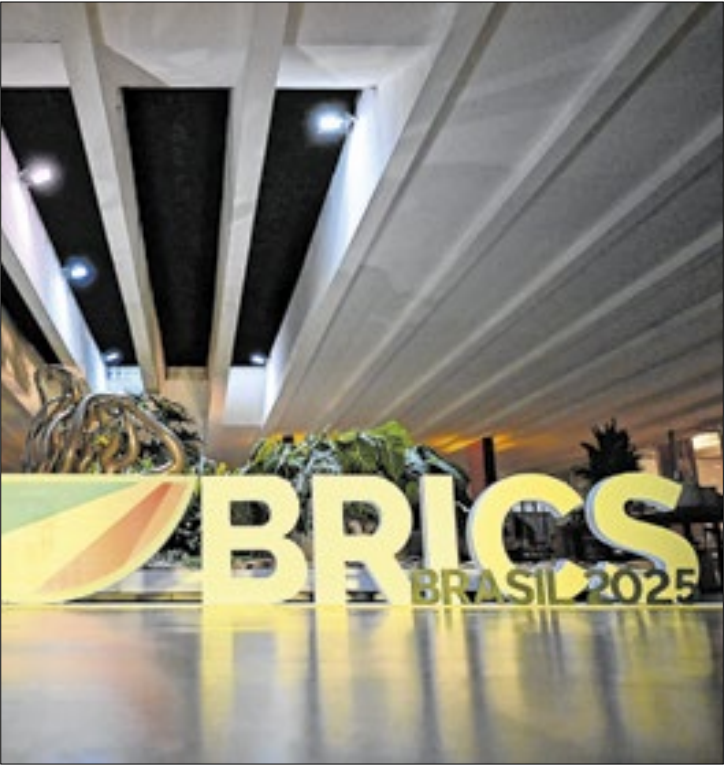
Fórum parlamentar se encerra nesta quinta

Em seu discurso na abertura do evento, Hugo Motta destacou a relevância do encontro entre os parlamentares de mais