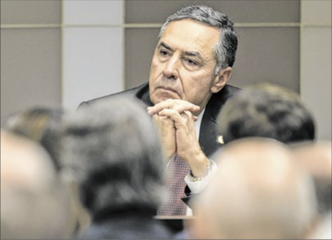
Barroso rebateu ideia de que STF quer legislar sobre o tema