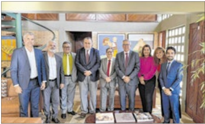
A equipe do “Correio da Manhã” e os convidados da OAB-DF, recepcionados na “Casa CM”