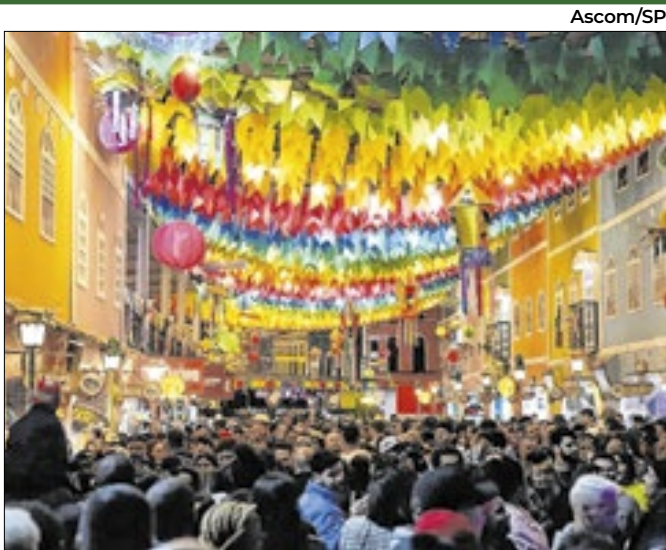
Arraiás aquecem o turismo de compras no Estado