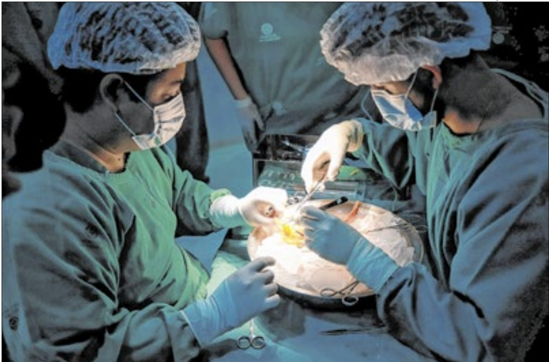
Transplante de rim é o mais realizado