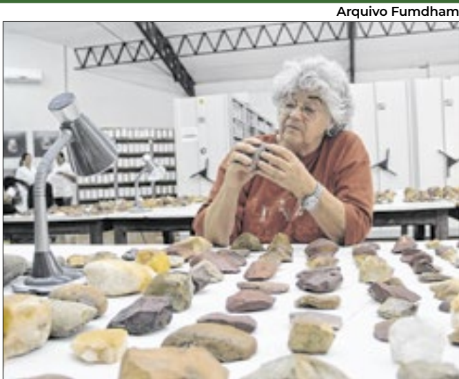
Arqueóloga liderou pesquisas sobre homem nas Américas

Investimento de R$ 49 mi terá reforço em equipamentos diversos