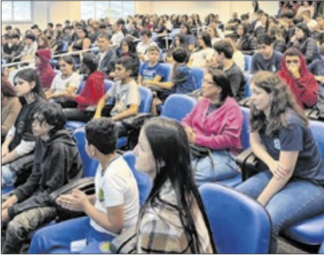
O evento foi no auditório da Cerpalo

O Conselho Estadual da Juventude (Conjuve/SC) realizou na tarde desta quarta-feira, 4 de junho, em Paulo Lopes, o 2º Encontro Fórum das Juventudes. O evento foi no auditório da Cooperativa de Eletricidade de Paulo Lopes (Cerpalo) e reuniu centenas de jovens. “Foi um dia muito produtivo. Conseguimos reunir quase 150 jovens e falar da importância do Conselho no município, mostrar por meio de dinâmicas o quanto é importante eles terem voz na sua cidade,