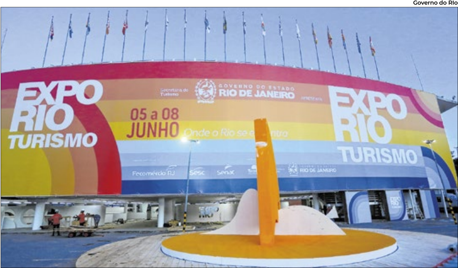
Evento terá ainda gastronomia, cultura, artesanato e painéis temáticos

Evento acontece no espaço Lagoon, no Rio, e terá atrações culturais, experiências imersivas e os principais destinos das 12 regiões do estado