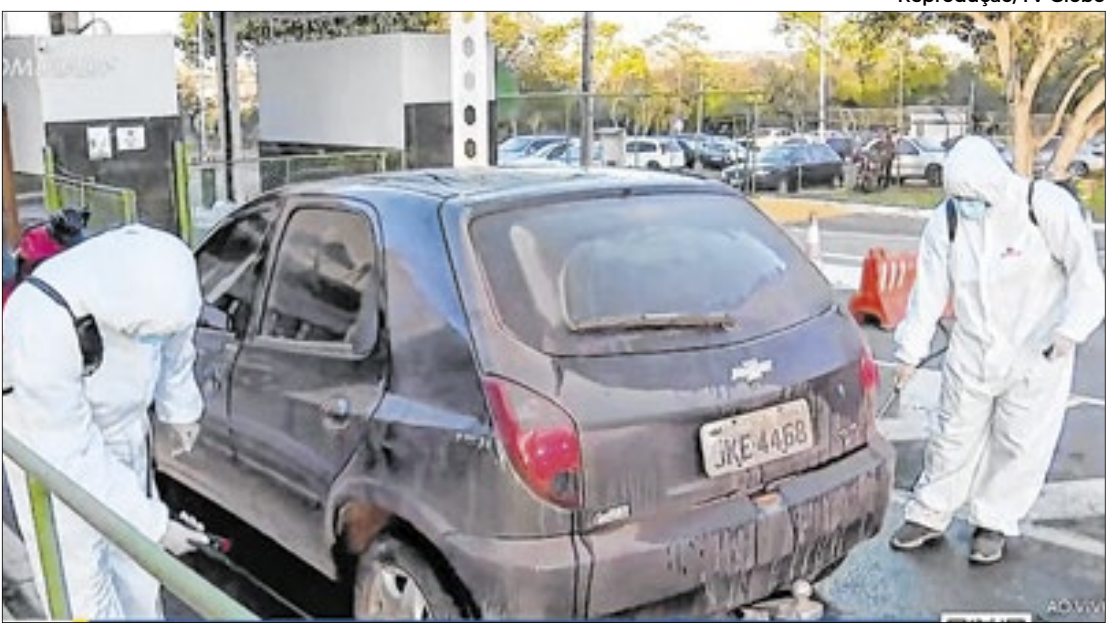
Os poucos veículos que entram no Zoo passam por desinfecção para evitar contaminação

Zoológico de Brasília”, afirma a Agência Brasília, site oficial de notícias do GDF. “Até o presente momento, as aves do plantel da instituição não apresentaram nenhuma sintomatologia. Isso é importante quando a gente trata de um vírus facilmente difundido e que tem uma alta letalidade e transmissibilidade. O fato de não termos animais com sintomas é um sinal muito positivo para nós”, destacou o secretário de Agricultura, Abastecimento e Desenvolvimento Rural, Rafael Bueno. O titular da pasta lembrou que o DF está em estado de emergência zoossanitária desde 2023, quando foram adotadas as medidas protocolares estabelecidas pelo Ministério da Agricultura e Pecuária (Mapa). O caso foi identificado rapidamente devido ao trabalho de acompanhamento da saúde dos animais dentro do zoo, evitando assim a proliferação da doença. Coube à Seagri a coleta da amostra e necropsia para envio para o laboratório