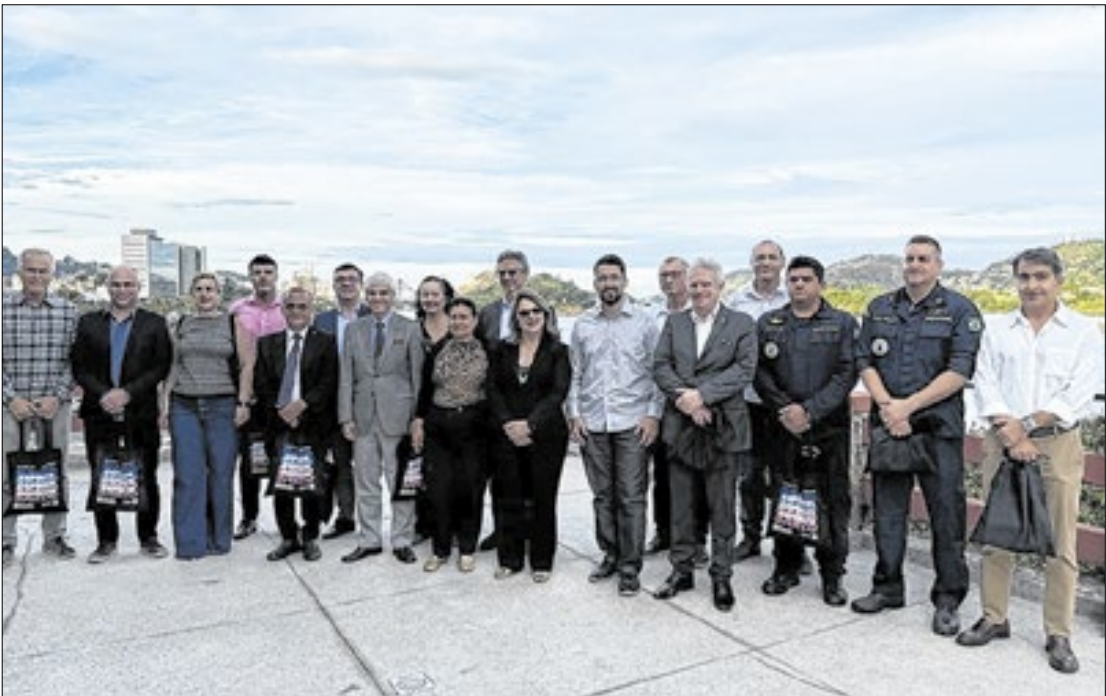
Durante a reunião, foram discutidos pontos essenciais para garantir estrutura adequada

Setur se reúne com representantes do setor náutico e turístico