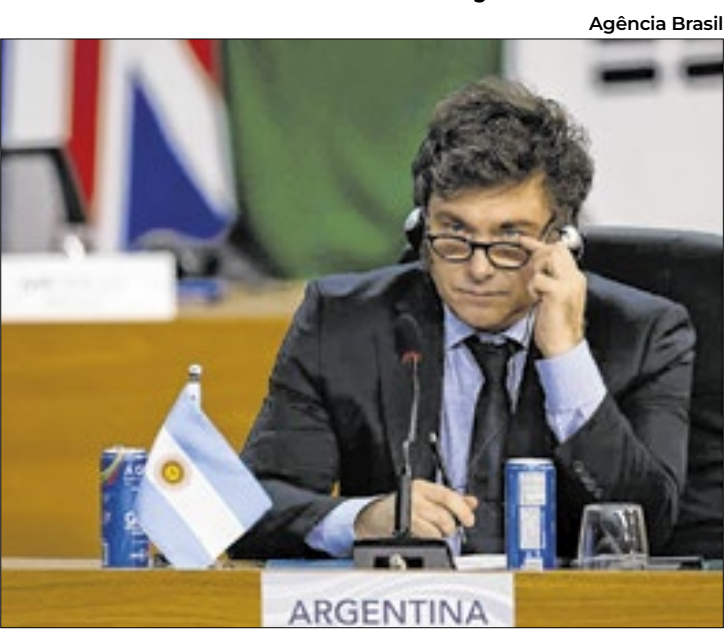
Milei está sendo criticado até por aliados pelos reajustes

Na última segunda (2), cerca de mil pessoas - incluindo médicos, apoiadores e famílias de pacientes - participaram de uma mobilização segurando velas em frente ao Obelisco, no centro de Buenos Aires, para exigir aumento salarial. O protesto foi organizado após idas e vindas na negociação com o governo Milei. Apesar de o hospital, de administração federal, ter anunciado um aumento nos pagamentos, os residentes afirmam que não houve aumento real e estão em greve. Os salários dos enfermeiros com dez anos de serviço não che-