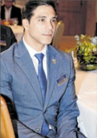
O cônsul-geral do Panamá no Rio de Janeiro, Ruben Arguelles