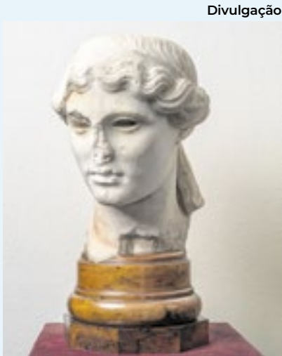
Mostra na Casa Eva Klabin reúne obras do acervo e fotografias contemporâneas para revelar como a mitologia greco-romana ainda ecoa nos dias de hoje