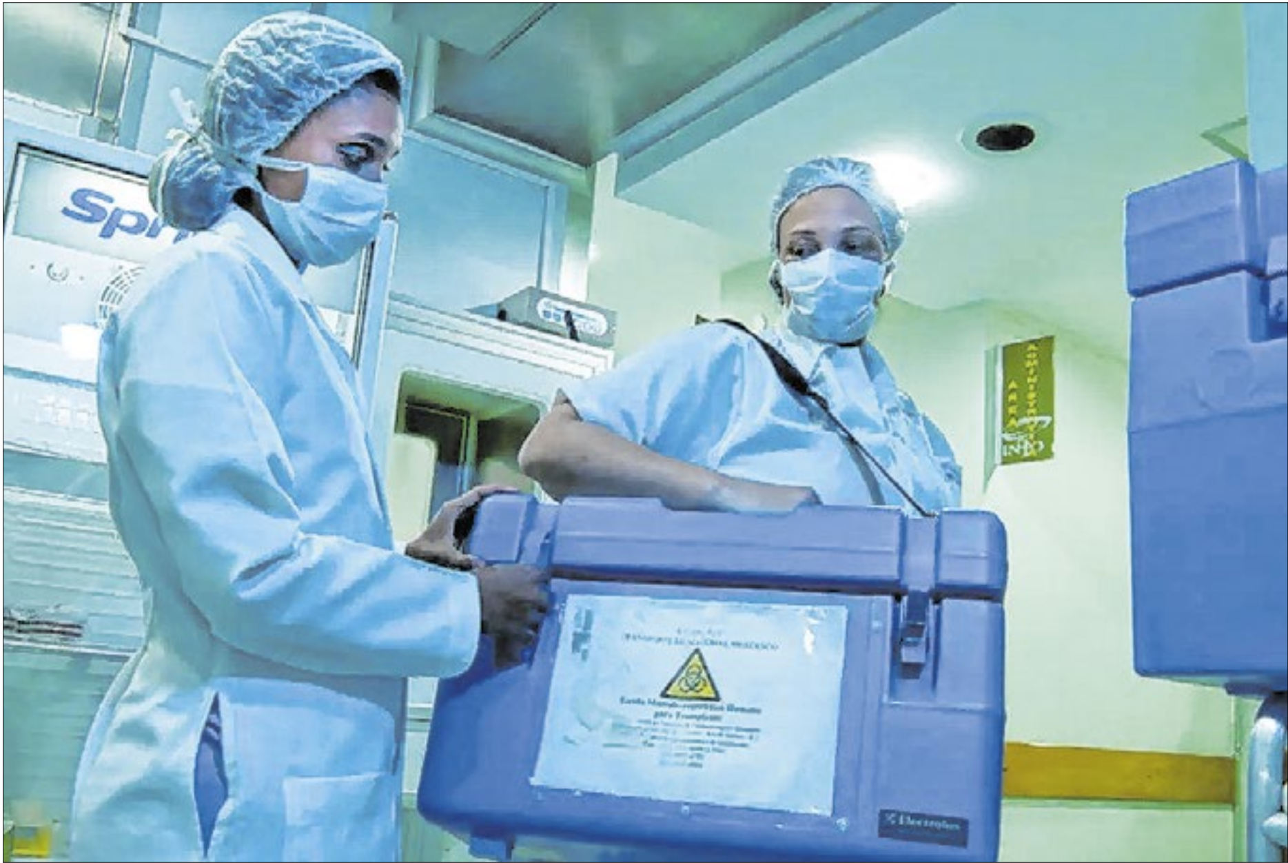
Brasil é o país que mais realiza transplantes pela rede pública de saúde

Atualmente, cinco hospitais realizam transplante de intestino delgado e multivisceral: um no Rio de Janeiro (RJ) e quatro em São Paulo, entretanto até a assinatura da portaria esse tipo de transplante não era disponibilizado na rede pública. A expectativa agora é que haja uma ampliação do procedimento.