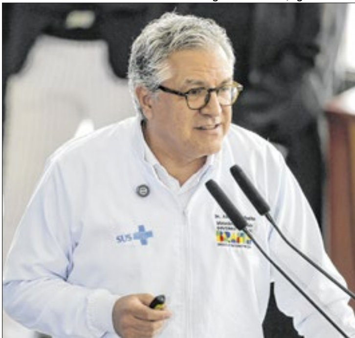
Padilha comemorou o recorde no número de transplantes