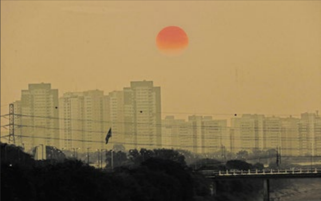
Impactos como calor excessivo e poluição do ar foram os mais citados

Uma pesquisa feita com internautas brasileiros de dez capitais investigou a forma como eles percebem as mudanças climáticas. Os impactos mais urgentes, como calor excessivo e poluição do ar, foram os mais citados pelos entrevistados