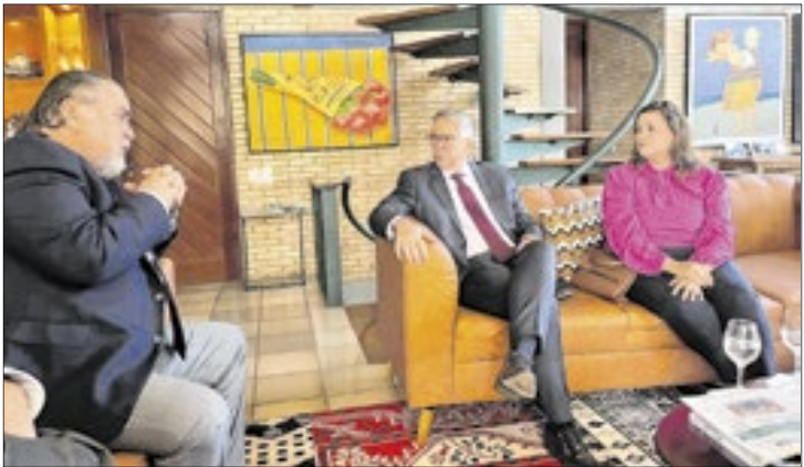
A conversa no “Correio da Manhã” tratou de temas como liberdade de imprensa e prerrogativas dos advogados