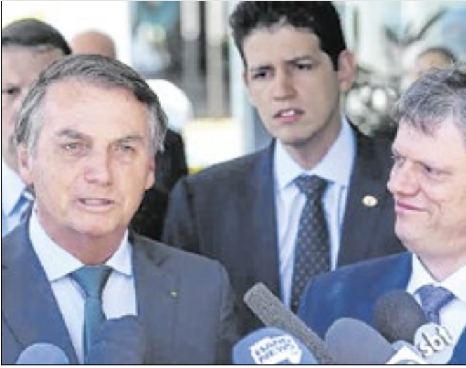
Bolsonaro estará com Tarcísio em 2026?