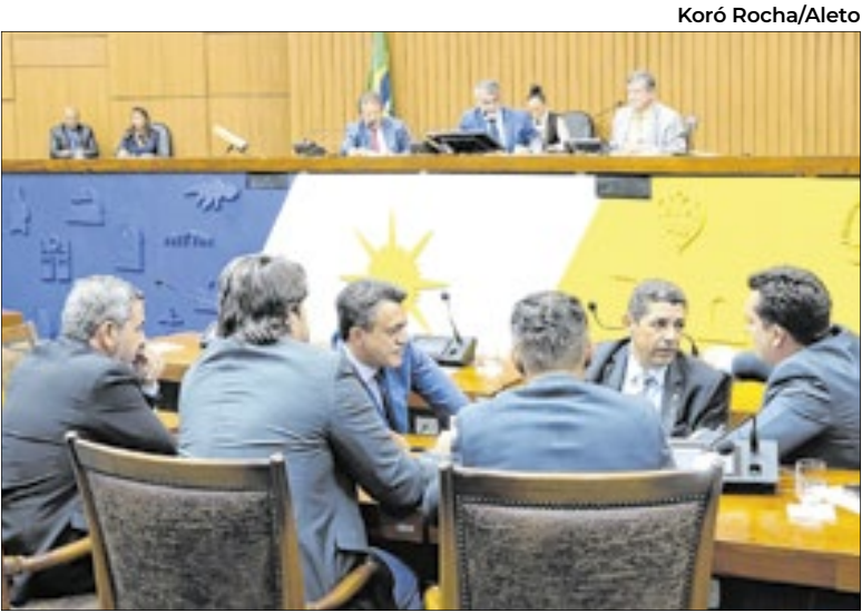
A medida busca acompanhar as transformações digitais

A Novacap foi escolhida para receber a Láurea ao Mérito, principal prêmio da engenharia brasileira. A homenagem reconhece sua atuação na construção de Brasília e em projetos de sustentabilidade. A premiação será em outubro, durante o maior evento do setor no país. A escolha foi feita por votação do conselho de engenharia.