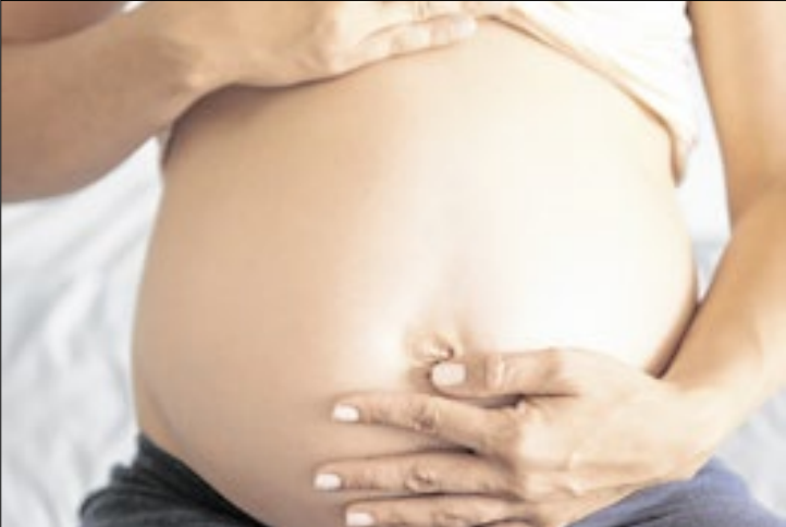
Estudo mostra que consumo pode levar a deficiências