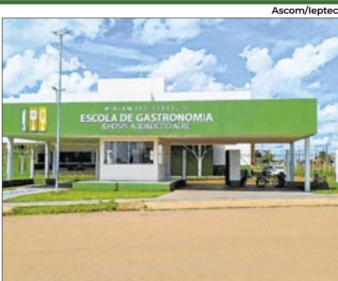
Vagas para confeitiro, pizzaiolo e panificação