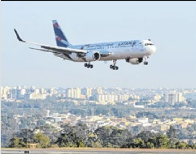
Reforma tributária deve encarecer passagens aéreas