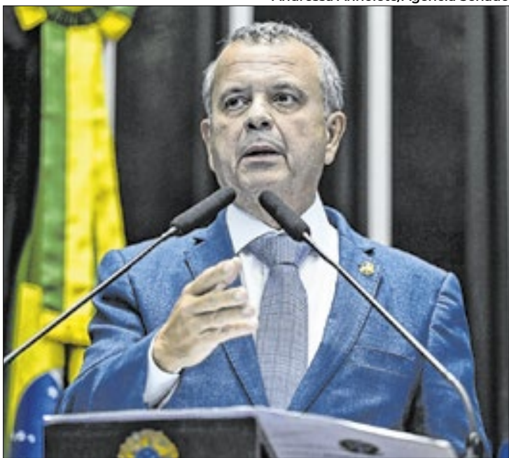
Marinho: Bolsonaro não queria ruptura democrática

do Planalto e do ex-ministro da Casa Civil, o general Walter Braga Netto — que foi o candidato a vice da chapa presidencial derrotada no segundo turno daquele ano. Segundo o congressista, nas reuniões depois do resultado das eleições, o que se tratou foi o fortalecimento do Partido Liberal nas eleições municipais, além de ter conversado com Braga Neto sobre as possíveis razões do insucesso no pleito.