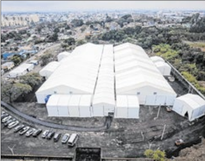
As transferências encerram de forma gradual

A estrutura do Centro Humanitário Vida, localizado em Porto Alegre, começou a ser desmobilizada. As famílias que ainda estavam no abrigo foram levadas para as moradias temporárias disponibilizadas pelo governo do Estado no bairro Sarandi. O Centro Vida foi o último a ser encerrado. As atividades nos centros Recomeço e Esperança, ambos em Canoas, já haviam sido finalizadas em dezembro de 2024 e em maio deste ano, respectivamente. As transferências dos abri-