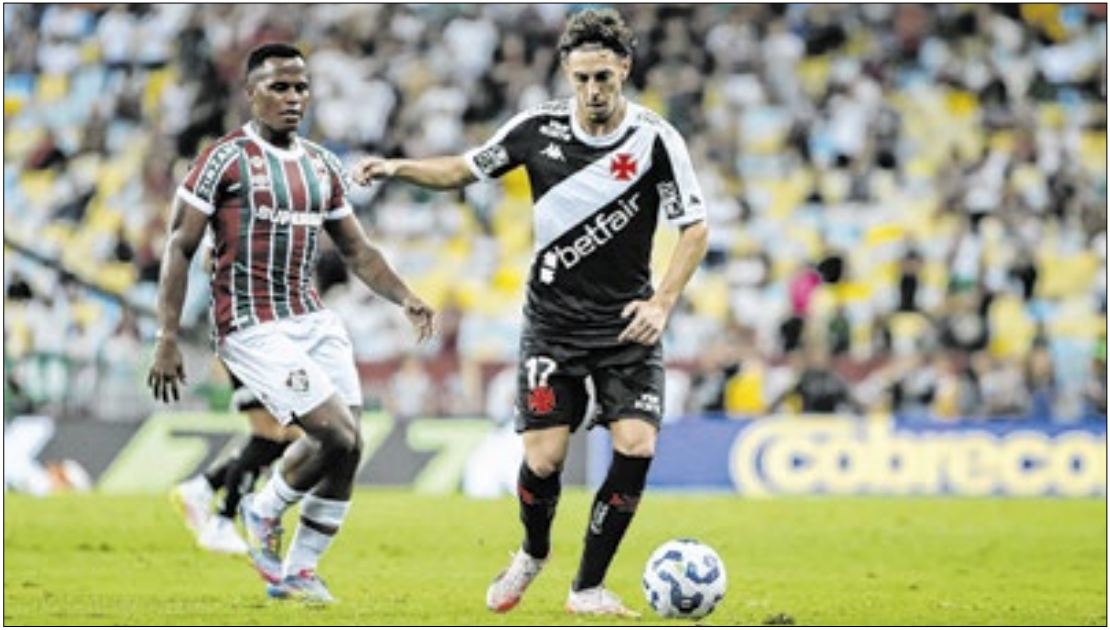
Vasco e Fluminense podem se encontrar numa eventual final da Sul-Americana

(ARG) São Paulo e Botafogo podem se enfrentar nas quartas. Na Sul-Americana, o destaque é a chance de um clássico carioca entre Vasco e Fluminense numa possível final.