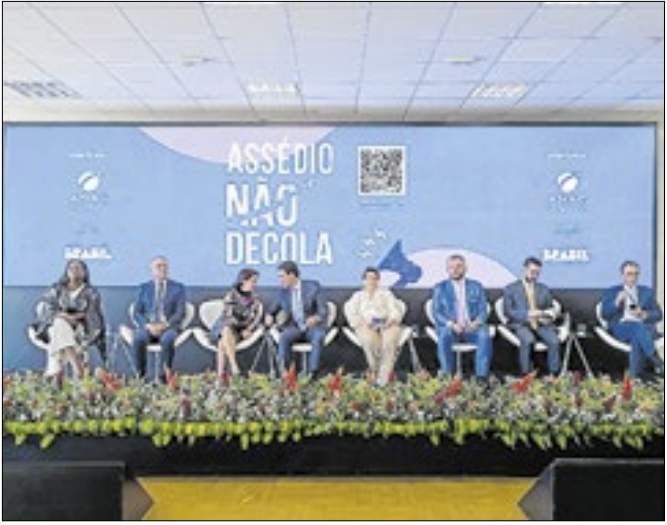
Medida visa conscientização dos passageiros