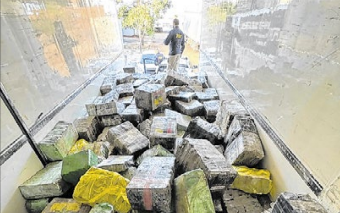
Droga estava sob caixas falsas e foi descoberta após vistoria em caminhão frigorífico

Diante disso, os agentes decidiram fazer a verificação no compartimento de carga. Ao perceber que seria descoberto, o homem fugiu correndo pela pista, atravessando a rodovia entre os veículos que percorriam o perímetro. A equipe da PRF iniciou perseguição a pé e com apoio da viatura. O condutor foi alcançado após cerca de um quilômetro e imobilizado. Durante a vistoria no cami-