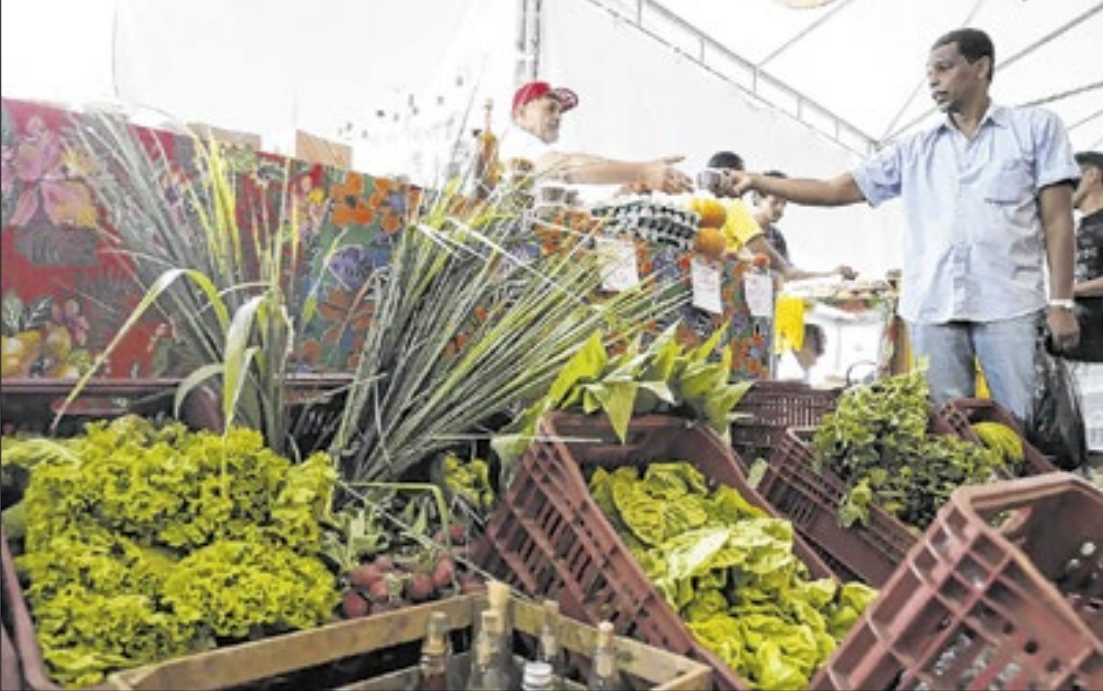
Recuos ‘milimétricos’ de projeções inflacionárias mascaram o avanço da carestia tupiniquim

Nesse contexto, o mercado manteve em 4,50% o IPCA para 2026 – o chamado ‘horizonte relevante’ – pela 3ª semana seguida, superando o