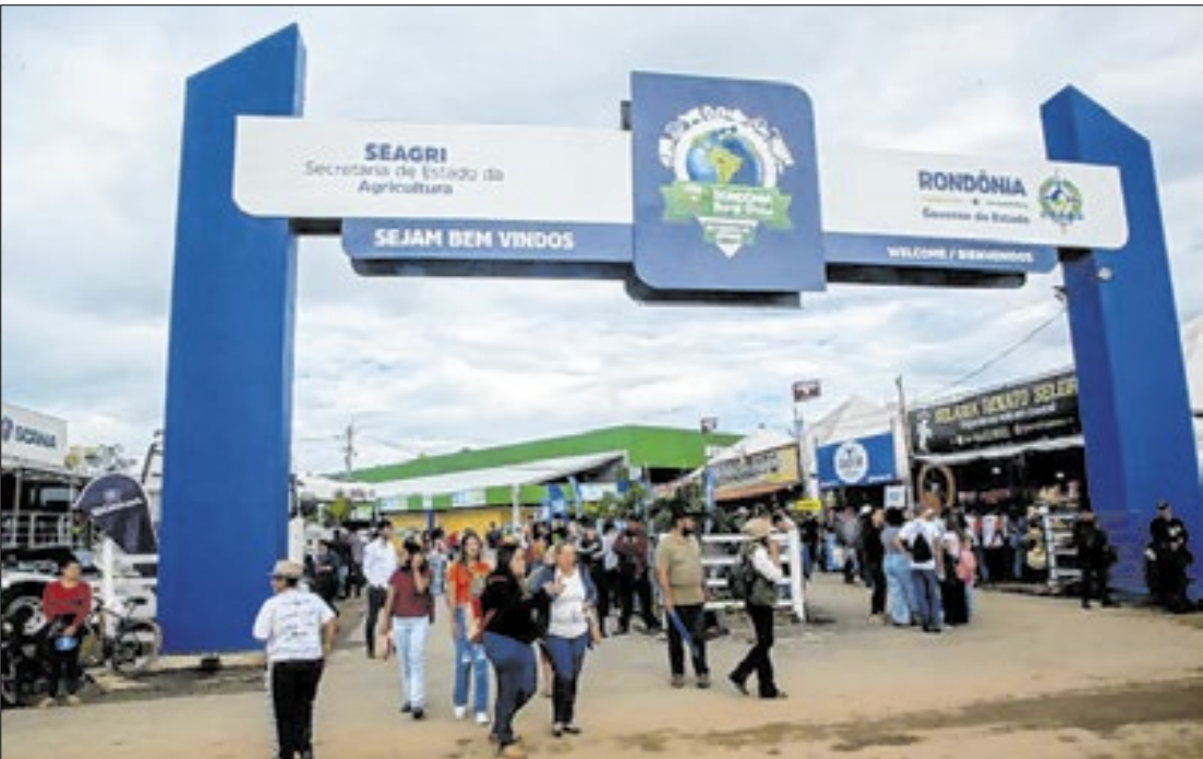
Evento teve 650 expositores e 26 vitrines tecnológicas no centro de Ji-Paraná

O evento apresentou 26 vitrines tecnológicas, que ofereceram soluções para produtores de diferentes setores do agro. A programação incluiu cursos, palestras e rodadas de negócios. Nesta edição, a feira trouxe o tema “Do Campo ao Futuro” e destacou ações ligadas à inovação e sustentabilidade. Entre as atividades, estiveram o 1º Concurso Estadual de Produção de Leite, o Concurso de Queijos e o Estande Show, que premiou boas práticas sustentáveis e criatividade. O evento também marcou