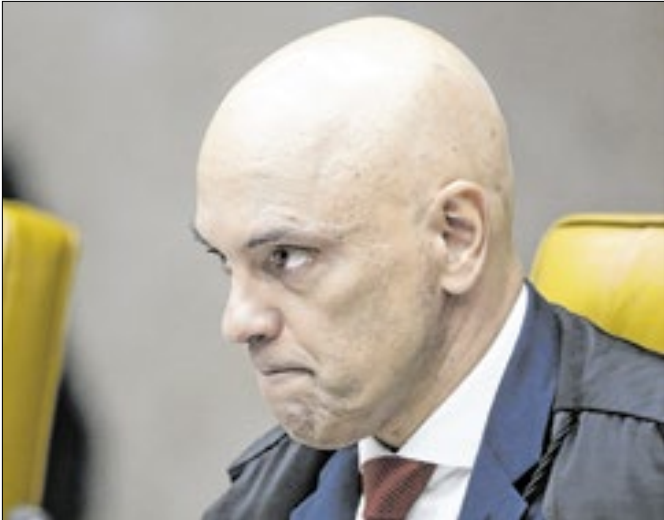
Oposição busca a maioria para cassar Moraes