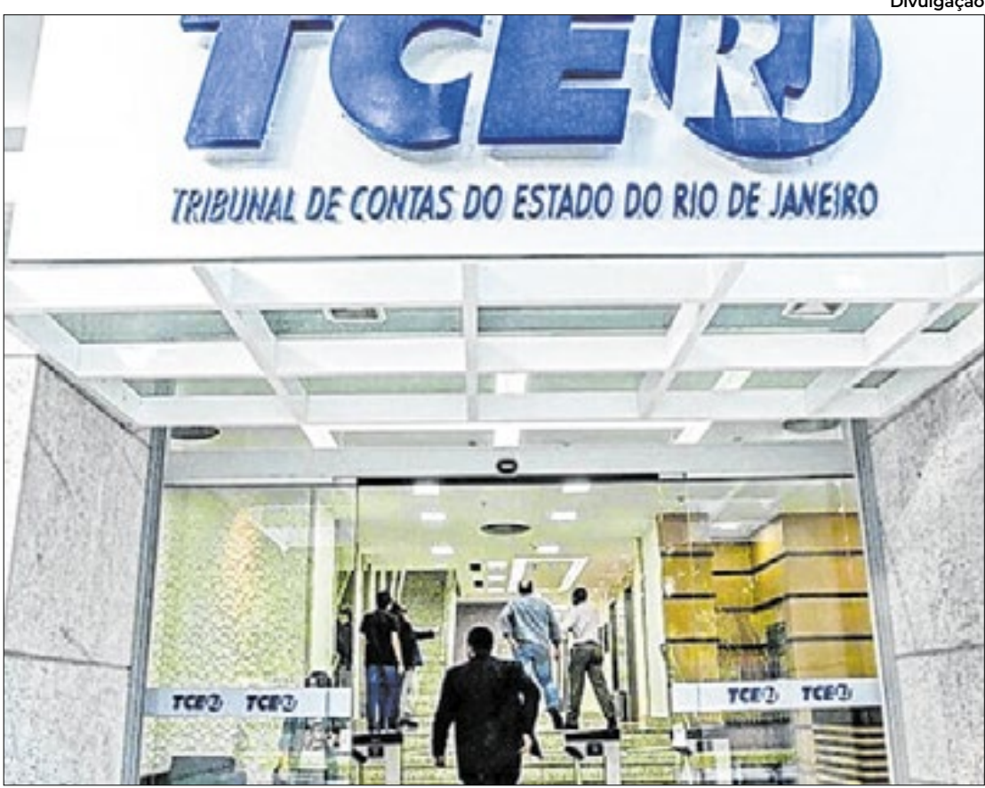
Aprovação foi unânime entre todos os conselheiros do tribunal de contas estadual

O Tribunal de Contas do Estado do Rio de Janeiro (TCE-RJ) emitiu, nesta segunda-feira (02), parecer favorável à aprovação das contas da gestão Cláudio Castro, referentes ao ano de 2024. Tanto os conselheiros quanto o corpo consultivo do TCE-RJ não apontaram irregularidades no relatório apresentado, o que não acontecia desde 2015. O voto do conselheiro relator do processo, Márcio Pacheco, foi acompanhado por unanimidade. Esse é o quarto ano consecutivo que a corte de contas julga favoravelmente os gastos do Governo do Estado, que fechou 2024 investindo em Saúde e Educação mais do que os limites previstos na Constituição. Os repasses para a primeira área foram de 15,21% da Receita Líquida de Impostos e Transferências, acima do mínimo de 12%. Já na Educação, que tem o piso estabelecido de 25%, foram aplicados 26,93%. “Recebo com responsabilidade e senso de dever cumprido o parecer favorável do Tribunal de Contas do Estado às contas de 2024. É um reconhecimento importante à transparência, ao equilíbrio fiscal e à seriedade com que tratamos os recursos públicos. Mais do que cumprir a legislação, superamos os investimentos mínimos em áreas essenciais, como Saúde e Educação, reforçando nosso compromisso com o que realmente importa: cuidar das pessoas e transformar realidades. Seguimos trabalhando com responsabilidade e foco nos resultados que a população espera e merece”, afirmou o governador Cláudio Castro.