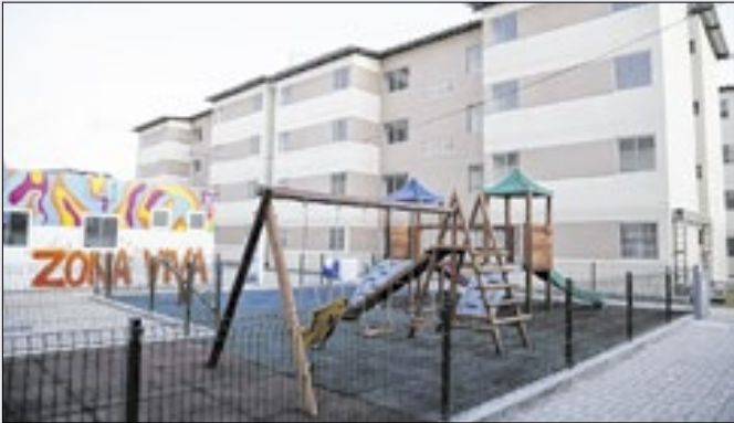
Valor das habitações populares terá teto de R$ 350 mil