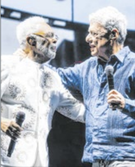
Gillberto Gil e Chico Buarque trocam carinho durante a participação surpresa de Chico em show de baiano no Rio. Juntos, cantaram a parceria ‘Calice’, canção censurada pela ditadura