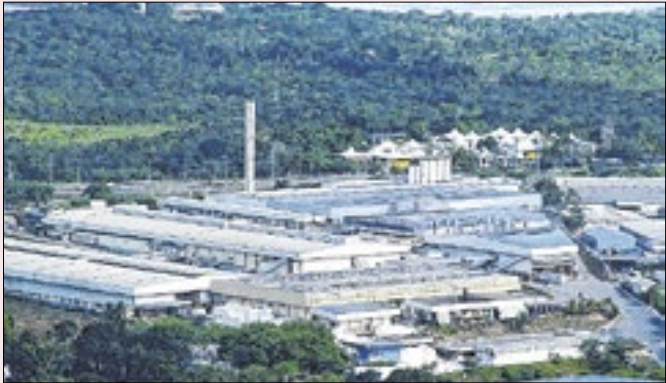
Indústrias na Zona Franca de Manaus