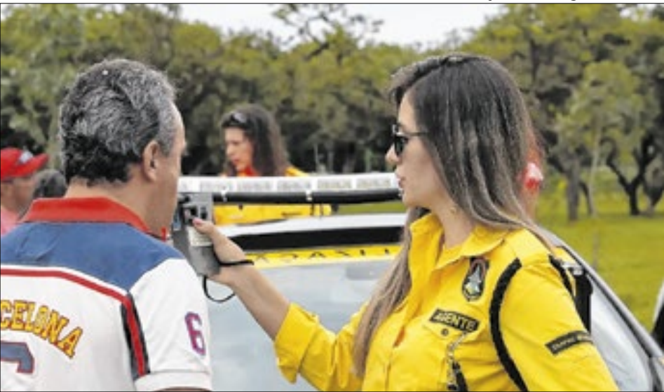
Para o Detran-DF, os dados demonstram uma consciência maior da população no quesito beber e dirigir

Uma pesquisa realizada pelo Cisa (Centro de Informações sobre Saúde e Álcool) mostrou que a taxa de mortes por acidentes de trânsito relacionados ao uso de álcool caiu 24% no Brasil desde 2010. No Distrito Federal, o índice em 2023 foi de 3,90 óbitos por 100 mil habitantes. Está apenas um décimo acima do menor índice, que foi registrado no Acre (que foi 3,80).