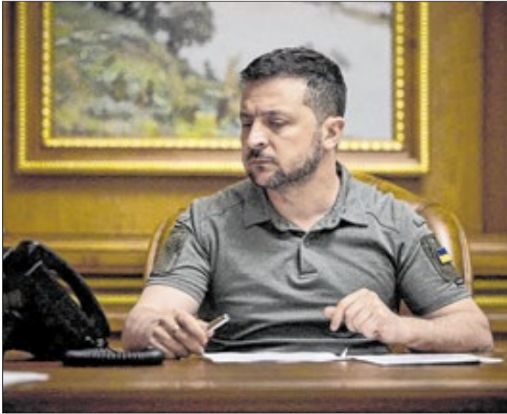
Proposta russa de paz passa pela convocação da eleição

Zelenski já foi chamado de ilegítimo pelo russo Vladimir Putin, e rejeita a ideia - hoje, ele teria uma tentativa de reeleição complicada, provavelmente tendo como rival