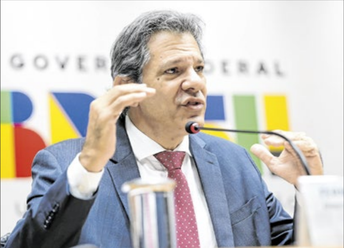
Haddad promete solução antes do prazo de dez dias