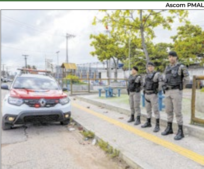
Estado tem liderado as ações da Operação Força Total

Expansão industrial destacada impulsiona economia regional