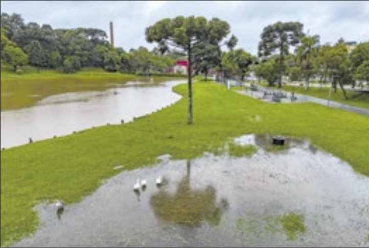
Junho trará chuva para regiões secas em todo o Estado

150 mm no mesmo período. Já o Sudoeste do Paraná, que vem sofrendo os impactos de uma seca moderada por conta da falta de chuvas desde dezembro, historicamente tem chuvas de até 200 mm em junho. Em junho as chuvas devem ficar na média nas regiões Leste (RMC e Litoral), toda a faixa Norte e nos Campos Gerais, e dentro ou acima da média em cidades do Oeste, Sudoeste e Centro-Sul - com destaque para Foz do Iguaçu, Pato Bran-