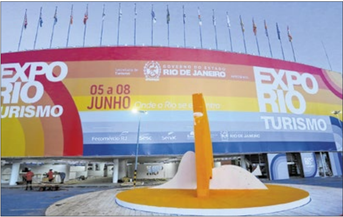
Governo do Rio

Feira tem atrações culturais e destinos de doze regiões turísticas