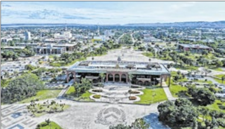
Estado ocupa o primeiro lugar no Norte no IPS Brasil 2025