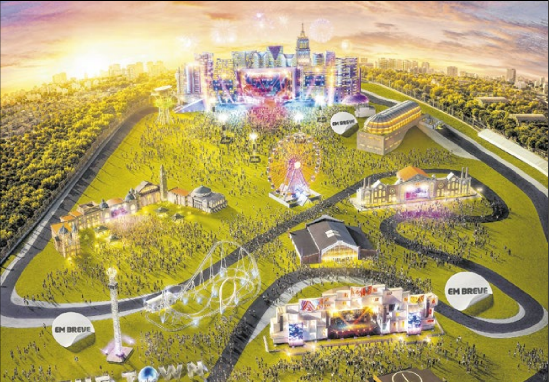
Primeira edição do festival recebeu meio milhão de pessoas em cinco dias em Interlagos

O último dia de The Town, 14 de setembro, fecha o festival em grande estilo com o dia perfeito para os amantes do pop. No palco Skyline, Katy Perry lidera a noite como headliner, com shows de Camila Cabello, J Balvin e IZA.