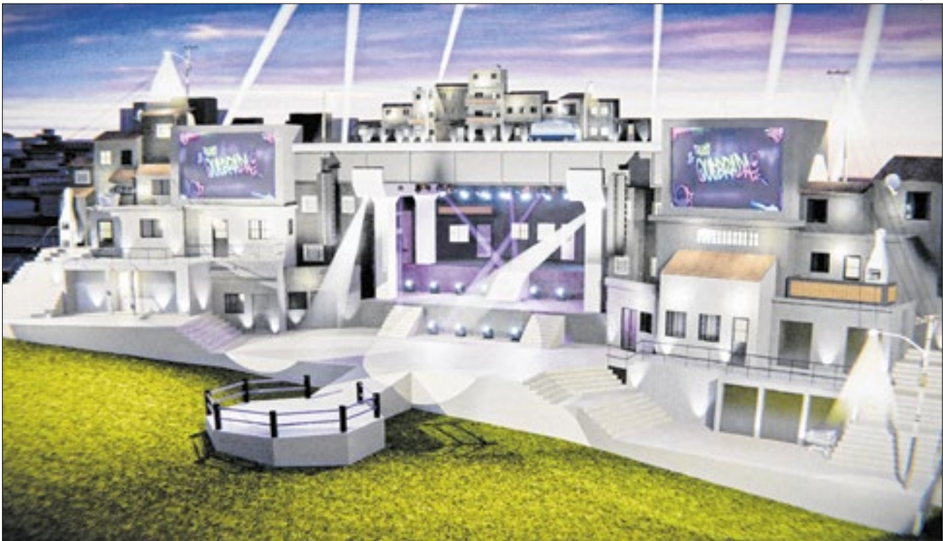
Projeção de como será o palco 'Quebrada', com atrações do rap e pagode