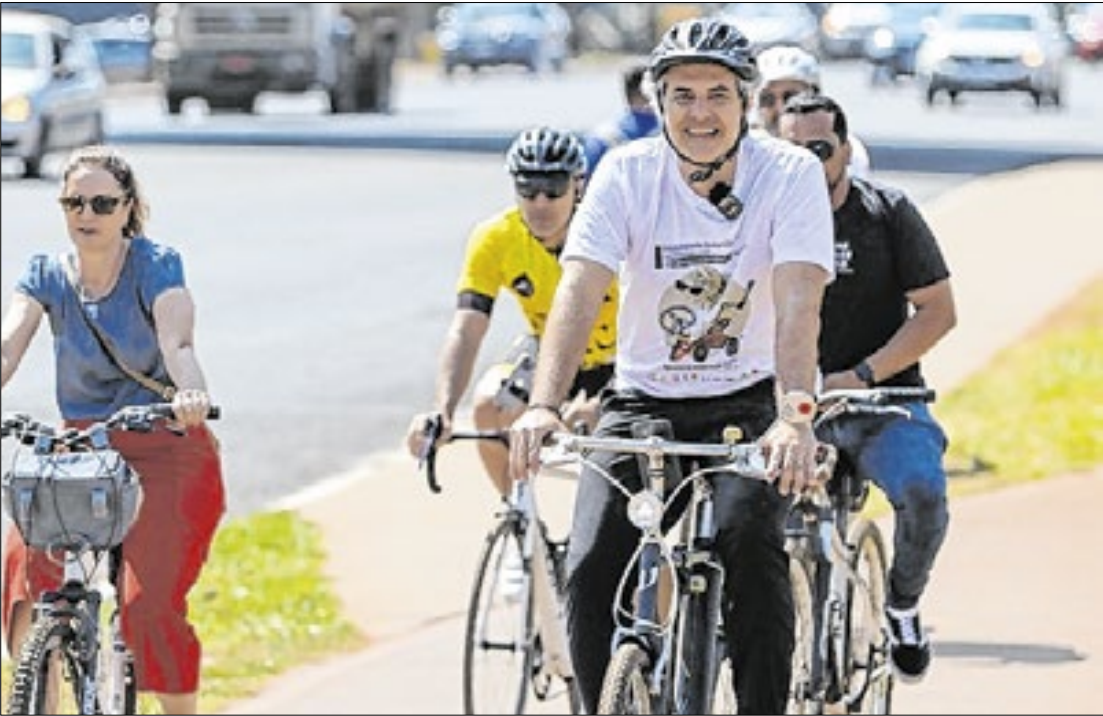
Os ciclistas de todo o país devem aproveitar o Dia Mundial da Bicicleta.

Para 2025, o orçamento total da premiação às organizações