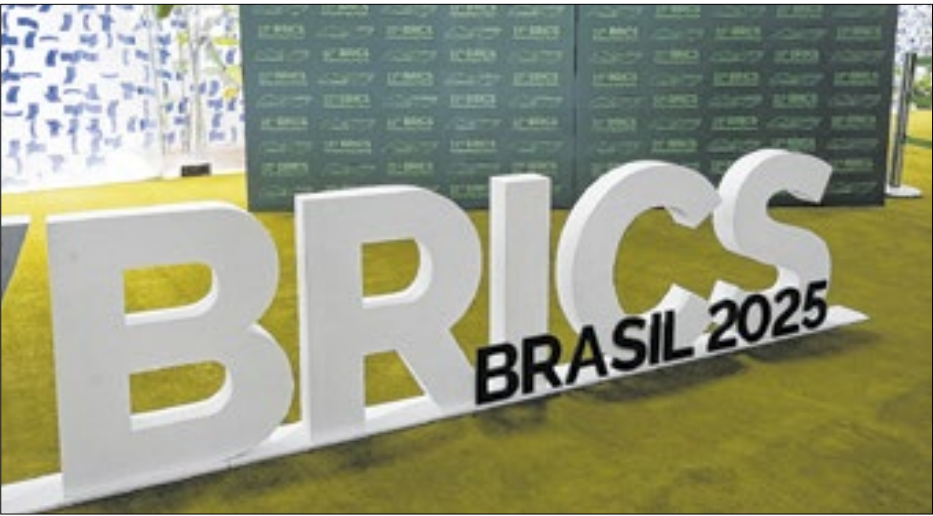
Brics dominarão a pauta do Congresso esta semana

O primeiro dia de evento está previsto para ser o mais movimentado. Nesta terça-feira, estão marcadas duas reuniões que acontecerão paralelamente no Congresso, uma das “Mulheres Parlamentares do Brics” e outra “dos Presidentes das Comissões de Relações Exteriores dos Parlamentos do Brics”. Os temas do primeiro grupo são: “Mulheres na Era da Inteligência Artificial: Entre a Proteção de Direitos e Inclusão Feminina na Economia Digi-