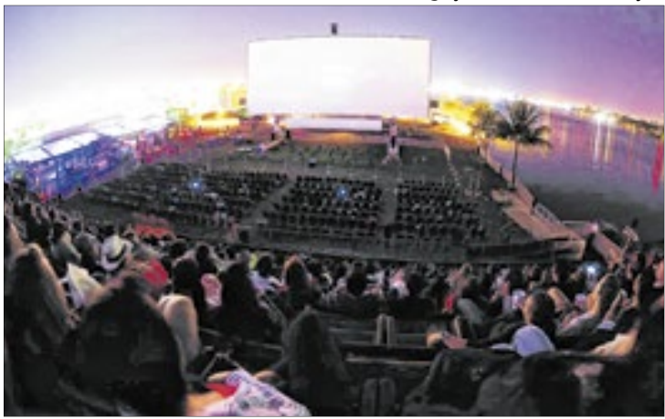
No Pontão do Lago Sul, o público da capital poderá assistir a filmes na maior tela de cinema a céu aberto do mundo

Na programação estão títulos que agradam a diversos públicos, como sucessos de bilheteria nacionais e internacionais, clássicos do audiovisual, infantis e filmes de terror. Alguns destaques do evento são a noite em homenagem a Fernanda Torres, o premiado “Anora”, os ainda inéditos “O Esquema Fení-