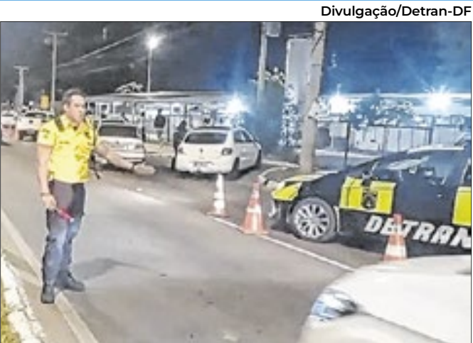
Para o Detran-DF, os dados demonstram uma consciência maior da população no quesito beber e dirigir.

Segundo ele, apesar da redução expressiva nos flagrantes, ainda há muito a ser feito. “Por isso, seguimos firmes, com ações educativas, fiscalizações integradas e processos rigorosos de suspensão do direito de dirigir, utilizando tecnologia de ponta para garantir mais eficiência. Nosso compromisso é claro: preservar vidas e tornar o trânsito do Distrito Federal cada vez mais seguro.”