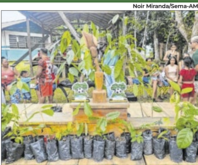
Apoio à educação ambiental e práticas sustentáveis