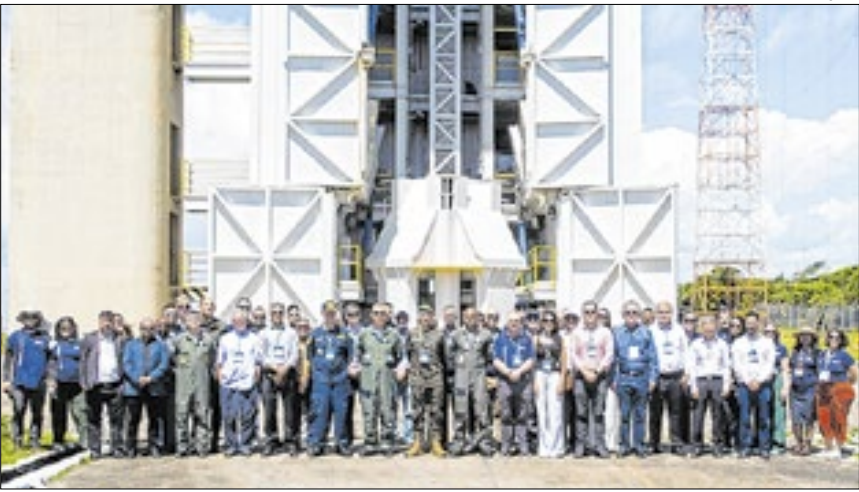
Reunião abordou diversos temas

O Ministério das Comunicações integrou a 73ª Reunião do Conselho Superior da Agência Espacial Brasileira (AEB), realizada na última terça-feira (27), no Centro de Lançamento de Alcântara (CLA), no Maranhão. O encontro debateu o fortalecimento das parcerias internacionais para a expansão do Programa Espacial Brasileiro.