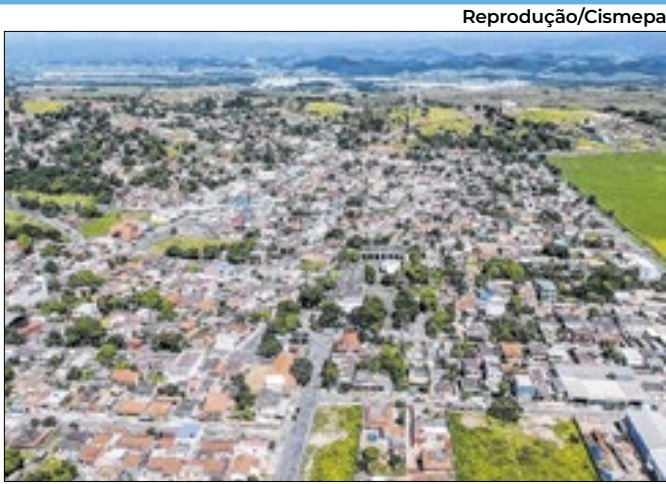
Oportunidade divulgada é para moradores da cidade

A empresa de internet Quick Fibra, da filial de Porto Real está com vagas disponíveis para o cargo de especialista em relacionamento com o cliente. A vaga será temporária, e neste cargo, o funcionário será responsável por construir e manter um relacio-