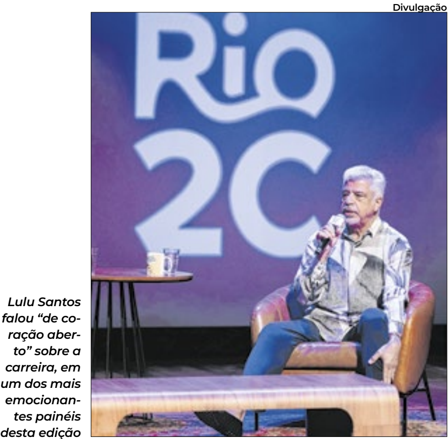
Lulu Santos falou “de coração aberto” sobre a carreira, em um dos mais emocionantes painéis desta edição

Circula em conjunto com: CORREIO PETROPOLITANO