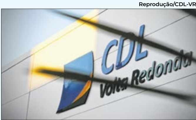
Vagas incluem oportunidades em diversas áreas

mana, entre 08h e 17h, e interessados devem enviar currículo para o.e-mail.sectrabahoerendapm-pr@gmail.com ou para o WhatsApp (24)99853-1075.