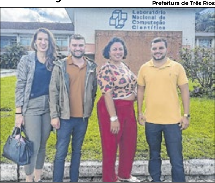
Prefeitura de Três Rios

A Concessionária Rota 116 S/A orienta os motoristas a redobramem a atenção ao trafegar pelo trecho e a respeitarem a sinalização implantada, que será o sistema de pare e siga no local. Em caso de chuva, os serviços poderão ser reagendados.