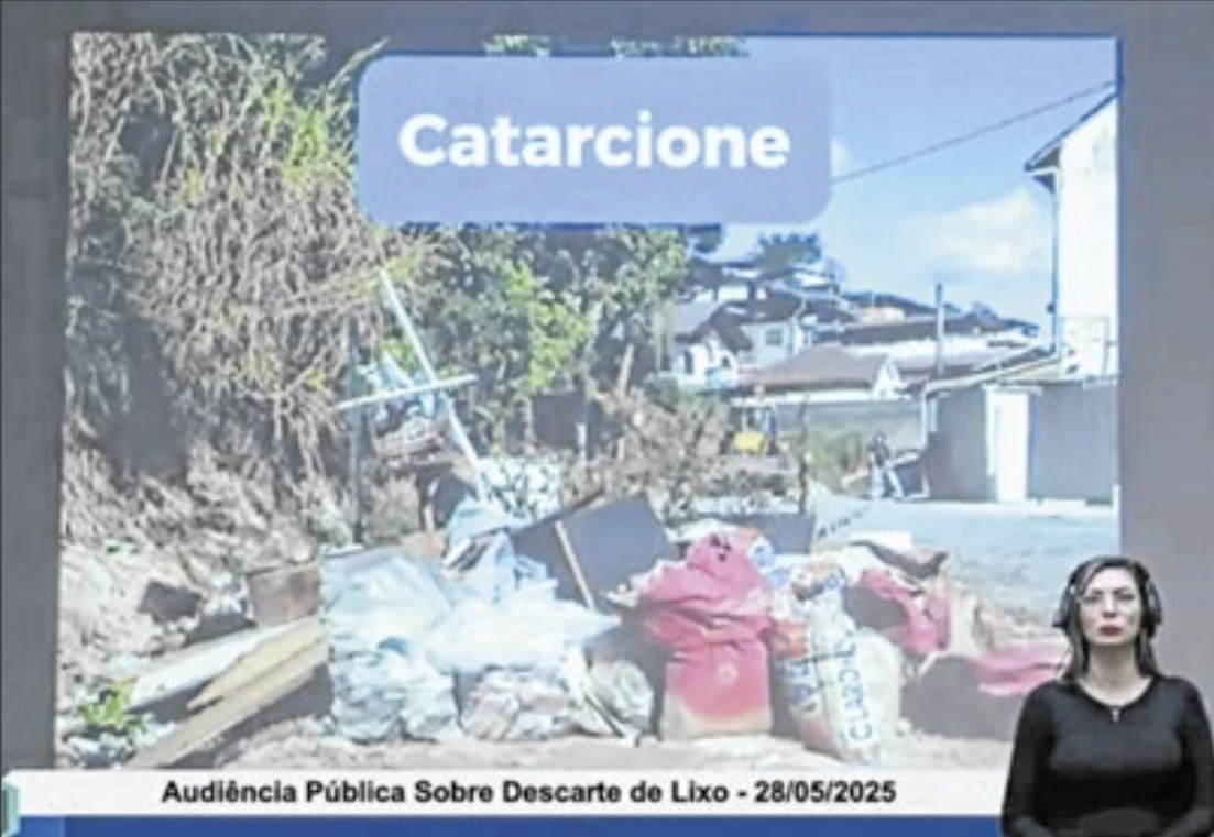
Câmara Municipal de Friburgo