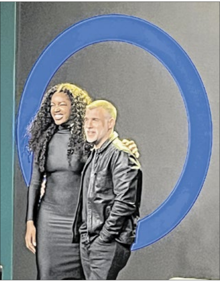
Iza contou sobre o processo criativo que ela teve de aceitar para conseguir expressar sua arte

do Pop’ conseguiu roubar a cena ao trazer o cantor ‘de coração aberto’ para falar não apenas de sua gloriosa carreira, mas também de sua vida pessoal.