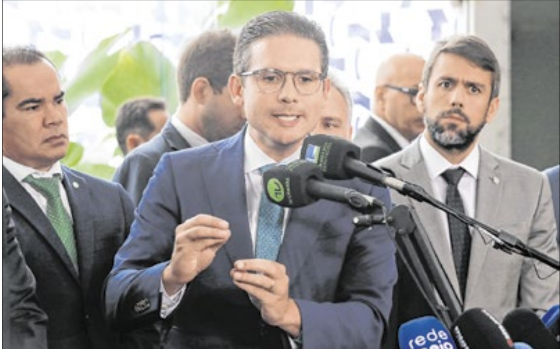
Motta deu dez dias para governo encontrar alternativa ao IOF

Até o momento, ao menos 20 propostas de suspensão foram protocoladas no Congresso Nacional. Para Motta, aumentar tributos sempre que o gasto público cresce não funciona. “É essencial pensar no futuro com medidas definiti-