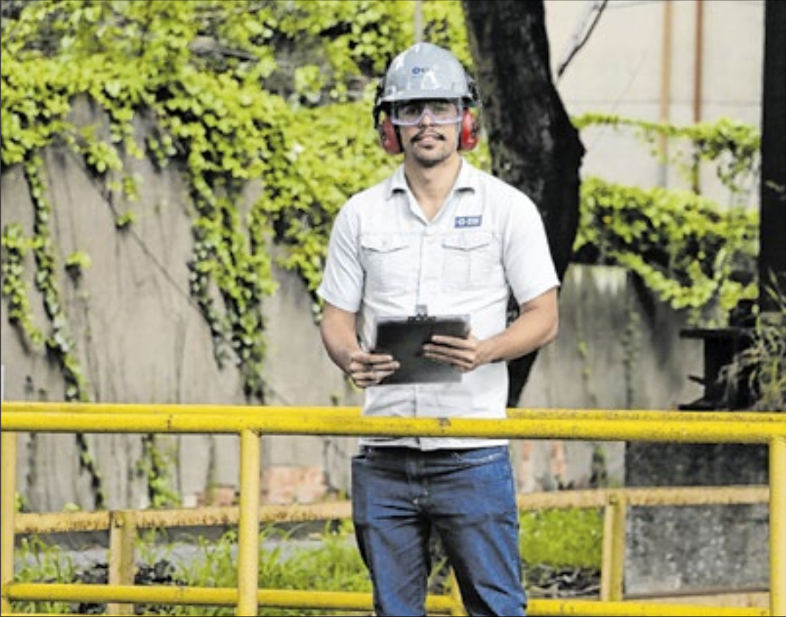
Oportunidades são paramecânica, elétrica, solda, produção, motoristas e outras áreas

Cerca de 100 vagas estão abertas para diversos cargos na Usina Presidente Vargas (UPV), em Volta Redonda, e em Porto Real. As oportunidades, que foram divulgadas pela Companhia Siderúrgica Nacional (CSN), são para as áreas de mecânica, elétrica, solda, produção, motoristas, operação de máquinas móveis e segurança do trabalho.