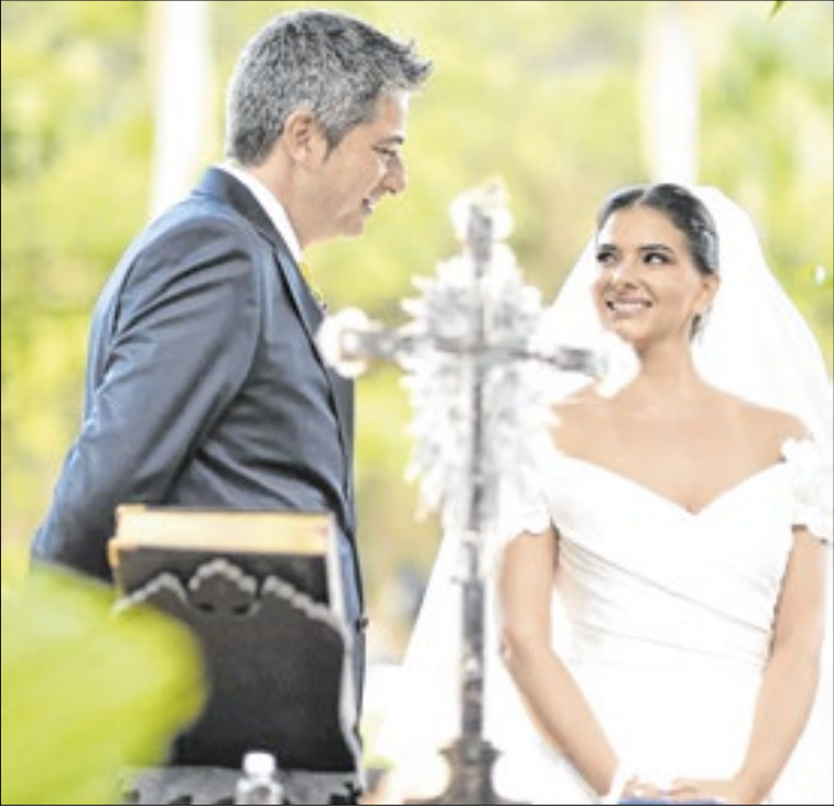
O casamento foi realizado na Locanda Bela Vista, em Itaipava, com cerca de 350 convidados