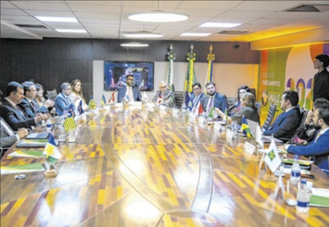
Procuradores defendem aprovação da PEC 18/2025 (PEC da Segurança Pública) pelo Senado

“A PEC da Segurança precisa ser analisada à luz da PEC 37, que trata diretamente da inclusão das guardas municipais e dos agentes de trânsito como forças auxiliares. Esse é um ponto sensível para as Assembleias Legislativas, que muitas vezes são responsáveis