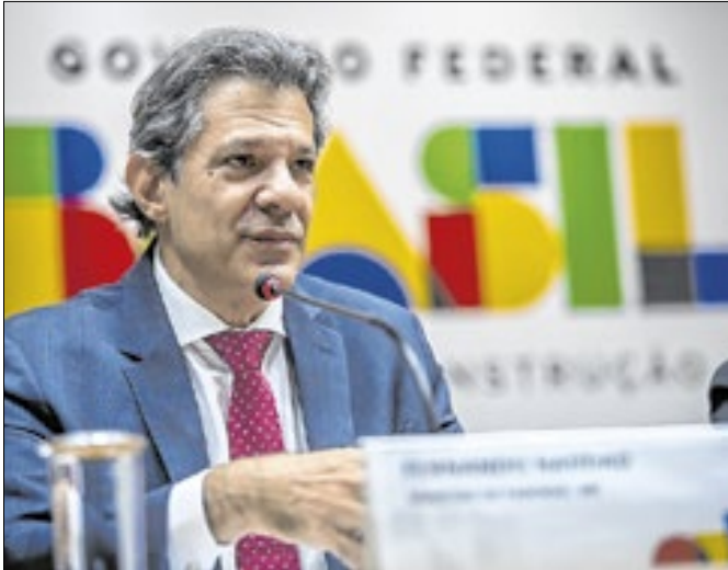
Cansaço de Haddad preocupa Planalto