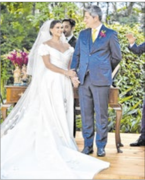
Tudo começou no torneio de tênis Rio Open, quando os dois se conheceram...

Para a noiva, o momento mais emocionante foi a cerimônia. Entrar