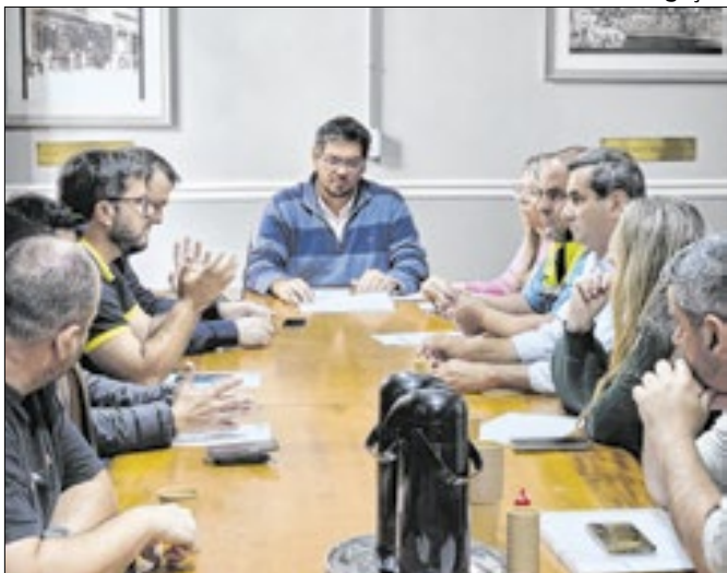
Ofício já foi encaminhado ao município