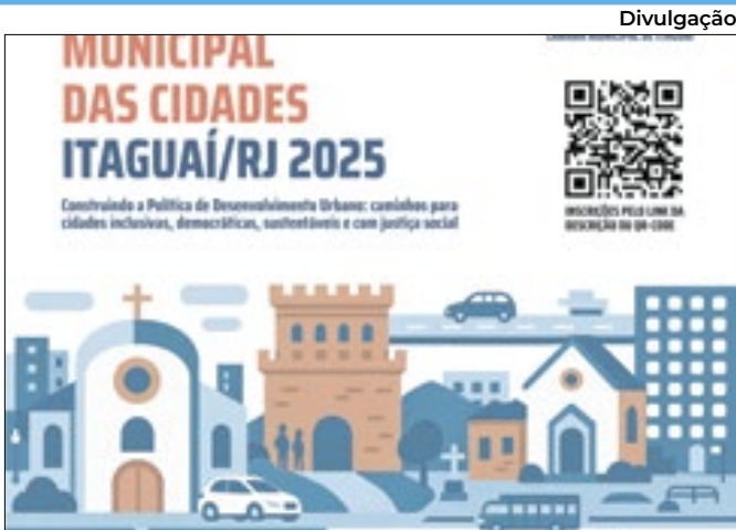
Evento acontecerá no dia 4 de junho, em Itaguaí

As inscrições para a 2ª Conferência Municipal de Itaguaí estão abertas. O evento acontece na quarta (4), das 8h às 18h, na Câmara de Vereadores de Itaguaí. O encontro é uma das etapas preparatórias para a 6ª Conferência Nacional das Cidades. Representantes de entidades, do governo municipal da sociedade civil e observadores levarão suas propostas para ajudar a construir a Política Nacional de Desenvolvimento Urbano