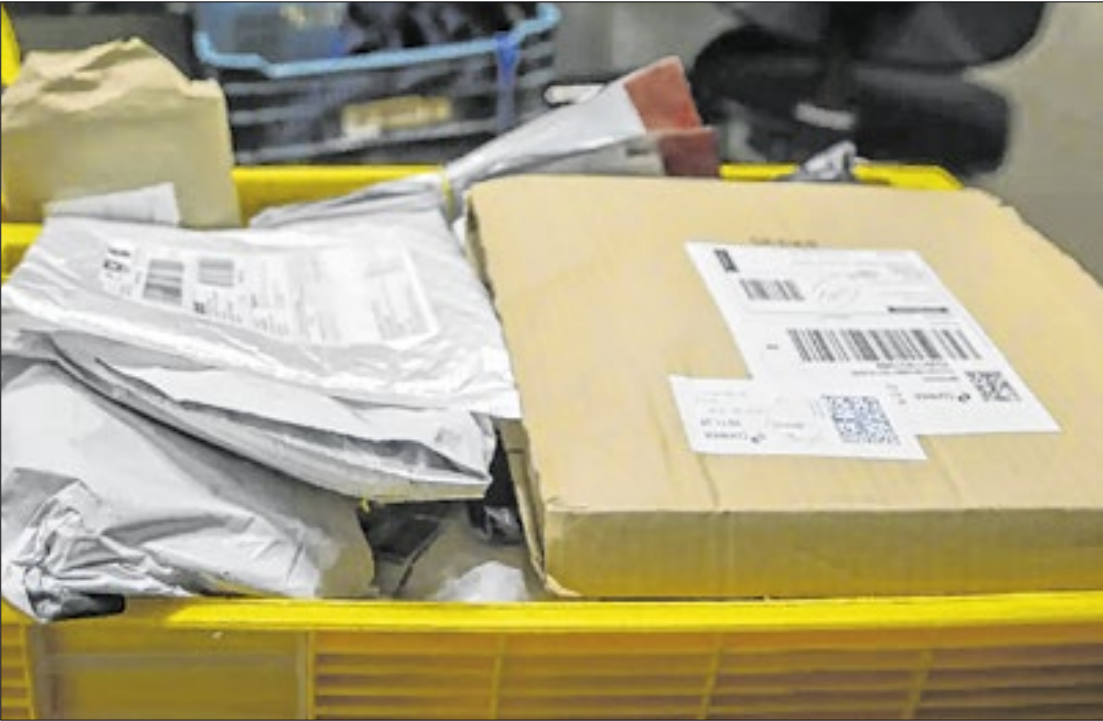
Joédson Alves - Agência Brasil

Conforme informado pela instituição, os Correios recentemente encerraram contratos de serviço de entrega com empresas terceirizadas, contando apenas com sua própria frota para prestar a função. A redução de pessoal gerou sobrecarga no manejo das encomendas, o que acarretou os atrasos. Ao entrar em contato com a empresa, o Correio Sul Fluminense solicitou mais detalhes sobre a paralisação e lentidão das entregas, questionando ainda se existe uma previsão para que o