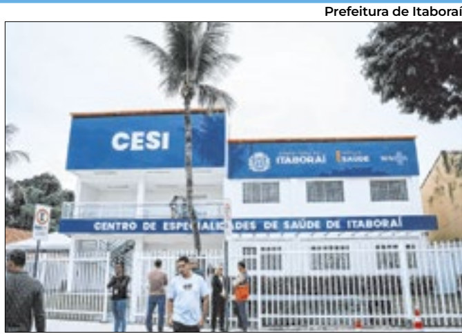
Prefeitura de Itaboraí Meta é o cuidado humanizado e qualificado à população