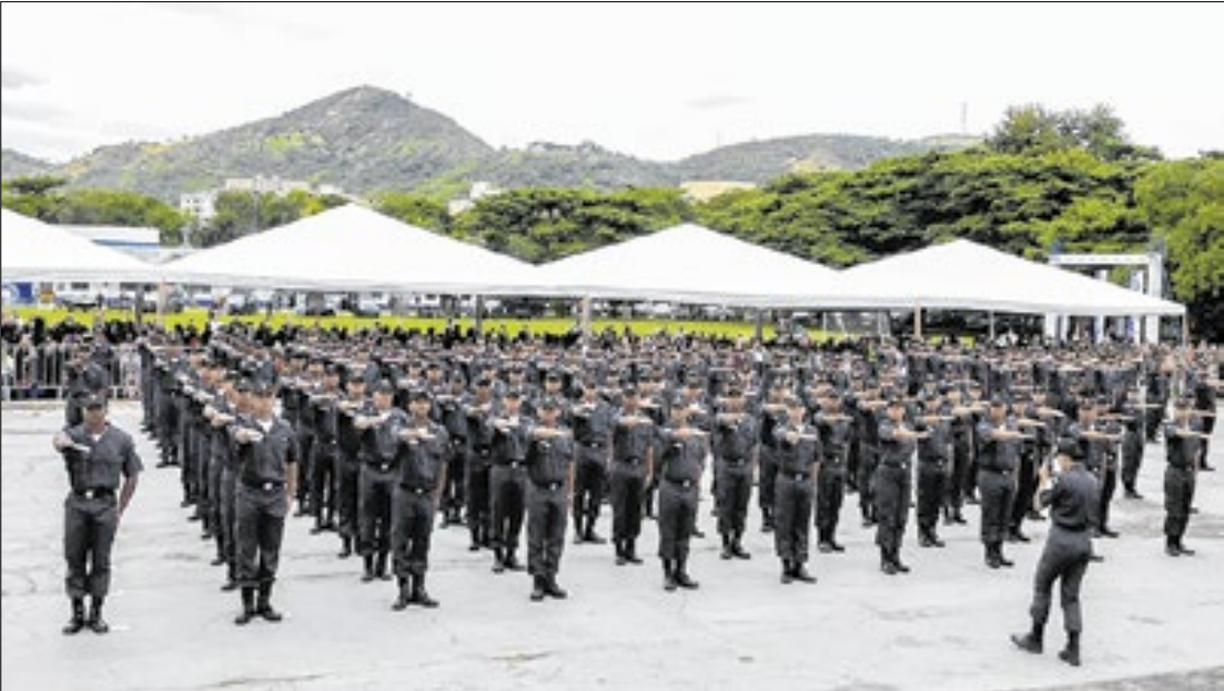
Nova tropa da Polícia Militar já está apta para cumprir missões de patrulhamento em 2026

“É uma honra liderar o Estado do Rio de Janeiro nesse tempo de reconstrução. Estamos investindo no policial e em tudo que proporciona ao