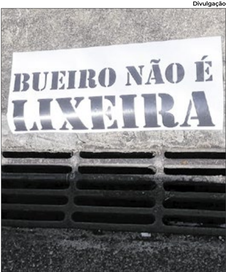
Objetivo é incentivar o descarte correto dos resíduos

Segundo a Oceana.Org, entidade focada exclusivamente na preservação dos oceanos, no Brasil, em média, 1,3 milhão de toneladas de plástico acabam no oceano por ano, afetando a vida marinha, nos ecossistemas e na atividade pesqueira. Diante dessa realidade, a Oceana defende a redução na oferta e consumo