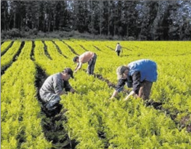
Medida permite renegociar dívidas devido à estiagem