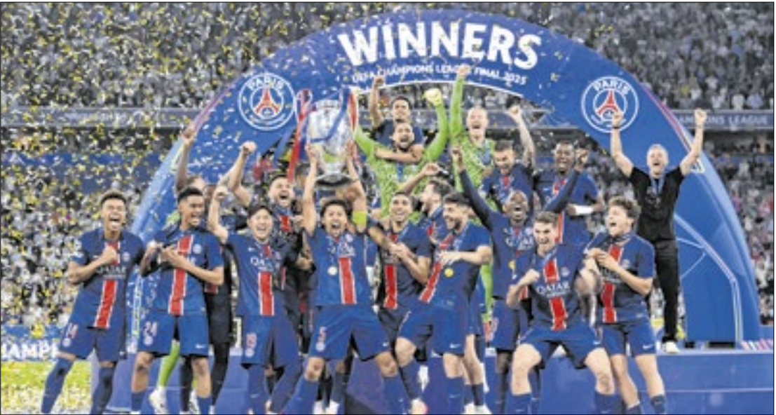
Euforia pela primeira Champions League do PSG deixou Paris em estado de puro caos

A final da Champions League 2025 foi histórica para o PSG, que conquistou sua primeira taça do torneio, um sonho antigo dos torcedores parisienses e do dono do clube, o empresário catari Nasser Al-Khelaifi, que investiu bilhões nos últimos anos para elevar o clube à primeira prateleira da Europa. No Allianz Arena, em Munique, na Alemanha, o time comandado pelo técnico Luis Enrique foi implacável. Sem deixar a Inter de Milão respirar, o time parisiense abriu o placar aos 10 minutos do primeiro tempo, com Hakimi, ex-Inter de Milão, que se recusou a comemorar em respeito ao antigo clube. Aos 19, o jovem Doué, que havia dado a assistência para o primeiro gol, marcou o segundo. Naquela altura, a sensação era de que o jogo já estava decidido, mas nem o mais otimista torcedor do PSG poderia imaginar o que viria no segundo tempo.