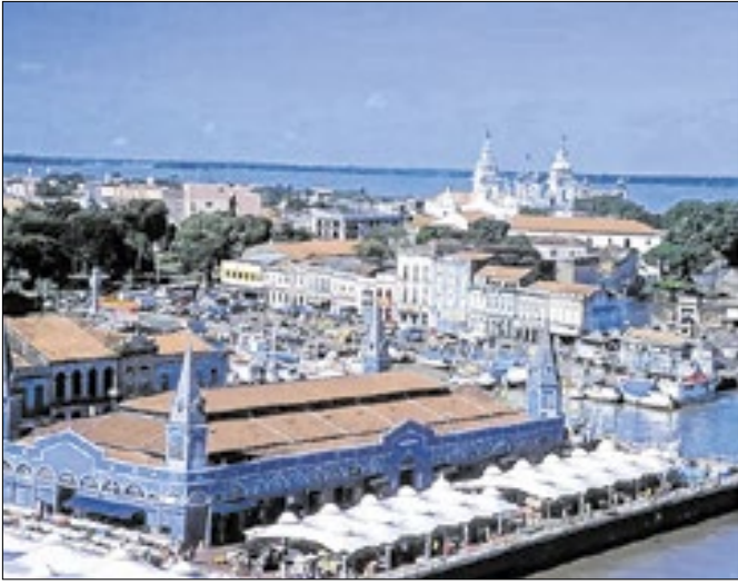
Belém ocupa o 22o. lugar no IPS