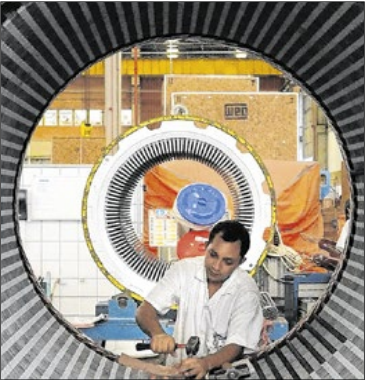
Enquanto Agro salta 12,2%, indústria amarga recuo de 1%