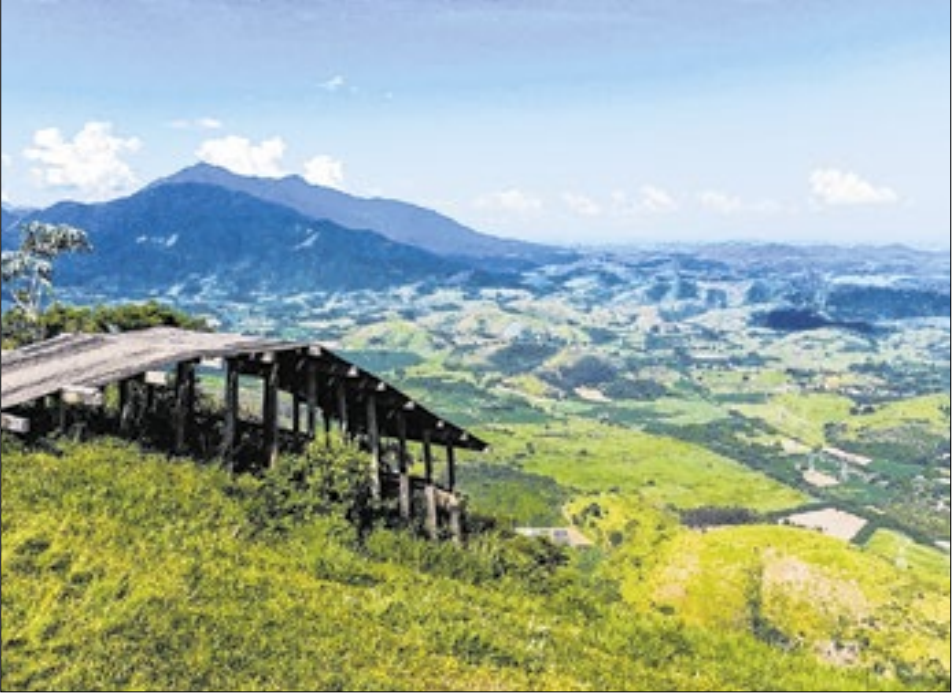
Atividade é indicada para todas as idades, com direito a plantio de mudas nativas da Mata Atlântica

Essa ação faz parte da Semana do Meio Ambiente que acontece entre os dias 02 e 06 de junho e tem como ob-