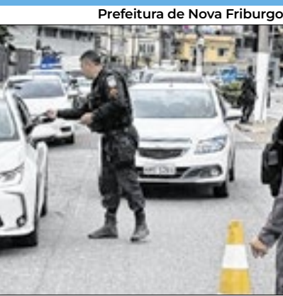
Prefeitura de Nova Friburgo

Em Nova Friburgo, uma operação conduzida pelas secretarias de Mobilidade e Urbanismo (Semu) e de Segurança e Ordem Pública (Sesop), em parceria com policiais militares do Programa Estadual de Integra-