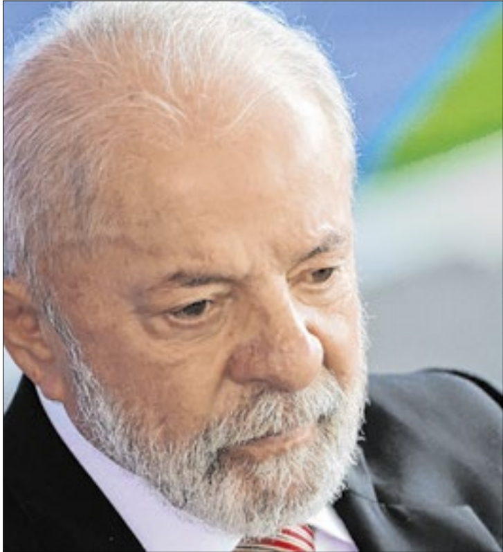
Lula já perde de adversários no segundo turno

da Manhã, o cientista político Isaac Jordão avaliou que a alta desaprovação é um sinal vermelho que demonstra grande resiliência dos números e que o governo “não está conseguindo reverter isso”.