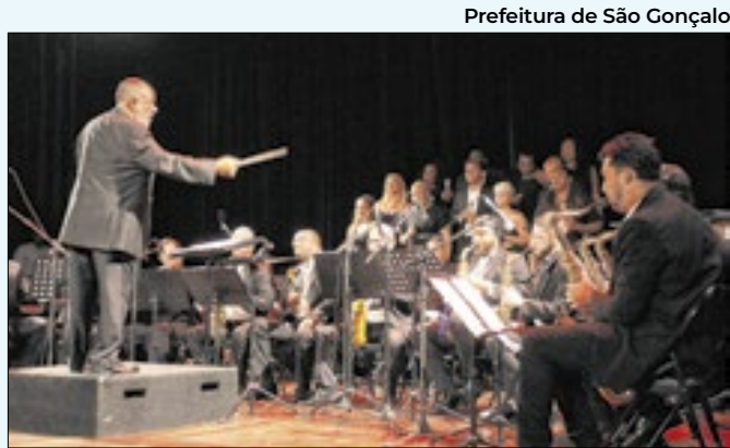
Prefeitura de São Gonçalo Sinfônica terá clássicos da MPB e sucessos internacionais

por meio da Política Nacional de Equidade, Educação para as Relações Étnico-Raciais e Educação Escolar Quilombola (PNEREQ). A premiação reafirma o compromisso de Cabo Frio com uma educação que nasce do território e respeita os saberes ancestrais.