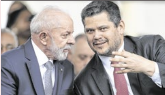
Lula e Alcolumbre: estratégia indica ter dado certo