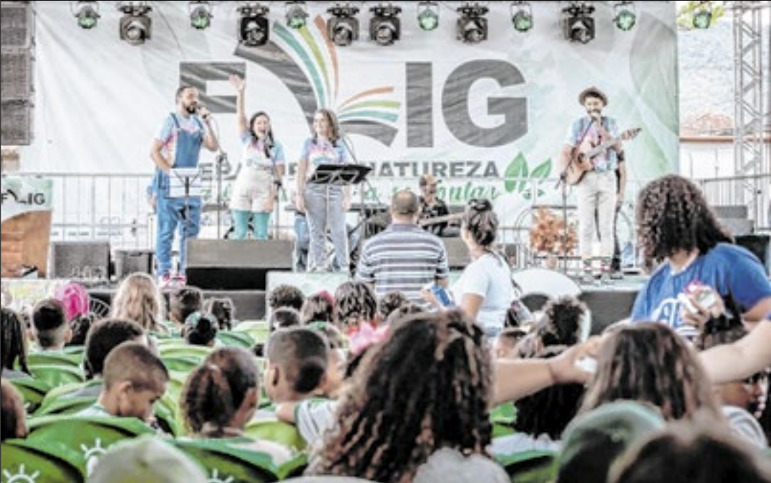
A 3ª Feira Literária de Guapimirim acontece de 4 a 8 de junho, no Antigo Posto do Nelson

A cerimônia oficial de abertura da FLIG acontece no dia 4 de junho, às 19h, com o espetáculo teatral “Atazanado”, estrelado pelo ator Rodrigo Sant’Anna. Entre os destaques da programação estão a apresentação teatral com o ator Thiago Lacerda, basea-