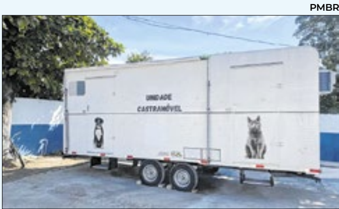
Moradores de Heliópolis terão quatro dias de vacinação