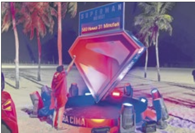
Relógio está próximo ao Hotel Hilton de Copacabana