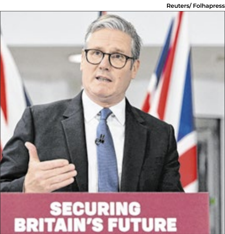
Starmer defende gasto de US$ 2 bi em fábricas de armas

O Reino Unido deve estar pronto para lutar e vencer uma guerra contra Estados militarmente fortes, afirmou neste domingo (1º) o primeiro-ministro do país europeu, Keir Starmer, ao comentar um plano para construir pelo menos seis novas fábricas de armas e explosivos com 1,5 bilhão de libras (US$ 2 bilhões ou R$ 11,5 bilhões). O alerta de Starmer ocorre na véspera da publicação de uma revisão das capacidades militares britânicas e um dia depois de seu governo anunciar os planos de gastos. O pano de fundo é a Guerra da Ucrânia, a maior em solo europeu desde o fim da Segunda Guerra Mundial, e a instabilidade na parceria com os Estados Unidos desde o retorno à Casa Branca de Donald Trump, um crítico de gastos militares em órgãos multilaterais. “Estamos sendo diretamente ameaçados por Estados com forças militares avançadas, então devemos estar prontos para lutar e vencer”, escreveu Starmer em um artigo para o jornal The Sun publicado neste domingo. O político