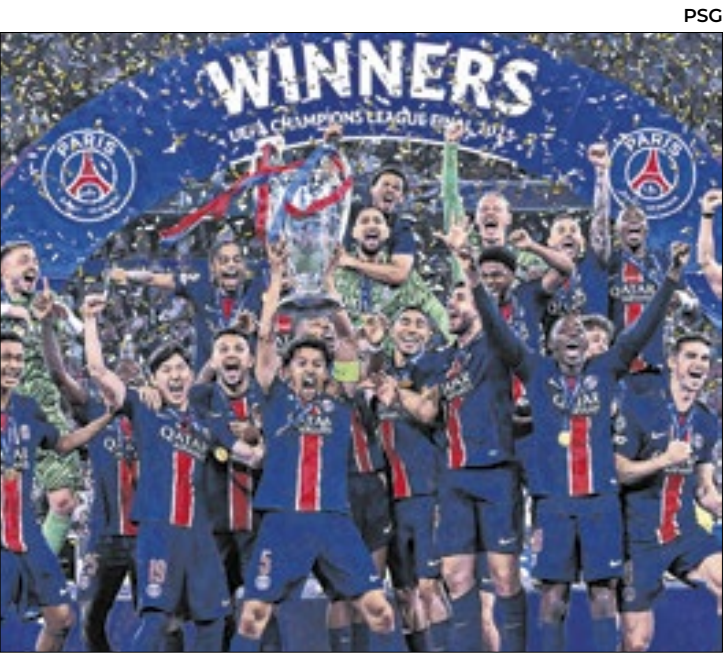
Celebrações da torcida deixaram três mortos na França

A França viveu um fim de semana de muitas comemorações o mais puro caos. Após a sonhada conquista inédita da Champions League pelo PSG,