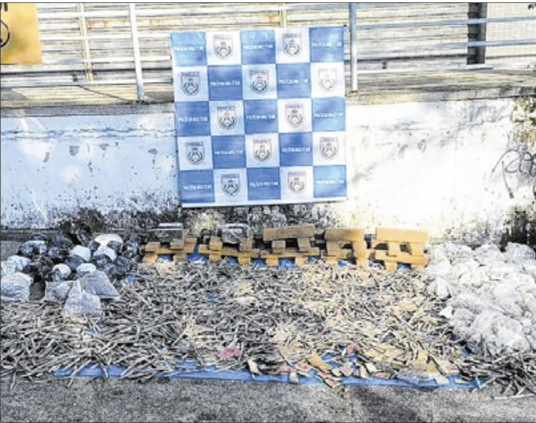
Batalhão de Ações com Cães apreendeu 204kg de drogas

leado no pescoço durante a ação e foi levado para hospital. Está fora de perigo.