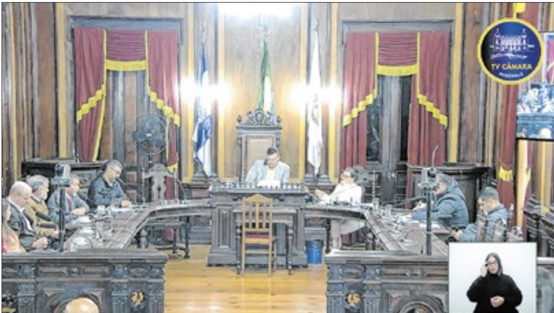
Apesar da queda na arrecadação, sefaz tem expectativa de aumento para o futuro

■ICMS (Imposto sobre Circulação de Mercadorias e Serviços): 7,36%