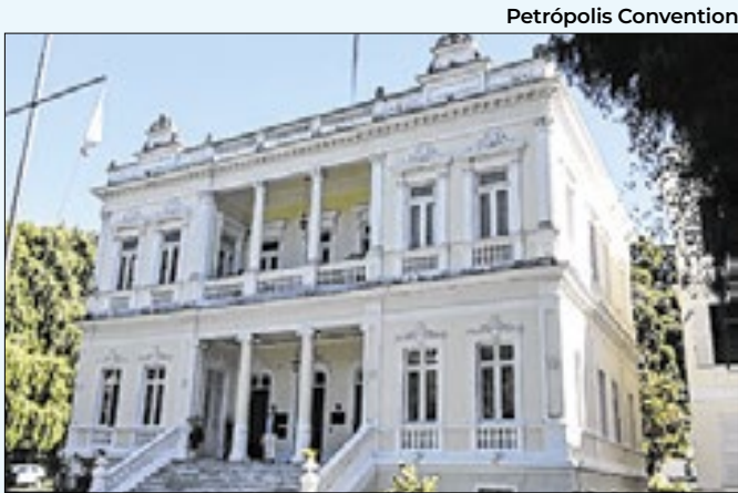
Serão 140 unidades habitacionais no local