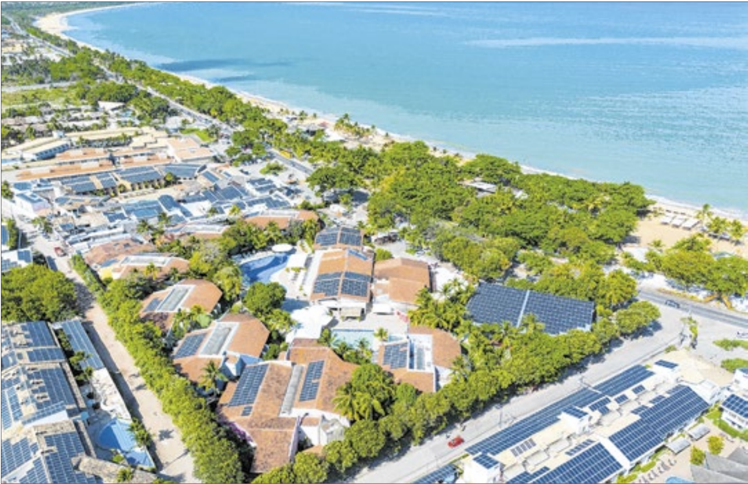
Pelo terceiro ano consecutivo, hotel está no top 10 do ranking

Localizado em frente à praia de Taperapuan, a mais badalada de Porto Seguro, o Arcobaleno é um dos mais conhecidos resorts da Bahia com infraestrutura que inclui Parque de Piscinas e o melhor Clube de Praia da região. Também é o único resort da cidade que trabalha com dois sistemas all inclusive. Além do All Inclusive Premium, por um pequeno acréscimo na diária, é possível adquirir o Max Premium, que inclui a oferta de bebidas importadas. Além disso, inclui a opção de 15 marcas de cerveja, sendo duas artesanais, e mais jantar “à la carte” e serviço 24 horas. Nos dois serviços, estão incluídas seis refeições por dia – café da manhã, petiscos, almoço, lanche da tarde, jantar e pizza noturna, além de open bar com sucos, refrigerantes, drinques e cinco marcas de cerveja.