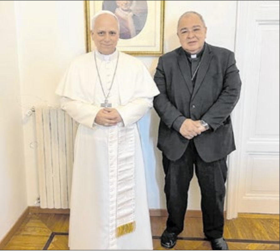
Dom Orani (direita) com o papa Leão XIV (esquerda)

O cardeal Orani João Tempesta, arcebispo metropolitano do Rio de Janeiro, definiu Robert Francis Prevost, o papa Leão XIV, como “alguém que escuta muito e acolhe antes de tomar decisões”. A fala aos jornalistas ocorreu na manhã desta quarta-feira (14), na sede da mitra arquiiepiscopal do Rio. De volta da viagem ao Vaticano, dom Orani concedeu uma entrevista sobre a participação no conclave que elegeu o novo pontífice. Para ele, os dias de clausura em Roma e os momentos vividos na Capela Sistina foram únicos. Uma das curiosidades do conclave mencionadas por dom Orani foi a experiência de se desconectar do mundo exterior. Dom Orani foi o primeiro cardeal brasileiro recebido em audiência privada pelo novo papa.