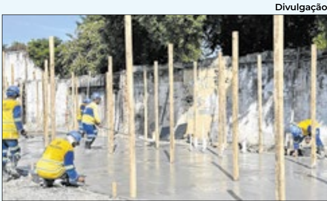
Obra foi iniciada em Nova Iguaçu após 60 anos

gem e plantio de novas mudas de árvores. A equipe da Secretaria Municipal de Serviços Públicos realizou também a limpeza do Viaduto da Bayer, no Centro. A via é um dos pontos de acessos mais conhecidos do município, que liga a tradicional Avenida Carvalhaes à Bica da Mulata.