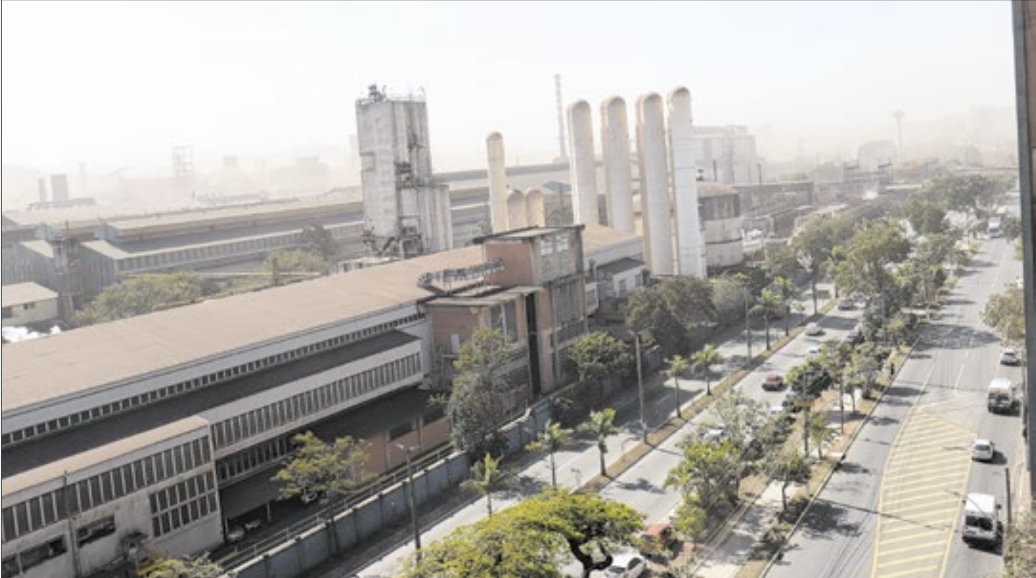
Usina Presidente Vargas é a maior poluidora de Volta Redonda, com emissão da chamada ‘fumaça preta’