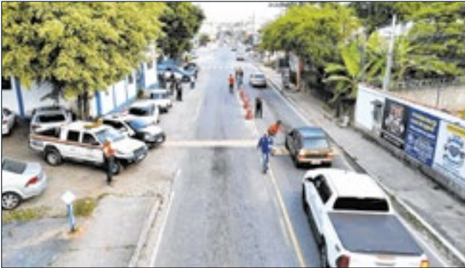
Prefeitura fez distribuição de panfletos e fiscalização

Por meio da Secretaria de Ordem Pública, Defesa Civil e Fiscalização, a prefeitura de Pinheiral intensificou nesta terça-feira (13) a campanha educativa voltada aos motoristas da cidade. Desde fevereiro, quando a secretaria foi implantada, diversas ações vêm sendo realizadas com foco na organização do trânsito, segurança