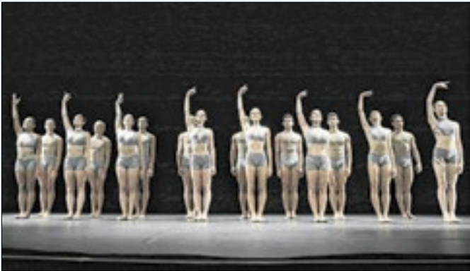
Apresentação acontece a partir de 30 de maio