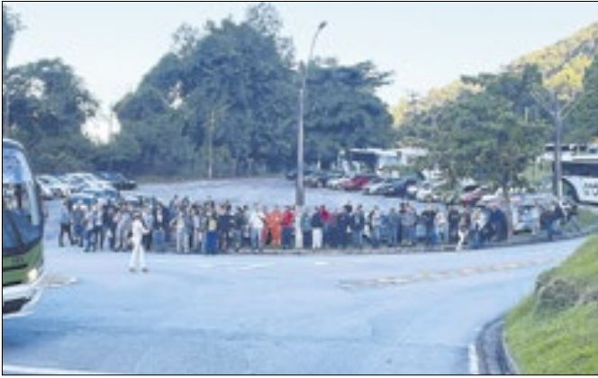
Empregados ficaram em greve por mais de 20 dias

O Acordo Coletivo de Trabalho (ACT) referente ao período 2024-2026 foi assinado entre a Eletronuclear e os sindicatos que representam os empregados das usinas nucleares de Angra dos Reis nesta terça-feira (13). A base de empregados do Rio de Janeiro,