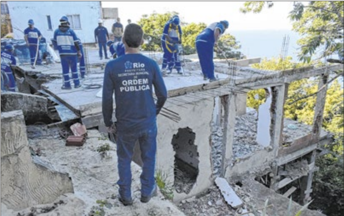
Agentes demoliram uma casa no Vidigal

equipe para profissionais, pacientes e acompanhantes. Mais do que uma data a se festejar, o dia também marca os quase 60 mil carioquinhas trazidos à vida por esta que é uma das maiores maternidades da rede pública municipal. Um marco importante para a cidade e a saúde carioca.