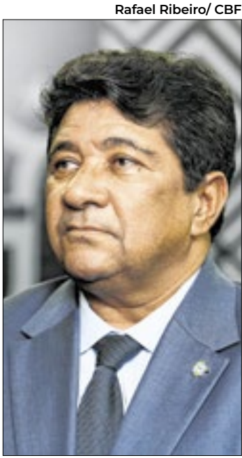
Ednaldo poderá, por exemplo, vetar o design das camisas do Brasil

fez na quarta (14) um requerimento por uma audiência pública na Comissão de Esporte da Câmara sobre as mudanças no estatuto da CBF. O parlamentar é apoiador de Bolsonaro, mas também é do mesmo estado e partido do ex-presidente da Câmara, Arthur Lira. A reforma estatutária foi feita em novembro de 2024 e aprovada por unanimidade pelas federações. O novo estatuto da CBF ainda não está nos canais oficiais da entidade, mas pode ser consultado em cartório no Rio. Quando a CBF disse há algumas semanas de que o novo uniforme seguiria o que diz o estatuto, referindo-se às cores da camisa, ela acabou revelando implicitamente um dos efeitos práticos da nova versão do documento. A aprovação dos mo-