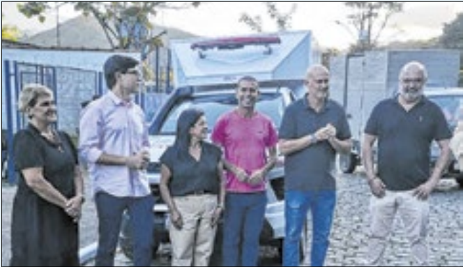
Veículo vai atender a população de Visconde de Mauá

Uma importante conquista para a Saúde de Resende foi anunciada nesta sexta-feira (07) pelo prefeito Tande Vieira. A cidade contou com a chegada da primeira ambulância 4x4, destinada especialmente ao atendimento da população de Visconde de Mauá e região. O anúncio foi feito antes da abertura oficial da tradi-