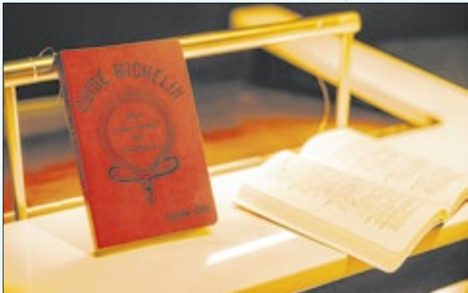
Rio tem oito estabelecimentos estrelados