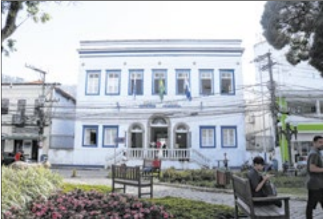
Sede da Prefeitura de Angra dos Reis

A população de Angra dos Reis terá acesso gratuito a serviços e orientações importantes para a declaração anual do Imposto de Renda e para o fortalecimento do empreendedorismo local. Nesta quinta-feira (15), das 9h às 16h, a Praça Codrato de Vilhena, no centro, receberá a Ação