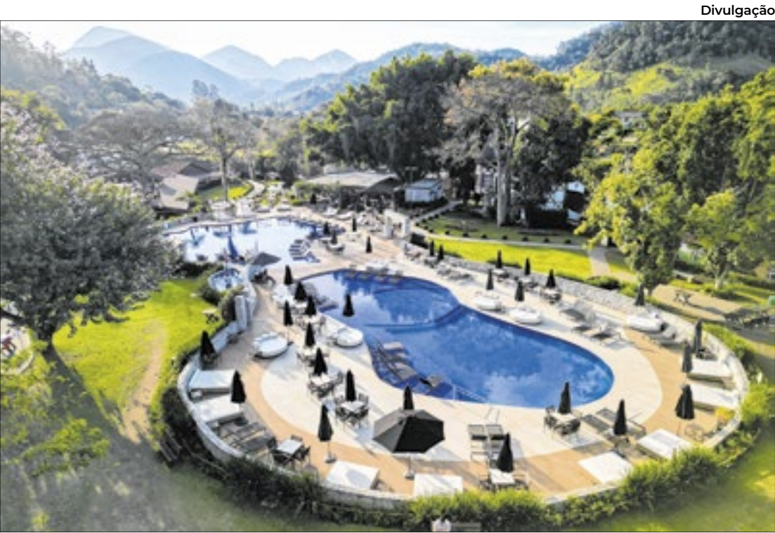
Figura entre os 10 melhores do mundo