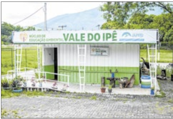
Evento reúne municípios da Baixada e Sul Fluminense

A cidade de Japeri será sede, nesta quinta (15), de uma oficina regional de Planejamento Plurianual de Educação Ambiental. O evento reunirá representantes de nove municípios da Baixada e Sul Fluminense, no Núcleo de Educação Ambiental Vale do Ipê, das 9h às 16h30. A iniciativa é promovida pela Prefeitura Municipal, por meio da Secretaria do Ambiente e Desenvolvimento Sustentável, em parceria com o Instituto Estadual do Ambiente