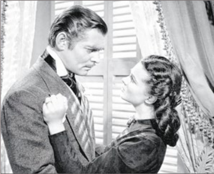
‘E O Vento Levou’ é um dos filmes selecionados para a mostra

Mostra em salas do Grupo Estação resgata filmes estrelados pelos grandes astros do cinema