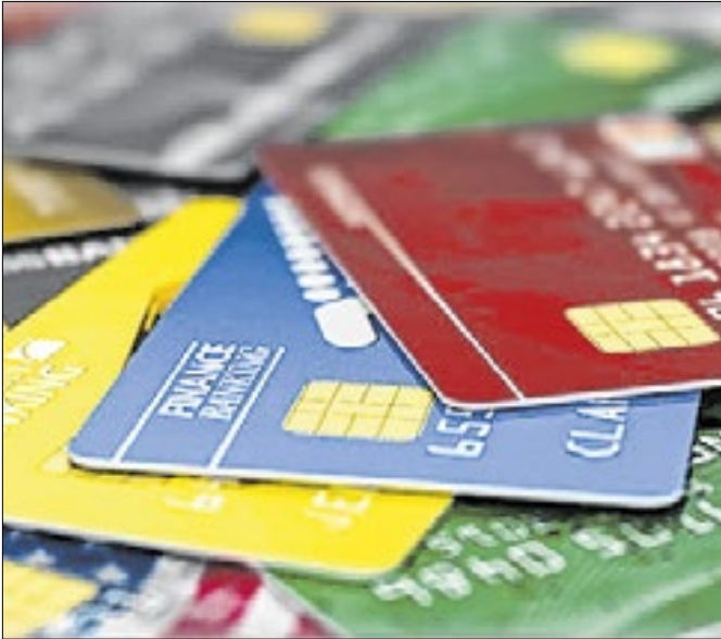
População de 30 a 39 anos são os mais negativados