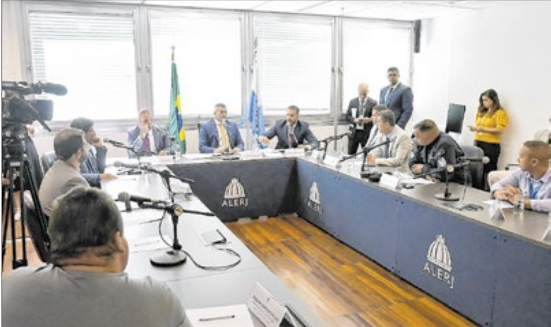
‘CPI da Transparência’ da Alerj debate fiscalização de reboques no Estado do Rio