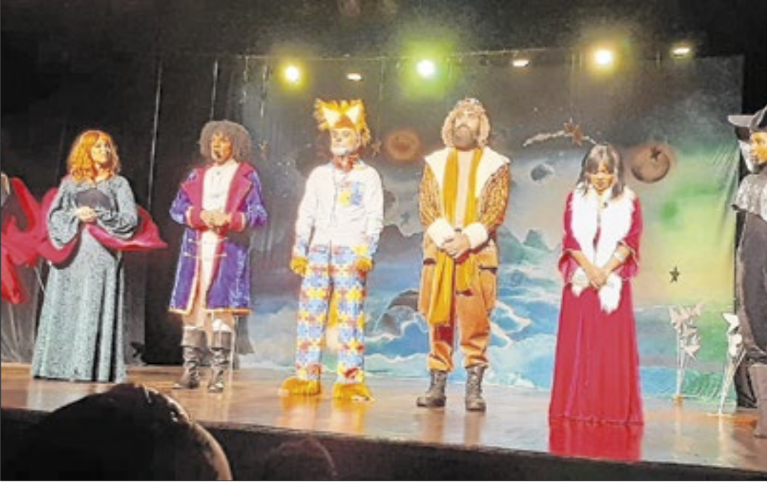
Público poder assistir a três apresentações gratuitas

No próximo domingo (18), às 10h, o público poderá conferir o espetáculo “O Pequeno Príncipe: Uma viagem aos planetas inclusivos”, da Cia. Rindo à Toa. A apresentação conta a clássica história em uma versão única, na qual o Pequeno Príncipe viaja para outros planetas da Via Láctea com sua rosa, com o objetivo de ajudar a trazer para a Terra pessoas com necessidades especiais e reeducar outras que não têm habilidade, sensibilidade ou respeito pelo próximo. A peça trata de