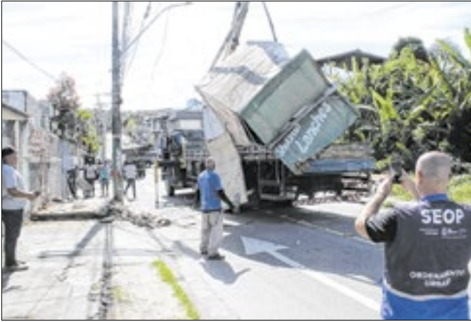
Administração não abre mão de ordenamento urbano

A Secretaria de Ordem Pública da Prefeitura de São Gonçalo, através da Subsecretaria de Fiscalização de Posturas, realizou, nesta manhã de terça-feira (13), a remoção de dois trailers irregulares que estavam abandonados na Rua Francisco Neto, no bairro Raul Veiga. Os locais estavam sendo utilizados como abrigo para usuários de drogas, que também ameaçavam a população, segundo denúncias dos moradores.