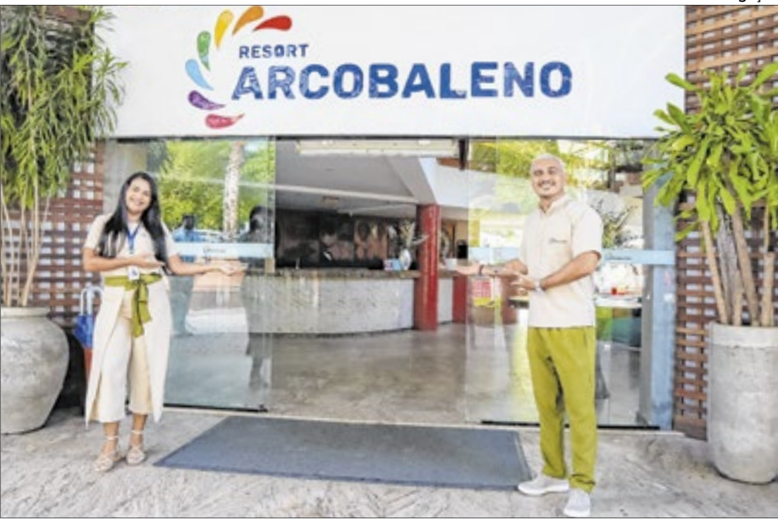
Hotel ocupa a terceira posição na edição de 2025