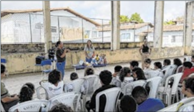
Ação incluiu promoção de saúde e prevenção de doenças

A Prefeitura de Búzios, por meio da Secretaria Municipal de Saúde, realizou mais uma edição do Programa Saúde na Escola (PSE), nesta terça-feira (13), na Escola Municipal João José de Carvalho, no bairro Rasa. A ação aconteceu em dois turnos: das 9h às 11h30 e das 13h30 às 16h. Atendeu estudantes com atividades educati-