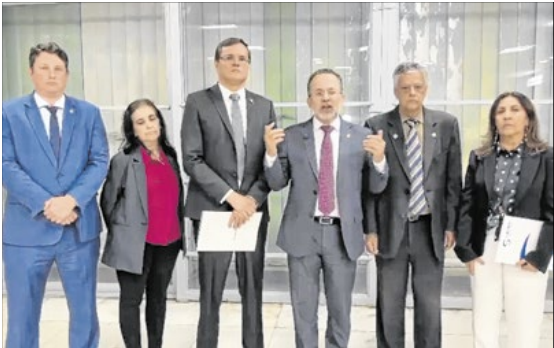
Representantes da Receita saíram “frustrados” da reunião