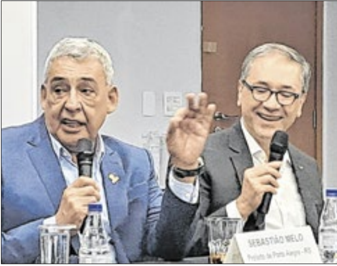
Sebastião Melo: FNP briga com CNM por impostos