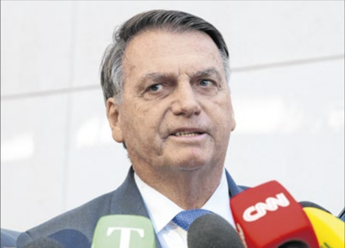
Bolsonaro disse confiar em reverter sua situação

Ele ainda completou que conversou com comandantes das Forças Armadas por serem pessoas de confiança para ele. “É o meu círculo de amizade, eu fui militar”, afirmou.