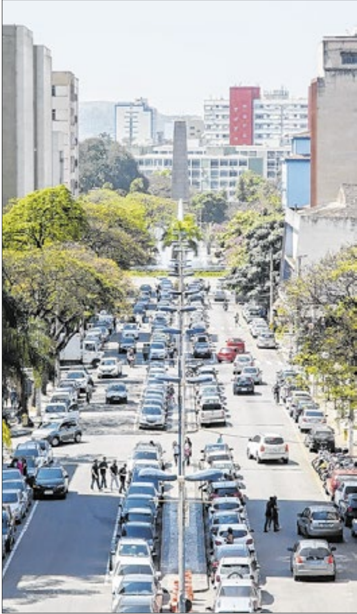
Projeto inicia no dia 26 de maio em Volta Redonda

O “Qualifica Impacto Comunidades” lança projeto em Volta Redonda, que oferecerá cursos gratuitos de qualificação profissional, com início previsto em 26 de maio. A iniciativa é voltada especialmente para moradores de regiões com baixo desenvolvimento econômico e social, com foco em inclusão digital e geração de renda. As inscrições são gratuitas e já estão abertas.