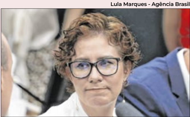
Crime foi cometido no mandato anterior

Ao insistir no tema de Ramagem, o presidente da Câmara procura demonstrar uma simpatia pública — ainda que inútil — com a situação de acusados de tentativa de golpe. Pela proposta que levou toco no STF, a ação contra Bolsonaro e aliados também seria suspensa.