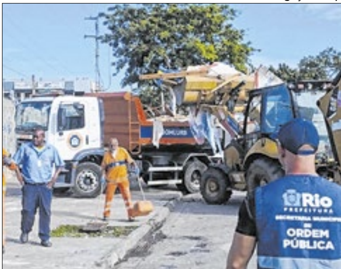
Operação aconteceu na Mangueira