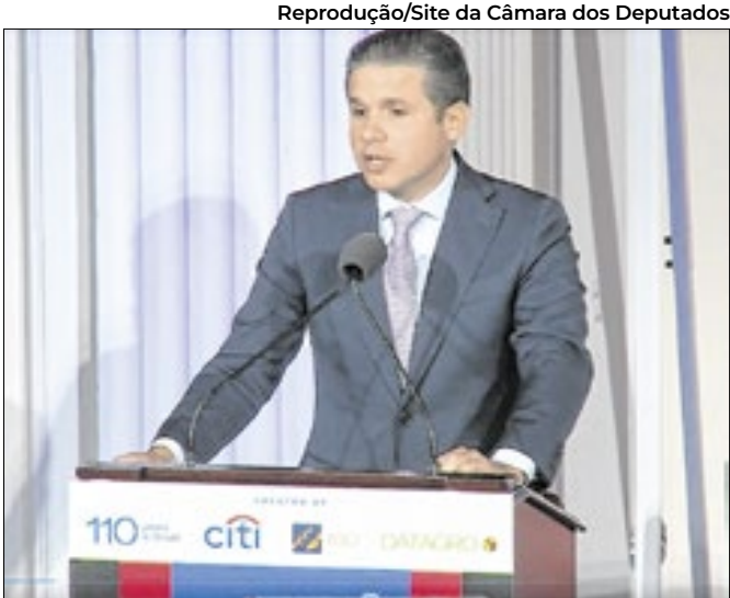
Motta participou ontem de evento em Nova York