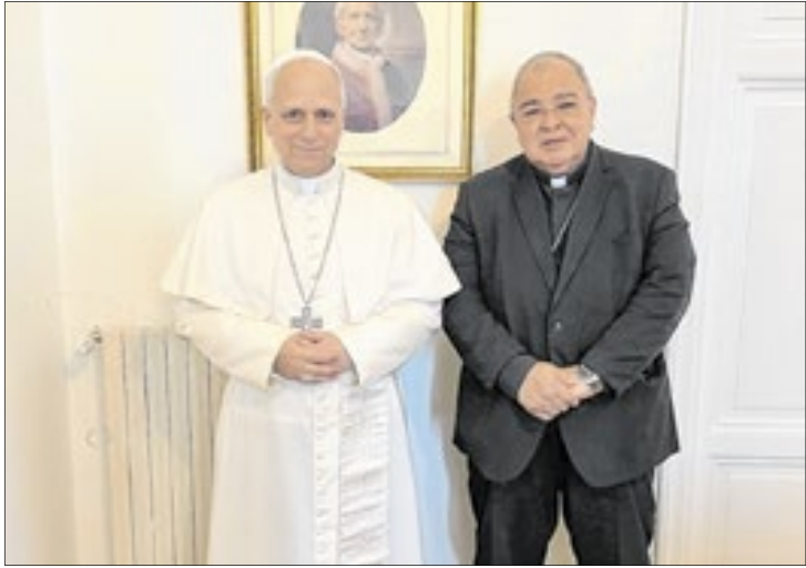
Papa Leão XIV e o Cardeal Dom Orani Tempes- ta em Roma

Antes do encontro nesta semana, ele também relem- brou outros momentos de diálogos entre os dois, como durante a comissão da Amé- rica Latina, “passamos uma