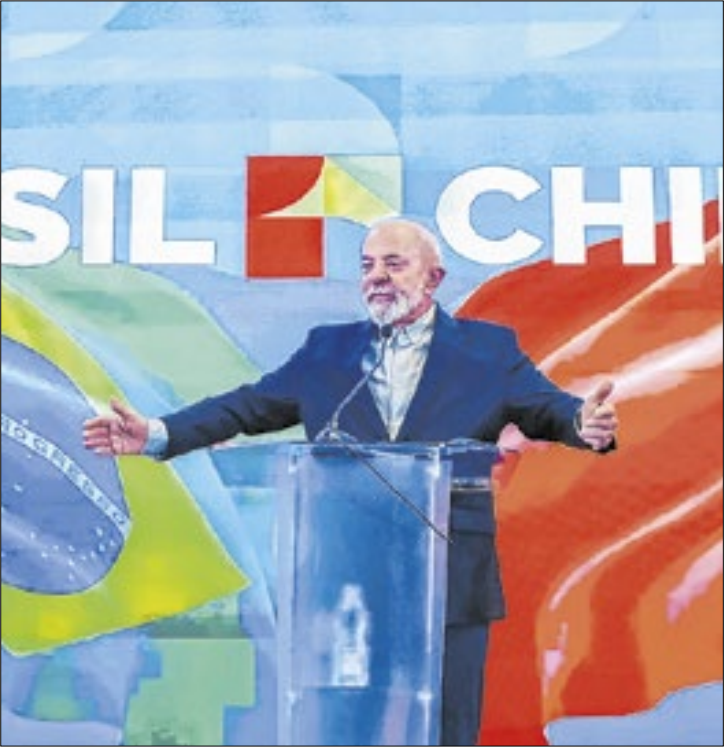
Lula: alguém “teve a pachorra” de vazar a conversa

Ao explicar o contexto, Lula disse que havia pedido ao presidente chinês para enviar alguém de seu governo para conversas sobre uma regulamentação no ambiente digital brasileiro para evitar “absurdos”.