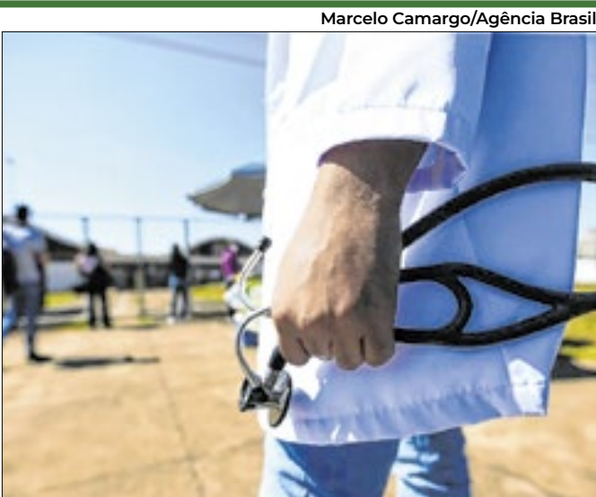
Prova é feita em duas etapas e aborda cinco áreas