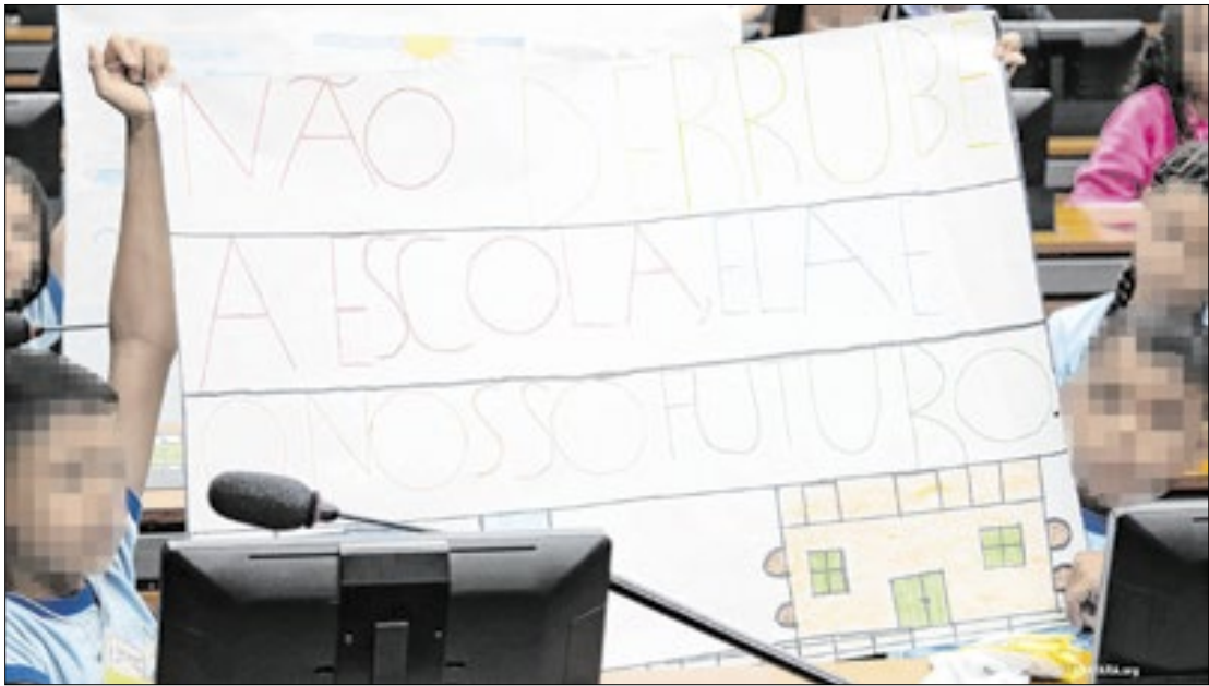
Crianças protestaram contra a construção da usina