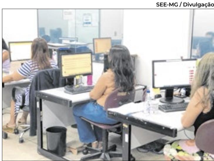
Sistema desburocratiza processos de solicitação

a burocracia do papel e unificar os processos, modernizamos a gestão das contratações temporárias, proporcionando mais transparência e agilidade para todos os candidatos”, destaca. Implementado inicialmente em caráter piloto na Superintendência Regional de Ensino (SRE) de Januária, em março deste ano, o Siaut foi desenvolvido com o objetivo de otimizar os processos da rede estadual de ensino, para facilitar a solicitação de autorizações para que profissionais possam lecionar em áreas diferentes de sua formação ou atuar como secretários e diretores em escolas públicas e privadas da educação básica. O novo sistema organiza e padroniza dados, automatiza etapas e reduz significativa-