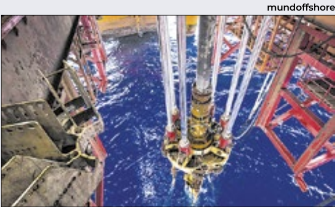
Recuo do petróleo no exterior ‘acende alerta’ na estatal

No pedido de reavaliação dos limites máximos de repasse das perdas, a Light avaliou que há distorção causada pela consideração de dados defasados, sem considerar a “expressiva queda do mercado” de baixa tensão, consumidores residenciais, pela crise econômica no Rio de Janeiro.