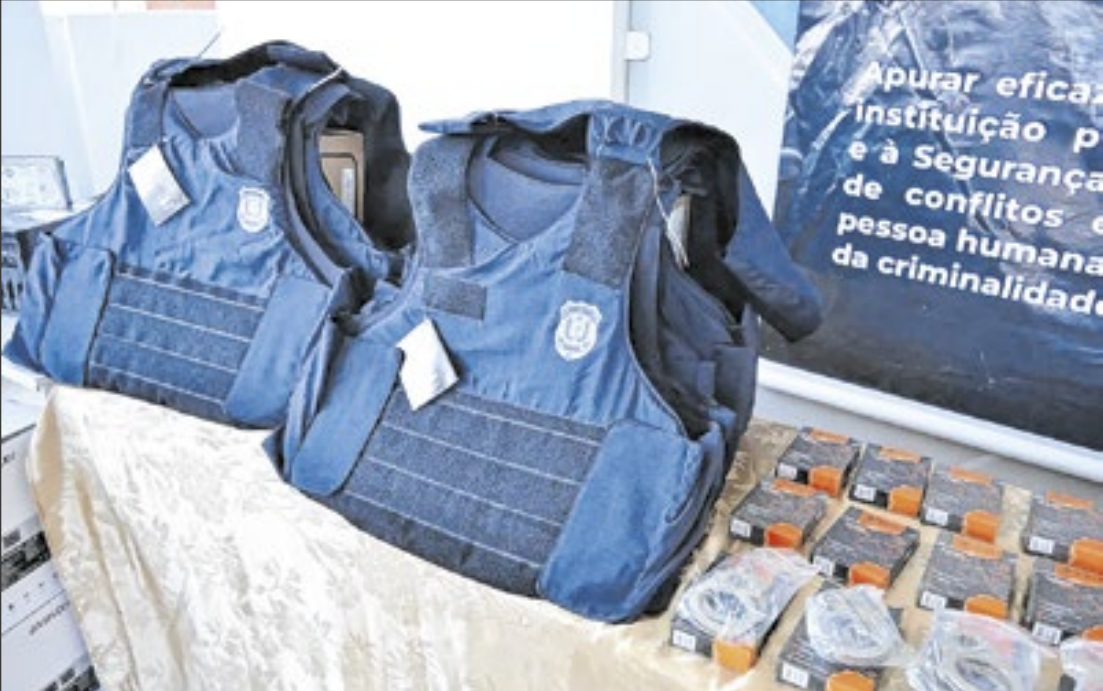
Entrega de equipamentos reforça delegacias em Macapá e interior do estado

Além dos homicídios, houve redução de 49,29% nos roubos. Foram pouco mais de 1 mil