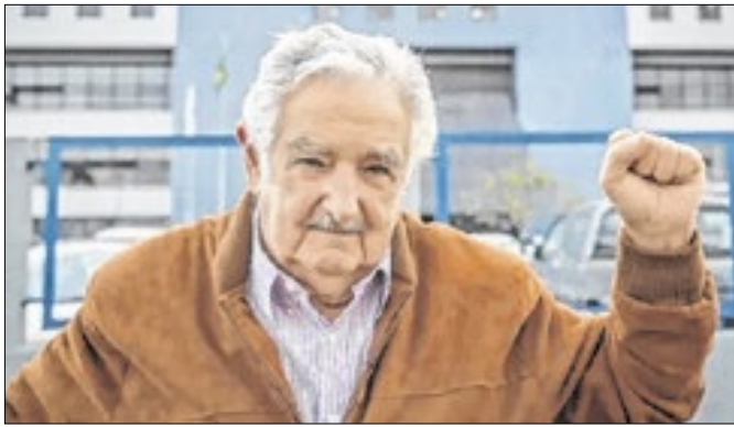
Ricardo Stuckert/ PR

autos evidenciam a falta de uma manutenção preventiva por parte do responsável pelos aparelhos de ar-condicionado”. Além disso, segundo a denúncia, a empresa responsável pela fabricação dos contêineres destinados ao alojamento dos adolescentes, tinha uma janela gradeada por quarto, portas de correr que emperraram durante o incêndio e uma única porta de saída descentralizada, localizada distante do quarto 1, onde todos os jovens que ocupavam o lugar, morreram. Por Douglas Corrêa (Agência Brasil)