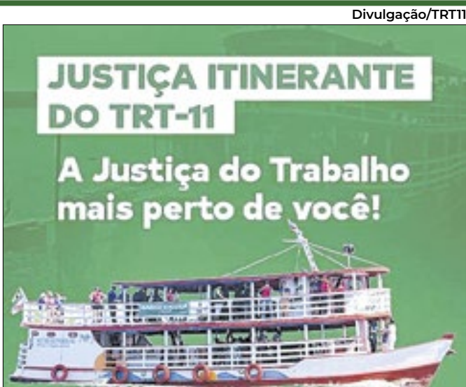
Haverá expedição de notificações e intimações