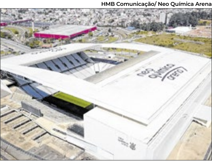
HMB Comunicação/ Neo Química Arena

Uma das oito sedes brasileira da Copa do Mundo de 2027, São Paulo tenta ganhar a disputa nos bastidores e levar o jogo de abertura para o estádio do Corinthians. Para isso, terá pelo menos três meses até a Fifa bater o martelo. O calendário de partidas da Copa Feminina ainda não está definido. Até o momento, a entidade máxima do futebol só divulgou quais sedes e estádios foram escolhidos para o evento. A Fifa trabalha para fechar a agenda até outubro. Por enquanto, representantes da organização estão fazendo novas visitas às arenas contempladas para analisar as estruturas antes de divulgarem quais jogos serão realizados em cada estádio. São Paulo busca convencer a Fifa de