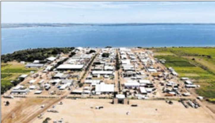
Edição de 25 anos e terá painel com negócios e serviços