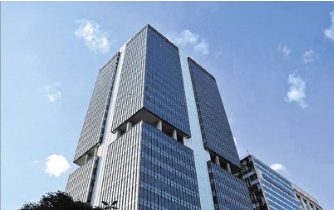
Documento do colegiado deixa claro que política contracionista (juros altos) deve prosseguir

Em outro trecho do documento, o comitê esclarece que “a política monetária significativamente contracionista já tem contribuído e seguirá con-