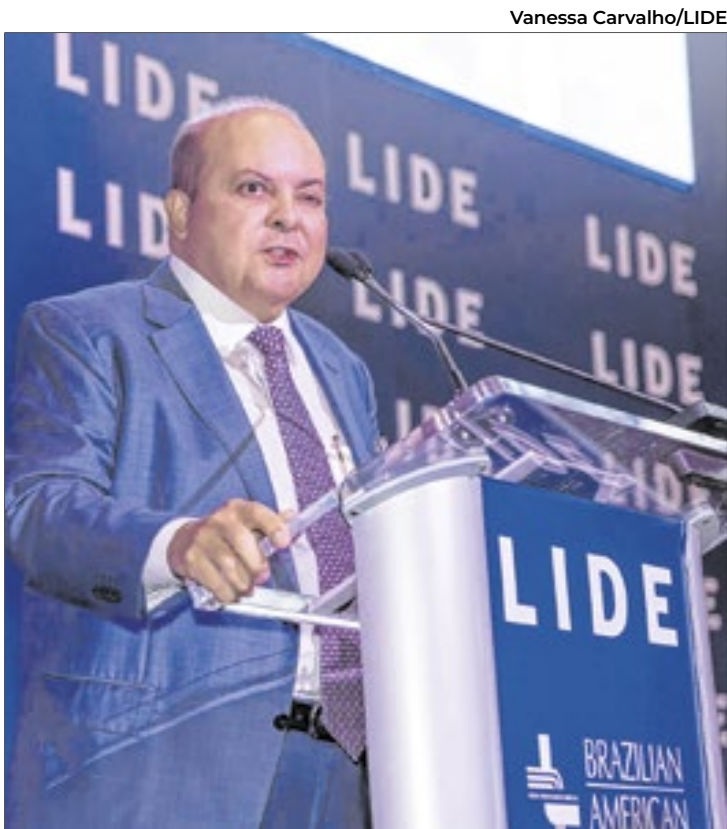
Em Nova Iorque, Ibaneis Rocha destacou Brasília

Enquanto o Brasil disputa espaço no radar dos grandes investidores internacionais, governadores de diferentes regiões do país apresentaram no LIDE Brazil Investment Forum, em Nova Iorque, suas visões sobre o caminho para fortalecer a economia nacional. Em comum, todos defenderam um modelo de gestão pragmático, baseado em reformas estruturantes, estabilidade institucional e uma relação madura com o setor privado. Para o governador do Distrito Federal, Ibaneis Rocha (MDB), o principal desafio do Brasil é garantir previsibilidade para investidores. Ele foi enfático ao afirmar: “O que nós precisamos é ter um olhar de futuro e deixar de lado as ideologias. Desenvolvimento se faz com pragmatismo, com responsabilidade, com segurança jurídica.” Ibaneis ainda destacou que Brasília, além de centro político, se consolida como polo logístico e de serviços. Coube ao governador do DF ainda destacar o crescimento do turismo na capital, o aumento da balança comercial com os Estados Unidos e o legado desenvolvimentista