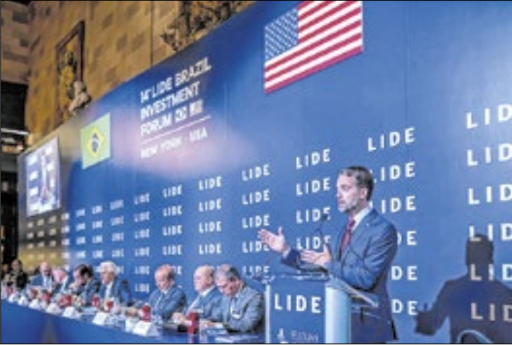
Leite deu detalhes da recuperação do Rio Grande do Sul

ponsabilidade fiscal e visão de futuro”, afirmou. Do ano passado para cá, o Rio Grande do Sul recuperou-se da tragédia das grandes enchentes no início de 2024.