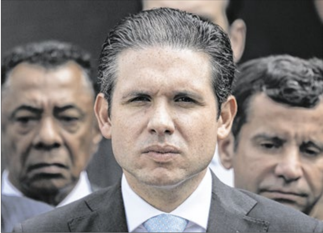
Motta recorreu ao plenário do STF contra decisão da Primeira Turma