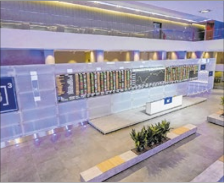
Avanço forte de ‘blue chips’ garante alta histórica da bolsa