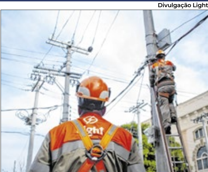
Suspensão via avaliar aumento de dívida para R$ 11,5 bi