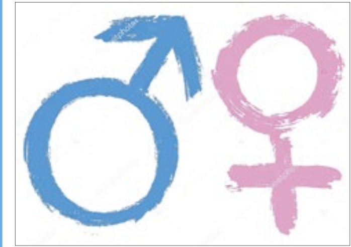
Decreto assinado ontem por Celina Leão prevê atuação de um pool de secretarias e da sociedade

A governadora em Exercício, Celina Leão (PP), assinou decreto ontem instituindo no Distrito Federal a Semana de Promoção da Saúde Sexual e Reprodutiva, cujas ações serão realizadas anualmente, na primeira semana do mês de maio. “Deverão ser promovidas ações educativas, campanhas de conscientização, palestras, seminários, workshops e atividades culturais voltadas para a promoção da saúde sexual e reprodutiva, com ênfase na prevenção de doenças sexualmente transmissíveis,