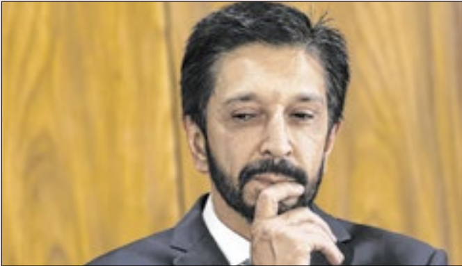
Federação fortalece possibilidade de Nunes