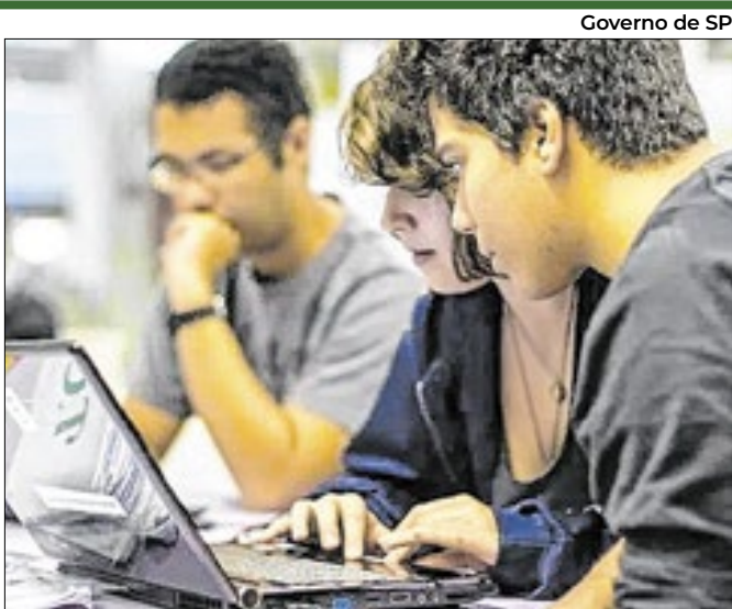
Programa é voltado à introdução de pessoas