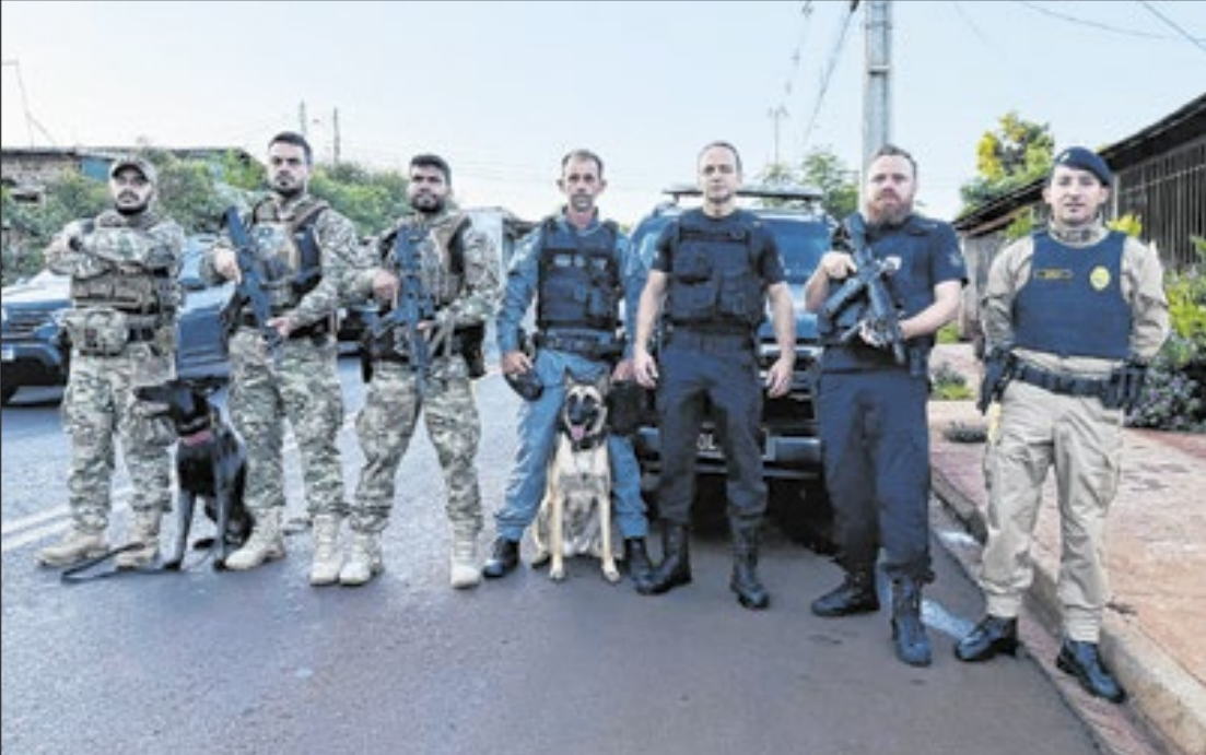
O Paraná tem se destacado pela combinação de ações preventivas

Com esse resultado, o Estado mantém a trajetória de diminuição da violência letal que se consolidou nos últimos anos. Desde 2018, a taxa caiu 12,5%, reforçando o papel do Paraná como referência nacional em políticas públicas de segurança. No número absoluto de homicídios, o Paraná também registrou a segunda maior queda do Brasil, com redução de 14,8% entre 2022 e 2023. A variação do índice, que ficou atrás