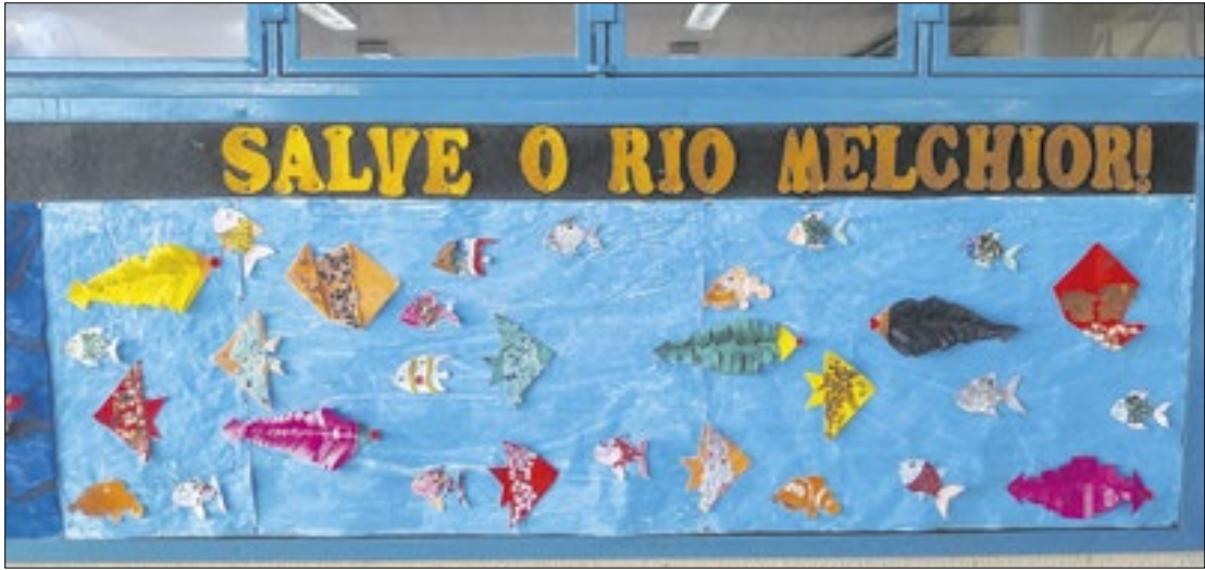
Impactos da usina sobre o Rio Melchior discutidos

“Eu gosto muito dos professores. Eu quero pedir que não derrubem a escola, eu a amo demais”