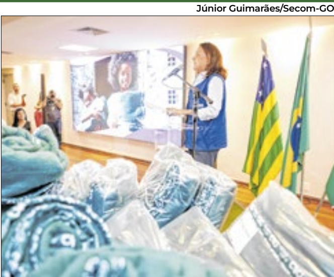
“Aquecendo Vidas” prevê arrecadação de 105 mil itens

Uso de nirsevimabe objetiva reduzir complicações e internações