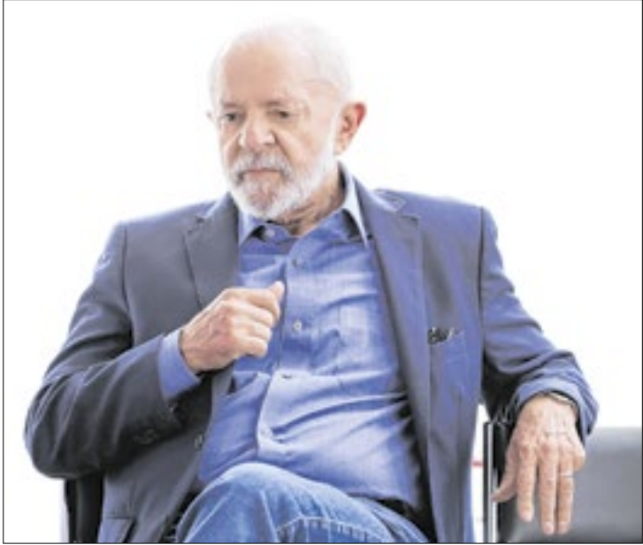
Lula vê-se às voltas com novo problema para administrar

No período da manhã, a PF deflagrou a operação “Face