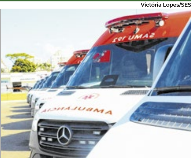
A cerimônia de entrega ocorreu em Florianópolis

A Secretaria de Estado de Saúde realizou, na manhã desta segunda-feira, 12, a entrega de sete novas ambulâncias e 50 veículos Fiat Cronos para 57 municípios catarinenses. A cerimônia ocorreu em São José, na Grande Florianópolis, com a presença de autoridades estaduais. Os veículos foram adquiridos por meio de uma emenda parlamentar federal no valor de R$ 7,6 milhões. As ambulâncias serão utilizadas para atendimentos médicos de urgência e emergência, enquanto