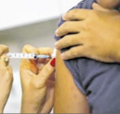
Vacinação é fundamental

Após as fortes chuvas que atingiram o município de Três Rios nas últimas semanas, a Prefeitura, por meio do “Programa Mais Prefeitura nos Bairros”, mobilizou diversas equipes para um amplo mutirão de limpeza urbana. A ação,