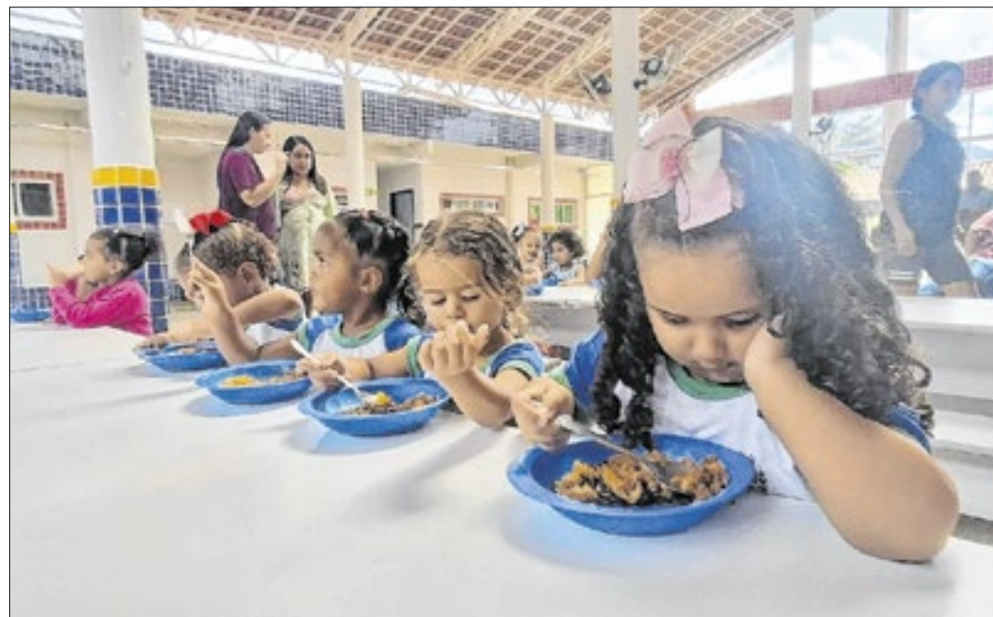
PMJ Gestora avaliou o cardápio, a higiene nas cozinhas e a aceitação das refeições

“Todas as nossas escolas estão com merenda. Viemos conferir pessoalmente como os serviços vêm sendo realizados e como é a