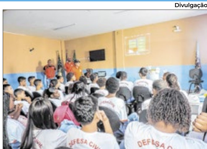
Divulgação Edição 2025 do programa já começou para os alunos