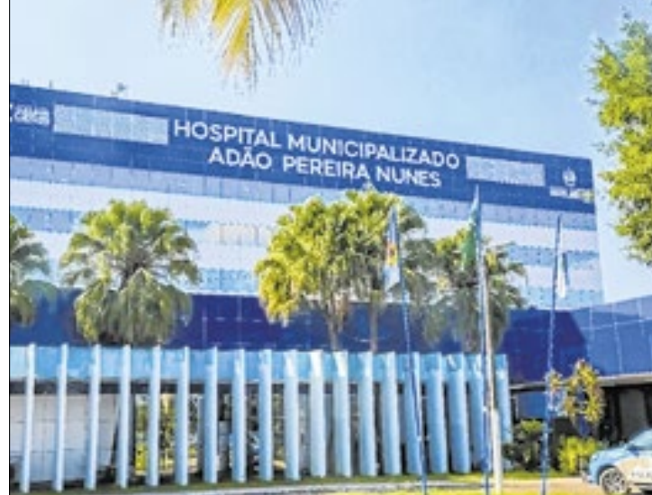
Reprodução Municipalização do Adão Pereira Nunes completou três anos em 2025

O HMAPN é referência em urgência e emergência de média e alta complexidades, oferecendo especialidades e os serviços de clínica médica; ortopedia e traumatologia; neurocirurgia; cirurgias: geral, vascular, pediátrica, plástica,