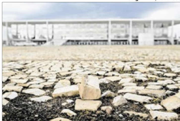
As pedras portuguesas, soltas, se tornaram "marca registrada" do abandono do espaço nobre da cidade