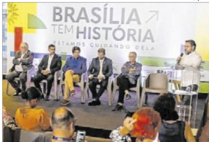
Autoridades do Iphan Nacional anunciam investimentos de R$ 22 milhões no restauro da Praça dos Três Poderes

Federal (GDF) para ações de preservação em outros bens tombados da capital.