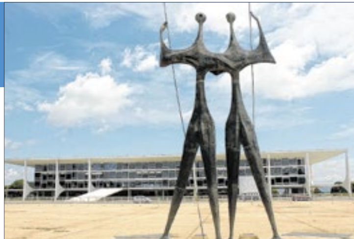
A estátua 'Os Candangos' será revitalizada, junto com a reforma da Praça dos Três Poderes

O evento, realizado no Sesi Lab, também marcou a celebração de uma parceria entre o Instituto e o Governo do Distrito