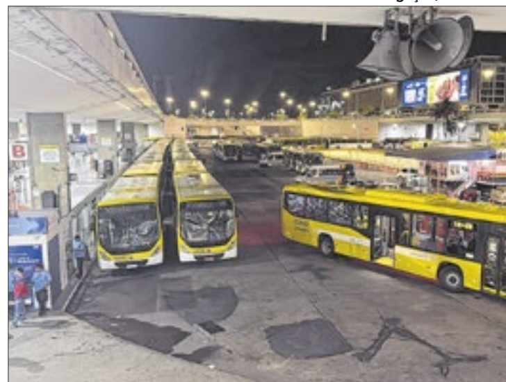
O dia de maior movimento foi a quinta (17), quando o transporte coletivo registrou 1.251.449 acessos, 22% a mais que na quinta-feira da Semana Santa de 2024

Já no aniversário de Brasília, 21 de abril, os acessos