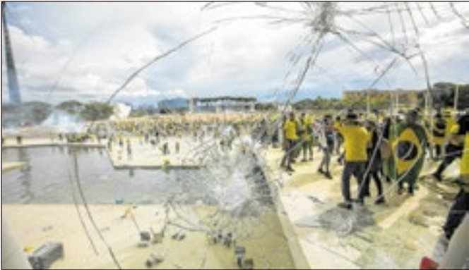
Quem depredou acalentava depor o governo?

Curioso como agora a discussão entre os aliados do ex-presidente Jair Bolsonaro se dê em torno de uma lei que ele sancionou. O “feitiço contra o feiticeiro” lembra um pouco o que veio também a acontecer com o presidente Luiz Inácio Lula da Silva, quando não disputou as eleições de 2018: na ocasião, condenado, Lula