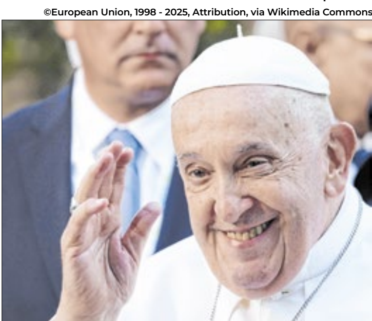
Enfermeiro do Papa o incentivou a passear no Papamóvel