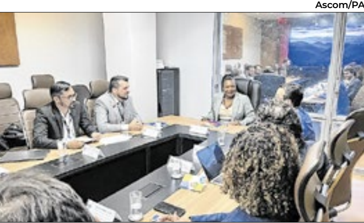
Encontro de Gestores de Cultura inclui cultura popular