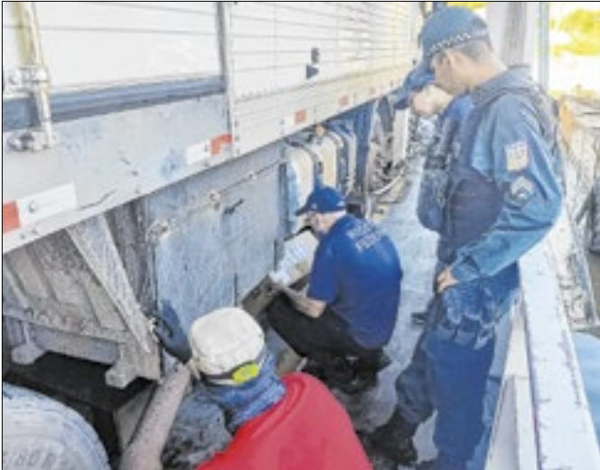
Acordo fortalece combate ao contrabando na Amazônia