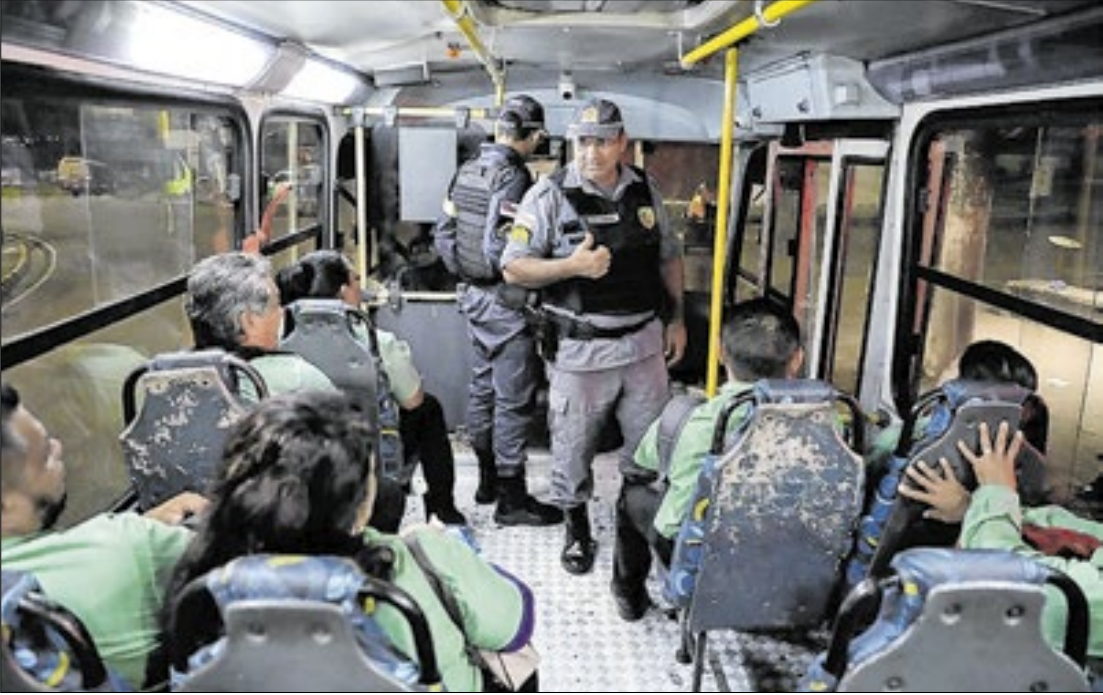
Forças de segurança atuam em conjunto e focam ações em trajeto do Distrito Industrial

Manaus registrou, entre janeiro e março de 2025, o menor número de roubos ao transporte coletivo dos últimos oito anos, de acordo com o que foi divulgado pela Agência Amazonas na terça-feira (22).