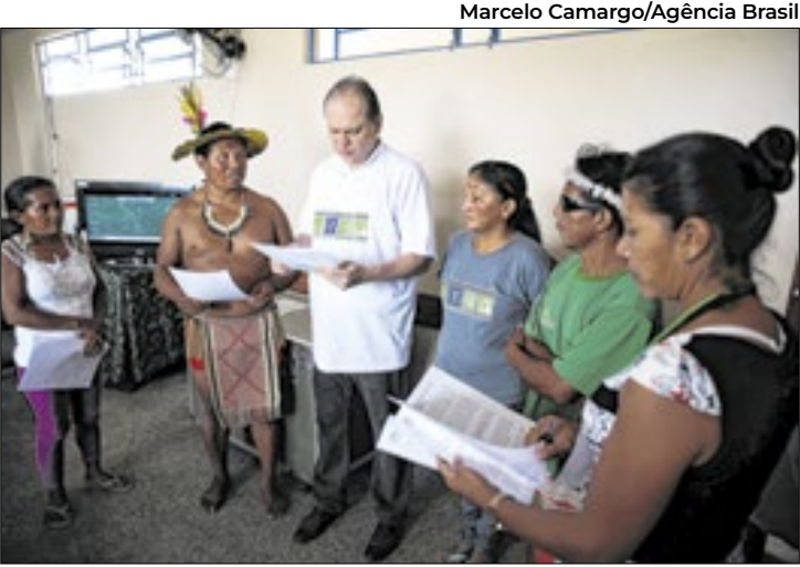
Acesso à internet de qualidade permitirá a telessaúde

“Na agenda de ação, o MPI e o governo brasileiro estão engajados em anunciar novos mecanismos financeiros, como o Fundo Florestas Tropicais para Sempre (TFFF) e a renovação da Promessa, onde países e setores da filantropia se comprometem em apoiar organizações indígenas e políticas indigenistas”, informou o ministério.