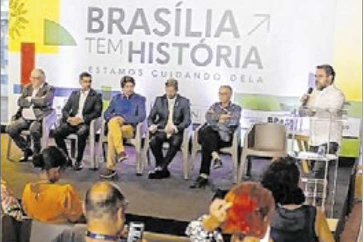
Autoridades do Iphan Nacional anunciam investimentos de R$ 22 milhões no restauro da Praça dos Três Poderes

Federal (GDF) para ações de preservação em outros bens tombados da capital.