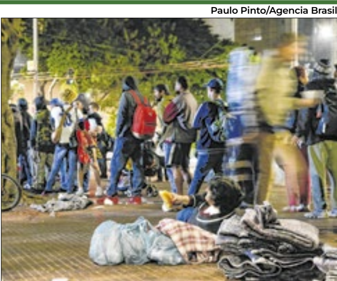
Dados do observatório da Universidade Federal de MG

O número de pessoas vivendo em situação de rua em todo o Brasil registradas no Cadastro Único para Programas Sociais (CadÚnico) do governo federal, em março deste ano, chegou a 335.151. Se comparado ao registrado em dezembro de 2024, quando havia 327.925 pessoas nessa situação, houve um aumento de 0,37% no primeiro trimestre deste ano.