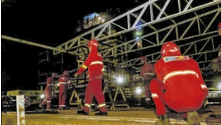
Estado tem maior crescimento proporcional de vagas