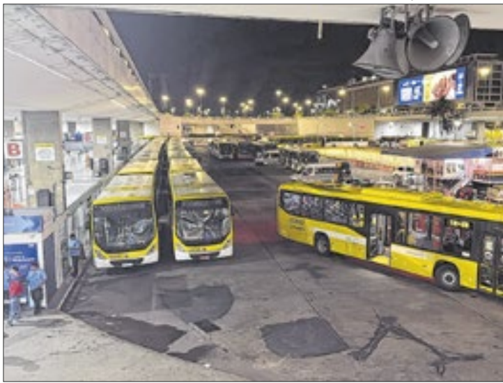
O dia de maior movimento foi a quinta (17), quando o transporte coletivo registrou 1.251.449 acessos, 22% a mais que na quinta-feira da Semana Santa de 2024

Já no aniversário de Brasília, 21 de abril, os acessos