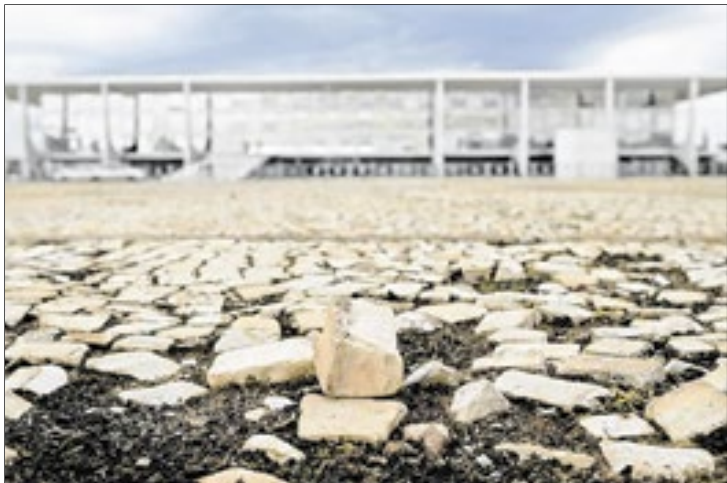
As pedras portuguesas, soltas, se tornaram “marca registrada” do abandono do espaço nobre da cidade