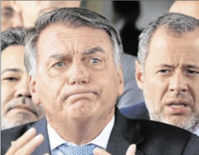
Foi Bolsonaro quem sancionou a lei

O presidente da Câmara, Hugo Motta (Republicanos-PB), poderá ter conversas com ministros do Supremo Tribunal Federal (STF) antes da reunião de líderes da quinta-feira (24), quando poderá haver decisão sobre a tramitação do projeto de anistia aos presos do 8 de janeiro de 2023. Motta vem tentando costurar uma alternativa que evite que a aprova-