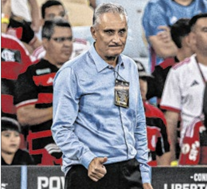
Tite encerrou as negociações com o Corinthians por isso

O técnico Tite, que era considerado o favorito para assumir o cargo de treinador do Corinthians, vago desde a demissão do argentino Ramón Díaz, declinou do convite para reassumir o comando do alvinegro. Segundo o clube, as partes ficaram muito próximas do acerto e o treinador era esperado para assinar o contrato e já comandar os trabalhos da equipe nesta terça-feira (22). “No entanto, por uma decisão pessoal, Tite resolveu pausar momentaneamente a sua carreira para cuidar da sua saúde física e mental”, disse o Corinthians em nota. “Entendi que existem momentos em que é preciso compreender que, como ser humano, posso ser vulnerável e admitir isso certamente irá me tornar mais forte”, declarou o treinador. “Sou um apaixonado pelo que faço e assim seguirei sendo,