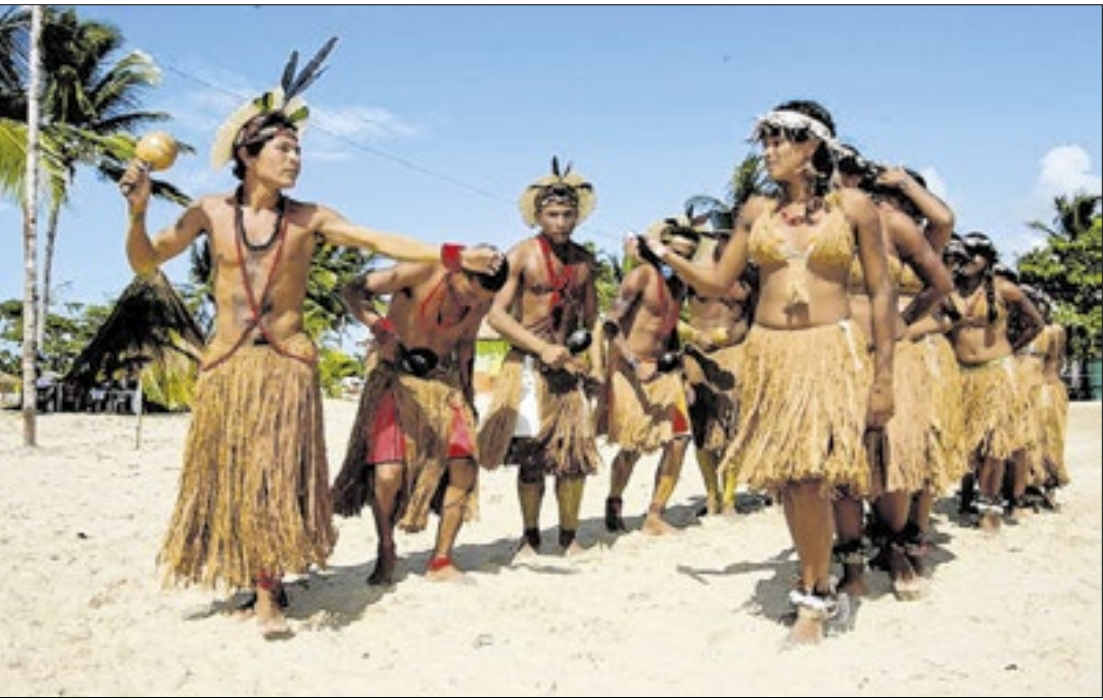
Grupo Pataxó na Bahia. O estado concentra uma das maiores populações da região

Região tem 238 etnias e dobrou população indígena em 12 anos