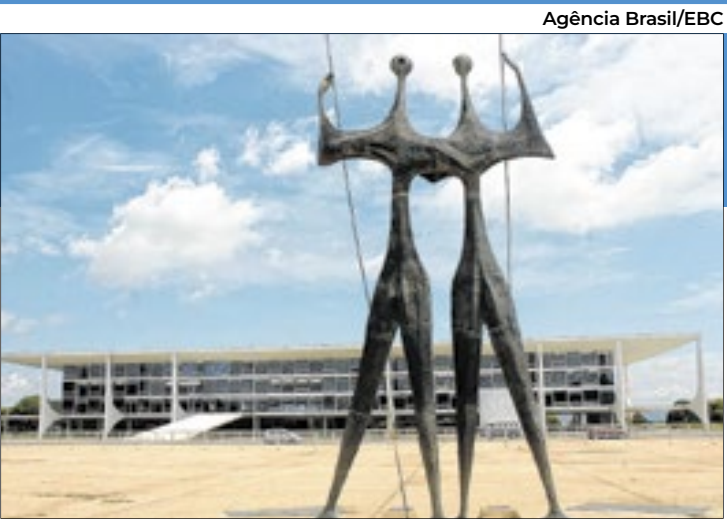
A estátua ‘Os Candangos’ será revitalizada, junto com a reforma da Praça dos Três Poderes

O evento, realizado no Sesi Lab, também marcou a celebração de uma parceria entre o Instituto e o Governo do Distrito