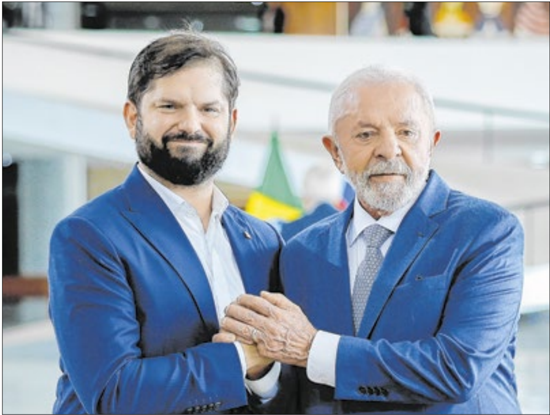
Ricardo Stuckert / PR

Além das tarifas, o presidente do BC ressaltou a incerteza gerada pela falta de clareza sobre os desdobramentos dessas medidas, o que acaba adiando decisões de consumo e investimento. “Há uma incerteza sobre o que irá ocorrer. Quais tarifas, de fato,