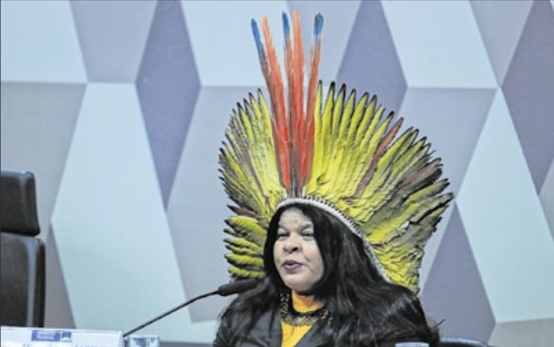
A pasta direciona esforços para a 30ª Conferência da ONU sobre Mudança do Clima

Em nota divulgada hoje, o Ministério dos Povos Indí-