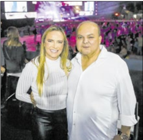
No área VIP da festa em Brasília, o governador e a vice-governadora da capital federal, Ibaneis Rocha e Celina Leão