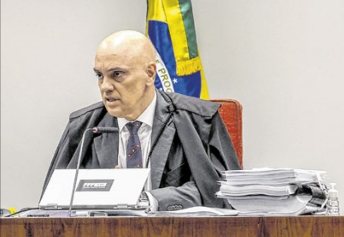
Moraes sobre sua participação: “investigado não escolhe juiz”

Todos eles são acusados pelos mesmos crimes do que os réus do núcleo 1, assim como todos os núcleos do plano, já que o indiciamento da Procuradoria-Geral da República foi o mesmo para todos os envolvidos. A diferença está no papel