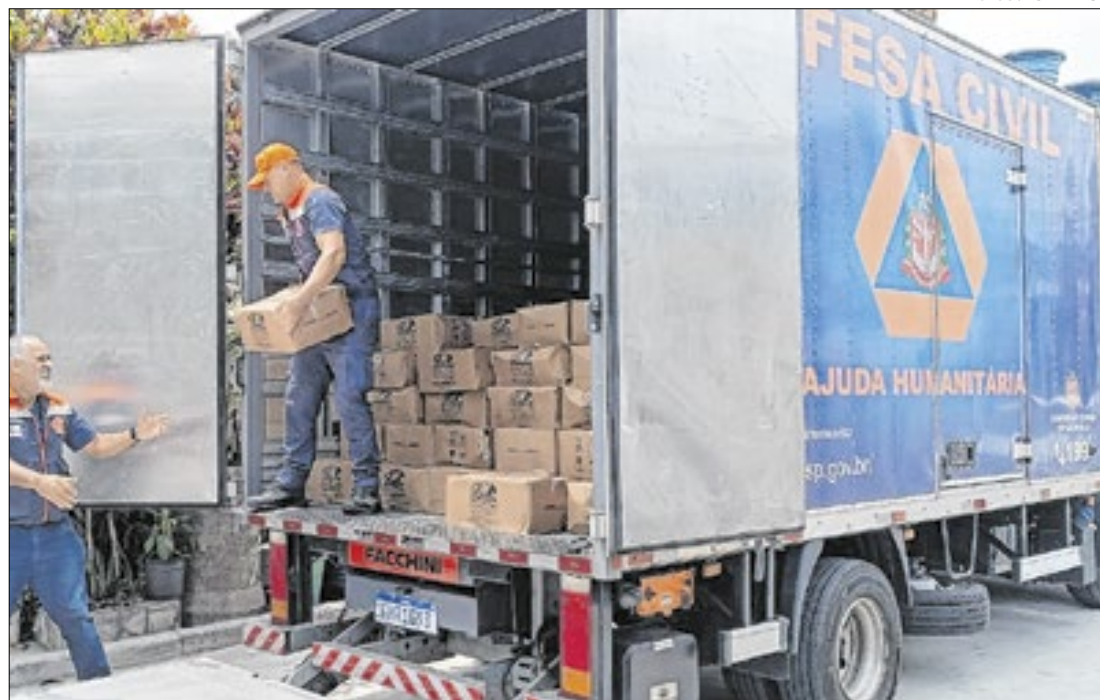
Defesa Civil - SP

Defesa Civil monitora municípios com maiores volumes