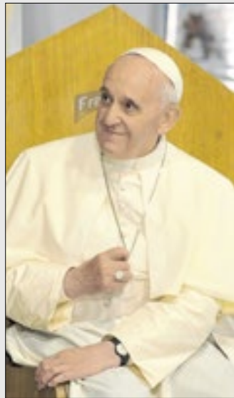
"O sepulcro deve ser na terra, simples, sem decoração especial e com a única inscrição: Franciscus"

terra; simples, sem decorações especiais e com a única inscrição: Franciscus.