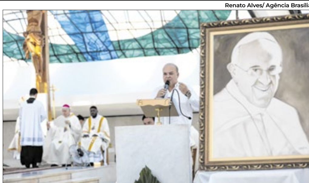
Renato Alves/ Agência Brasília