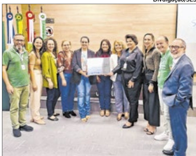
Projeto visa garantir a manutenção da amamentação