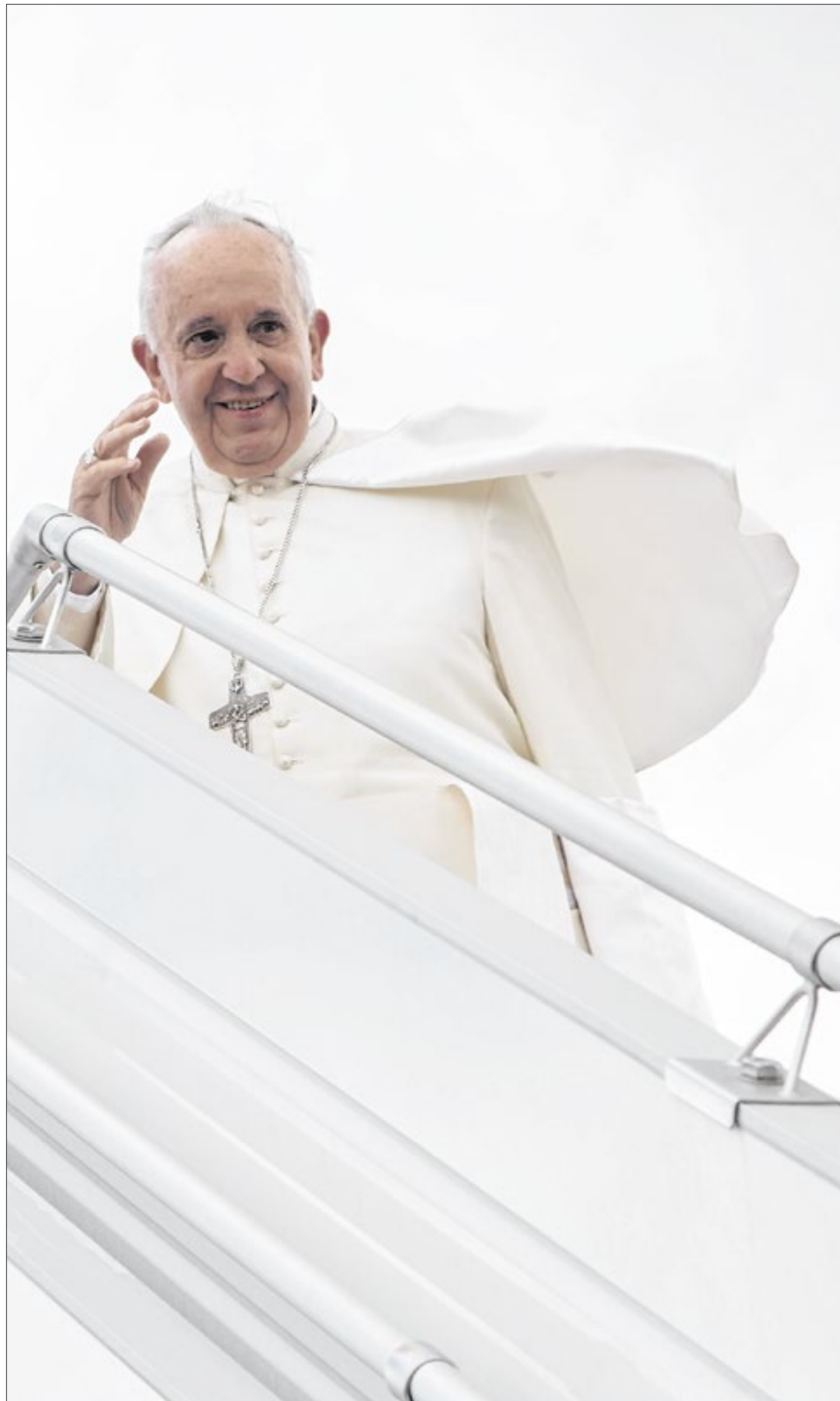
Papa Francisco dedicou sua influência para, principalmente, trazer a Igreja novamente para perto do povo

“Quanto desejo de morte vemos todos os dias em tantos conflitos que ocorrem em diferentes partes do mundo! Quanta violência vemos com frequência também nas famílias, dirigida contra as mulheres ou