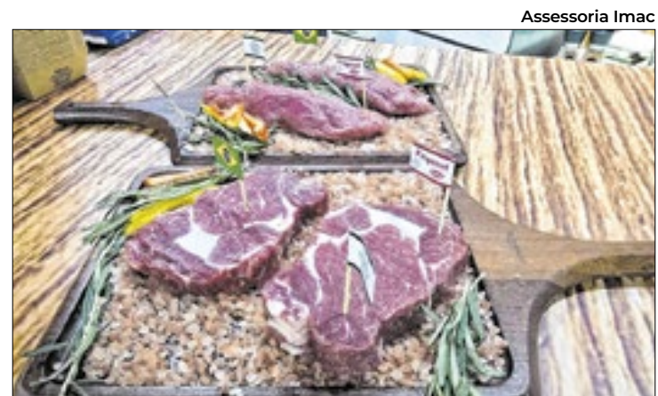
Produto respondeu por 80% das exportações

A cerimônia litúrgica contou com a presença de autoridades locais, incluindo o governador e a primeira-dama, Mayara Noronha Rocha. Ambos participaram do ato religioso em homenagem à capital e se juntaram aos fiéis que prestaram tributo ao papa. Durante o evento, o arcebispo de Brasília, cardeal Paulo Cezar Costa, conduziu os ritos e destacou a importância do líder religioso