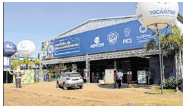
Gestão lançou edital de chamamento público