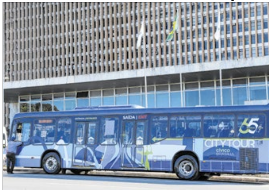
Paulo H. Carvalho/ Agência Brasília

"Estamos fazendo a retomada do turismo cívico para fortalecer o pertencimento e passar a história da capital e do sonho de