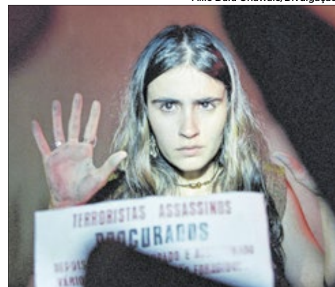
A atriz Valentina Herzage em cena de ‘Ainda Estou Aqui’, cujo sucesso internacional despertou interesse nas produções brasileiras