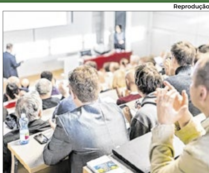
Reprodução Conferência debaterá cidades sustentáveis e justiça

Mais de R$ 10 milhões já foram investidos nos últimos meses