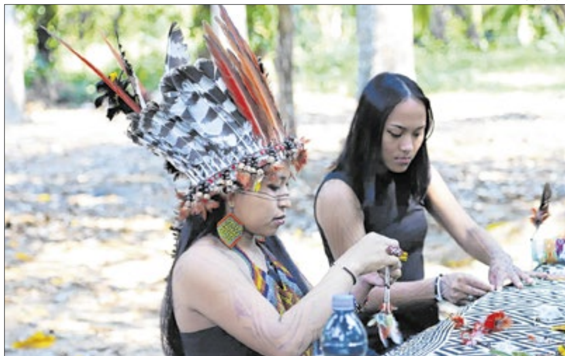
Coletivo é fortalecido por mulheres, que levam a cultura e simbologia às peças

Lideranças indígenas e personalidades do Acre têm ganhado ainda mais força mundialmente após a criação da