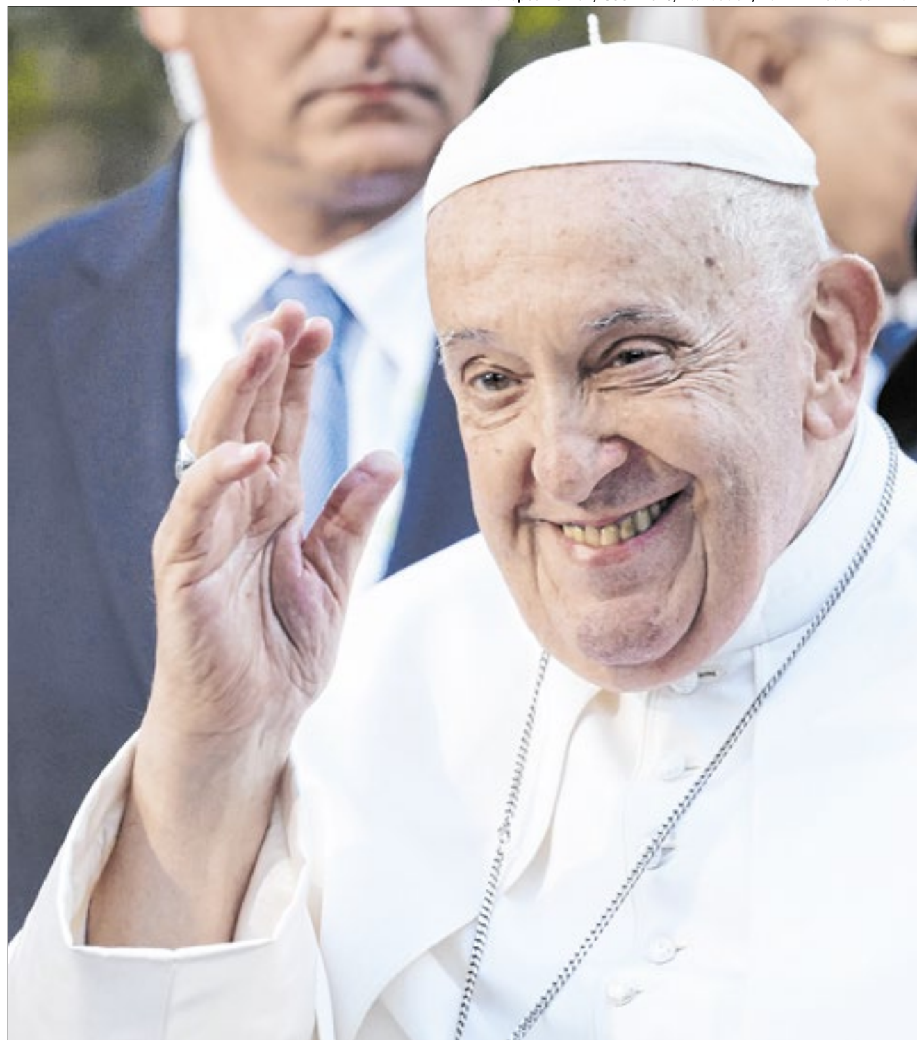
O papado de Francisco deixa um legado eterno de amor, misericórdia, perdão e inclusão

Dentre tantos eventos históricos vividos neste papado, talvez nenhum tenha sido tão emblemático quanto a pandemia do Novo Coronavírus. Com o mundo trancando dentro de casa, o Papa fez um gesto de esperança em 27 de março de 2020. No auge da pandemia, o Santo Padre rezou sozinho a missa na Praça de São Pedro, dando bênção e indulgência aos fiéis do mundo. A foto de Francisco rezando sozinho foi a imagem da pandemia, dando ao planeta a real noção do tamanho da crise que era vivida naquele momento. Em suas palavras, ele pediu atenção às “pessoas comuns”, que não “aparecem nas manchetes”.