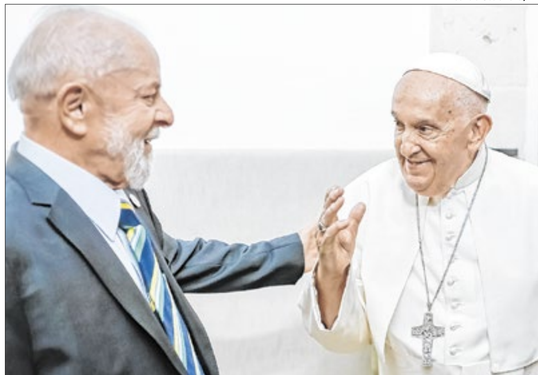
Pontífice faleceu nesta segunda-feira, aos 88 anos

Jorge Mario Bergoglio assumiu o papado em 2013 e, nos últimos anos, enfrentava problemas de saúde. Em fevereiro, foi internado para exames e tratamento de uma bronquite, permanecendo 38 dias hospitalizado. Recebeu alta em 23 de março e seguia em recuperação. Sua última aparição pública foi no domingo (20), durante a bênção de Páscoa na Praça de São Pedro, quando falou brevemente aos fiéis. O Papa faleceu às 7h35 (horário de Roma), nesta segunda-feira (21), no Vaticano,