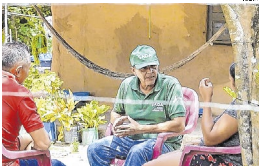
Ascm-PI A iniciativa tem mudado a vida de milhares de agricultores familiares no Piauí

A UPA 24h de Picos na Bahia completa um ano no último domingo (20). Foram mais de 68 mil atendimentos e 59 mil exames, sendo referência em urgência para adultos. A unidade atende 42 municípios da região e conta com 186 profissionais, entre diretos e terceirizados.