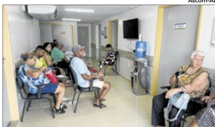
Ascom-AL Laboratório de palmilhas 3D foi implantado

Para Libonato Rocha, da Sada, o impacto do programa vai além da estrutura: é compromisso com o agricultor, orientando tecnicamente para agregar valor e melhorar a vida no campo.