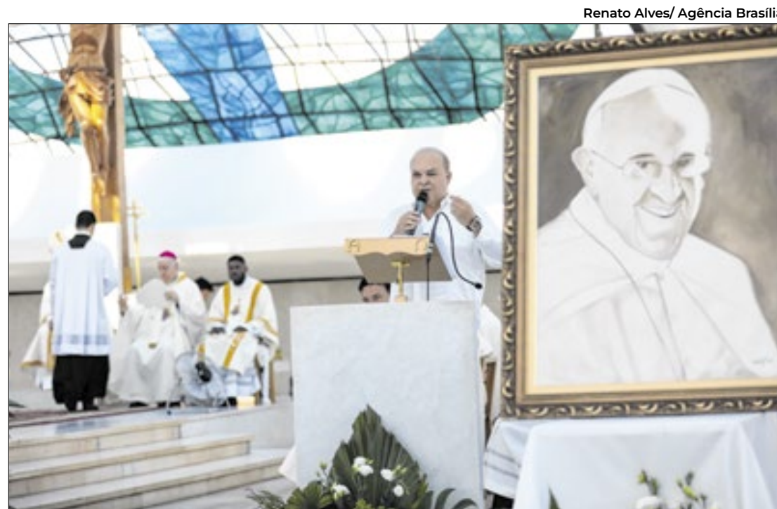
Governador do DF, Ibaneis Rocha, decreta sete dias de luto pela morte do Papa