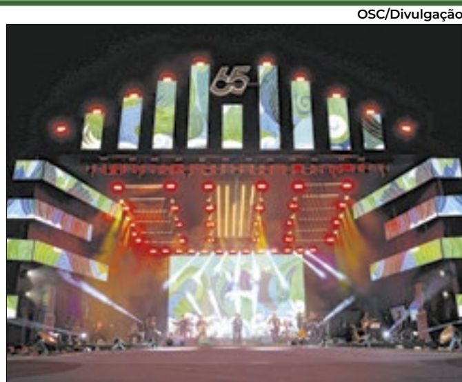
Festa em comemoração aos 65 anos de Brasília

Homenagem ao Papa comove fiéis na Catedral Metropolitana