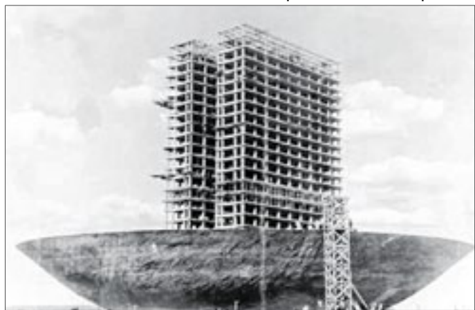
Niemeyer era "apaixonado" pela solução adotada para as cúpulas, que parecem suspensas

Ele também explica a simbologia das duas cúpulas e sua relação com o processo legislativo. "Cada uma de uma forma