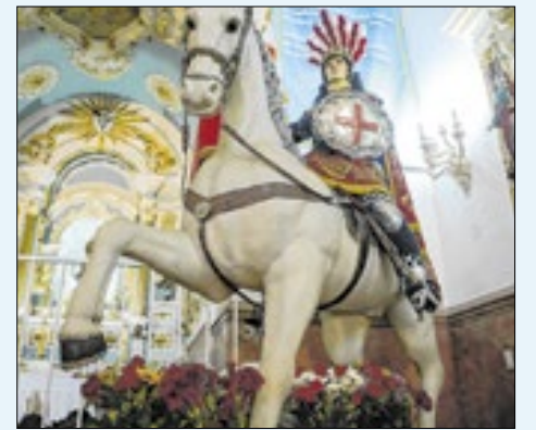
Igreja de São Jorge, na Praça da República