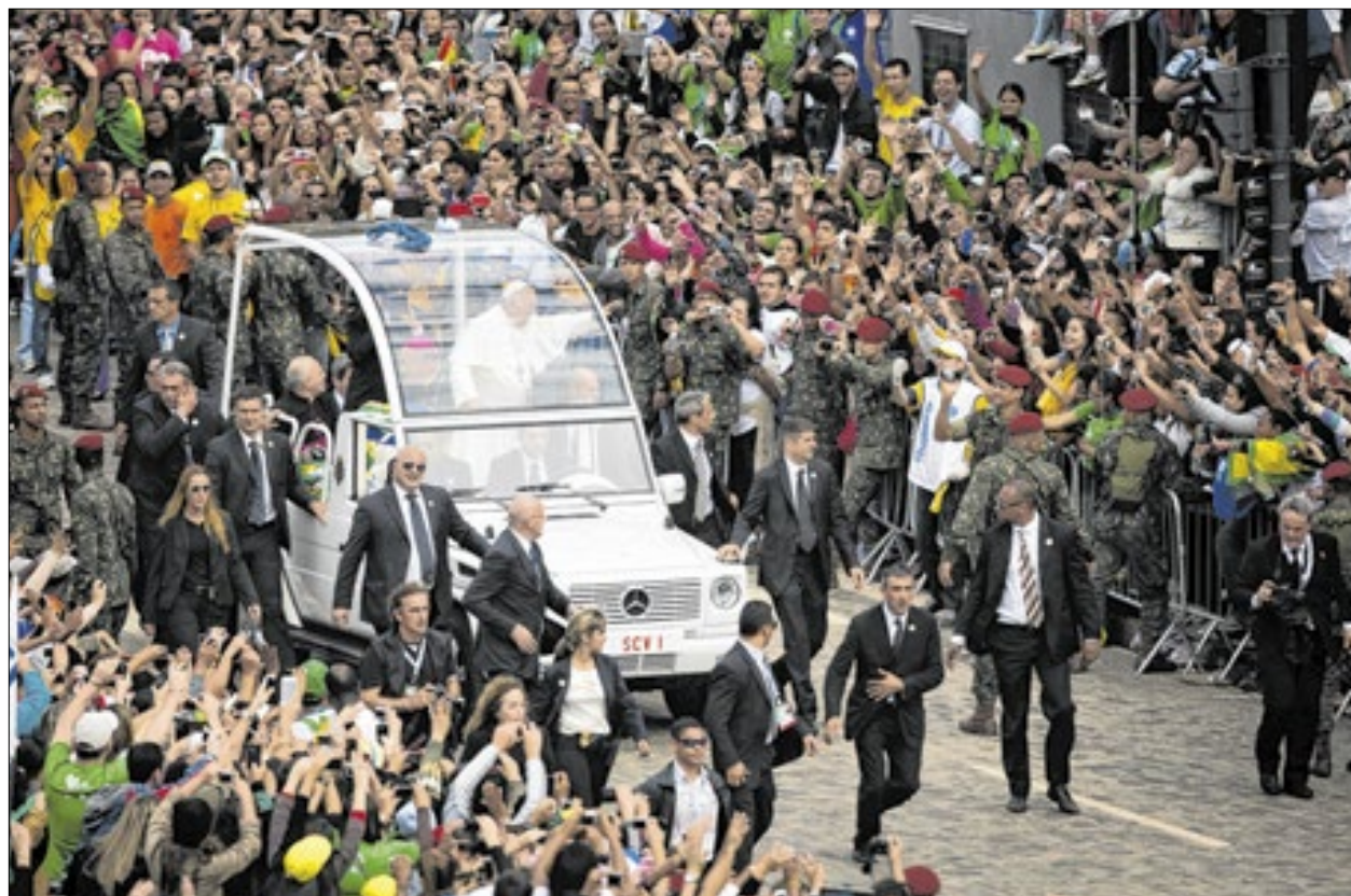
Papa Francisco durante sua passagem por Copacabana (RJ), na Jornada Mundial da Juventude de 2013

Antes de comandar a JMJ, Francisco visitou o Santuário de Aparecida do Norte, no interior de São Paulo. Na chegada ao Rio de Janeiro, ele dispensou carros de luxo e adotou um Fiat como transporte. Em uma brecha na segurança, em plena Avenida Presidente Vargas, ele ficou preso no trânsito e foi cercado por fiéis. Ele abriu a janela do veículo e atendeu a todos, abençoando bebês e crianças, e mandando mensagens de positividade. Ele também visitou o Hospital São Francisco de Assis na Providência de Deus, na Tijuca, além de visitar a comunidade de Varginha, em Manguinhos, na Zona