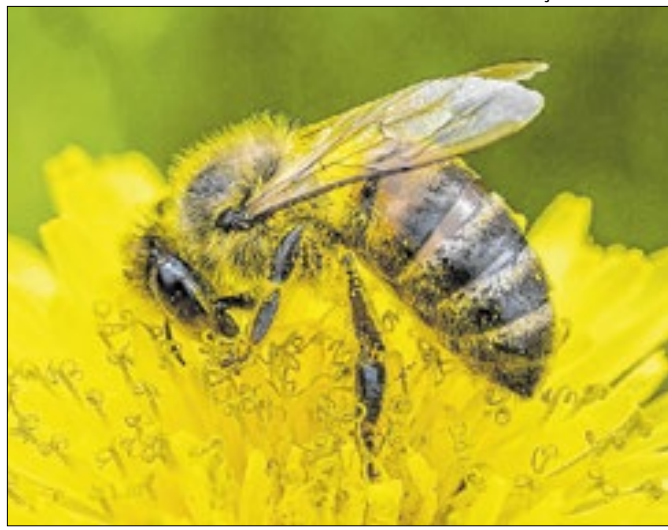
Veneno da abelha Apis mellifera e o própolis produzido