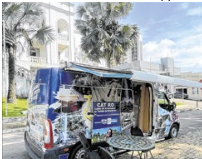
CAT Móvel em frente ao prédio da Universidade Federal