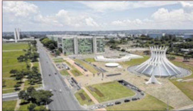
Início na Catedral: “sob a proteção de Deus”