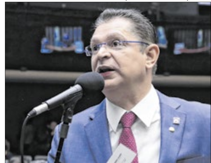
Sóstenes diz que não aceitará nova mudança