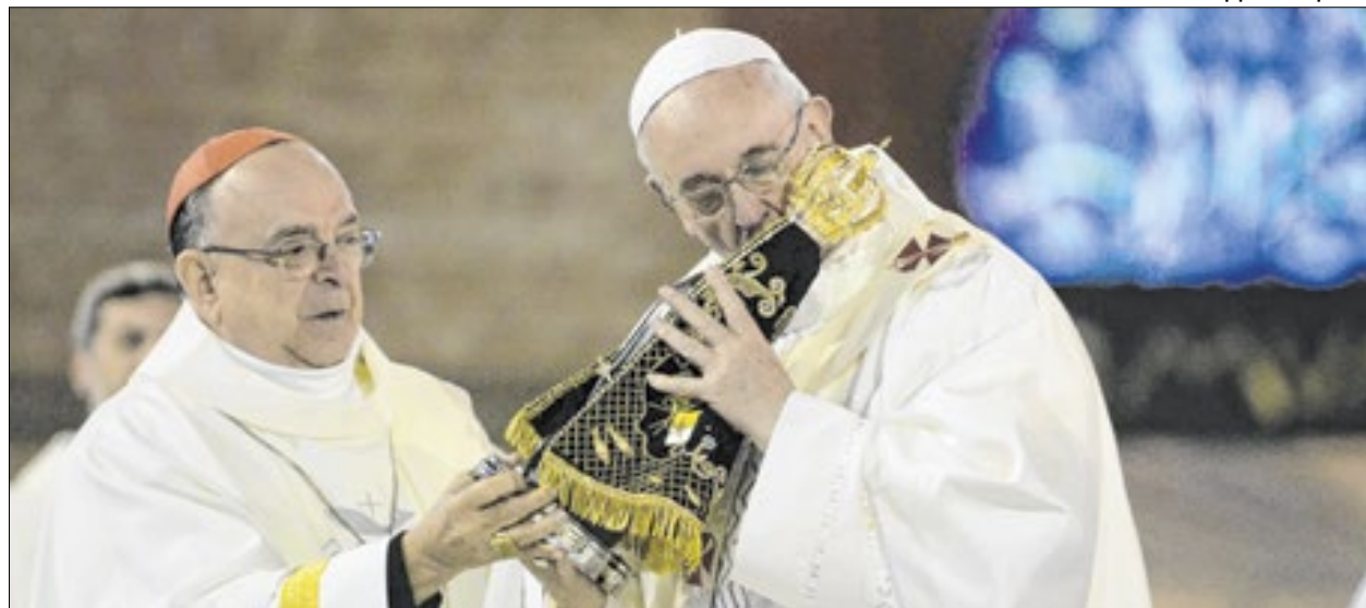
Seu primeiro ato no Brasil foi visitar o Santuário Nacional de Aparecida, no interior de São Paulo

Norte do Rio de Janeiro. Ele também participou de vigílias de oração com jovens, falou com governantes, voluntários e líderes da Igreja local, além da Via Sacra com a juventude e a Santa Missa na Praia de Copacabana.