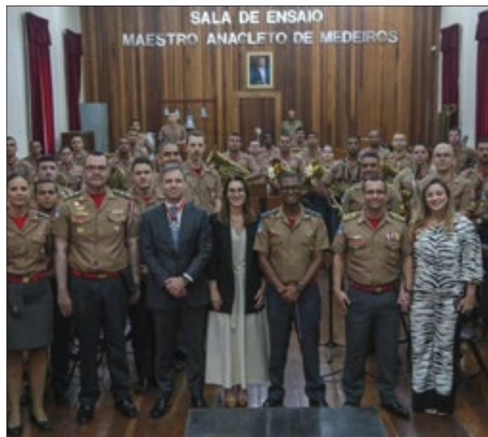
Devido a sua presença, a Orquestra do CBMERJ preparou uma apresentação especial ao ministro André Mendonça