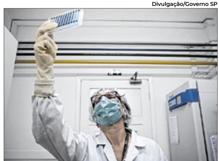
Concurso público para pesquisador no Instituto Butantan

Os requisitos básicos da vaga — como ser brasileiro nato ou naturalizado; ter formação referente à vaga; estar quite com a Justiça Eleitoral, entre outros — podem ser consultados no capítulo 3 do edital. O documento também dá detalhes das atribuições e documentação exigida para candidatos com deficiência, lactantes e sobre o processo de pontuação diferenciada para candidatos pretos, pardos e indígenas (capítulo 7).