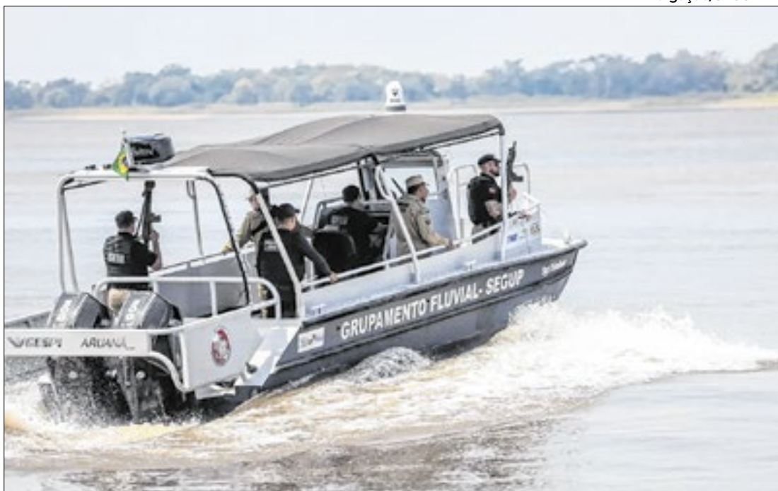
O estado teve uma redução de 75% nos registros de roubo no primeiro trimestre de 2025

Também aparecem na lista Sapucaia, Santo Antônio do Tauá, Santa Maria do Pará, São João da Ponta, Bagre, Salinópolis,