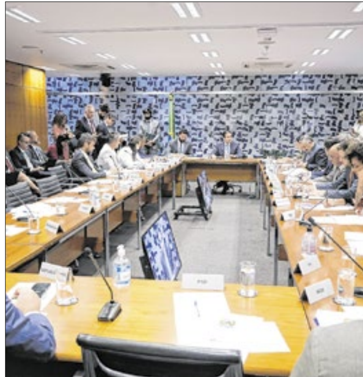
Líderes definirão destino do PL da Anistia

Após uma semana parada devido ao feriado da Semana Santa, o Congresso Nacional retorna com expectativas acerca da reunião de líderes da Câmara dos Deputados nesta quinta-feira (24) para discutir o requerimento de urgência para votar projeto que concede anistia aos presos envolvidos nos atos antidemocráticos de 8 de janeiro de 2023 (Requerimento 1410/2025). Nesta quinta-feira (17), o líder da bancada do PL na Câmara dos Deputados, Sóstenes Cavalcante (RJ), reiterou que “o texto final da Anistia será decidido soberanamente pelos plenários da Câmara e do Senado”.