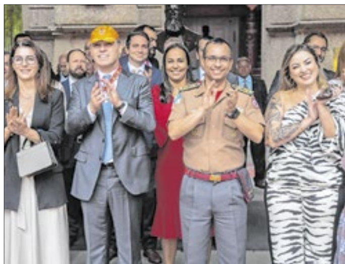
O ministro, durante sua visita, pôde conhecer de perto as instalações do centenário Quartel Central dos Bombeiros do Rio