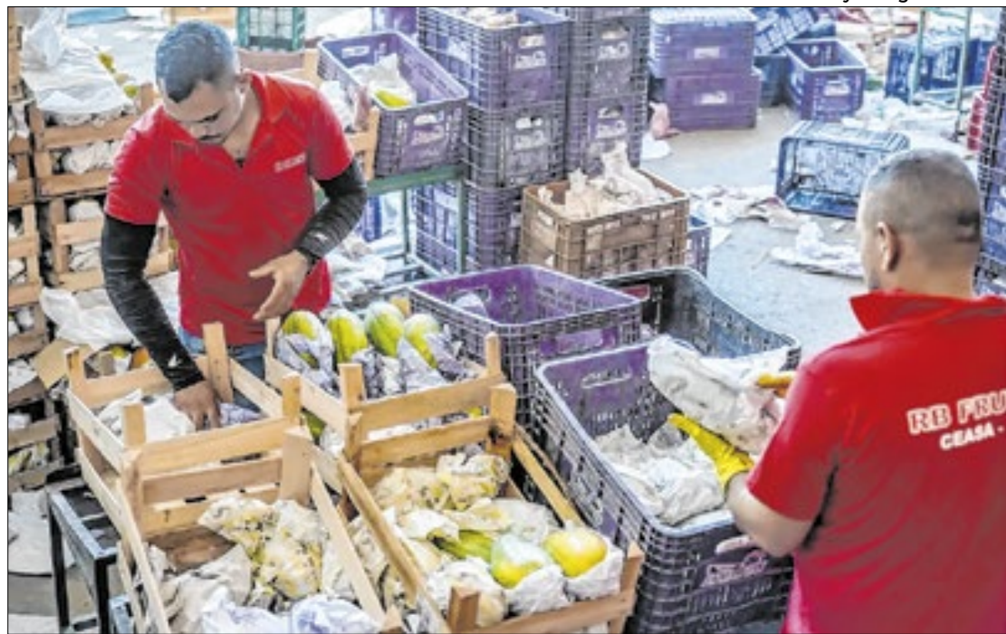
Proposta mirabolante de Alckmin valeu comparação com humorístico ‘Casseta e Planeta’

Como é impossível conceber tal mudança por decreto, exigindo a exclusão dos principais fatores inflacionários do cálculo do IPCA pelo IBGE, o vice de alta plumagem tuca, então, teria sugerido que o ‘trabalho sujo’ fosse executado pelo suposto subserviente Banco Central (BC), ora pilotado pelo indicado e confirmado Gabriel Galipolo, que continua apertando moneta-