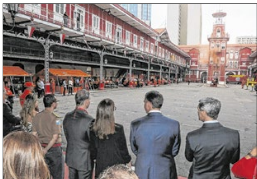
Durante a visita do ministro, foi realizado um simulado operacional com militares demonstrando cenários reais de salvamento e combate a incêndio