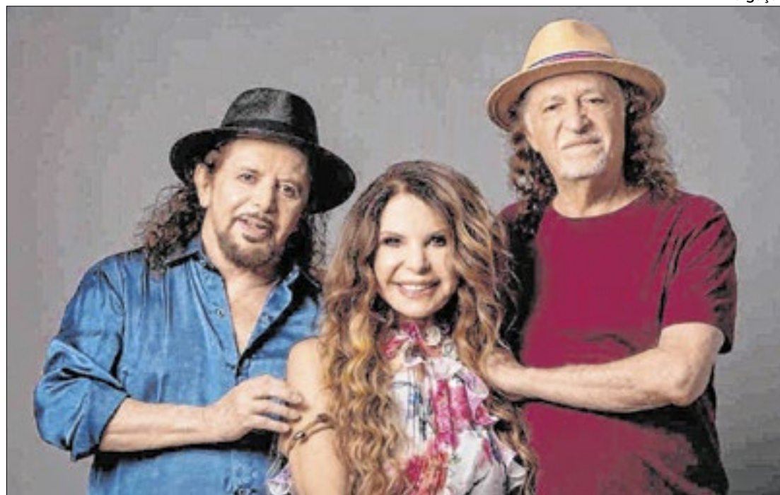
Geraldo Azevedo, Elba Ramalho e Alceu Valença estão entre as atrações