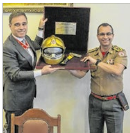
Além da medalha e cobertura (boné), o ministro também recebeu um capacete dourado do CBMERJ