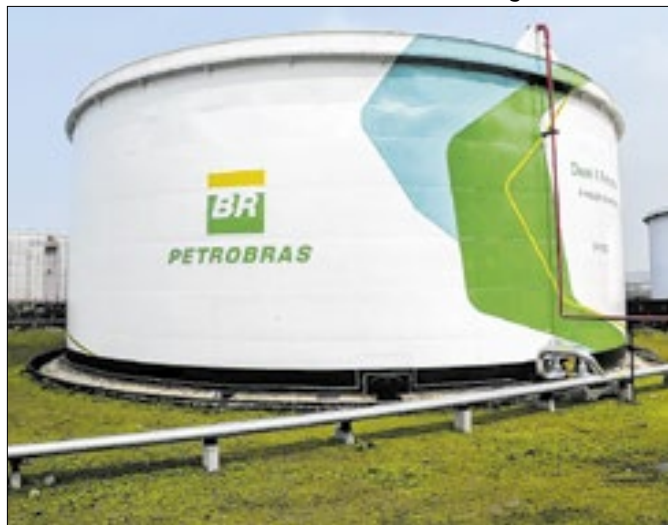
Às distribuidoras, diesel passa a custar R$ 3,43 o litro