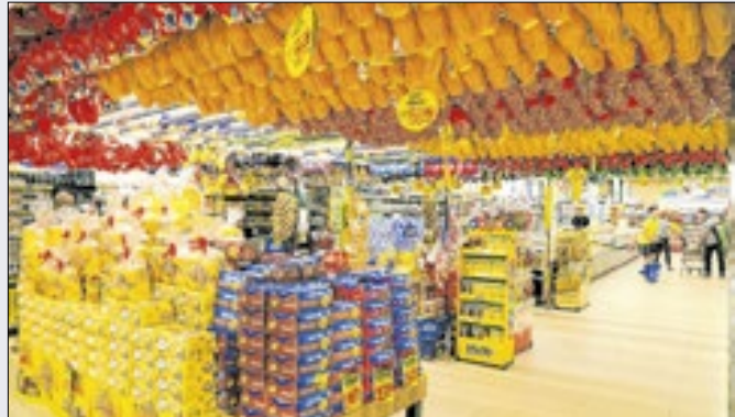
Disparada de preço do chocolate terá impacto no varejo