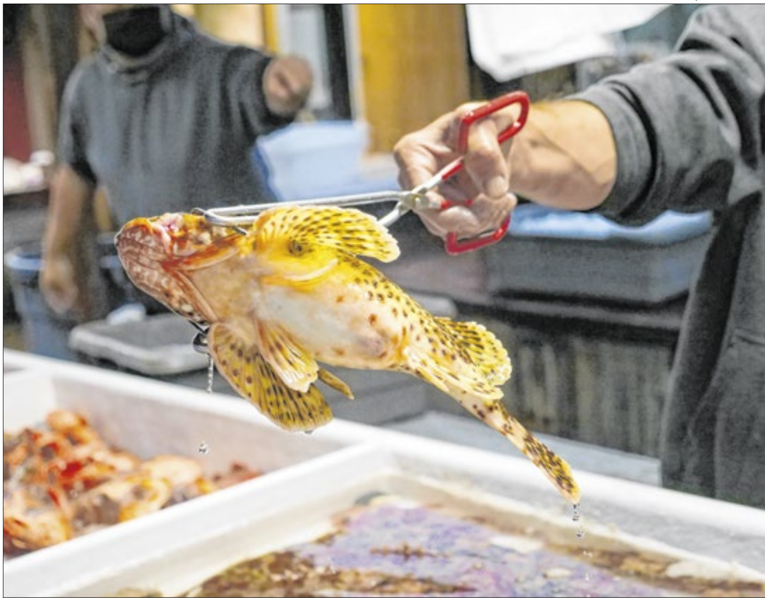
Peixe é rico em ômega 3, que ajuda a equilibrar o colesterol bom do corpo

Quanto às características anatômicas do peixe inteiro ou inteiro eviscerado fresco, o consumidor deve observar: Olhos, que devem estar brilhantes, translúcidos e salientes, ocupando a órbita ocular; Pele úmida, com brilho natural metálico e coloração apropriada da espécie, sem manchas, com as nadadeiras e escamas bem fixadas; Brânquias, ou seja, as popularmente conhecidas guelras, devem estar avermelhadas e sem muco; Odor leve, que lembra “cheiro do mar”; Carne firme, que ao ser pressionada, deve voltar à posição original rapidamente;