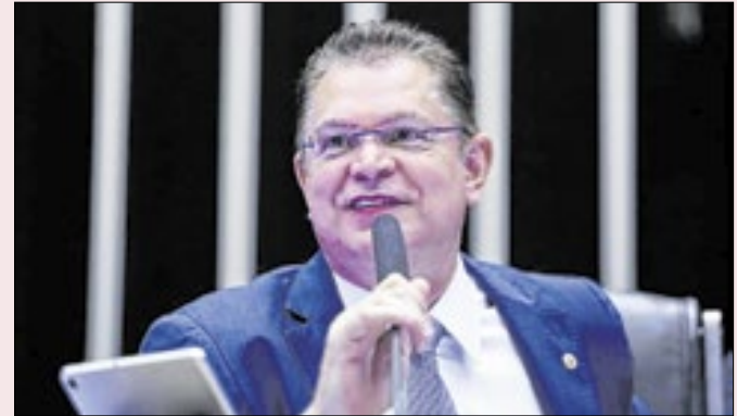
Líder do PL ironizou fala de Gilmar Mendes