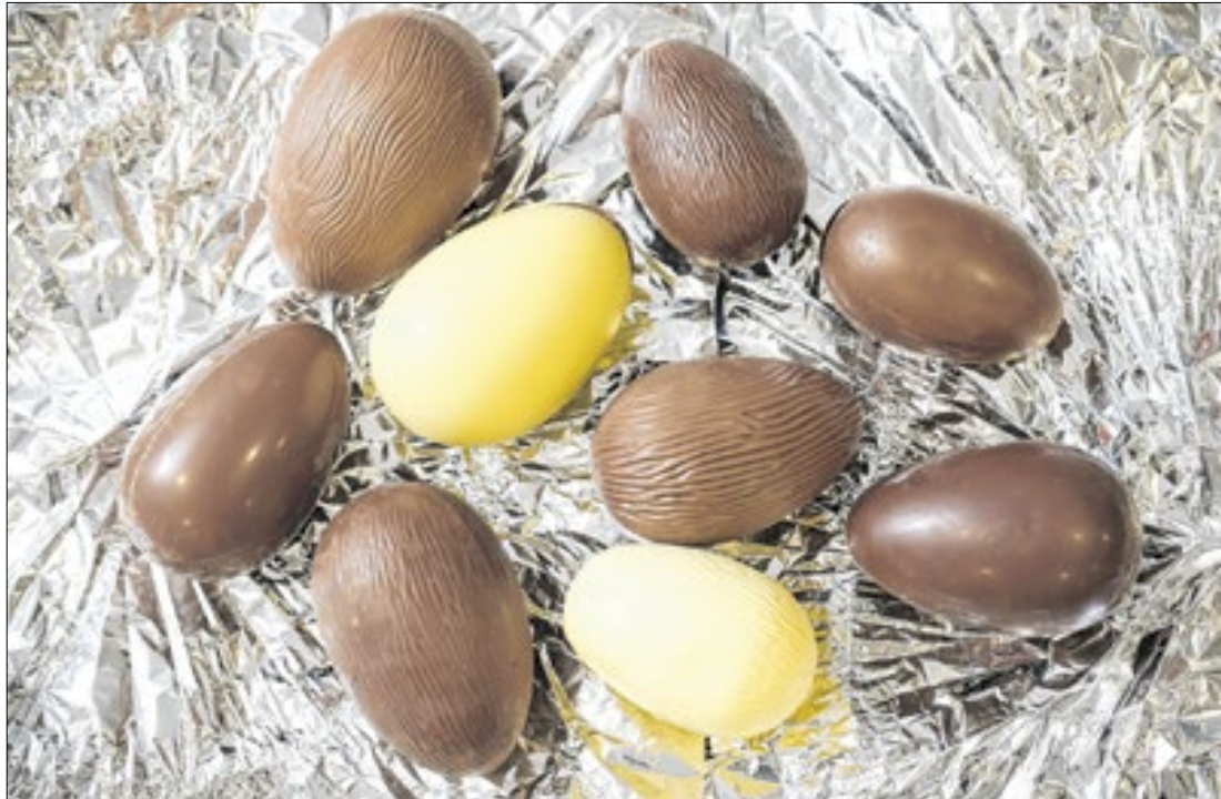
Alguns ovos caíram no gosto dos jornalistas que os provaram