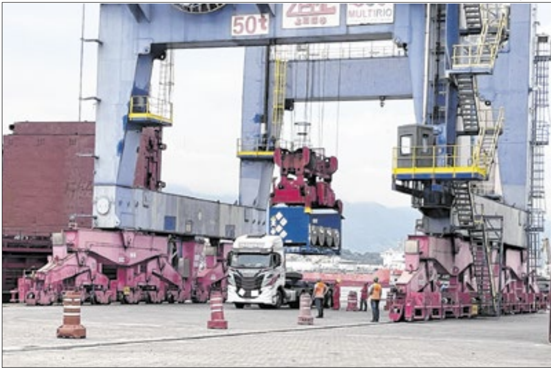
Urânio é transportado do Porto do Rio para Resende, sul do Estado do RJ

A Indústrias Nucleares do Brasil (INB) concluiu uma das mais importantes operações logísticas do setor nuclear brasileiro em 2025: o recebimento e transporte de aproximadamente 14 toneladas de urânio enriquecido importado da Rússia. A operação foi concluída nesta quarta-feira (17) e teve um aparato de segurança que envolveu desde o GSI até todas as forças de