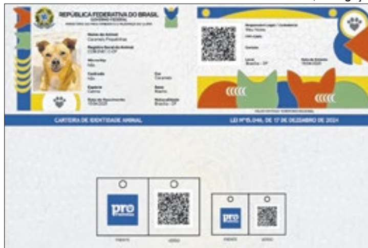
Saiba como funciona a SinPatinhas; Registro é voluntário

para registrar cães e gatos em um banco de dados nacional, um instrumento para promover o controle populacional ético de cães e gatos, estimulando a guarda responsável e o combate ao abandono e aos casos de maus-tratos.