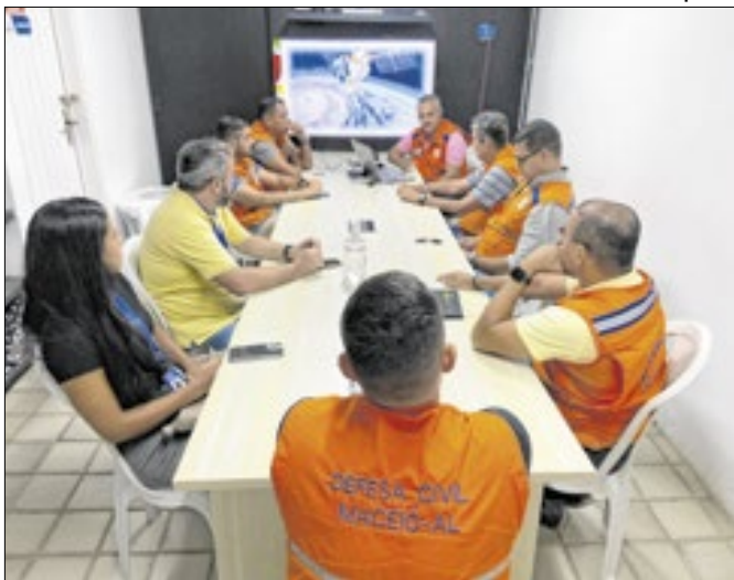
Apresentação aconteceu durante reunião estratégica