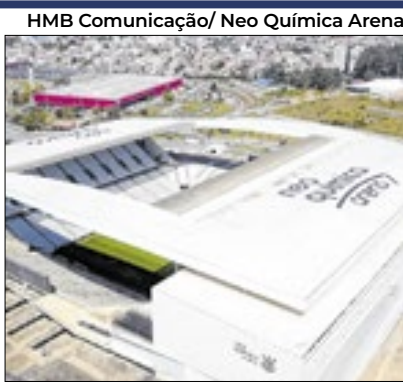
HMB Comunicação/ Neo Química Arena

A CBF definiu a cidade de São Paulo como sede do duelo entre Brasil e Paraguai, válido pelas Eliminatórias para a Copa de 2026, que ocorre em junho. O palco da partida será a Neo Química Arena.