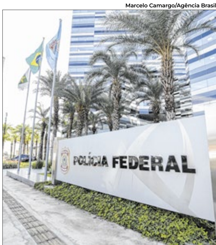
Depoimentos foram simultâneos para evitar combinação

Dois situações estão sendo investigadas. A primeira é a utilização política da agência, dentro do que ficou conhecido como “Abin paralela”, o uso da instituição para monitorar adversários. Embora a corporação tenha identificado que o uso ilegal da agência ocorreu durante o governo do ex-presidente Jair Bolsonaro (PL), que agiu com objetivo de monito-