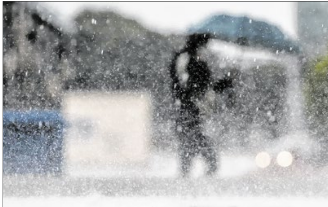
O governo do Estado decretou situação de emergência em 129 municípios

O Piauí enfrenta um período chuvoso atípico, com volume de precipitações 50% abaixo da média histórica entre dezembro e março. A situação tem causado prejuízos à agricultura e à pecuária, levando o Governo do Estado a decretar situação de emergência em 129 municípios. Desses, 40 apresentam um cenário ainda mais crítico, conforme avaliação da Secretaria Estadual de Defesa Civil.