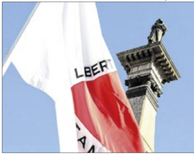
Cerimônia em Ouro Preto homenageia personalidades