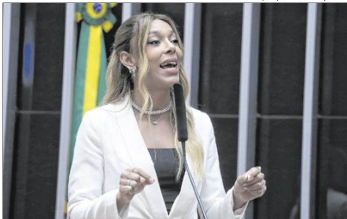
Erika Hilton pretende acionar Trump por transfobia

Erika havia sido convidada para participar de uma conferência na Universidade de Harvard e no Instituto de Tecnologia de Massachusetts (MIT, na sigla em inglês), onde