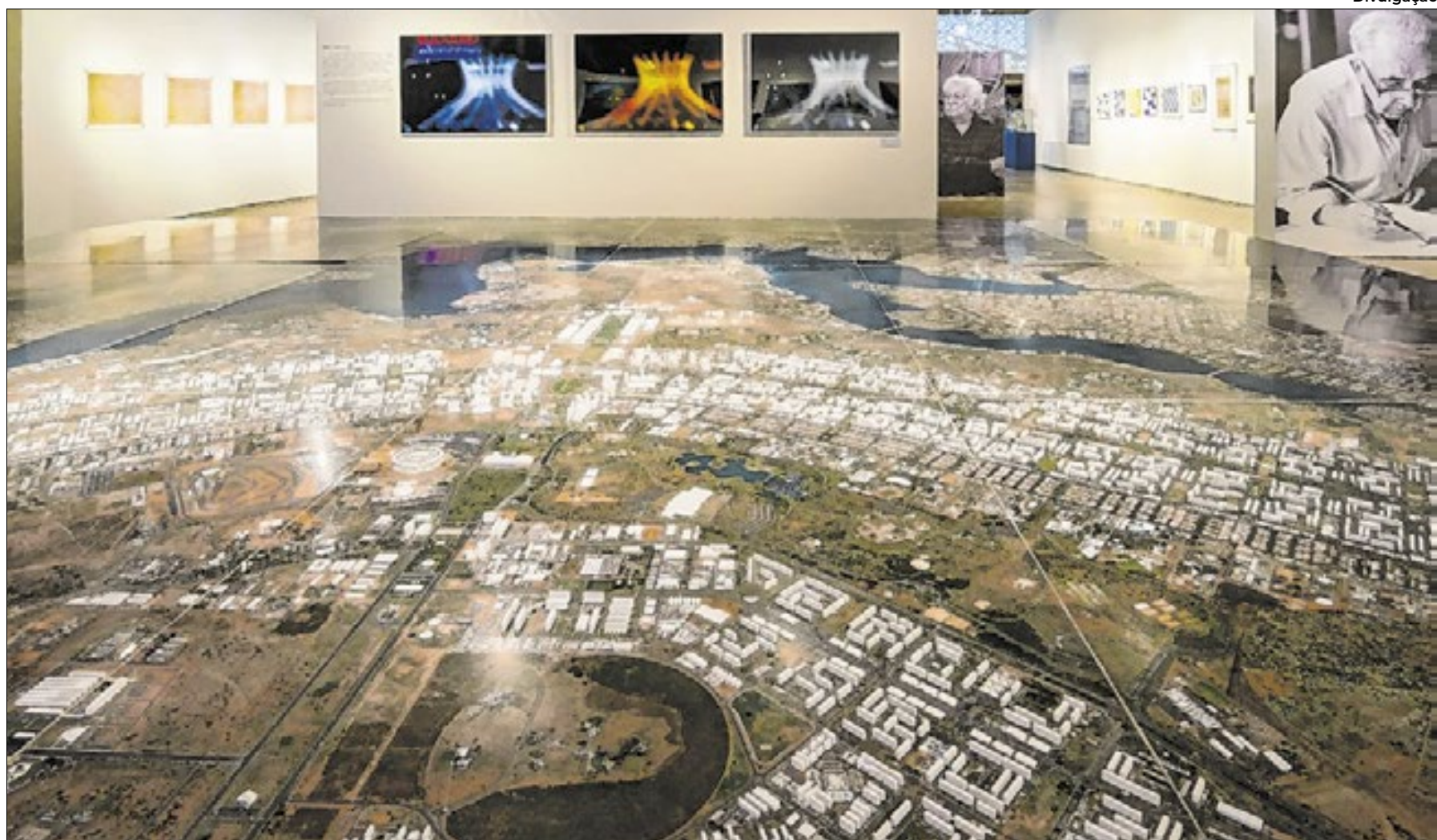
Maquete de Brasília montada para a exposição em Marselha

Ela também destaca a influência na construção das Superquadras de Brasília. Segundo ela, o relato de Corbusier à Costa sobre a ideia do Cité Radieuse,