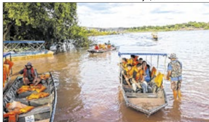
Serviço entre Aguiarnópolis e Estreito segue mantido