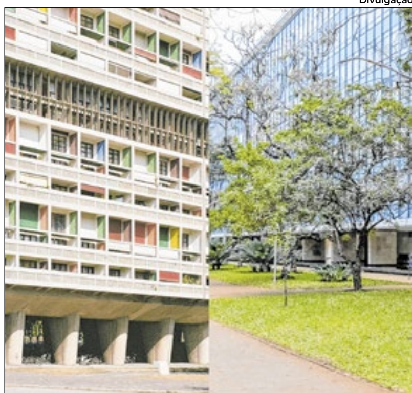
Prédio em Marselha inspirou as superquadras