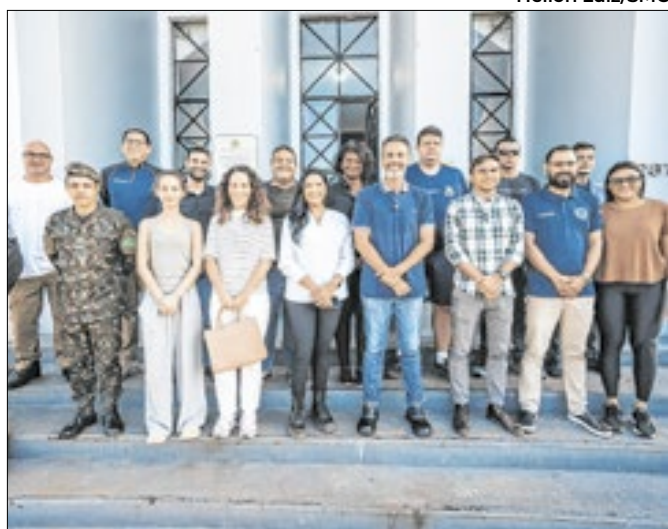
Grupo leva ajuda humanitária a comunidades ribeirinhas