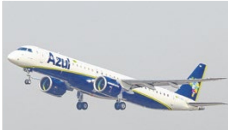
Voos adicionais foram planejados para destinos turísticos