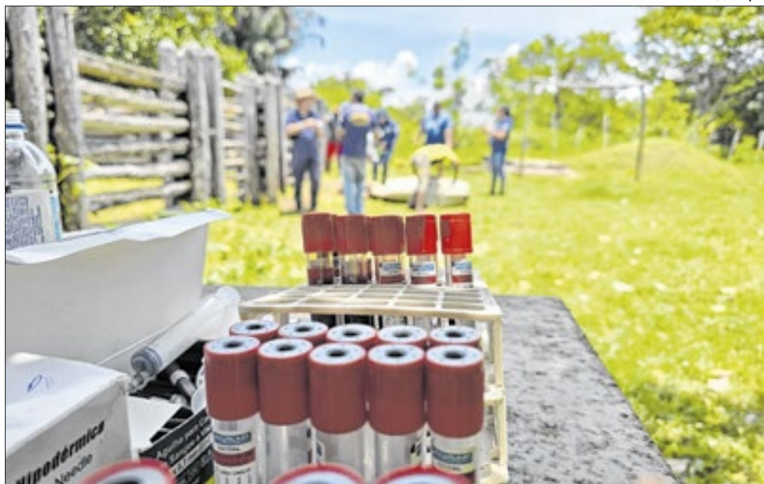
O levantamento representa um avanço estratégico para a agropecuária piauiense

A conclusão do estudo está prevista para o fim do primeiro semestre de 2025. Atualmente, o Piauí é classificado como zona de risco desconhecido