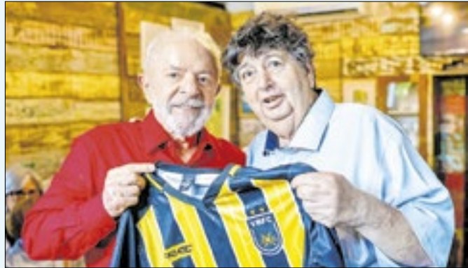
Presidente esteve na casa do prefeito de Pirai, Pezão