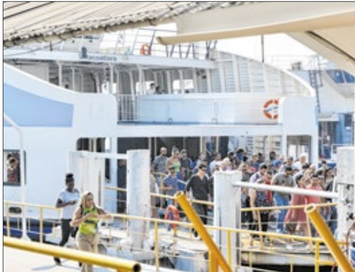
Valores das tarifas foram reduzidos em quatro linhas