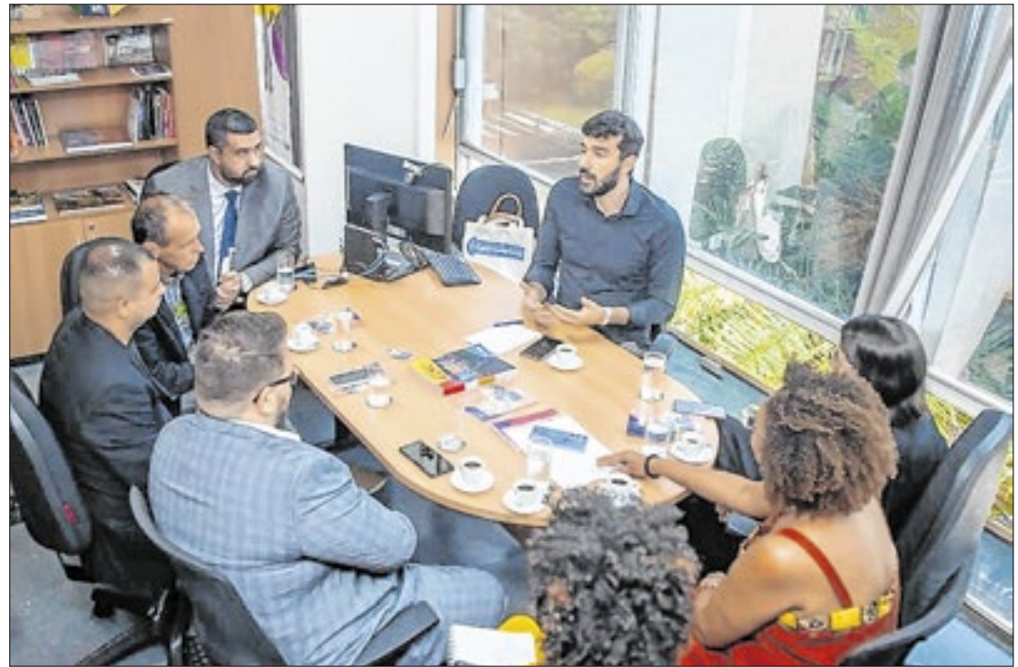
Em 11 de fevereiro, a Reunião com as comitivas de Teresópolis e Rio de Janeiro

Um dos principais destaques do segundo ciclo é a exigência de que municípios, estados e DF comprovem a execução de pelo menos 60% dos recursos recebidos na etapa anterior e destinem verbas próprias à cultura para ter acesso aos novos repasses, condição que pode complicar a chegada dos recursos a diversos municípios que tiveram editais publicados no ano passado e não conseguiram alcançar a meta de cumprimento dos prazos. No caso de Teresópolis, que teve os editais cancelados, porque havia irregularidades neles e porque eles foram lançados quando não havia mais a provisão do recurso em conta,