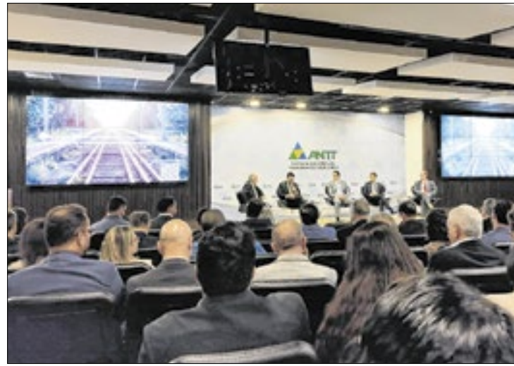
Projeto foi incluído no chamamento público

No evento, a ANTT apresentou projetos considerados prioritários para o governo