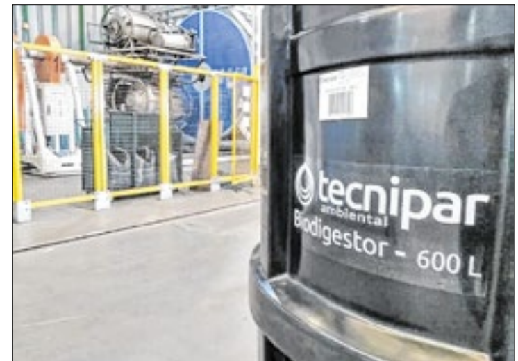
Os produtos são voltados para o setor de saneamento