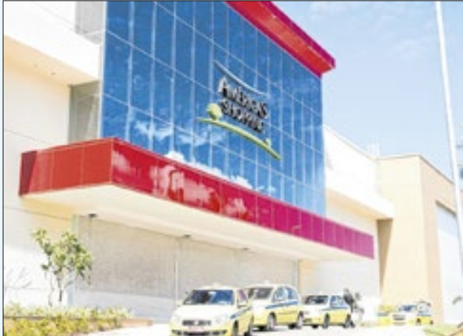
Creche só em locais com mais de 100 lojas conveniadas