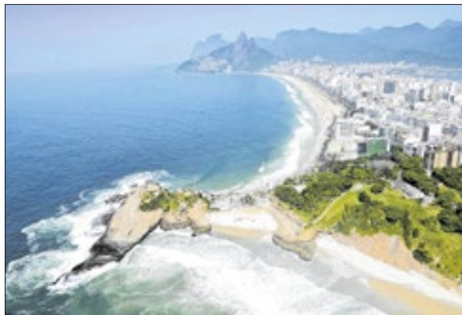
Aluguel por temporada em alta atesta atratividade do Rio