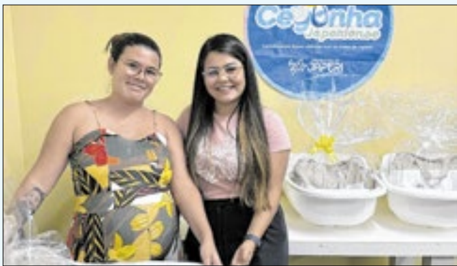
Gestantes foram encaminhadas pelas UBS's do pré-natal