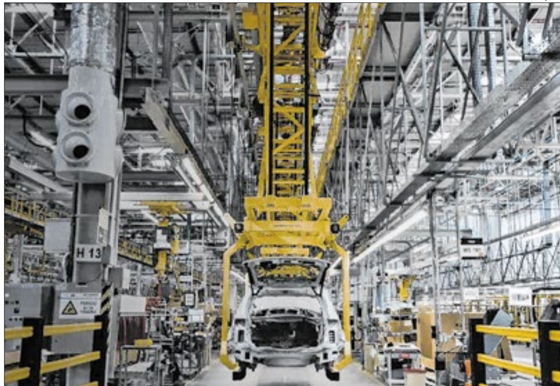
Apesar da expansão notável da economia do RJ, Firjan recomenda cautela para 2025