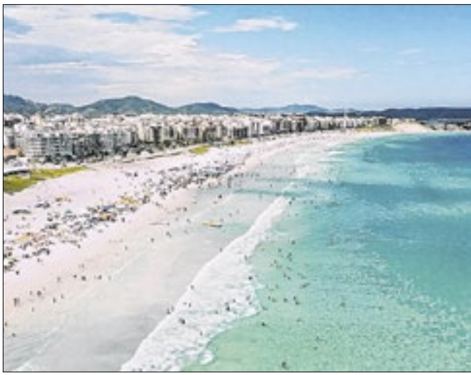
Praia do Forte é o principal ponto turístico da cidade