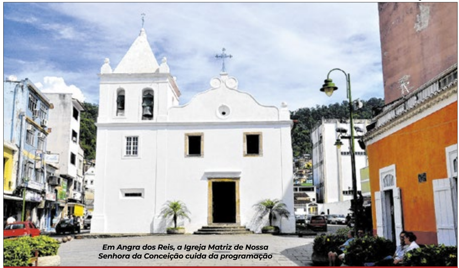
Em Angra dos Reis, a Igreja Matriz de Nossa Senhora da Conceição cuida da programação