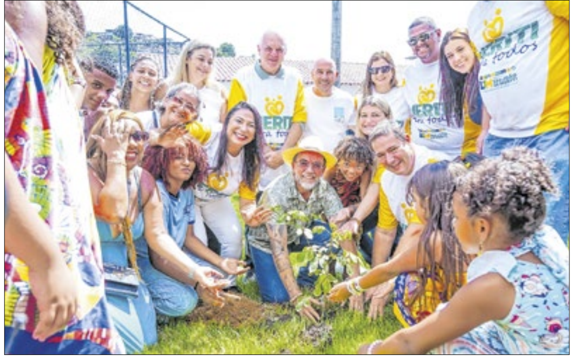
Evento iniciou o dia com o plantio de uma muda de ipê amarelo no pátio da Escola Municipal Ediberto Ribeiro de Castro

A Arena Poeirão, no bairro Parque Araruama, em São João de Meriti, recebeu a segunda edição do mutirão de serviços Meriti Para Todos. A ação atendeu cerca de 1.500 pessoas e reuniu mais de 40 serviços gratuitos, oferecidos por secretarias da Prefeitura, concessionárias e empresas privadas.