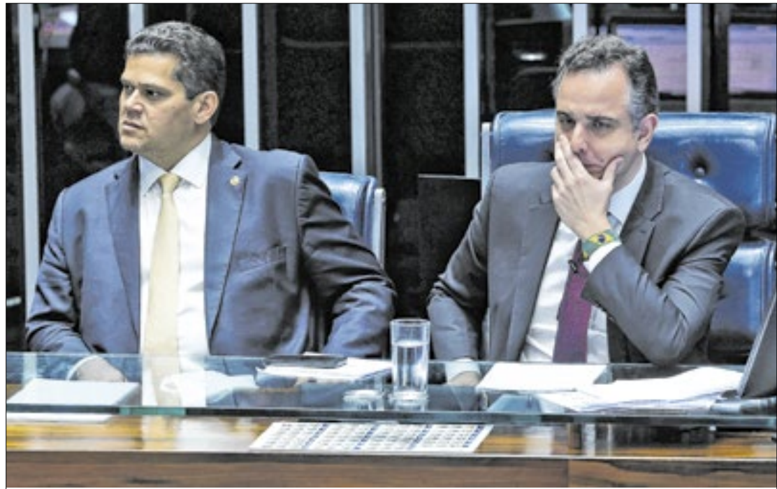
Alcolumbre e Pacheco articulam o projeto de redução de penas

A principal alternativa discutida para a anistia é justamente a revisão das penas aplicadas pelo Supremo em alguns casos, como forma de conter uma anistia geral de todos os crimes, como propõe o projeto cuja urgência foi pedida pelo líder do PL na Câmara, Sóstenes Cavalcante (RJ).