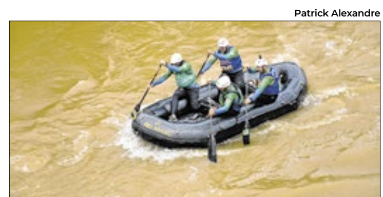
Cidade do interior do estado é berço do rafting no Brasil

Além da disputa dentro das águas, Três Rios também foi palco de lazer e entretenimento no Horto Municipal. Com muita música e gastronomia da melhor qualidade, moradores e turistas aproveitaram a programação cultural preparada especialmente para o evento. A iniciativa, além de promover a valorização dos artistas e empreendedores locais, gerou emprego e renda temporária, movimentando setores como alimentação, hospedagem, transporte e comércio, reafirmando o compromisso da cidade com o desenvolvimento sustentável por meio do turismo esportivo e cultural.