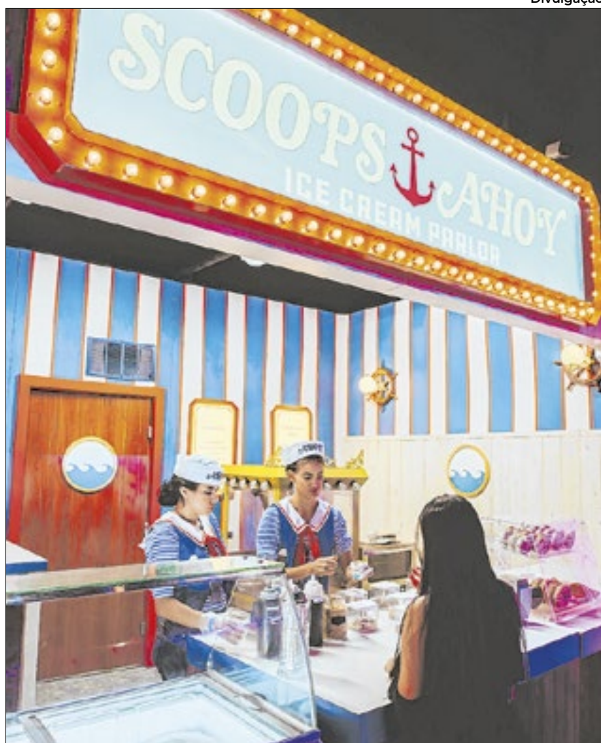
O 'Scoops Ahoy' ficará aberto ao público até o fim da experiência

das da série, como a Sala Arco-Íris, a praça de alimentação do Starcourt Mall, o Laboratório Nacional de Hawkins e um portal para o Mundo Invertido. E o mais legal é que existe essa interação com os personagens da série a todo momento, com todo o elenco de atores e dubladores oficiais da série trazidos de volta.