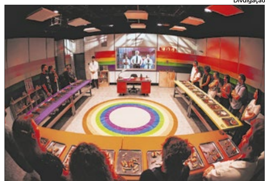
A Sala Arco-Íris traz a interação de visitantes 'com poderes' com os outros elementos disponíveis, como latas e quebra-cabeças

The Experience de exposição, porque é uma mistura de tipos de entretenimento. Você tem atores que interagem com o público e com as telas. Temos muita tecnologia envolvida para criar situações que coloquem o visitante no centro da ação, como um personagem da aventura, que vai decifrar enigmas, usar seus poderes e mudar a narrativa da história. Ou seja, ele participa de um episódio