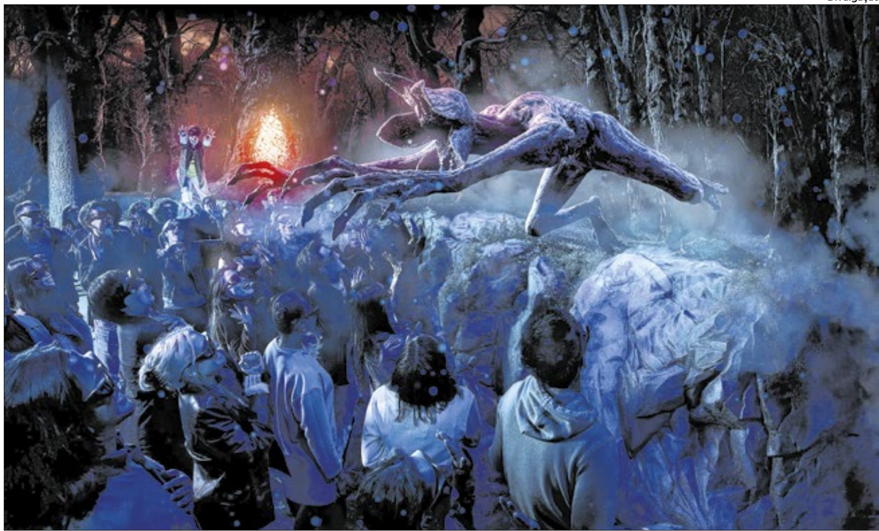
Um dos espaços traz uma ação interativa em 3D, na qual os visitantes devem ajudar a Onze a lutar contra o Demogorgon e o Vecna, vilões da série

São mais de 2.500m 2 de estrutura, em que são recriados cenários de diferentes tempora-