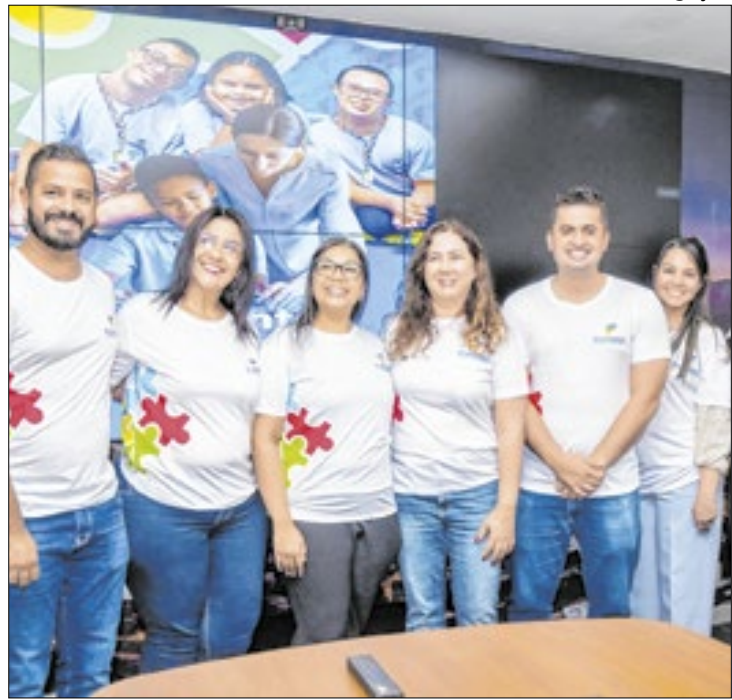
Além da saúde mental, programa terá foco na inclusão

A Prefeitura de Duque de Caxias, através da Fundação de Apoio à Escola Técnica, Ciência, Tecnologia, Esporte, Lazer, Cultura e Políticas Sociais de Duque de Caxias (FUNDEC), realizou a cerimônia de lançamento do mais novo curso da fundação: o Curso de Agente Terapêutico.