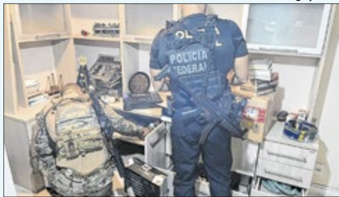
Justiça bloqueou R$ 3,5 bi das contas de investigados