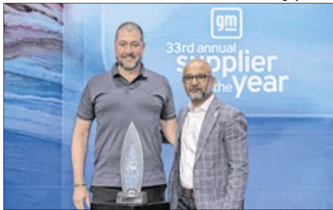
Empresa é incluída em homenagem pela montadora