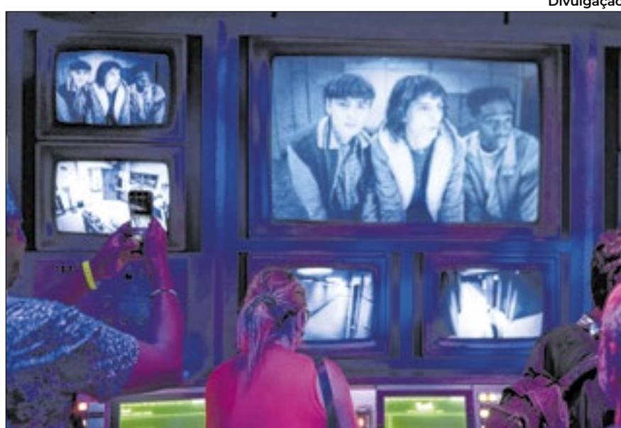
Will, Mike, Dustin, Lucas, Erica, Onze e Max interagem com o público ao longo das cinco etapas do 'Stranger Things: The Experience'