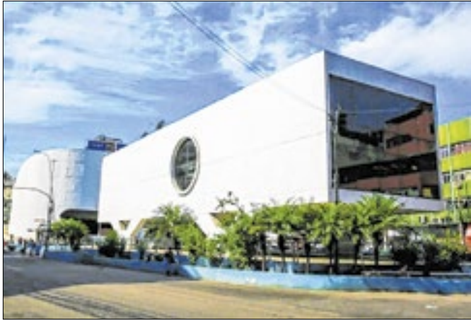
Biblioteca foi aprovada no programa do MEC