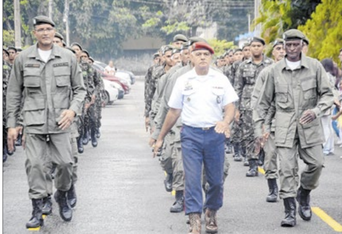
Cerimônia no Tiro de Guerra foi feita em alusão ao Dia do Exército Brasileiro