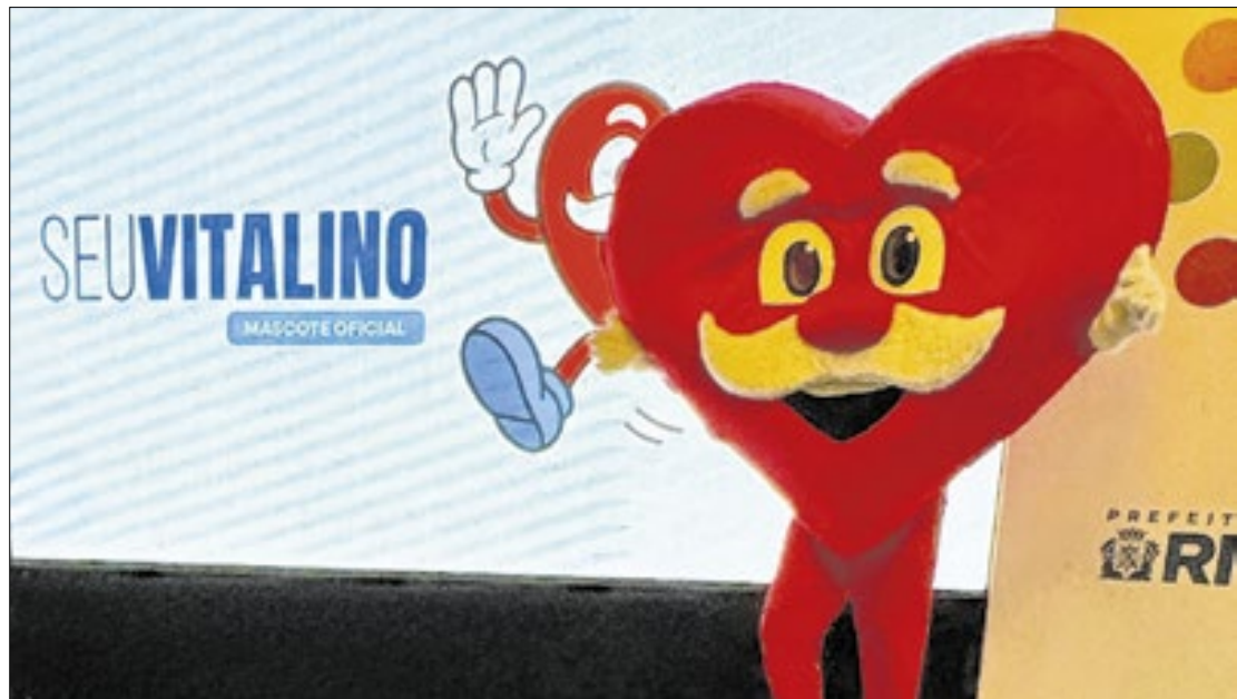
O programa OES possui 12 diretrizes que vão nortear políticas públicas para a faixa etária

Durante o evento, o prefeito Eduardo Paes e o secretário da SEMESQVE, Felipe Michel, apresentaram também o mascote oficial desta iniciativa: