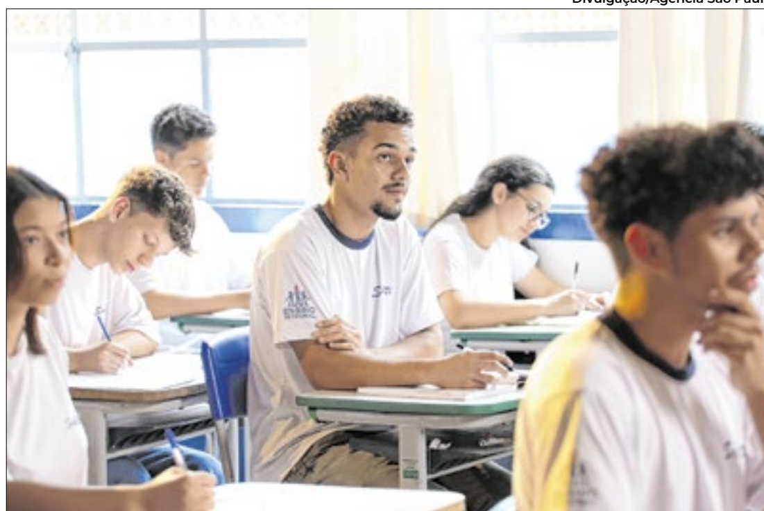
Alunos precisam estar matriculados nas 2ª e 3ª séries da formação técnico profissional

Empresas têm até 31 de maio para se cadastrar e fazer contratações