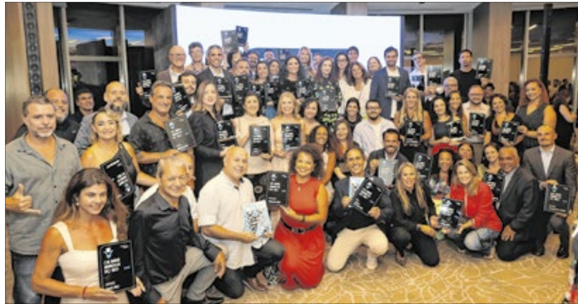
Os premiados das 50 categorias que receberam 10 mil votos, em menos de 20 dias de pesquisa