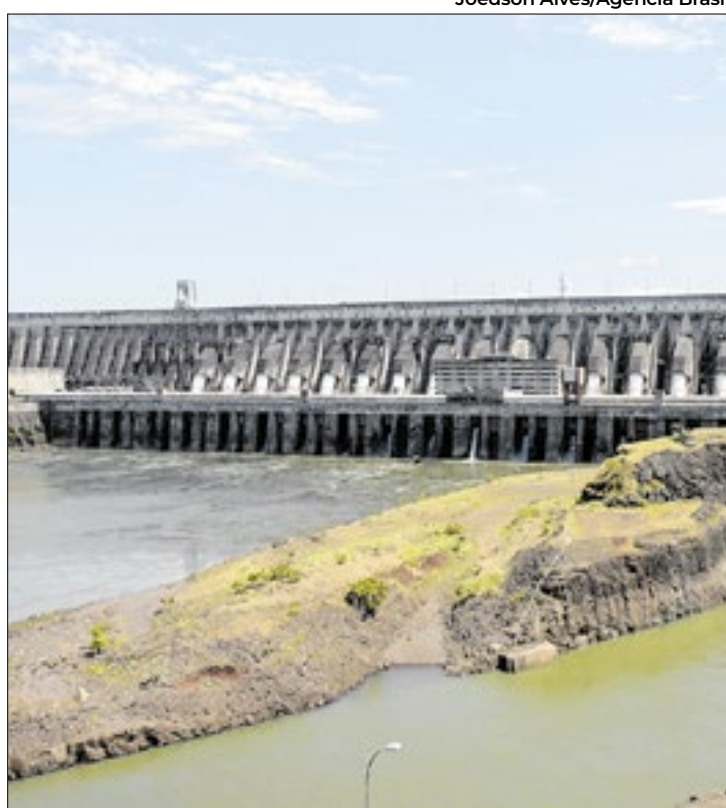
Ação buscaria informações sobre a hidrelétrica de Itaipu

Paralelamente, o ministro das Relações Exteriores, Mauro Vieira, reuniu-se com o chanceler paraguaio, Rubén