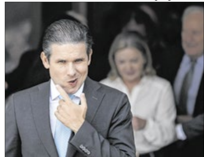
Hugo Motta decidiu ouvir o colégio de líderes