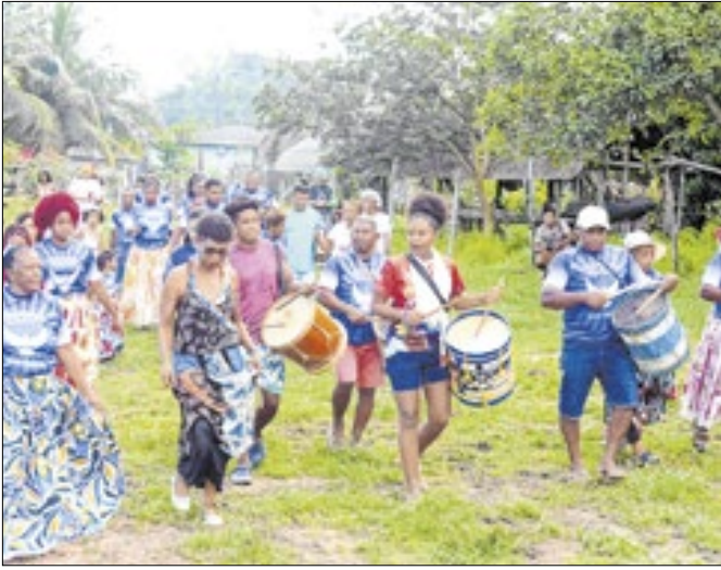
Festejo tradicional seguirá até o dia 22 de junho