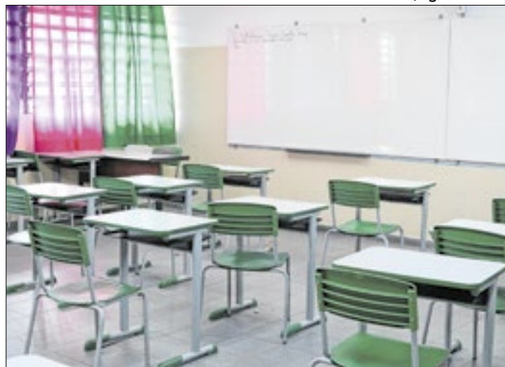
Prova é um dos eixos do Programa Mais Professores