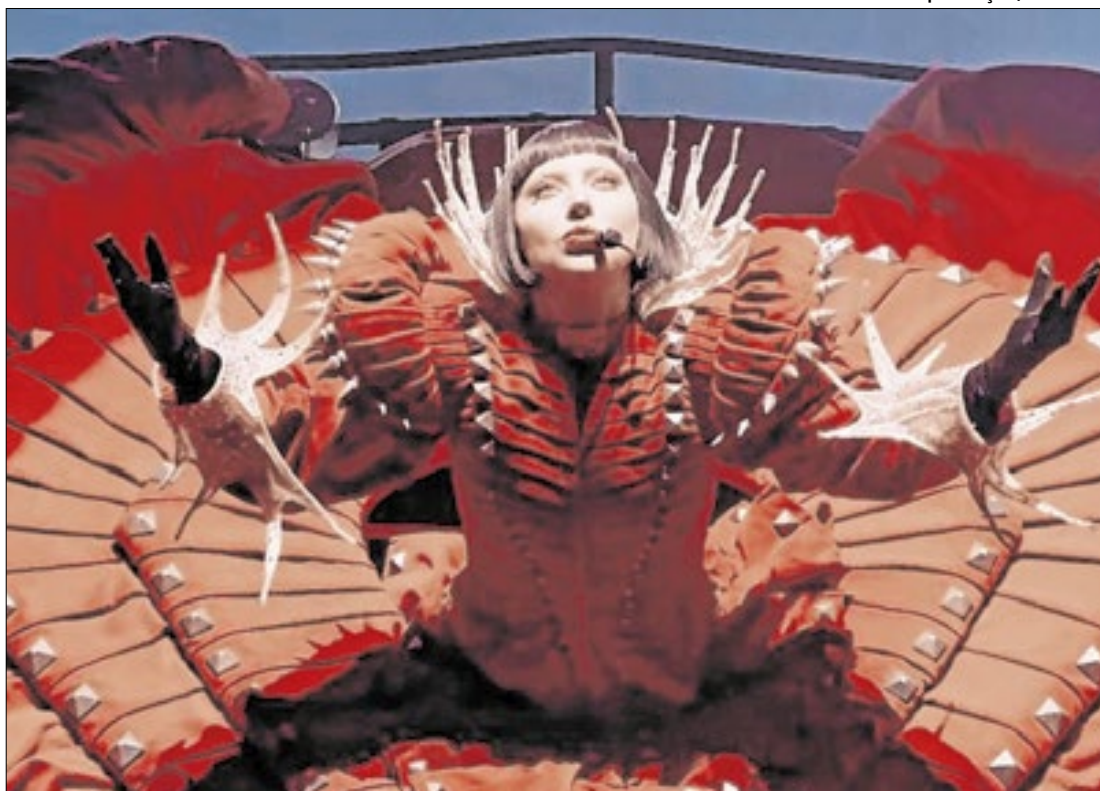
Cantora vai se apresentar no dia 3 de maio, em Copacabana

Além da estrutura, os dados de venda e pesquisa por passageiros também confirmam o fenômeno em torno da artista. Segundo levantamento da ClickBus, plataforma especializada em vendas online de passagens rodoviárias, a procura por viagens ao Rio de Janeiro para a semana do show de Gaga aumentou cerca de 170% em comparação ao mesmo período do ano passado — quando Ma-