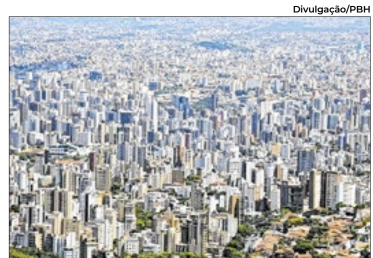
Belo Horizonte tem destaque no setor gastronômico

O Observatório do Turismo de Belo Horizonte também realizou a atualização dos dados do mercado de trabalho