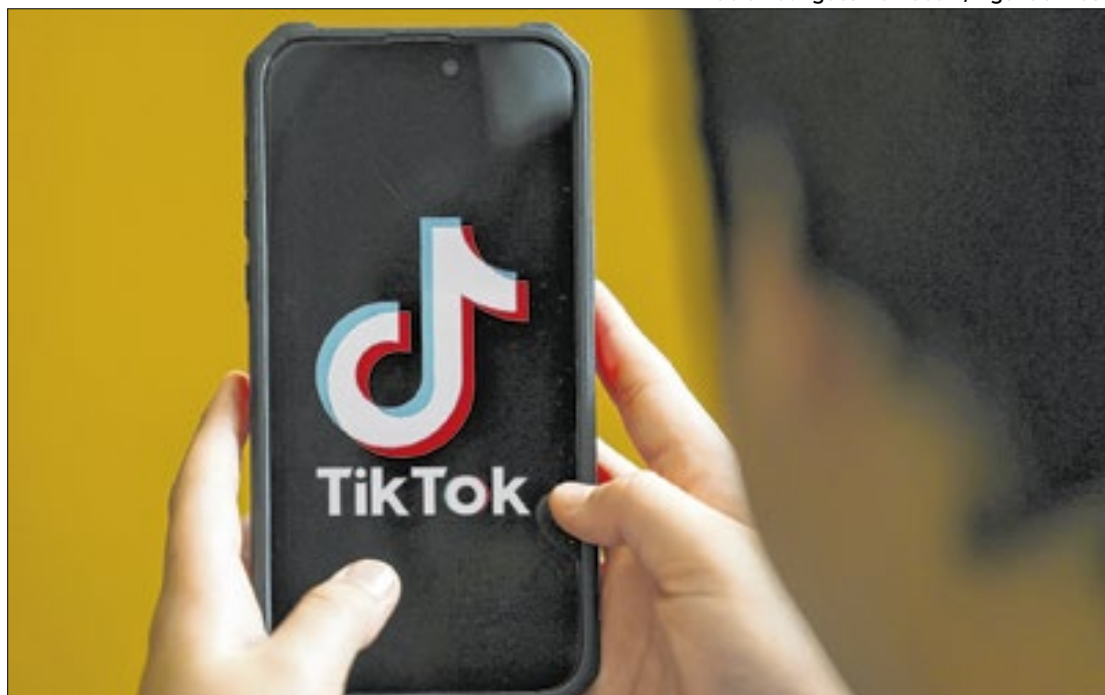
Comissão começará a discutir regulação das redes