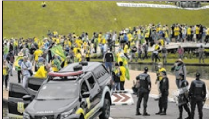
Projeto daria gradação aos atos violentos do 8/01