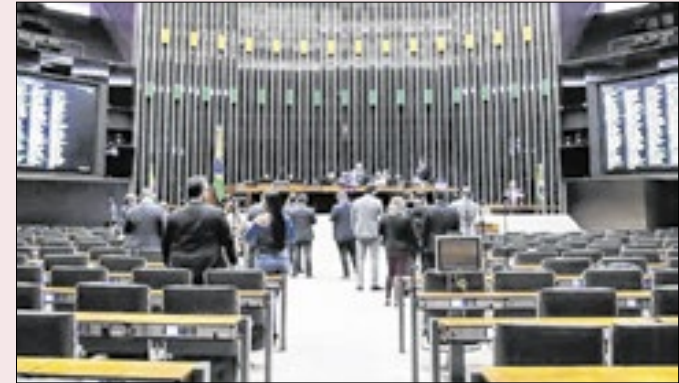
Maioria quer evitar ficar nos extremos