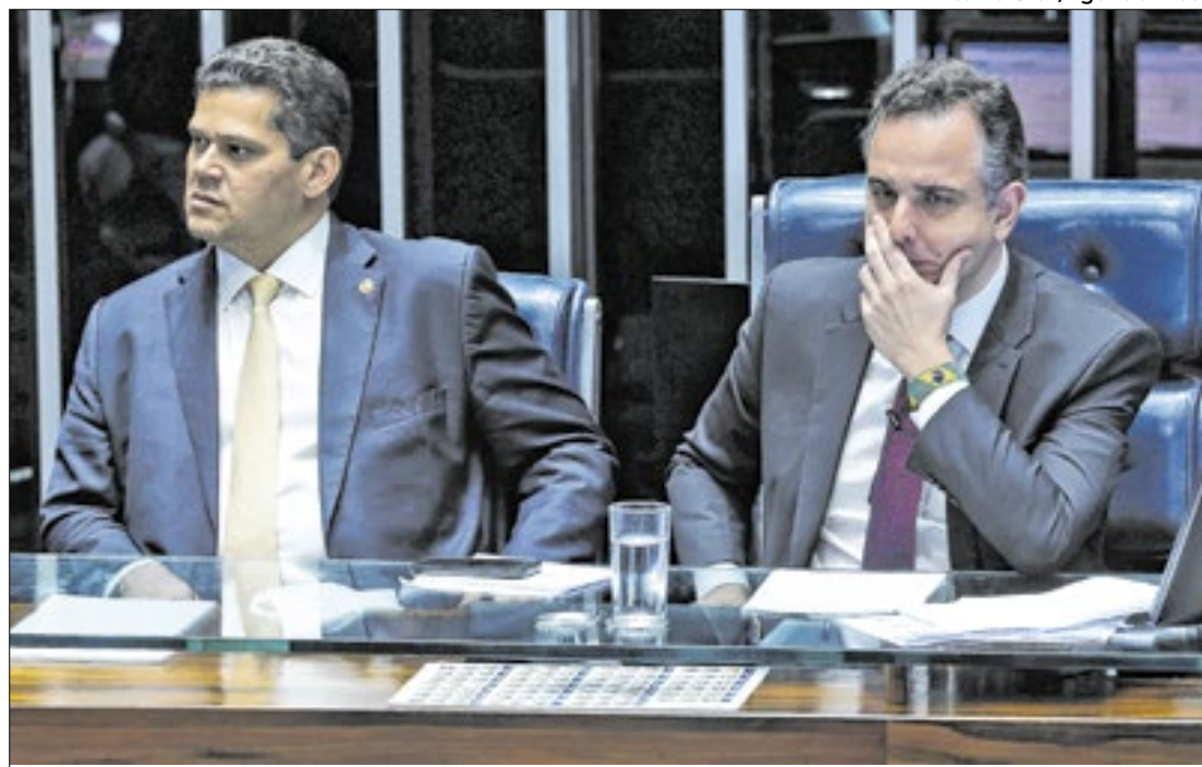
Alcolumbre e Pacheco articulam o projeto de redução de penas

A principal alternativa discutida para a anistia é justamente a revisão das penas aplicadas pelo Supremo em alguns casos, como forma de conter uma anistia geral de todos os crimes, como propõe o projeto cuja urgência foi pedida pelo líder do PL na Câmara, Sóstenes Cavalcante (RJ).