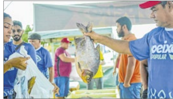
Programa vende o quilo a valores entre R$ 12 e R$ 25