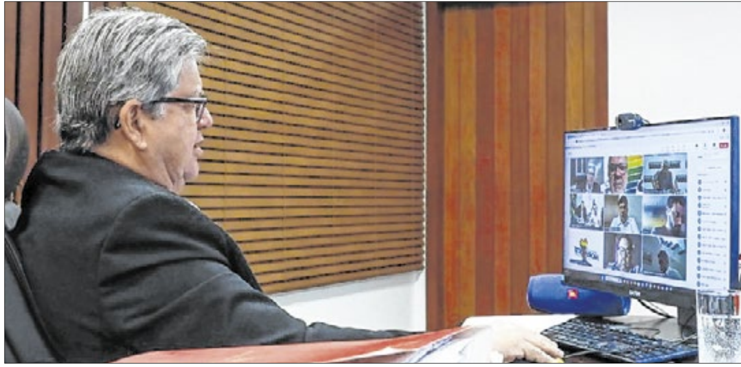
A Paraíba será representada pelo vice-governador Lucas Ribeiro