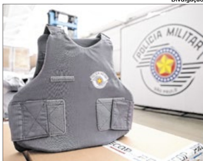
Coletes possuem a mais alta tecnologia para proteção