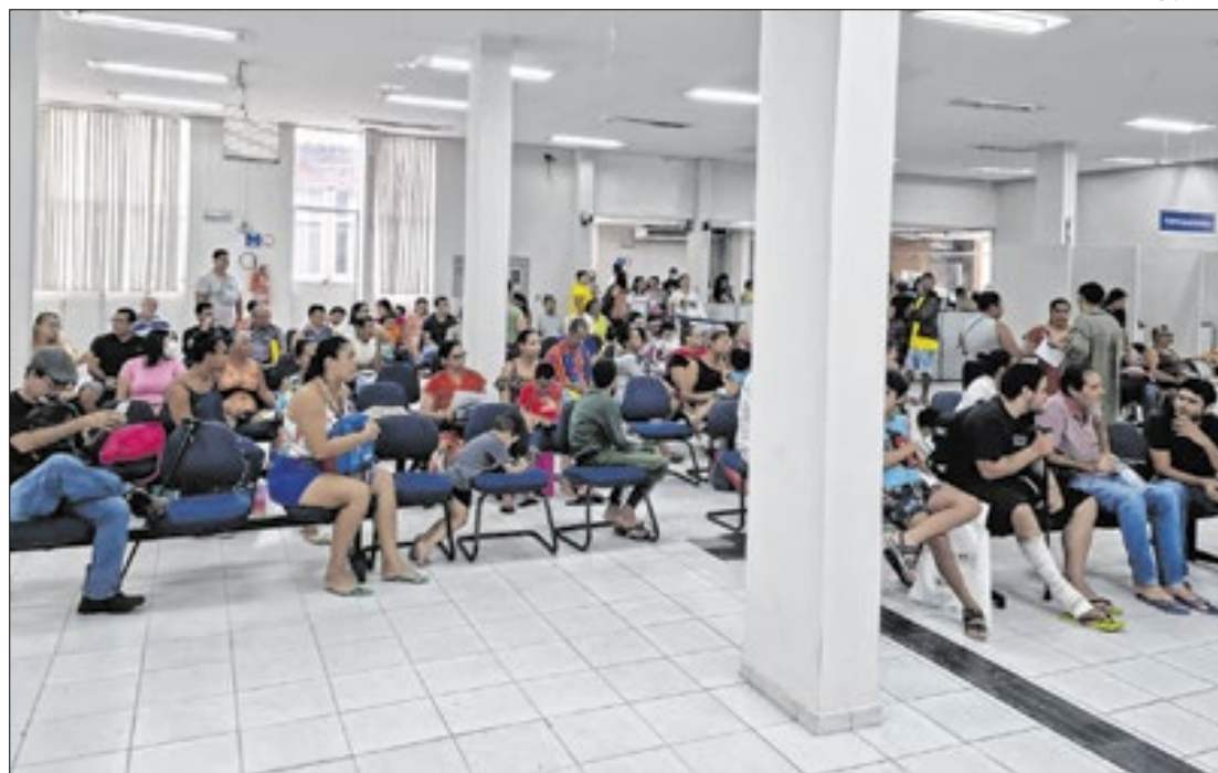
A medida institui o Programa de Gerenciamento de Benefícios

os processos que já tenham esgotado o prazo de 45 dias para análise inicial ou que tenham expirado algum outro prazo estabelecido pela justiça, bem como as avaliações sociais para a concessão do Benefício de Prestação Continuada (BPC), voltado a idosos de baixa renda e pessoas com deficiência de qualquer idade.