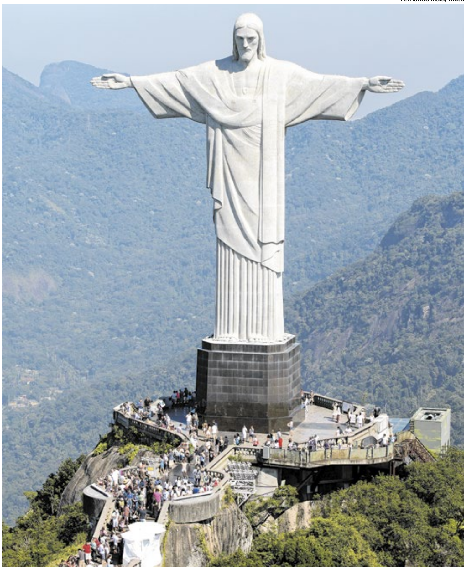
Fiscalização no Cristo teve o objetivo de verificar a proposta de reforma de acessibilidade apresentada pelo ICMBio