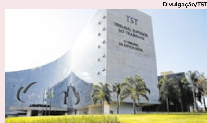
Para Anamatra, Justiça do Trabalho é que deve decidir