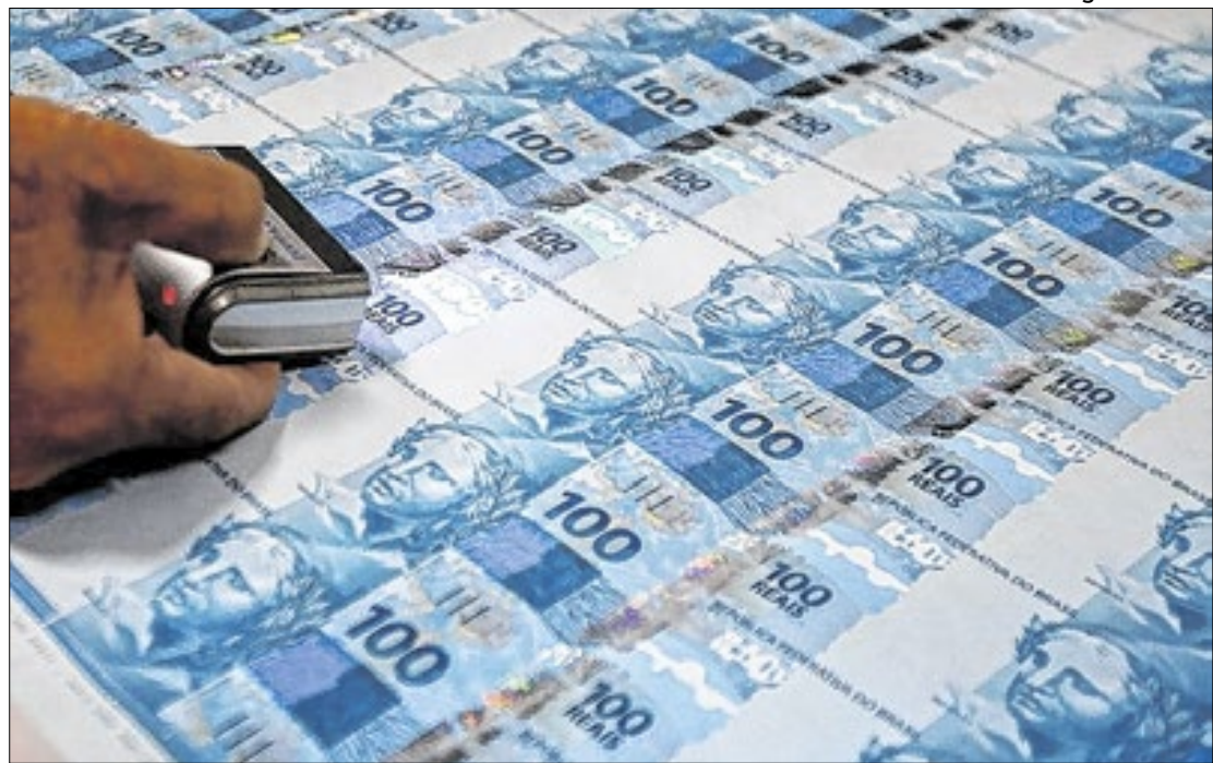
Governo teve de revisar, para cima, estimativa de 'pico' da dívida bruta do país

A 'numeralha' de estimativas está prevista na Proposta de Lei de Diretrizes Orçamentárias (PLDO) de 2026, apresentada, nessa terça-feira (15) pelo