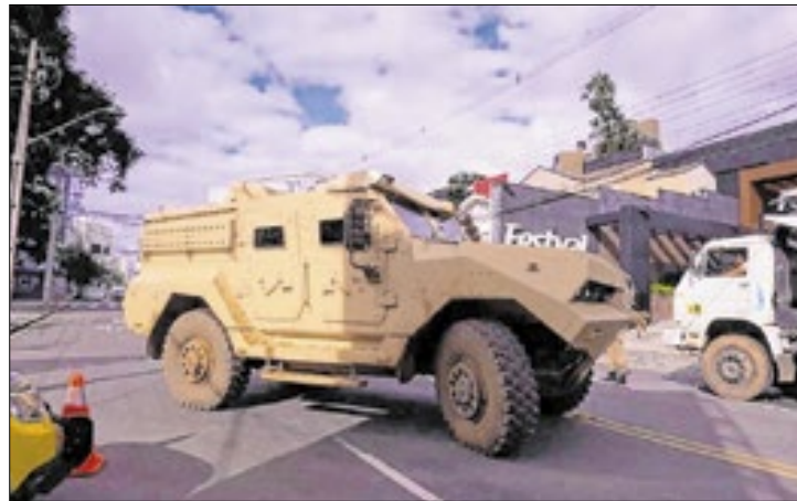
Estado faz testes para avaliar o mercado

A Secretaria de Segurança Pública do Paraná (SESP) planeja reforçar a frota das forças de segurança do Estado com 12 blindados. A estratégia é dividir a compra em duas frentes, cada uma com seis unidades. Uma delas já está em andamento, em conjunto com um procedimento licitatório aberto pela Polícia Militar do Distrito Federal (PMDF). A outra, que será com um edital próprio, ainda está em fase inicial de análise dentro do próprio Governo do Estado.