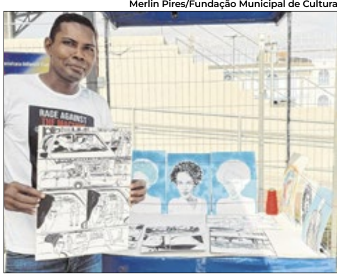
Evento gratuito no Amapá Garden Shopping