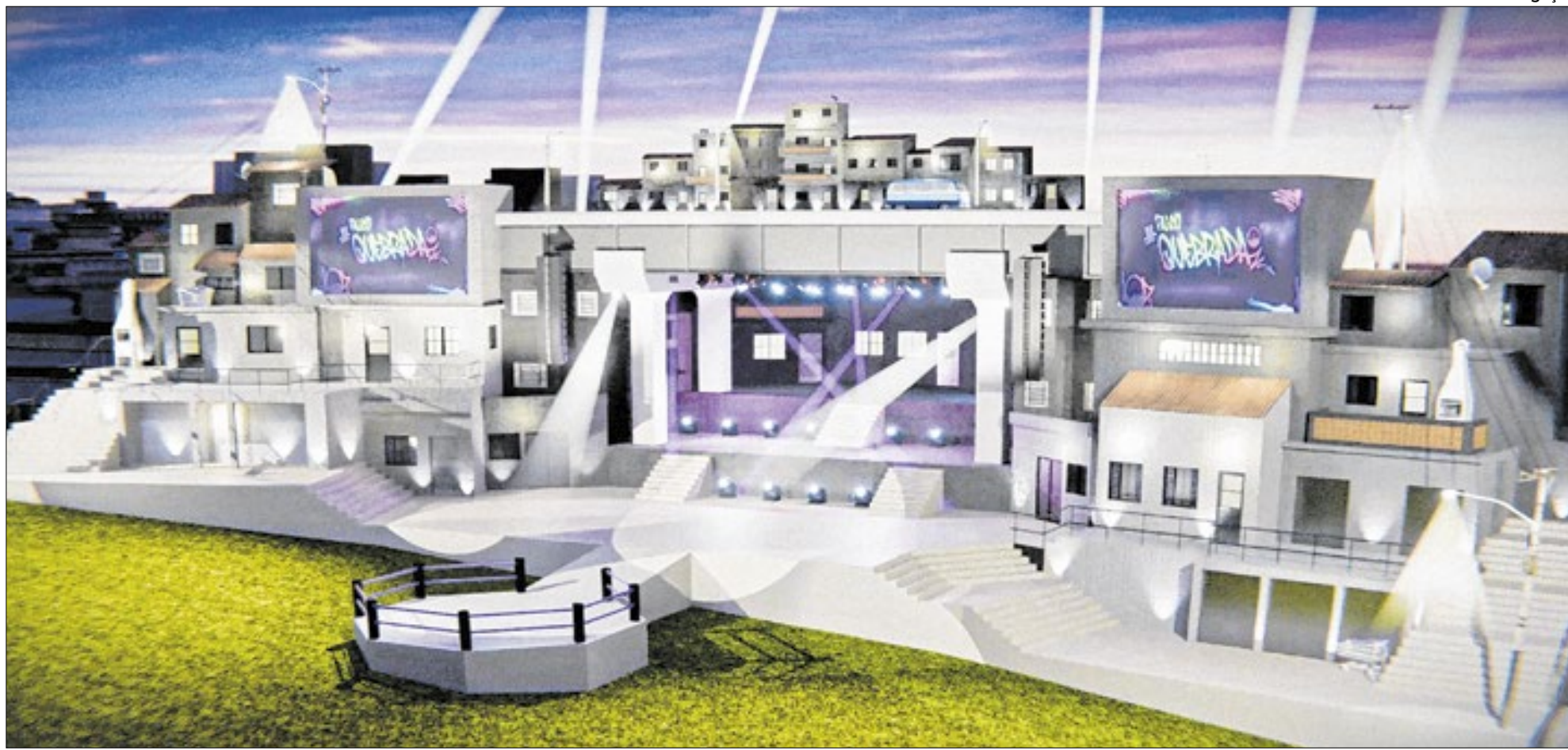
Projeção de como será o novo palco para o The Town, com atrações do rap e pagode