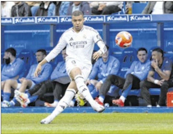
Mbappé é a grande esperança de gols do Real Madrid

O Real Madrid precisa de uma goleada para avançar direto nesta quarta (16) na Champions League. Os espanhóis foram derrotados pelo Arsenal por 3 a 0 no jogo de ida, na Inglaterra, o que significa que o time precisará vencer por quatro gols ou mais de diferença em casa para ir à semifinal. Uma vitória do Real Madrid por três gols de vantagem levará o jogo para a prorrogação. Mesmo com cenário difícil, o técnico Carlo Ancelotti não joga a toalha.