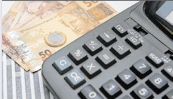
Mínimo de 2026 é bem inferior ao estimado pelo Dieese