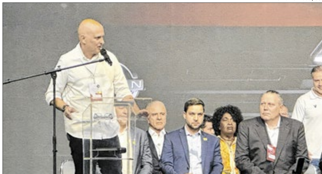
Tande Vieira, prefeito de Resende-RJ, resalta geração de 400 novas vagas na fábrica

-A gente precisa centralizar esse atendimento. Trazer esse cuidado para a cidade, é melhor que custear os tratamentos - disse o prefeito.