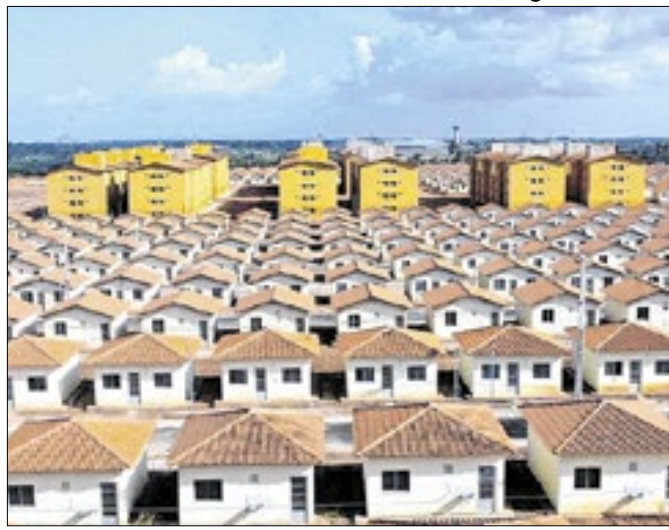
Nova faixa do MCMV terá de arcar com juros de 10%