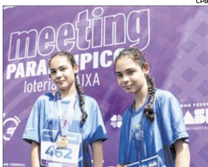
Irmãs começaram a praticar esportes há um ano