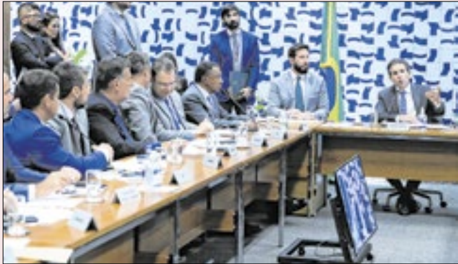
Motta não vai resolver as questões sozinho