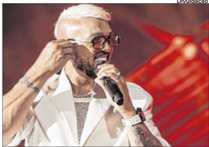
Belo vai encerrar a programação do palco, em 14 de setembro

Local terá Belo, MC Hariel, Black Pantera, Kayblack e Criolo como headliners