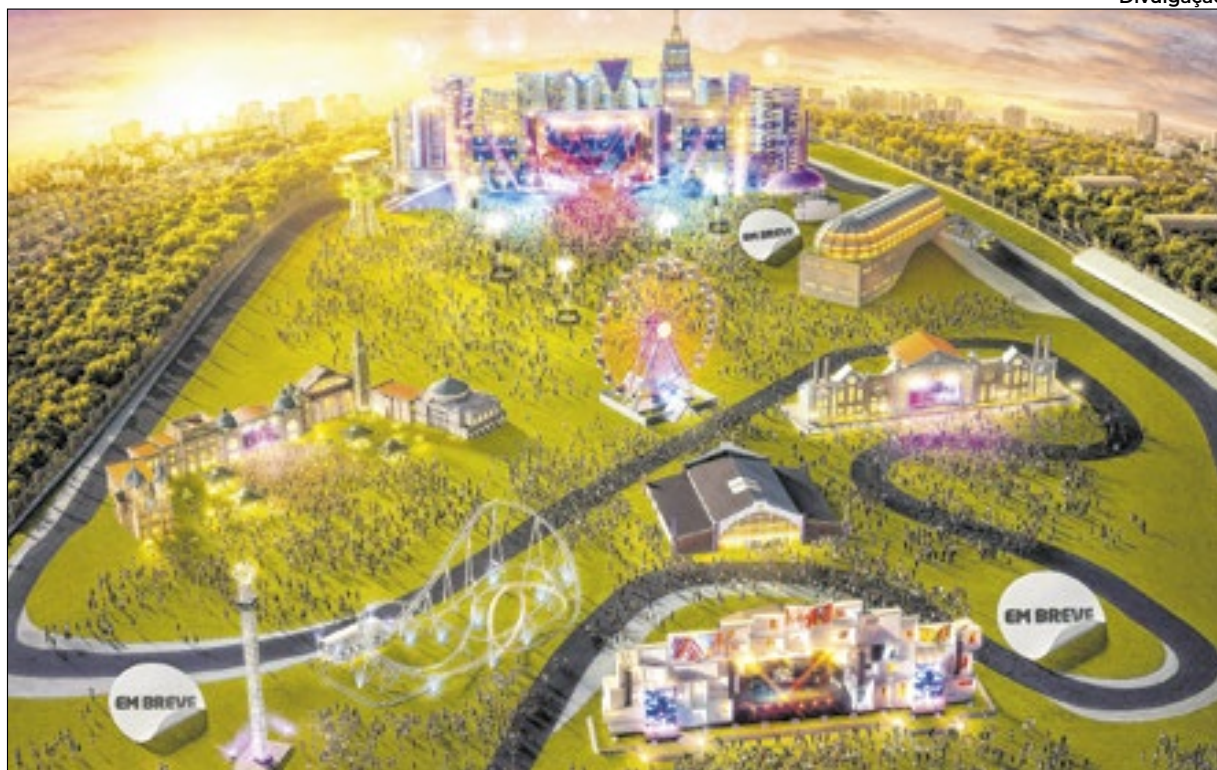
Possível projeção de como ficará o The Town no Autódromo de Interlagos, em SP