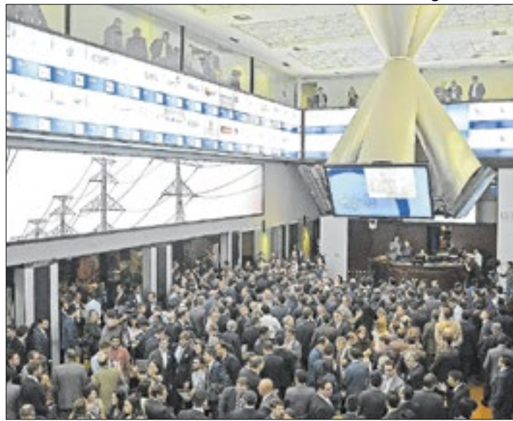
Cautela com o PLDO de 2026 e com PIB chinês selou queda

A agenda escassa durante o pregão e a falta de sinalizações mais claras sobre o andamento da guerra comercial fez o Ibovespa oscilar entre leves altas e baixas por todo o pregão desta terça-feira (15).