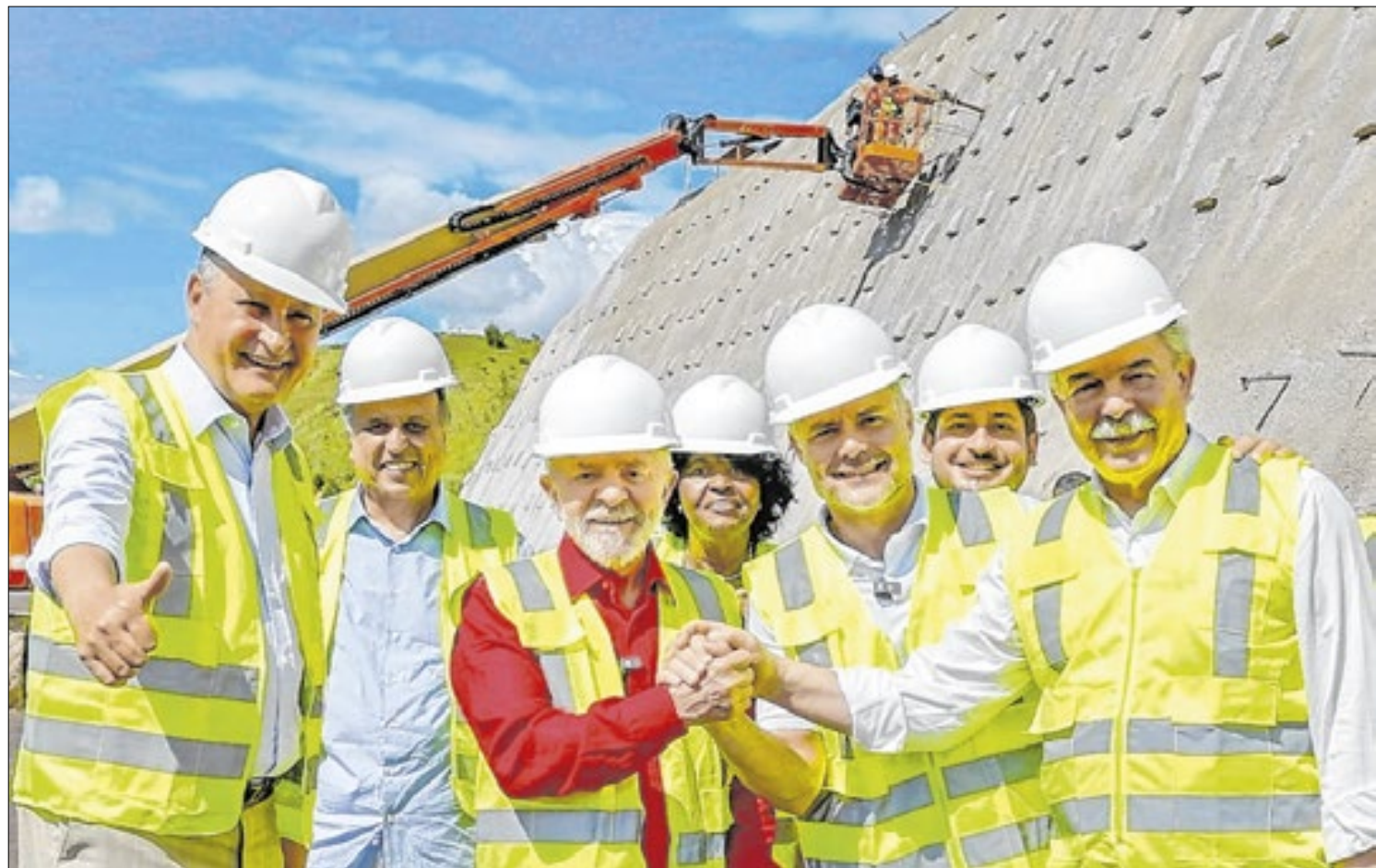
Lula, Mercadante, Pezão, e representantes da CCR, na Rodovia Presidente Dutra, na altura de Paracambi, no Estado do Rio

No encontro, em Pirai, o presidente e o prefeito conversaram sobre o programa "Minha Casa Minha Vida", solicitado por Pezão, ainda no ano passado, durante uma visita a