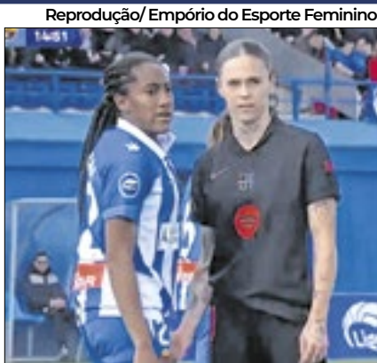
León foi condenada por assédio