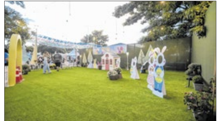
Atividades e brinquedos incluirão percepções sensoriais