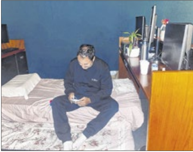
Glauber passa a receber compaixão conveniente