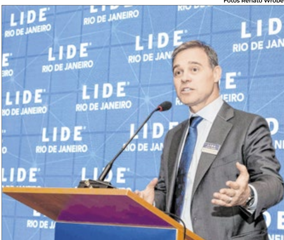
Ministro do Supremo Tribunal Federal e do Tribunal Superior Eleitoral, André Mendonça falou sobre o papel das instituições jurídicas no cenário corporativo

Segundo Andréia Repsold, “a Governança Corporativa pode ser um catalisador para uma sociedade mais justa, responsável, íntegra e ética. Neste evento, especialistas e líderes compartilharam visões e experiências sobre práticas responsáveis que podem gerar impacto positivo. As empresas tem um papel fundamental na construção de um futuro mais sustentável e devem inspirar mudanças que beneficiem a todos”.