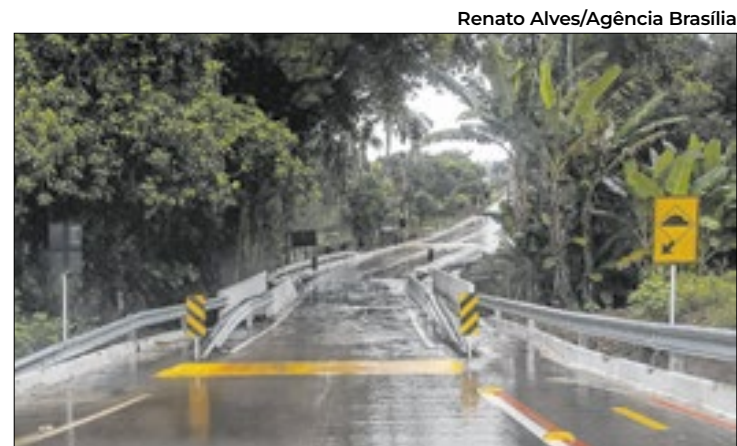
Renato Alves/Agência Brasília

A tecnologia utiliza sistemas semelhantes aos usados na internet das coisas, adaptados ao ambiente espacial.