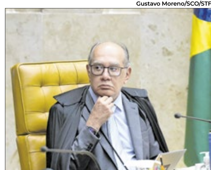
PGFN estuda os efeitos da decisão de Gilmar Mendes