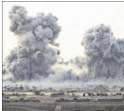
Israel fez novo ataque ao Líbano

Parte das intervenções trumpistas apontam para uma narrativa ideológica de como abordar temas como o ‘antisemitismo’. Coincidentemente ou não, alunos da relatam ver colegas tendo seus vistos de estudantes revogados.