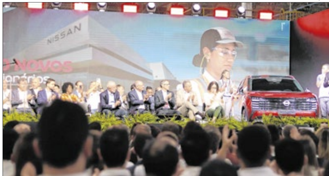
Nissan no sul do Estado do RJ anuncia investimentos com a presença de Lula

Outro assunto abordado por Tande foi com relação à votação dos vetos ao Propag (Programa de Pleno Pagamento de Dívidas dos Estados). "Tão importante aqui para o Estado do Rio e para outros estados também, mas fundamentalmente para o Estado do Rio, a gente precisa que seja aprovado