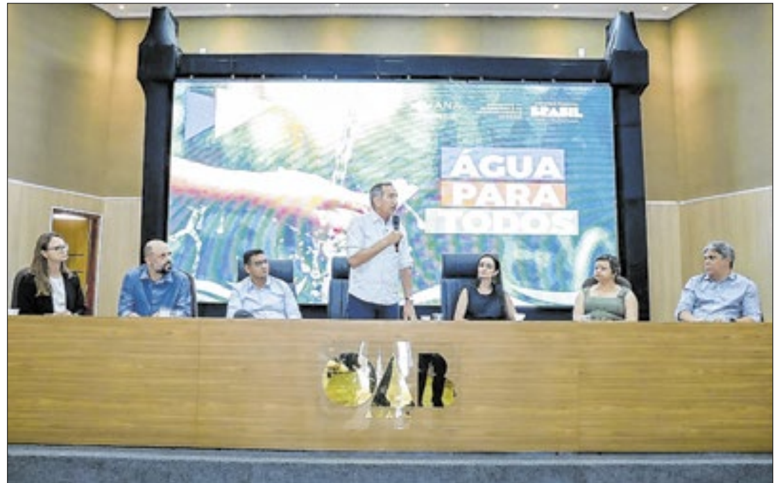
Waldez afirmou que o maior problema ambiental da Amazônia é a política sanitária

No evento, foram mostrados os resultados iniciais do