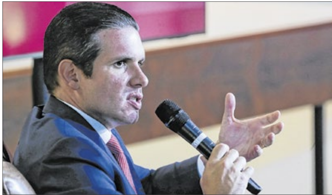
Motta não quer desgaste sobre anistia sozinho

cada do Partido Liberal na Câmara, Sóstenes Cavalcante (RJ), parabenizou a decisão de Motta. “A verdadeira democracia se faz pelo processo legislativo – e não por decisões monocráticas de um só. O presidente da Câmara tem atribuições importantes, mas as grandes decisões sempre passam pelo Colégio de Líderes ou, mais ainda, pela vontade soberana da maioria da Casa. No caso do PL da Anistia, 264 deputados respaldam a urgência”, escreveu Sóstenes em suas redes sociais.