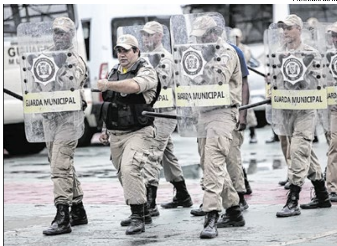
Prefeitura do Rio

Medida votada por ampla maioria dos vereadores: 43 contra 7