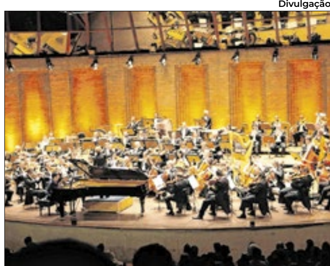
Festival de Campos do Jordão tem 55ª edição