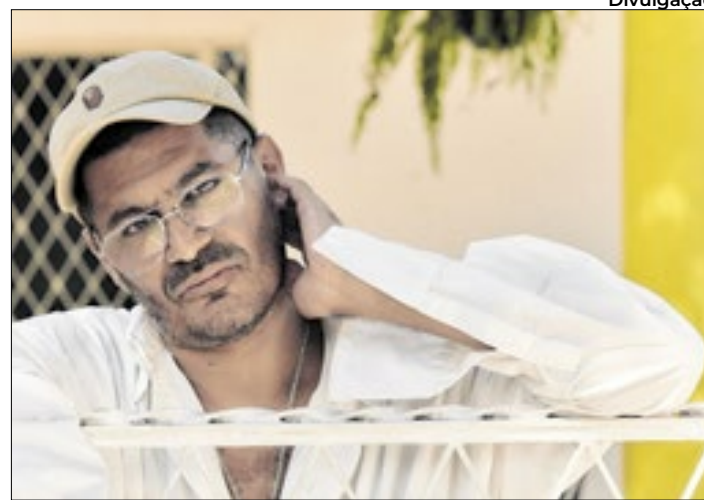
Criolo será a grande atração no dia 13 de setembro