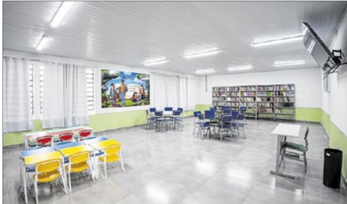
Deste valor, R$ 19,7 milhões se referem a trabalhos encerrados em 50 obras

“Desde 2024, temos um volume de investimentos e um número de obras em escolas sem precedentes nas últimas décadas. Esse cenário impressionante resulta de três fatores: a reestruturação da SOP, que otimizou processos e modernizou a gestão; a parceria com a Secretaria da Educação; e a recuperação financeira do Estado em andamento desde a primeira gestão do governador Eduardo Leite”, afirma a secretária Izabel Matte.