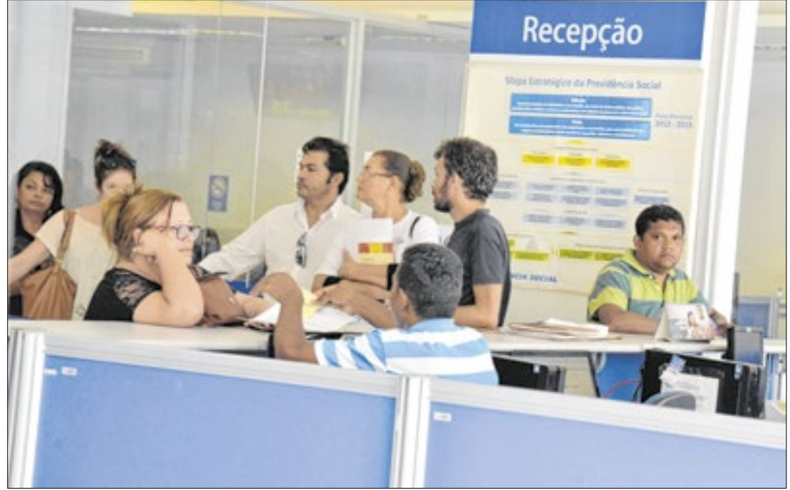
Médicos peritos ao retornarem ao trabalho após 235 dias de paralisação

definido após assinatura de acordo com o Ministério da Previdência Social a entidade que representa os médicos peritos. Pelo acordo, a pasta vai restituir o salário descontado desde janeiro.