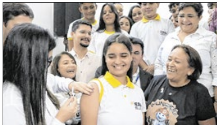
Vacinação nas escolas é símbolo da campanha