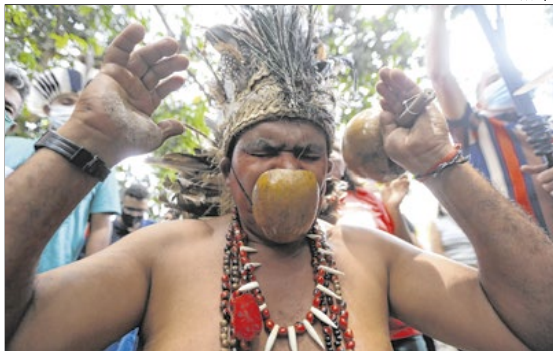
Outro exemplo de inclusão é o projeto “EJA Warao”, voltado à alfabetização

O estado do Piauí abriga 7.378 indígenas pertencentes a cinco etnias, distribuídas em sete municípios — com destaque para Piripiri e Lagoa de São Francisco, segundo dados do Instituto Brasileiro de Geografia e Estatística (IBGE).