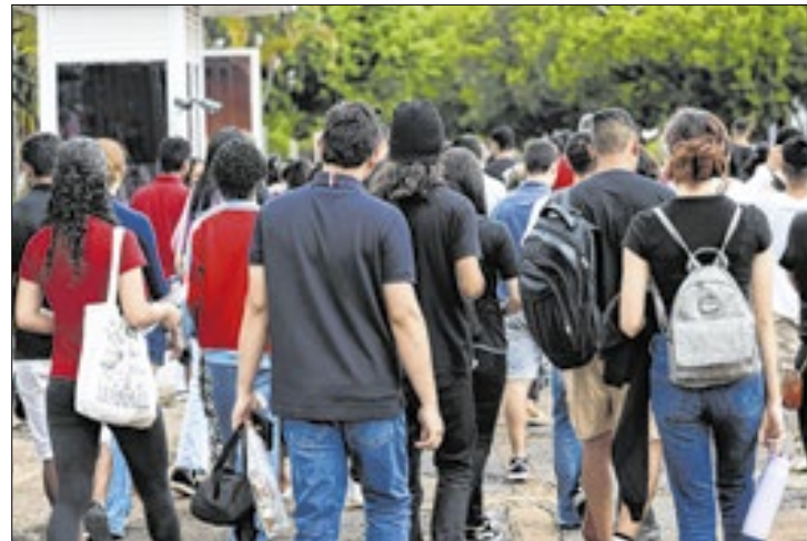
Interessados têm até 25 de abril para fazer a solicitação

O período para solicitar a isenção da taxa de inscrição no Exame Nacional do Ensino Médio (Enem) de 2025 será entre 14 e 25 de abril.