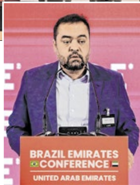
Durante discurso no Brazil Emirates Conference, em Dubai, o governador Cláudio Castro falou sobre o turismo fluminense, recordes e conquistas do setor

“Em 2024, o RIOgalão recebeu mais de 1,4 milhão turistas internacionais, estabelecendo um novo recorde desde 2014, ano da Copa do Mundo no Brasil. Resultado de negociações feitas também pelo Governo do Estado, que apresentou as restrições ao modelo elaborado, que desconsiderava o Sistema Multierportos e que poderia levar a uma concorrência desleal com o Santos Dumont”, explicou o governador.