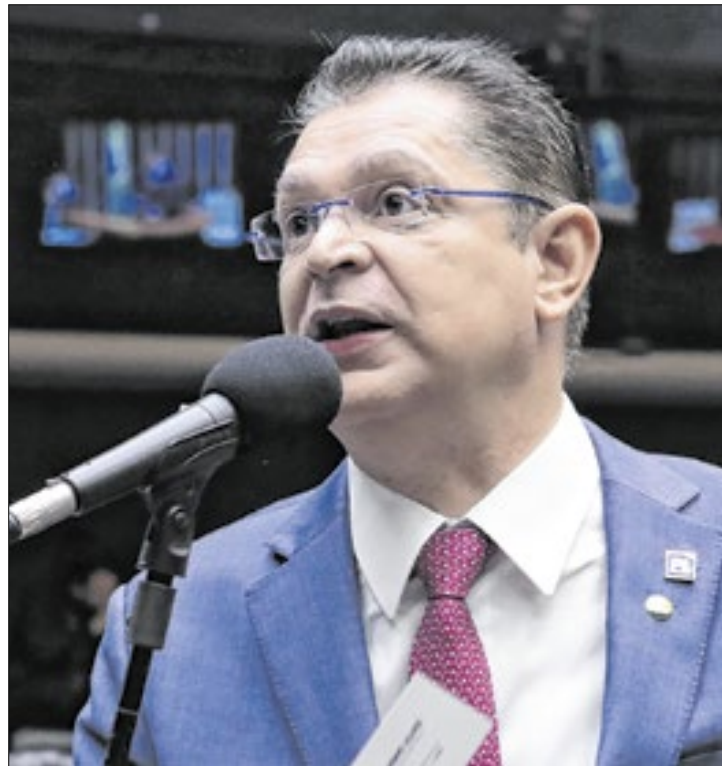
Sóstenes obteve cinco assinaturas a mais que o mínimo

A proposta do requerimento é acelerar a tramitação do PL da Anistia. Quando é aprovado um requerimento de urgência, o texto segue diretamente para votação no plenário da Casa, sem precisar passar por análises nas comissões. O documento divulgado nesta segunda apresenta o nome de 264 parlamentares. Porém, em nota para a imprensa, Sóstenes esclareceu que duas assinaturas “foram invalidadas por se tratarem de assinaturas de líderes partidários”, que são as do próprio Sóstenes e do líder da oposição, Luciano Zucco (RS). “Inicialmente, a orientação era para a coleta de assinaturas por meio dos líderes, mas, posteriormente, houve uma mudança de procedimento, passando-se a exigir assinaturas individuais dos parlamen-