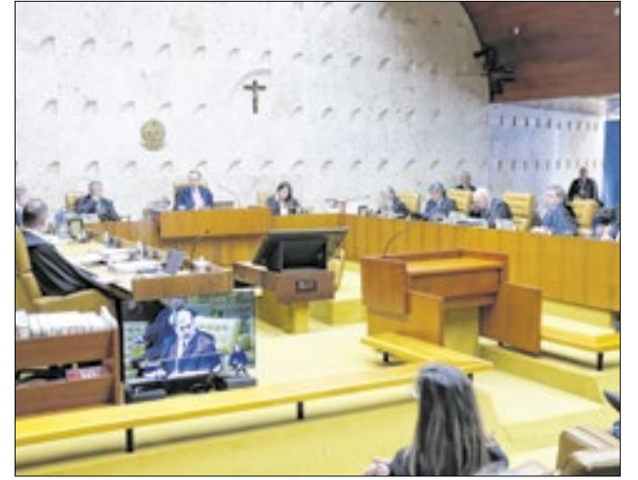
Plenário do STF terá que decidir sobre pejotização