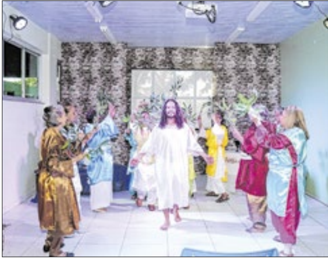
Grupo apresenta peça da Paixão de Cristo amanhã (16)