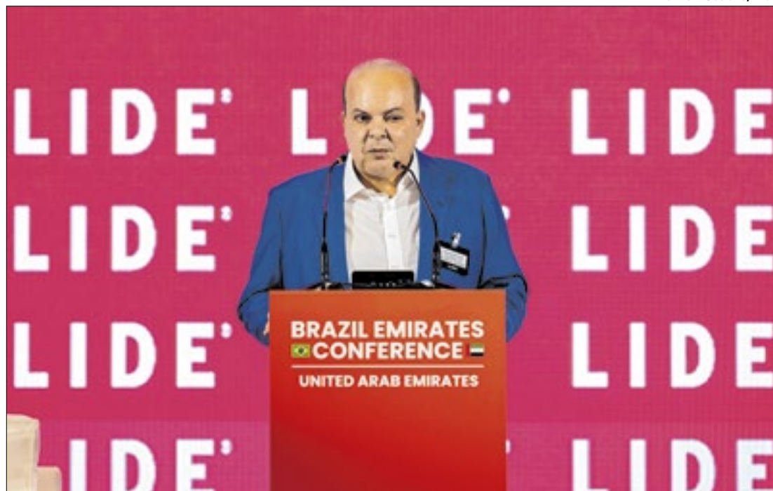
Ibaneis afirmou compromisso em tornar Brasília "cidade verde"