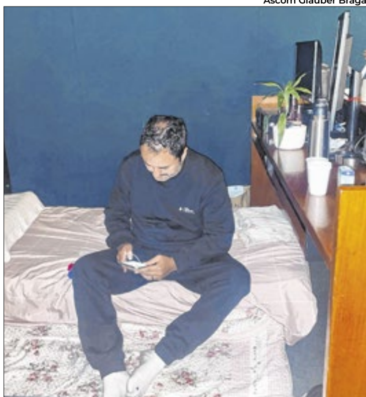
Ascom Glauber Braga

No ano seguinte, foi uma das fundadoras do Partido Socialismo e Liberdade (Psol), tendo sido a primeira presidente da legenda. Mais tarde, acabou se desentendendo no próprio Psol e passou a integrar a Rede, partido pelo qual disputou um cargo de deputada pelo Rio de Janeiro.