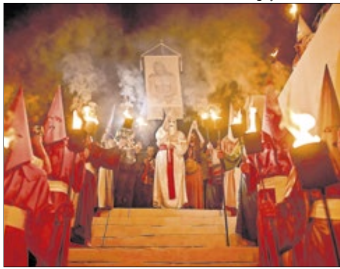
Tradicional celebração cristã é realizada desde 1747