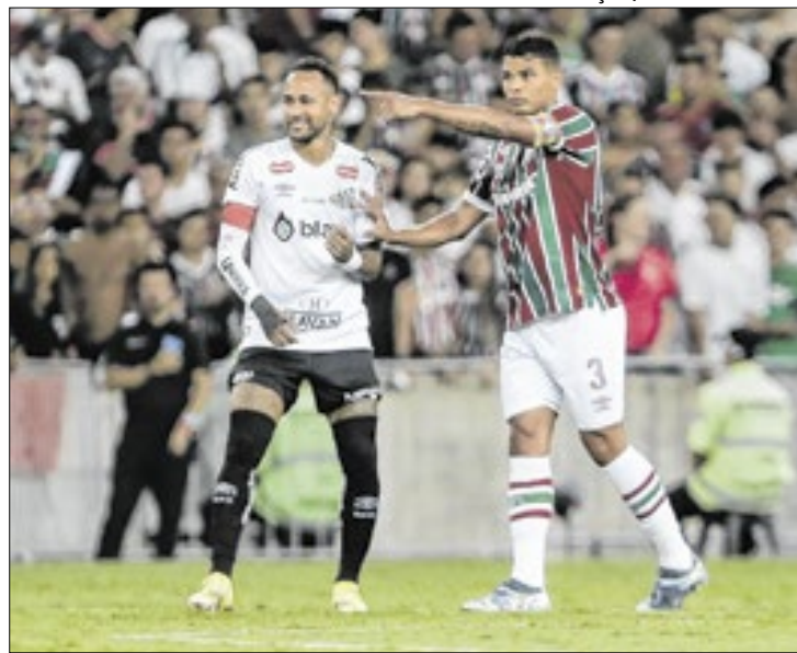
Lucas Merçon/ Fluminense FC