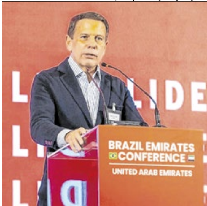
Ex-governador de São Paulo, João Dória foi o fundador do LIDE e atualmente é o copresidente do Conselho do grupo de líderes empresariais