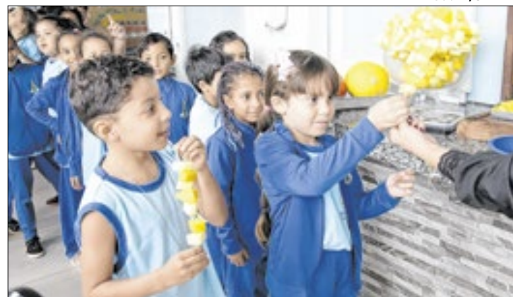
A manga foi adotada por ser próxima da realidade do DF