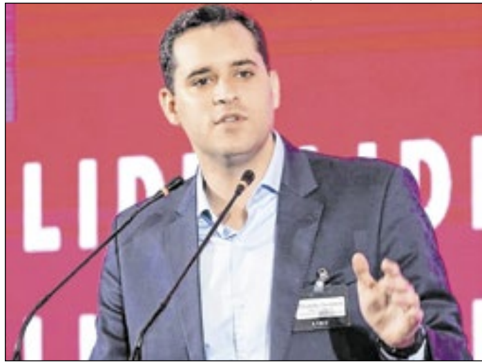
Eduardo Cavaliere, vice-prefeito da cidade do Rio, também esteve presente no evento nesta segunda