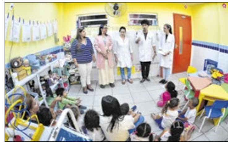
Imunização visa ampliar e atualizar a cobertura vacinal