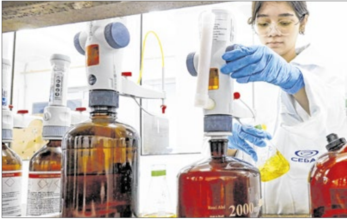
O programa conta com 272 pontos de monitoramento de qualidade da água