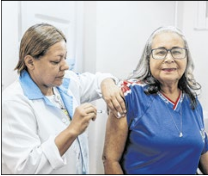
Campanha segue vacinando grupos mais vulneráveis