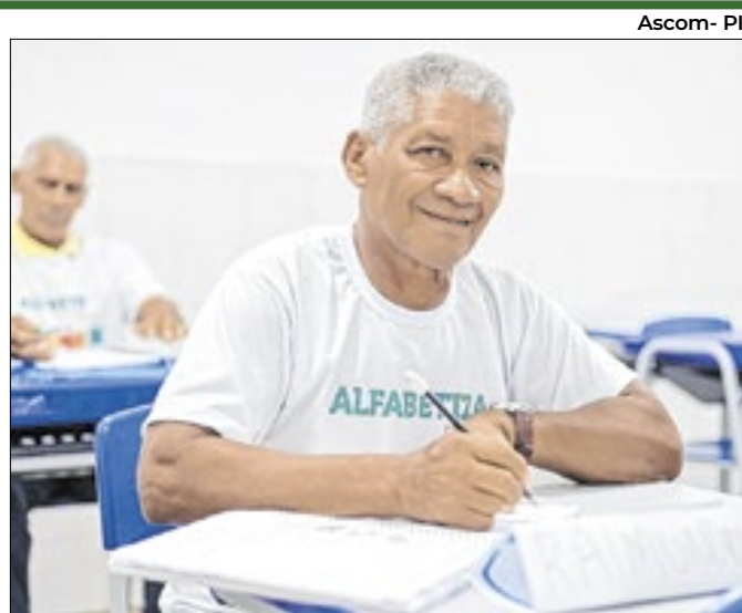
Foram investidos R$ 940 mil, referentes aos repasses