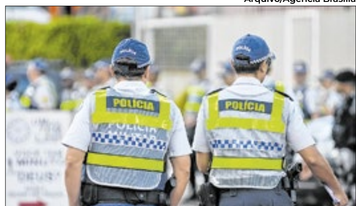
Plataforma agiliza denúncias e ajuda no planejamento