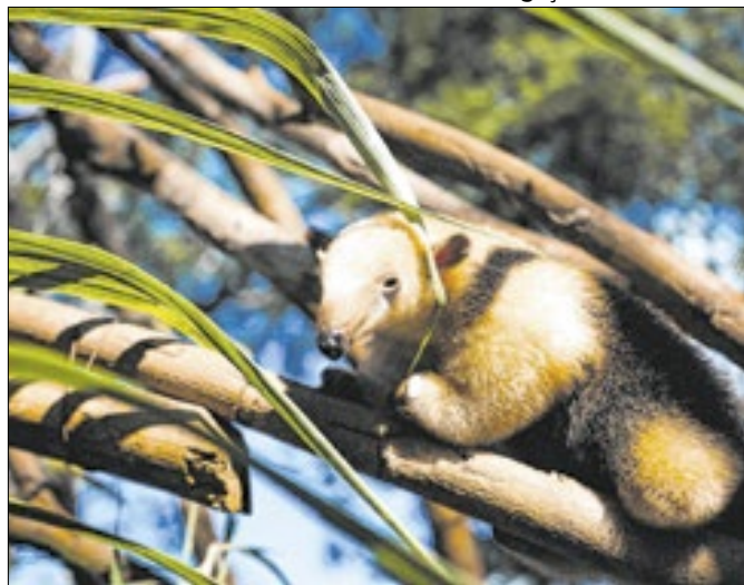
As outras opções eram: Castanha, Formiga e Pipoca